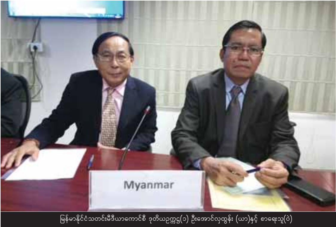
မြန်မာနိုင်ငံသတင်းမီဒီယာကောင်စီ ဒုတိယဥက္ကဋ္ဌ(၁) ဦးအောင်လှထွန်း (ယာ)နှင့် စာရေးသူ(ဝဲ)

မြန်မာနိုင်ငံ သတင်းမီဒီယာကောင်စီ အား ကမ္ဘာ့သတင်းမီဒီယာကောင်စီ(အဖွဲ့ဝင်) အဖြစ် လက်ခံရန် သင့်၊ မသင့် ဆွေးနွေးသည့် အစီအစဉ်ပါသည်။ မြန်မာအဖွဲ့ခေါင်းဆောင် ဦးအောင်လှထွန်းက မြန်မာ့သတင်းမီဒီယာ ကောင်စီအား ကမ္ဘာ့အဖွဲ့ဝင်ဖြစ်ဖို့ ကျိုးကြောင်း ခိုင်မာစွာ လျှောက်လဲတင်ပြ ဆွေးနွေးသည်။