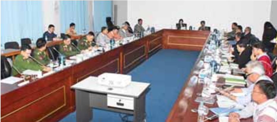
NCA အကောင်အထည်ဖော်မှု ပြန်လည်သုံးသပ်ခြင်းဆိုင်ရာ ပူးတွဲအစည်းအဝေး ကျင်းပစဉ်။