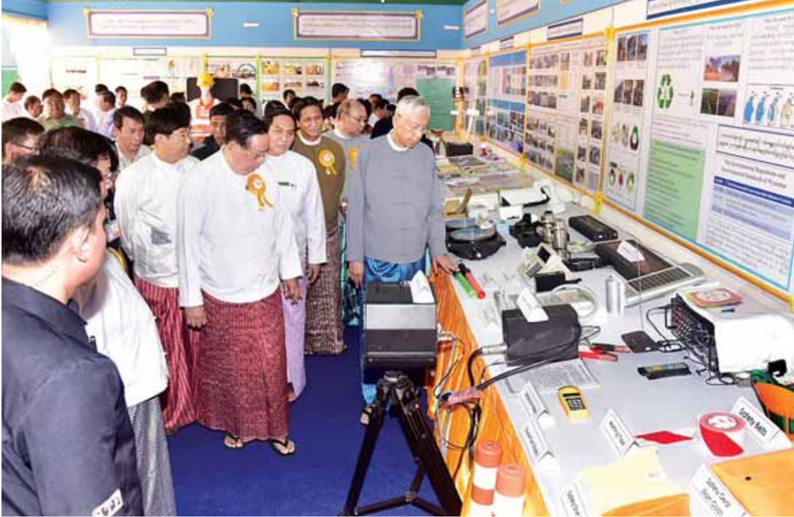
နိုင်ငံတော်သမ္မတ ဦးထင်ကျော်နှင့် ဇနီးနှင့် အဖွဲ့ဝင်များ Public Works Department ၏ (၁၃၁)နှစ်မြောက် အထိမ်းအမှတ်ပြခန်းများကို လှည့်လည်ကြည့်ရှုကြစဉ်။

နေပြည်တော် နိုဝင်ဘာ ၂၅ ပြည်ထောင်စုသမ္မတမြန်မာနိုင်ငံတော် နိုင်ငံတော်သမ္မတ ဦးထင်ကျော်နှင့် ဇနီး ဒေါ်စုစုလွင်တို့သည် ယနေ့နံနက် ၉ နာရီတွင် ဆောက်လုပ်ရေးဝန်ကြီးဌာန၌ ကျင်းပသည့် ဆောက်လုပ်ရေးဝန်ကြီးဌာန Public Works Department ၏ (၁၃၁)နှစ်မြောက် နှစ်ပတ်လည်အခမ်းအနားသို့ တက်ရောက်ချီးမြှင့်သည်။