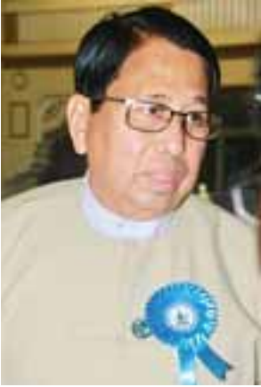
ပြည်ထောင်စုဝန်ကြီး ခေါက်တာဖေမြင့်

သတင်းစာဆရာကြီး၊ ဆရာမကြီး တွေဟာ သတင်းစာဆရာဘဝမှာ အတွေ့အကြုံမျိုးစုံကို ဖြတ်သန်းခဲ့ရ တယ်။ သူတို့ကိုယ်တိုင် သူတို့ရဲ့ ရွှေက ရှိခဲ့တဲ့ ဆရာကြီး ဆရာမကြီးတွေဆီ ကနေ သင်ကြားလေ့လာဆည်းပူးပြီး တော့ ကိုယ်တိုင် လက်တွေ့လုပ်ဆောင် ပြီး သတင်းစာပညာ ပြည့်ဝလာတဲ့ သူတွေဖြစ်ပါတယ်။ အတွေ့အကြုံတွေ