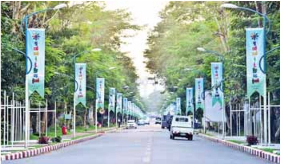
ရန်ကုန်တက္ကသိုလ်အတွင်း လူငယ်ဘက်စုံဖွံ့ဖြိုးရေးပွဲတော် ကျင်းပရေး ကြိုတင်ပြင်ဆင်ထားမှုများကို တွေ့ရစဉ်။