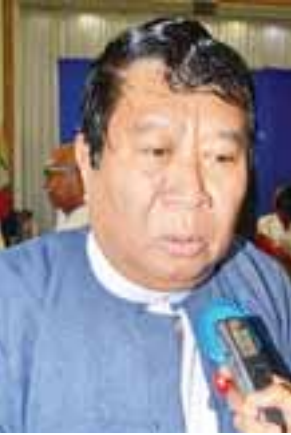
ရန်ကုန်မြို့တော်ဝန် ဦးမောင်မောင်စိုး

တန်ဖိုးကလည်း မြင့်မား၊ သတင်းထောက်လည်း စာရေးတာပဲ၊ စာရေးဆရာလည်း စာရေးတာပဲ နှစ်ဦး စလုံးက လူတွေကောင်းဖို့အတွက် ထိန်းကျောင်းတည်မတ်ပေးတဲ့ စာတွေ ကို မျှဝေပေးတဲ့သူတွေ ဖြစ်ပါတယ်။ ကျွန်တော်တို့ နိုင်ငံအတွက် သတင်း စာ ဆရာရော စာပေပညာရှင်တွေရော အများကြီးကို လိုအပ်တယ်။ သူတို့ရဲ့ ဝေဖန်သုံးသပ်မှုကို အသုံးပြုနိုင်ရင်