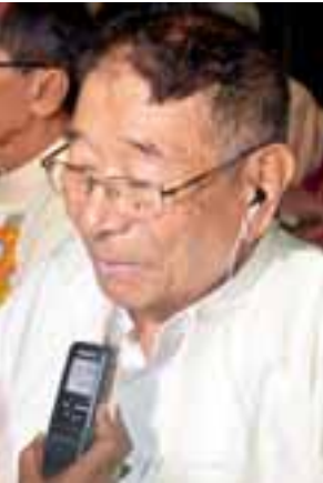
ဦးတိုး(တက္ကသိုလ်)

ဒီနေ့ကျင်းပတဲ့ သတင်းစာဆရာ သက်ကြီးပူဇော်ပွဲဟာ အင်မတန် ထူးခြားတယ်။ ဘာဘာတို့လို သတင်းစာ ဆရာ သက်ကြီးပူဇော်ပွဲမှာ နိုင်ငံတော် သမ္မတကြီးဖြစ်တဲ့ ဦးထင်ကျော်က လည်း သတင်းစာဆရာတွေအတွက် စာရင်းတင်ပါဆိုပြီး အဲဒီစာရင်းတွေနဲ့ ဆရာကြီးတွေကို ကန်တော့တယ်။ ဒီနှစ်လည်း ဆရာကြီး ၁၃၀ ကျော်မယ် ထင်တယ်။ ငွေသားရော ပစ္စည်းတွေ ရောစုံမှာပါ။ ဒီနှစ်က အောက်တိုဘာ ၃၀ ရက်မှာ ၇၅ နှစ်ပြည့်ပြီးသား ဆရာ ကြီးတွေကို ကန်တော့ဖို့ ရွေးခဲ့တာပါ။ တကယ်တမ်းပြောရရင် သတင်းစာ သမားတွေဆိုတာက အခုမှပဲ သတင်းစာဆရာ ဖြစ်ချင်ကြတယ်။ အရင်က ဆရာကြီးတွေဆို ချုပ်ချယ်မှု တွေ၊ နှိပ်ကွပ်မှုတွေ အများကြီးကို