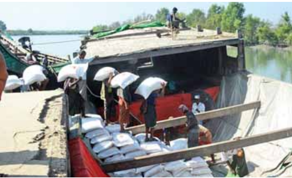
မောင်တောနယ်စပ်မှ ဘင်္ဂလားဒေ့ရှ်နိုင်ငံသို့ ဆန်များတင်ပို့ရန် စက်လှေကြီးများပေါ်သို့ တင်ဆောင်နေစဉ်။