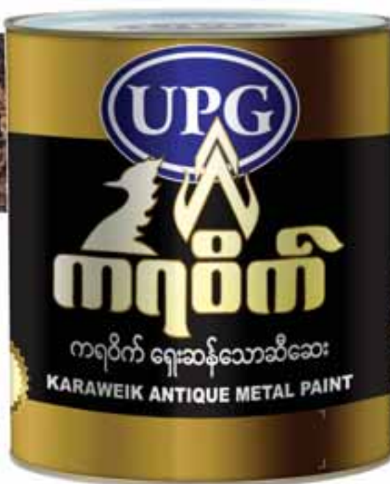
Karaweik Acrylic Antique Metal Paint Pale Gold (KG-AA44)