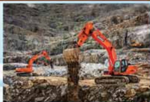
2 nd Prize - Pyi Htut Khaung