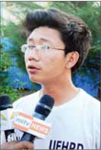
ကိုစိုင်းသူ