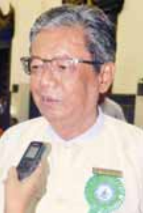
မြန်မာနိုင်ငံသတင်းစာဆရာအသင်း ဥက္ကဋ္ဌ ဦးသီဟစော

ရင်ဆိုင်ကျော်လွှားခဲ့ကြတယ်။ သူတို့ရဲ့ ရင်ဆိုင် ဖြတ်သန်းလာရတာတွေကို အသိအမှတ်ပြုချင်တယ်။ သူတို့ကို လည်း အထောက်အပံ့တစ်ခုလိုမျိုး ရစေချင်ပါတယ်။ နှစ်စဉ် ငွေသားက တော့ အလျှင်လိုရတဲ့အပေါ်မှာ မူတည်တယ်။ ပစ္စည်းပစ္စယတွေပါ တယ်။ ဒီနှစ် နိုင်ငံတော်သမ္မတကြီးက ရော၊ တပ်မတော်ကာကွယ်ရေးဦးစီး ချုပ် ဗိုလ်ချုပ်မှူးကြီး မင်းအောင်လှိုင်