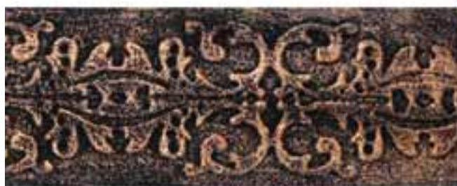
Karaweik Acrylic Antique Metal Paint Copper Gold (KG-AA22)