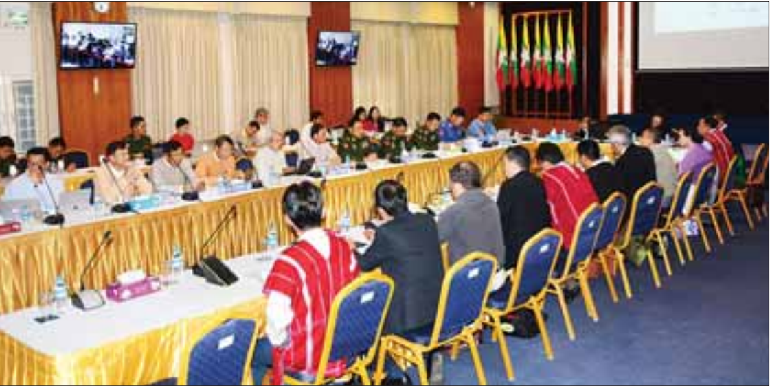
NCA အကောင်အထည်ဖော်မှုဆိုင်ရာ ပြန်လည်သုံးသပ်ခြင်းအစည်းအဝေး ကျင်းပစဉ်။

ပြည်ထောင်စုရှေ့နေချုပ် ဦးထွန်းထွန်းဦးက “NCA အကောင်အထည်ဖော်မှု ပြန်လည်သုံးသပ်ရေးအစည်းအဝေးဟာ လိုလိုလားလားနဲ့ ဆောင်ရွက်တဲ့ အစည်းအဝေးဖြစ်ပါတယ်။ NCA နဲ့ ပတ်သက်တဲ့ လုပ်ငန်းတွေ ဘယ်လောက်ပြီးစီးသလဲ၊ ဘယ်လောက်ဆောင်ရွက်နိုင်ခဲ့သလဲ၊ ဘာတွေရှေ့ဆက်ဖို့ လိုသလဲဆိုတာ ကျွန်တော်တို့ပြန်လည်သုံးသပ်ဖို့လိုပါတယ်။ NCA မှာ ဆောင်ရွက်ရမယ့် လုပ်ငန်း တော်တော်များများကိုလည်း ကျွန်တော်တို့ ဆောင်ရွက်နိုင်ခဲ့တယ်လို့ ယုံကြည်ပါတယ်။ ပြန်လည်ပြီးတော့ ဆောင်ရွက်နိုင်တဲ့ လုပ်ငန်းတွေအပေါ်မှာ အားသာချက်တွေ၊ အားနည်းချက်တွေ၊ NCA မှာ ပါဝင်တဲ့ အခန်းအလိုက် ခေါင်းစဉ်တွေမှာ လိုအပ်နေတာတွေ၊ ဖြည့်တင်းစရာရှိတာတွေ၊ ဆက်လက်ဆောင်ရွက်စရာရှိတာတွေကို ဒီကနေ ဆွေးနွေးညှိနှိုင်းကြဖို့ပဲဖြစ်ပါတယ်။