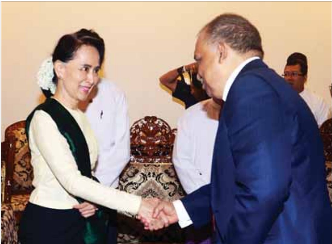
နိုင်ငံတော်၏အတိုင်ပင်ခံပုဂ္ဂိုလ်နှင့် ဘင်္ဂလားဒေ့ရှ် ပြည်ထောင်စုဝန်ကြီးတို့ ရင်းရင်းနှီးနှီးနှုတ်ဆက်စဉ်။

နေပြည်တော် အောက်တိုဘာ ၂၅ နိုင်ငံတော်၏ အတိုင်ပင်ခံပုဂ္ဂိုလ် နိုင်ငံခြားရေးဝန်ကြီးဌာန ပြည်ထောင်စုဝန်ကြီး ဒေါ်အောင်ဆန်းစုကြည်သည် ဘင်္ဂလားဒေ့ရှ် ပြည်သူ့သမ္မတနိုင်ငံ ပြည်ထောင်စုဝန်ကြီး H.E. Mr. Asaduzzaman နှင့် အဖွဲ့အား ယနေ့ နံနက် ၁၀ နာရီတွင် နေပြည်တော်ရှိ နိုင်ငံခြားရေးဝန်ကြီးဌာန ပြည်ထောင်စုဝန်ကြီး ဧည့်ခန်းမ၌ လက်ခံတွေ့ဆုံသည်။ တွေ့ဆုံစဉ် အိမ်နီးချင်း နှစ်နိုင်ငံ အကြား ဖြစ်ပေါ်လျက်ရှိသည့် နယ်စပ်ဒေသလုံခြုံရေးနှင့် တရားဥပဒေစိုးမိုးရေးဆိုင်ရာ ကိစ္စရပ်များအပေါ် ချစ်ကြည်ရင်းနှီးစွာနှင့် အတူတကွ ဖြေရှင်းသွားနိုင်မည်ဟု ခိုင်မာစွာ ယုံကြည်ကြောင်းနှင့် ဘင်္ဂလားဒေ့ရှ်ဘက်သို့ မြန်မာဘက်မှ ရောက်ရှိနေသူများအား ပြန်လည်စိစစ်လက်ခံရေးနှင့် ပတ်သက်၍ နှစ်ဖက် ဆက်လက် ပူးပေါင်းဆောင်ရွက်သွားမည့် ကိစ္စရပ်များကို ဆွေးနွေးခဲ့ကြသည်။ (သတင်းစဉ်)