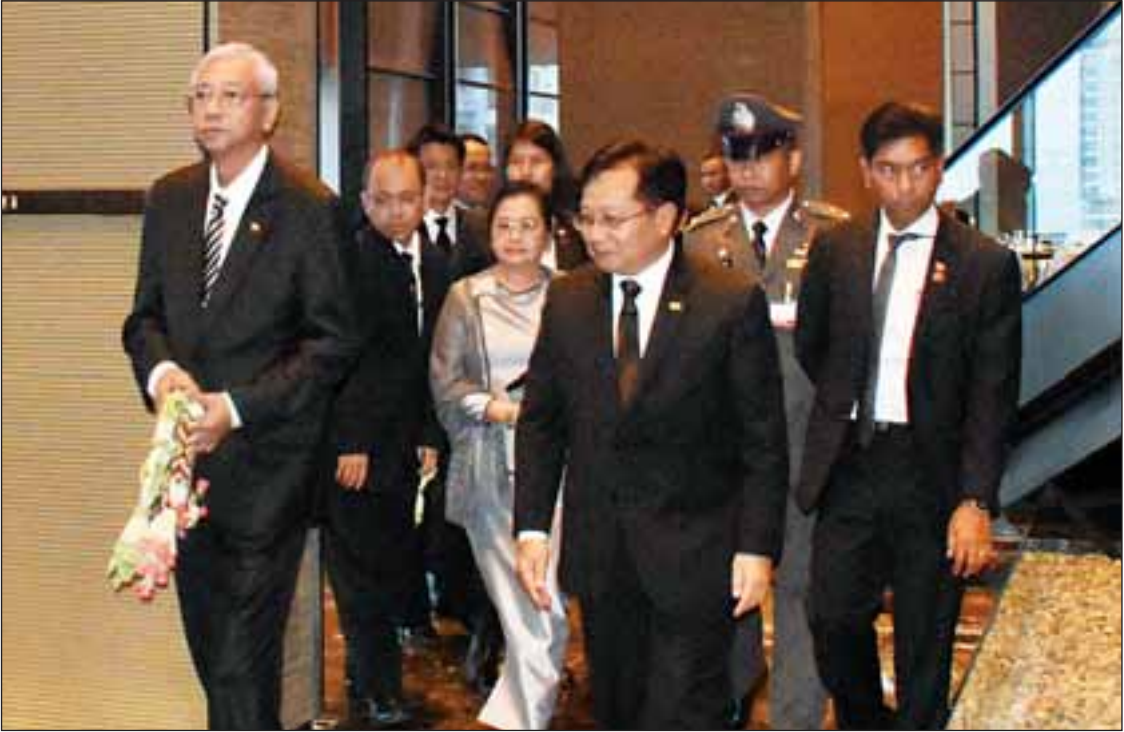
နိုင်ငံတော်သမ္မတ ဦးထင်ကျော်နှင့် ဇနီး ဒေါ်စုစုလွင် ထိုင်းနိုင်ငံ ဗန်ကောက်မြို့ ခွန်မောင်းအပြည်ပြည်ဆိုင်ရာလေဆိပ်သို့ ရောက်ရှိစဉ်။

ဗန်ကောက် အောက်တိုဘာ ၂၅ ပြည်ထောင်စုသမ္မတမြန်မာနိုင်ငံတော် နိုင်ငံတော်သမ္မတ ဦးထင်ကျော်နှင့် ဇနီး ဒေါ်စုစုလွင် တို့သည် နိုင်ငံခြားရေးဝန်ကြီးဌာန ဒုတိယဝန်ကြီး ဦးကျော်တင်၊ တာဝန်ရှိသူများနှင့်အတူ နတ်ရွာစံထိုင်းနိုင်ငံဘုရင် ဘူမိဘောအဒူလျာဒက်ရဲ့၏ တော်ဝင်ဈာပနအခမ်းအနားသို့ တက်ရောက်ရန် ယနေ့မုန်းလွဲ ၂ နာရီခွဲတွင် နေပြည်တော်မှ အထူးလေယာဉ်ဖြင့် ထွက်ခွာကြသည်။ နိုင်ငံတော်သမ္မတနှင့် ဇနီး ဦးဆောင်သောကိုယ်စားလှယ်အဖွဲ့အား ဒုတိယသမ္မတ ဦးမြင့်ဆွေနှင့် ဦးဟင်နရီဗန်ထီးယူ၊ တပ်မတော်ကာကွယ်ရေးဦးစီးချုပ် ဗိုလ်ချုပ်မှူးကြီး မင်းအောင်လှိုင်၊ နေပြည်တော်ကောင်စီဥက္ကဋ္ဌ ဒေါက်တာမျိုးအောင်နှင့်ဇနီး၊ နေပြည်တော်တိုင်းစစ်ဌာနချုပ်တိုင်းမှူး ဗိုလ်ချုပ်မြင့်မော်၊ မြန်မာနိုင်ငံဆိုင်ရာ ထိုင်းနိုင်ငံသံအမတ်ကြီး H.E. Mr. Jukr Boon-Long နှင့် ဇနီးနှင့် တာဝန်ရှိသူများက နေပြည်တော်အပြည်ပြည်ဆိုင်ရာ လေဆိပ်၌ ပို့ဆောင်နှုတ်ဆက်ကြသည်။ နိုင်ငံတော်သမ္မတ ဦးထင်ကျော်နှင့် ဇနီးနှင့်အဖွဲ့ဝင်များသည် ဒေသစံတော်ချိန် ညနေ ၄ နာရီ ၅ မိနစ်တွင် ထိုင်းနိုင်ငံ ဗန်ကောက်မြို့ စာမျက်နှာ ၃ ကော်လံ ၁ သို့ ☆