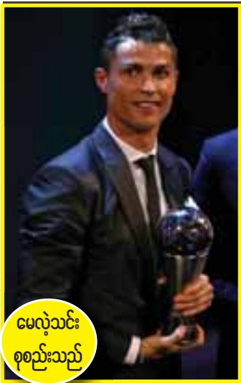
မေလဲ့သင်း စုစည်းသည်

သို့သော် မန်ယူဂိုးသမားဟောင်း ဝီတာရှုမိုက်ကယ်က ကစားသမားတစ်ဦးတည်းကို အမည်တပ်၍ ဝေဖန်ခဲ့သည့် ဂျာဂန်ကလော့ပ်၏ ပြောစကားအပေါ် ဘဝင်မကျကြောင်းဆိုခဲ့ပြီး လော့ပ်ရန်ကို ကာကွယ်ပေးခဲ့သည်။ ရှုမိုက်ကယ်က “ဒါမျိုးပြောတာက ဒီကစားသမားကို သတ်လိုက်တာနဲ့ အတူတူပဲ။ သူတို့ခံစစ်က တစ်ရာသီလုံး ဆိုးနေတာ ဒီအတွက် ဂျာဂန်ကလော့ပ်ကပဲ တာဝန်ယူရမှာဖြစ်တယ်။ ခုတော့ လော့ပ်ရန်အပေါ်ပဲ ဒီတာဝန်ကြီး ပုံချသွားတယ်”ဟု ပြန်လည် ဝေဖန်ခဲ့သည်။ လီဗာပူးအသင်းသည် ယခုနှစ်ဘောလုံးရာသီတွင်လည်း ခံစစ်ပိုင်းဆိုးရွားနေပြီး ပရီမီယာလိဂ် ကိုးပွဲ ကစားအပြီး ပေးဂိုး ၁၆ ဂိုးအထိရှိနေပြီဖြစ်ရာ ၁၉၆၄-၁၉၆၅ ခုနှစ်နောက်ပိုင်း အဆိုးရွားဆုံး မှတ်တမ်းဝင်သွားပြီဖြစ်သည်။