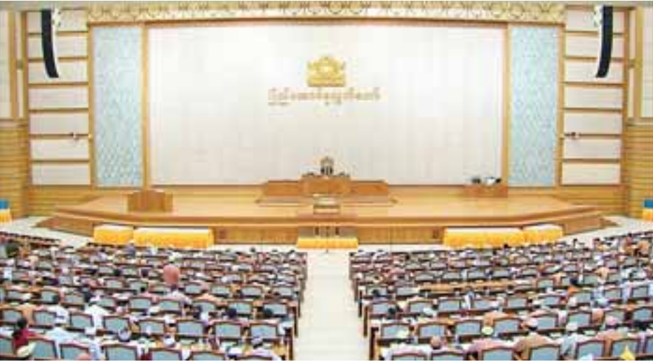
ဒုတိယအကြိမ် ပြည်ထောင်စုလွှတ်တော် ဆဌမပုံမှန်အစည်းအဝေး ကျင်းပစဉ်။

စိုက်ပျိုးရေး၊ မွေးမြူရေးနှင့် ဆည်မြောင်းဝန်ကြီးဌာန ကျေးလက်ဒေသဖွံ့ဖြိုးတိုးတက်ရေးဦးစီးဌာနမှ ကျေးလက်နေပြည်သူများ၏ လူမှုစီးပွားဘဝဖွံ့ဖြိုးတိုးတက်စေရန်ရည်ရွယ်၍ မြစ်မ်းရောင်ကျေးရွာစီမံကိန်းအား အကောင်အထည်ဖော်ဆောင်ရွက်ပေးလျက်ရှိကြောင်း သိရသည်။