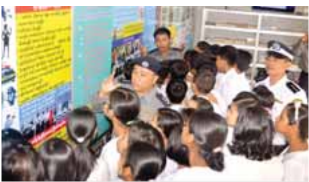
မြို့နယ်(မြန်/ဆက်)

ရန်ကုန် နိုဝင်ဘာ ၂၄ ရန်ကုန်တိုင်းဒေသကြီး ဒဂုံမြို့နယ် ကျန်းမာရေးဦးစီးဌာနအနေဖြင့် ကျောင်း အခြေပြုဂျပန်ဦးနှောက်ရောင်ရောဂါကာကွယ်ဆေးထိုးနှံခြင်းကို နိုဝင်ဘာ ၁၅ မှ ၂၃ ရက်ထိ ဆေးထိုးအဖွဲ့ ခြောက်ဖွဲ့ဖြင့် ကွင်းဆင်းထိုးနှံပေးခဲ့ကာ ပညာရေး ဌာန၏ ပူးပေါင်းကူညီမှုဖြင့် အခြေခံပညာကျောင်းများနှင့် ကိုယ်ပိုင်ကျောင်း များရှိ ကျောင်းသား ကျောင်းသူ ၁၁၆၃၇ ဦးအနက် ၁၁၁၂၇ ဦးကို ကာကွယ် ဆေးများထိုးနှံပေးနိုင်ခဲ့ပြီး ကျောင်းအခြေပြုအနေဖြင့် ၉၆ ရာခိုင်နှုန်း ထိုးနှံ ပေးနိုင်ခဲ့ကြောင်း ဒဂုံမြို့နယ်ကျန်းမာရေးဦးစီးဌာနမှ သိရသည်။