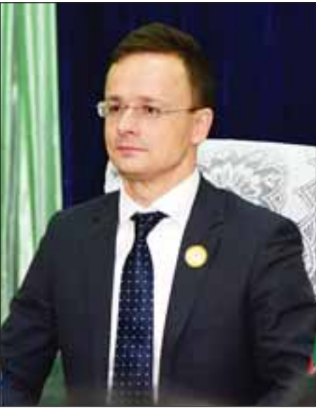
ဟန်ဂေရီနိုင်ငံခြားရေးဝန်ကြီး Mr. Peter Szijjarto

ဖြေ။ မြန်မာနိုင်ငံဟာ ကြီးမားတဲ့စိန်ခေါ်မှုတွေအကြား ရုန်းကန်နေရဆဲပဲလို့ ကျွန်တော်သိရှိထားပါတယ်။ စိန်ခေါ်မှုတွေနဲ့ ရုန်းကန်နေရတဲ့ နိုင်ငံများစွာရှိပါတယ်။ သို့သော်လည်း ရိုးရိုးသားသားပြောရရင် မြန်မာတစ်နိုင်ငံကို ပဲ ညွှန်းဆိုတာမဟုတ်ပါဘူး။ နိုင်ငံတကာ အသိုင်းအဝိုင်း အနေနဲ့ မြန်မာနိုင်ငံကို ဖိအားမပေးဖို့ ကျွန်တော်တို့ တိုက်တွန်းထားပါတယ်။ ဘာကြောင့်လဲဆိုတော့ မြန်မာ နိုင်ငံကို ဖိအားပေးလွန်းရင် မူလလမ်းကြောင်းပေါ် ပြန်လည် ရောက်ရှိသွားနိုင်တဲ့ အခြေအနေကြောင့် ဖြစ်ပါတယ်။ ဒီအခက်အခဲစိန်ခေါ်မှုတွေကို မြန်မာအစိုးရအနေနဲ့ ဖြေရှင်းနိုင်မယ်လို့ ကျွန်တော်တို့ယုံကြည်ပါတယ်။ မဟုတ် လို့ကတော့ ရွှေ့ပြောင်းသွားလာမှုတွေကို ကိုင်တွယ်ထိန်း သိမ်းနိုင်မှာ မဟုတ်ပါဘူး။ အာရှနိုင်ငံတွေက အတွေ့အကြုံ