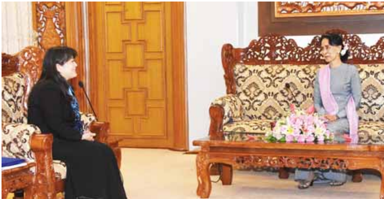
နိုင်ငံတော်၏အတိုင်ပင်ခံပုဂ္ဂိုလ် ဒေါ်အောင်ဆန်းစုကြည် ကုလသမဂ္ဂကလေးသူငယ်များ ရန်ပုံငွေအဖွဲ့.(UNICEF)၏ မြန်မာနိုင်ငံဆိုင်ရာ ဌာနကိုယ်စားလှယ်အား လက်ခံတွေ့ဆုံစဉ်။