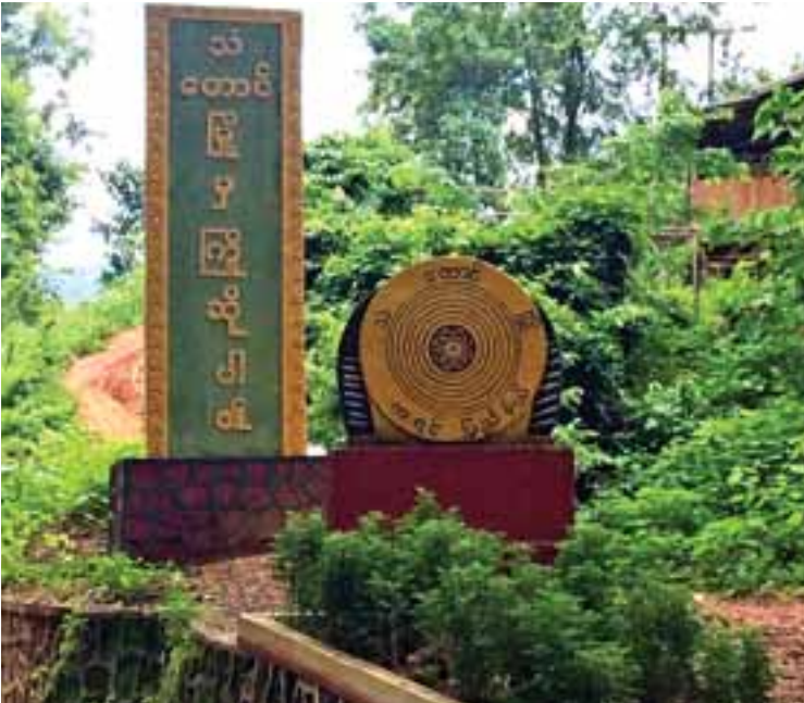
သံတောင်မြို့အဝင် ဆိုင်းဘုတ်

တညင်းသီးထွက်ချိန်တွင်မူ ပြည်ခြင်နှင့် ရောင်းလေ့ရှိပြီး ဈေးပေါလှသည်ဟုဆိုသည်။ တောင်တက်ခရီးတွင် တွေ့မြင်ရသည့် တောင်စွယ်တောင်တန်းများ၌ ဗုဒ္ဓရုပ်ပွားတော်များ၊ စေတီပုထိုးများကိုလည်း ကြည့်ညို့ဖွယ် ဖူးတွေ့ရလေသည်။ တောင်ပေါ်ရောက်ခါနီးတွင်မူ လက်ဖက်စိုက်ခင်းများကို အစီအရီ မြင်တွေ့ရပါ၏။ ဒေသခံတိုင်းရင်းသားများမှာ အေးဆေးဖော်ရွေလွန်းလှသည်။ အချို့သော ခရီးသွားများကား ဆိုင်ကယ်ကယ်ရိများဖြင့် တက်ကြသည်။ ခရီးသွားတိုးရစ်အချို့မှာ လမ်းအတိုင်းနားနားနေနေ ခြေကျင်တက်လာသည်ကို မြင်ရ၏။ တောလမ်း အသွယ်သွယ် လျှိုမြောင်အထပ်ထပ်ရှိပသာဒ သဘာဝအလှအပများကို ရှာဖွေခံစားလိုကြသူများပါပေ။