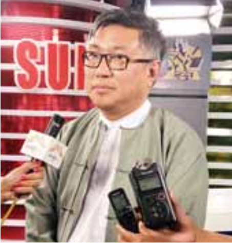
ဦးကိုကို(ကိုကို-စက်မှုတက္ကသိုလ်)

“အခု ဒီလိုအရေးကြီးတဲ့ issue တွေကို Sunday Talk ကနေ တင်ဆက်ဖို့ အခွင့်အရေးရတာကလည်း Sunday Talk ရဲ့ အောင်မြင်မှုတစ်ခုလို့လည်း ခံယူပါတယ်၊ ရခိုင်ဒေသနဲ့ပတ်သက်ပြီး အခု ထုတ်လွှင့်မယ့် အစီအစဉ်ကို ပြည်သူတွေ စောင့်မျှော်ကြည့်ရှုရင် တကယ့်ဖြစ်ရပ်မှန်တွေ သိနိုင်မယ်လို့ မျှော်လင့်ပါတယ်၊ မြန်မာ့ရုပ်မြင်သံကြားတင်မကဘဲ အခြားရုပ်မြင်သံကြား Channel တွေက တစ်ဆင့် ကမ္ဘာကိုပါ သိရှိနိုင်အောင် ထုတ်လွှင့်ပြသနိုင်မယ်ဆိုရင် မြန်မာနိုင်ငံအပေါ်မှာ စွပ်စွဲပြောဆိုနေတဲ့ ကိစ္စတွေနဲ့ပတ်သက်ပြီး မှားနေတဲ့ကိစ္စတွေကို အမှန်တစ်ခုနဲ့ ချေဖျက်နိုင်လိမ့်မယ်လို့ ကျွန်တော် မျှော်လင့်ပါတယ်”ဟု ၎င်းက သုံးသပ်ပြောကြားသည်။