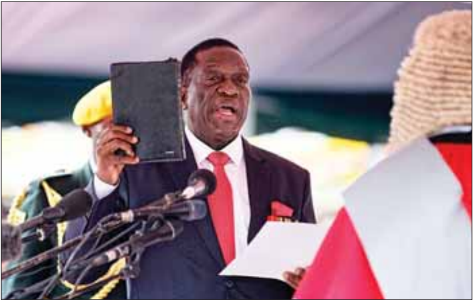
သို့ရာတွင် တပ်မတော်က နိုဝင်ဘာ ၁၅ ရက်တွင် နိုင်ငံရေး အကျပ်အတည်းကို ကြားဝင်ဖြေရှင်းပေးနိုင်ရန် သမ္မတအဖြစ် တာဝန်ထမ်းဆောင်စေခဲ့သည်။

အာဏာရ ဇနီးပီအက်ဖ်ပါတီသည် အိမ်နန့်ဂါဂါအား ပါတီမှ ဖယ်ရှားခဲ့ရာ သမ္မတကတော် ဂရေစ်မှာ မူဂါဘီ၏ အရိုက်အရာကို ဆက်ခံရန် လမ်းပွင့်သွားခဲ့သည်။