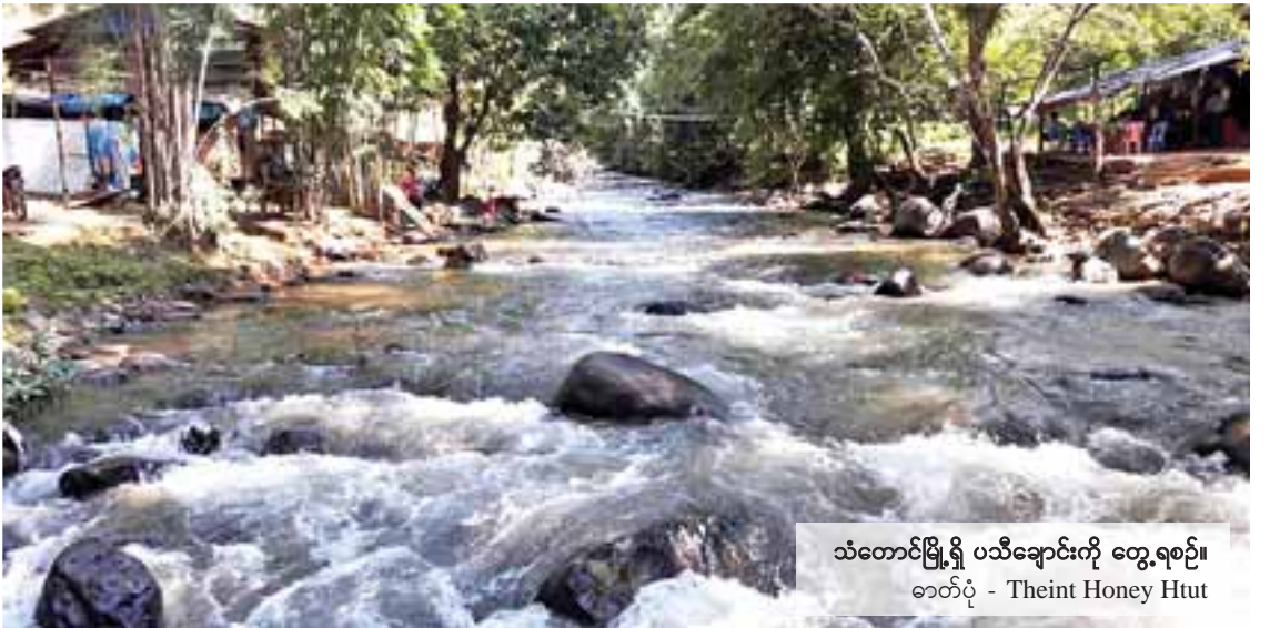
သံတောင်မြို့ရှိ ပသီချောင်းကို တွေ့ရစဉ်။

မိမိတို့ အလယ်တန်းကျောင်းသားဘဝတွင် မြန်မာစာ စကားပြေ၌ သင်ကြားရသည့် ဆရာကြီး ရွှေဥဒေါင်း၏ “သိုင်းနယ်မှ ကျားသောင်းကျန်း” ဆောင်းပါး၌ ပါဝင်သော တော၏တိတ်ဆိတ်ခြင်း၊ ဂူ၏တိတ်ဆိတ်ခြင်းဆိုသည့် စာကိုသတိရမိရာ ဤသို့တောင်အလုံ၌ တိတ်ဆိတ်နေခြင်းကို မည်သို့စာဖွဲ့ရမည်ကိုကား မသိတော့ပါချေ။ မိမိသည် တောင်ကြီး၊ မေမြို့၊ ကလေး၊ အောင်ပန်း