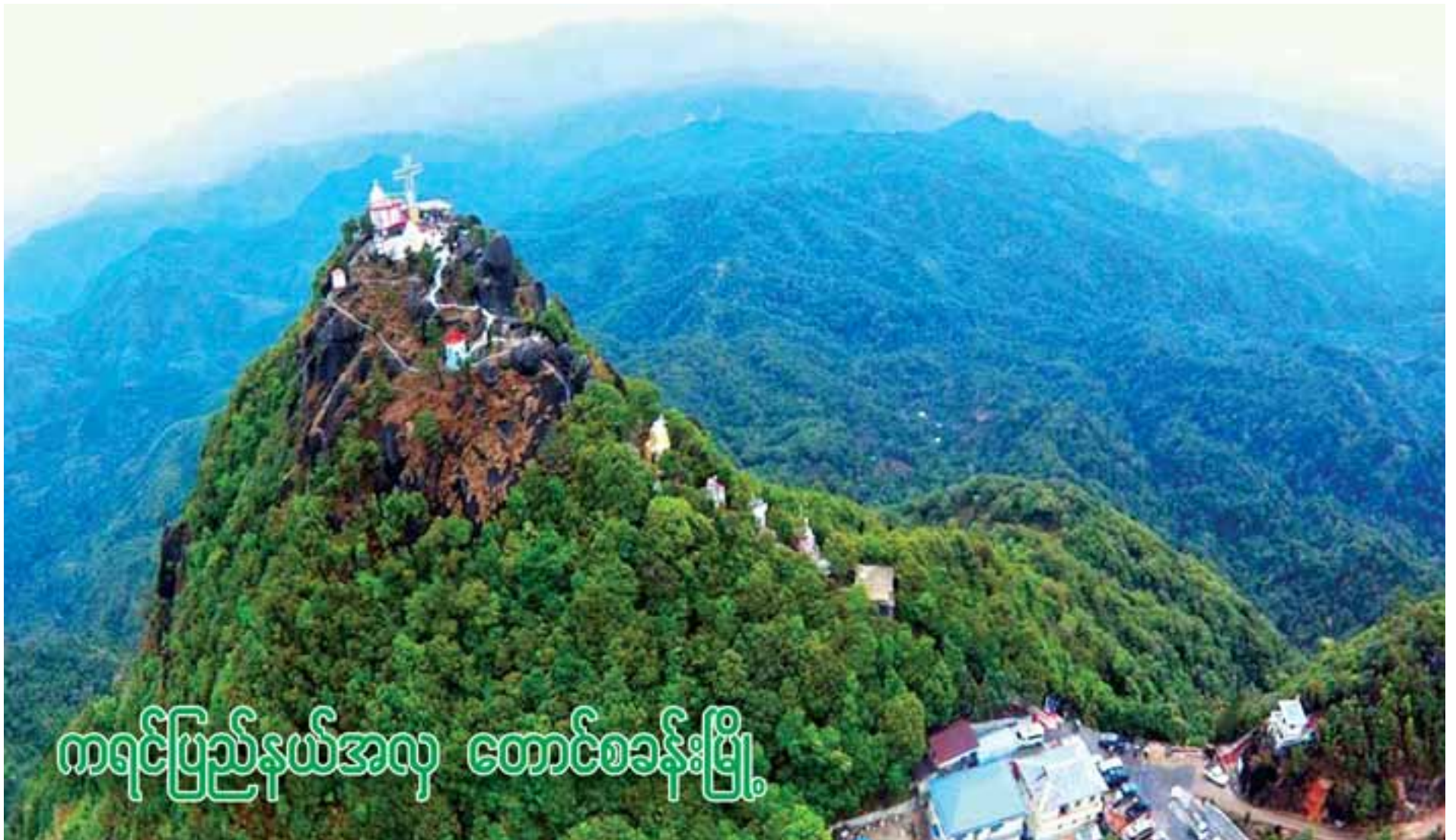
ကရင်တိုင်းရင်းသားတို့ အထွတ်အမြတ်ထားရာ နော်ဘူဘောတောင်။

အေးချမ်းလှပသော သံတောင်ကြီး တောင်စခန်းမြို့လေးမှာ ကရင်ပြည်နယ် အတွင်း ပင်လယ်ရေမျက်နှာပြင်အထက် ပေပေါင်း ၄၈၄၂ အမြင့်၌ တည်ရှိပါသည်။ ကရင်ပြည်နယ်အတွင်း ဆိုသော်ငြားလည်း ပဲခူးတိုင်းဒေသကြီးနှင့် ကပ်နေသည်ဖြစ်ရာ တောင်ငူမြို့နှင့် မိုင်သုံးဆယ်မျှသာ ခရီးတာ ကွာလေသည်။ သို့ဖြစ်၍ ရန်ကုန်မြို့မှ အဝေးပြေးလမ်းမကြီးအတိုင်း လွယ်လင့်တကူ