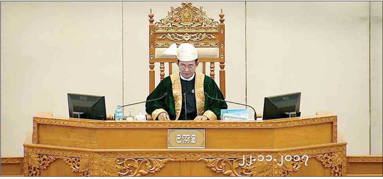
ပြည်သူ့လွှတ်တော်ဥက္ကဋ္ဌ ဦးဝင်းမြင့်

နေပြည်တော် နိုဝင်ဘာ ၂၂ ယနေ့ ကျင်းပသည့် ဒုတိယအကြိမ် ပြည်သူ့လွှတ်တော် ဆဌမပုံမှန် အစည်းအဝေး (၁၅) ရက်မြောက်နေ့တွင် ကော်မတီအဖွဲ့ဝင်များ အစားထိုး ဖွဲ့စည်းခြင်း၊ ကြယ်ပွင့်ပြ မေးခွန်း ၅ ခု မေးမြန်းခြင်းနှင့် ဖြေကြားခြင်း၊ ဥပဒေကြမ်း ၁ ခုအစီရင်ခံစာ တင်သွင်းခြင်းနှင့် အဆို ၁ ခု ဆွေးနွေးခြင်းတို့ကို ဆောင်ရွက်ကြသည်။ အစည်းအဝေးတွင် ပြည်သူ့လွှတ်တော်ဥက္ကဋ္ဌ ဦးဝင်းမြင့်က လွှတ်တော် အခွင့်အရေးကော်မတီ၏ လစ်လပ်သွားသောနေရာ၌ တပ်မတော်သားပြည်သူ့ လွှတ်တော်ကိုယ်စားလှယ် ဗိုလ်ချုပ်တင်ဆွေဝင်းအား အဖွဲ့ဝင်အဖြစ် လည်းကောင်း၊ အစိုးရ၏ အာမခံချက်များ၊ ကတိများနှင့် တာဝန်ခံချက်များ စိစစ်ရေးကော်မတီ၏ လစ်လပ်သွားသော အဖွဲ့ဝင်နေရာ၌ တပ်မတော်သား ပြည်သူ့လွှတ်တော်ကိုယ်စားလှယ် ဗိုလ်မှူးချုပ် ရဲနိုင်မျိုးအား အဖွဲ့ဝင်အဖြစ် လည်းကောင်း အစားထိုးဖွဲ့စည်းမည်ဖြစ်ကြောင်း တင်ပြပြီး ကော်မတီအဖွဲ့ဝင် များ အစားထိုးဖွဲ့စည်းခြင်းနှင့်စပ်လျဉ်း၍ လွှတ်တော်၏ အတည်ပြုချက်ရလူရာ လွှတ်တော်က သဘောတူကြောင်း ကြေညာသည်။ ထို့နောက် သာစည်မဲဆန္ဒနယ်မှ ဦးသန်းစိုး၏ သာစည်မြို့နယ်အတွင်းရှိ သက်တော်ဆည် ရေဝင်မြောင်းအား ပြန်လည်တူးဖော်ပေးရန်နှင့် တမံ(၁)နှင့် (၂)ကို ဆက်သွယ်သော မြောင်းအား စာမျက်နှာ ၅ ကော်လံ ၁ သို့ *