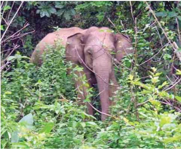
စပါးပေါ်ချိန်၊ ကြံခတ်ချိန်များတွင် ညအခါ တောဆင်ရိုင်းများ မကြာခဏ ဝင်ရောက်စားသောက်ဖျက်ဆီးလေ့ရှိသဖြင့် စပါးများကို စောစီးစွာ ရိတ်သိမ်း လေ့ရှိကြောင်း ရပ်မိရပ်ဖတစ်ဦးက ပြောသည်။