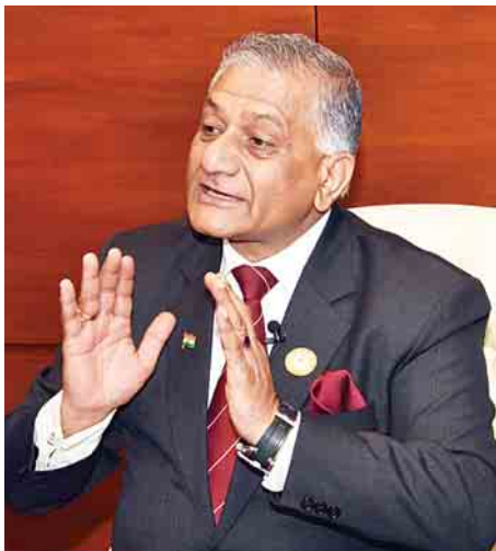
အိန္ဒိယနိုင်ငံ နိုင်ငံခြားရေးဝန်ကြီးဌာန ဒုတိယဝန်ကြီး Mr. vijay Kumar singh

ဖြေ။ ။ ရခိုင်မြောက်ပိုင်း အကျပ်အတည်းပြဿနာဟာ မြန်မာအစိုးရနဲ့ ဘင်္ဂလားဒေ့ရှ်နိုင်ငံ အစိုးရတို့အကြား ဆက်သွယ်နေတဲ့ အရေးကိစ္စတစ်ခုဖြစ်ပါတယ်။ အဲဒီပြဿနာမှာ အစိတ်အပိုင်း နှစ်ပိုင်းရှိတယ်လို့မြင်ပါတယ်။