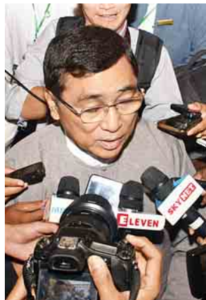
ပြည်ထောင်စုဝန်ကြီး ဒေါက်တာဝင်းမြတ်အေး

ဂလိုဘယ်လိုက်ဇေးရှင်းခေတ်တွင် မတူကွဲပြားခြားနားမှုများကို စီမံခန့်ခွဲခြင်း (Diversity Management in the Age of Globalization) ဆိုင်ရာ ဆွေးနွေးပွဲကို နိုဝင်ဘာ ၂၂ ရက်တွင် နေပြည်တော်ရှိ မင်္ဂလာဒုံရပ်ကွက်တွင် ကျင်းပခဲ့သည်။ အဆိုပါ ဆွေးနွေးပွဲတွင် "Policy and Conceptual Frameworks: Experiences from Southeast Asia, Experiences from Europe and Africa" စသဖြင့် မတူကွဲပြားမှုများ၊ စီမံခန့်ခွဲမှုဆိုင်ရာ မူဝါဒများ၊ အတွေ့အကြုံများကို ခေါင်းစဉ်များခွဲ၍ ပြည်တွင်း၊ ပြည်ပမှ Diversity Management ဆိုင်ရာ ကျွမ်းကျင်ပညာရှင်များက ဆွေးနွေးခဲ့ကြသည်။ ဆွေးနွေးပွဲသို့ ဘာသာပေါင်းစုံမှ အကြီးအကဲများ၊ ရခိုင်ပြည်နယ်အပါအဝင် တိုင်းဒေသကြီးနှင့် ပြည်နယ်များမှ တိုင်းရင်းသားလူမျိုးများ၊ လူငယ်များ၊ ဘာသာရပ်ဆိုင်ရာ ပညာရှင်များ၊ နိုင်ငံတကာအဖွဲ့အစည်းများ၊ အရပ်ဘက်လူမှုအဖွဲ့အစည်းများနှင့် စိတ်ပါဝင်စားသူများ တက်ရောက်ခဲ့ကြပြီး ၎င်းတို့၏ သဘောထားအမြင်များကို ယခုကဲ့သို့ ထုတ်ဖော်ပြောဆိုလိုက်ရပါသည်။