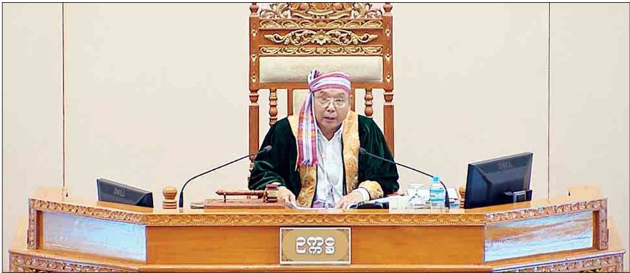
အမျိုးသားလွှတ်တော်ဥက္ကဋ္ဌ မန်းဝင်းနိုင်သန်း

နေပြည်တော် နိုဝင်ဘာ ၂၂ လူမှုဖူလုံရေးအဖွဲ့ပိုင် အလုပ်သမားဆေးရုံကြီးများနှင့် ဆေးခန်းများကို အဆင့်မြှင့်တင်နိုင်ရေးအတွက် ပုဂ္ဂလိကကျန်းမာရေး စောင့်ရှောက်မှု ကုမ္ပဏီ များနှင့်ပူးပေါင်း၍ အကောင်အထည်ဖော်ဆောင်ရွက်နိုင်ရန် ရေတိုရေရှည် စီမံကိန်းများ ရေးဆွဲဆောင်ရွက်လျက်ရှိပါကြောင်း အလုပ်သမား၊ လူဝင်မှု ကြီးကြပ်ရေးနှင့် ပြည်သူ့အင်အားဝန်ကြီးဌာန ပြည်ထောင်စုဝန်ကြီး ဦးသိန်းဆွေ ကပြောကြားသည်။ ယနေ့ကျင်းပသည့် ဒုတိယအကြိမ် အမျိုးသားလွှတ်တော် ဆဌမပုံမှန် အစည်းအဝေး(၁၅)ရက်မြောက်နေ့တွင် မွန်ပြည်နယ် မဲဆန္ဒနယ်အမှတ်(၉)မှ ဒေါက်တာဇော်လင်းထွဋ်၏ လုပ်ခလစာအလိုက် လစဉ်ကျန်းမာရေးနှင့် လူမှုရေးစောင့်ရှောက်မှု အာမခံငွေ ပေးသွင်းနေရသော်လည်း လုံလောက်သော ကျန်းမာရေးစောင့်ရှောက်မှု မပေးနိုင်သည့် လူမှုဖူလုံရေး ဆေးခန်းများအနေဖြင့် ထိရောက်သော ကျန်းမာရေး စောင့်ရှောက်မှုပေးနိုင်စေရန် မည်သို့မည်ပုံ စီမံဆောင်ရွက်နေသည်ကို သိရှိလိုခြင်းနှင့် စပ်လျဉ်း၍ ပြည်ထောင်စုဝန်ကြီးက အထက်ပါအတိုင်း ရှင်းလင်းဖြေကြားခဲ့ခြင်းဖြစ်သည်။ စာမျက်နှာ ၅ ကော်လံ ၁ သို့ ✦