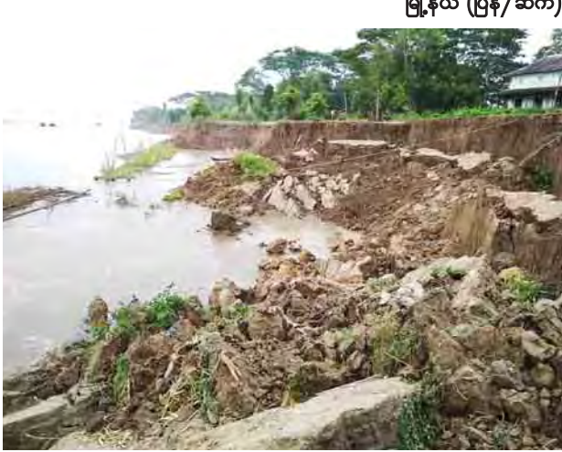
မြို့နယ် (ပြန်/ဆက်)

နေဖြူ နိုဝင်ဘာ ၂၂ နေဖြူမြို့နယ်တွင် မြစ်ကမ်းထိန်းသိမ်းရေးလုပ်ငန်းများအား နေဖြူမြို့နယ် အုန်းပင်ကွင်းအုပ်စု မရမ်းချောင်းမြစ်ကမ်းနားနှင့် မြစ်ကမ်းတစ်ဖက်ရှိ စံကင်း မြစ်ကမ်းနားတစ်လျှောက် ကျောက်စိကွန်ကရစ်ရံနံများဖြင့် မြစ်ကမ်းထိန်း သိမ်းရေးလုပ်ငန်းများ ဆောင်ရွက်လျက်ရှိသော်လည်း ယနေ့နံနက်ပိုင်းတွင် အုန်းပင်ကွင်းအုပ်စု မရမ်းချောင်းကျေးရွာ မြစ်ကမ်းပါးထိန်းသိမ်းခြင်းလုပ်ငန်း ဆောင်ရွက်နေသည့် နေရာအနီး ပေ ၃၀၀ ခန့် ကမ်းပါးပြိုကျခဲ့သည်။ နိုဝင်ဘာ ၁၈ ရက်ကလည်း စံကင်းကျေးတို့ဆိပ် ဆည်မြောင်းရေကင်းရုံးနှင့် ရေအရင်း အမြစ် မြစ်ကမ်းထိန်းရုံးအကြား ပေ ၁၀၀ ခန့် ရေကာတာတစ်ဝက်ကျော် ပြိုကျခဲ့ပြီး မြို့နယ်မှတာဝန်ရှိသူများက ကမ်းပြိုသည့်နေရာများသို့ ကွင်းဆင်း ဆောင်ရွက်လျက်ရှိကြောင်း သိရသည်။