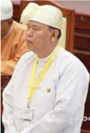
ဒုတိယဝန်ကြီး ဦးဝင်းမော်ထွန်း

ဆက်လက်၍ ဒုတိယဝန်ကြီးက လဟယ်မဲဆန္ဒနယ်မှ ဦးသက်နောင်၏