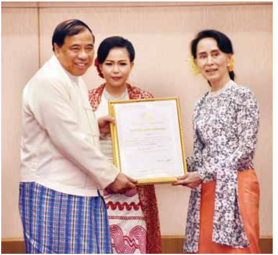
နိုင်ငံတော်၏အတိုင်ပင်ခံပုဂ္ဂိုလ် ဒေါ်အောင်ဆန်းစုကြည် အလှူရှင်တစ်ဦးအား ဂုဏ်ပြုမှတ်တမ်းလွှာပေးအပ်စဉ်။

UEHRD ကော်မတီဥက္ကဋ္ဌ နိုင်ငံတော်၏အတိုင်ပင်ခံပုဂ္ဂိုလ်က မည်သည့် အလုပ်မျိုးလုပ်လုပ် နိုင်ငံတစ်နိုင်ငံတွင် ကိုယ့်အချင်းချင်း စည်းစည်းလုံးလုံး လုပ်ပါက အောင်မြင်နိုင်မည်ဟု ယုံကြည်ပါကြောင်း၊ မိမိတို့ပြည်တွင်းအင်အားကို ယှဉ်နိုင်သည့် ပြည်ပအင်အားဆိုတာ ဘာမှမရှိဘူးဟု ယုံကြည်ပါကြောင်း။