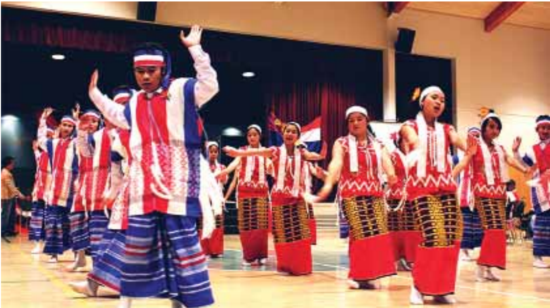
ကရင်နုံးယိမ်းအကဖြင့် ကပြဖျော်ဖြေစဉ်။

ကရင်ပြည်နယ်သို့ရောက်တိုင်း ကရင်ပြည်နယ်၏အထင်ကရ ဇွဲကပင်တောင်ကြီး၊ ဒေါနတောင်တန်းကြီး၊ ကော့ဂွန်းဂူ၊ သာမညတောင်နှင့်အတူ ကရင်တိုင်းရင်းသားလူမျိုးများကို တွေ့မြင်နေရ၍ ကရင်တိုင်းရင်းသားတို့၏အကြောင်းများကို အစဉ်အမြဲစိတ်ဝင်စားမိကာ ကရင်ပြည်နယ်နှင့် ကရင်တိုင်းရင်းသားများအကြောင်း စာရေးချင်စိတ်က တဖွားဖွားပေါ်လာတတ်သည်။ ဒါကြောင့်လည်း အခုတစ်ခေါက်တော့ ကရင်ပြည်နယ်အကြောင်းနှင့် ကရင်တိုင်းရင်းသားတို့၏အကြောင်းကို တစေ့တစောင်းလေ့လာ၍ ရေးသားမည်ဟူသော ဆုံးဖြတ်ချက်နှင့်အတူ ကရင်ပြည်နယ်အကြောင်း