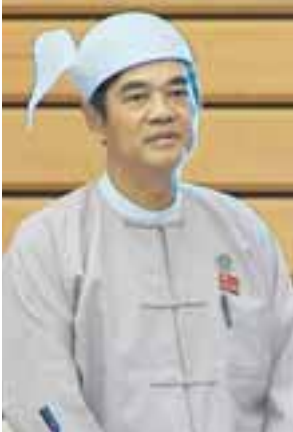
ပဲခူးတိုင်းဒေသကြီး မဲဆန္ဒနယ် အမှတ်(၁၁)မှ ဒေါက်တာဝင်းမြင့်

ကျန်းမာရေးဌာနအဖြစ် တိုးမြှင့်ပေးရန်မေးခွန်း တို့နှင့်စပ်လျဉ်း၍ ကျန်းမာရေးနှင့် အားကစားဝန်ကြီးဌာန ပြည်ထောင်စုဝန်ကြီး ဒေါက်တာမြင့်ထွေးက ပြန်လည် ဖြေကြားသည်။