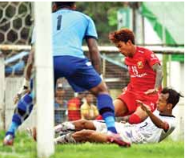
ဆီမီးဖိုင်နယ် ဒုတိယအကျော့ပွဲတွင် ဧရာဝတီနှင့် ရှမ်းယူနိုက်တက်အသင်းတို့ တွေ့ဆုံခဲ့စဉ်။

ယခုရာသီ ရှုံးထွက်ပြိုင်ပွဲတွင် အသင်းကြီးများအားလုံး စုံလင်စွာ တက်ရောက်နိုင်ခဲ့ပြီး ရှမ်းယူနိုက်တက်အသင်းနှင့် ရန်ကုန်အသင်းတို့သည် ဧရာဝတီနှင့် ရတနာပုံအသင်းတို့ ကျော်ဖြတ်ကာ တက်ရောက်လာခြင်းဖြစ်သည်။ ရှမ်းယူနိုက်တက်အသင်းသည် ဧရာဝတီအသင်းနှင့် နှစ်ကျော့စလုံး သရေကျခဲ့ပြီး ပထမအကျော့အိမ်ကွင်းပွဲတွင် တစ်ဂိုးစီသရေ၊ ဒုတိယအကျော့ အဝေးကွင်းပွဲတွင် နှစ်ဂိုးစီသရေကျကာ နှစ်ကျော့ပေါင်း သုံးဂိုးစီ သရေကျခဲ့သော်လည်း အဝေးဂိုး စည်းမျဉ်းဖြင့် ဗိုလ်လုပွဲတက်ရောက်လာခြင်းဖြစ်သည်။ ရန်ကုန်အသင်းမှာမူ ပထမအကျော့အိမ်ကွင်း စာမျက်နှာ ၇ ကော်လံ ၁ သို့ ●