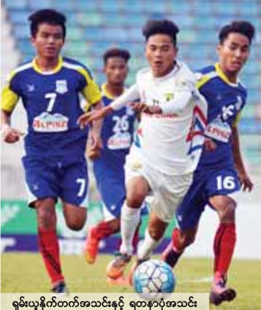
ရှမ်းယူနိုက်တက်အသင်းနှင့် ရတနာပုံအသင်း

ပွဲစဉ် (၂၁)အဖြစ် အောက်တိုဘာ ၂၁ ရက်တွင် သုဝဏ္ဏကွင်း၌ ချင်းယူနိုက်တက်အသင်းနှင့် GFA အသင်း၊ အောက်တိုဘာ ၂၂ ရက်တွင် မန္တလာသီရိကွင်း၌ ရတနာပုံအသင်းနှင့် ရှမ်းယူနိုက်တက်အသင်း၊ အောင်ဆန်းကွင်း၌ ရခိုင်အသင်းနှင့် မကွေးအသင်း၊ ပဲခူးကွင်း၌ ဟံသာဝတီအသင်းနှင့် Southern အသင်း ပုသိမ်ကွင်း၌