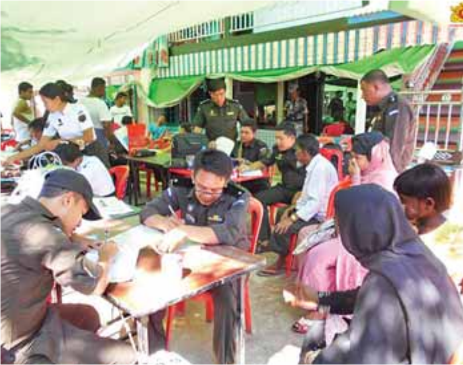
လူဝင်မှုကြီးကြပ်ရေးနှင့် ပြည်သူ့အင်အားဦးစီးဌာနမှ ဝန်ထမ်းများ မောင်တောမြို့နယ် ရွှေလေးမြောက်၊ အနောက်နှင့် အလယ်ရွာတို့တွင် NVC ကတ်များထုတ်ပေးနိုင်ရေးလုပ်ငန်းများ ဆောင်ရွက်နေစဉ်။ (အပေါ်ပုံနှင့်အောက်ပုံ)

ယခုကဲ့သို့ နိုင်ငံသားစိစစ်ခံရမည့်သူ၏ သက်သေခံကတ်ပြား (NVC) နှင့် NID(Biometric) လုပ်ငန်းများကို ဆက်လက်ကွင်းဆင်းဆောင်ရွက်သွားမည်ဖြစ်ကြောင်း သတင်းရရှိသည်။ (သတင်းစဉ်)