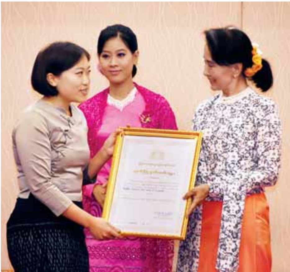
နိုင်ငံတော်၏အတိုင်ပင်ခံပုဂ္ဂိုလ် ဒေါ်အောင်ဆန်းစုကြည် အလှူရှင်တစ်ဦးအား ဂုဏ်ပြုမှတ်တမ်းလွှာပေးအပ်စဉ်။