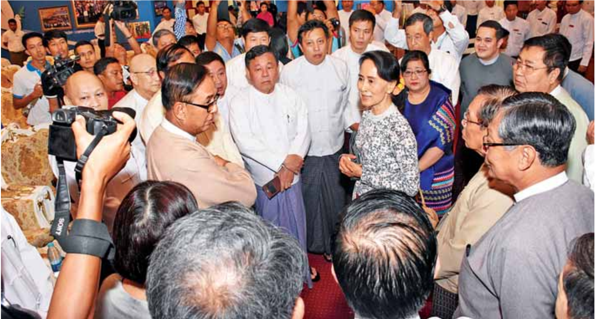
UEHRD အတွက် အလှူငွေပေးအပ်ပွဲအခမ်းအနားတွင် နိုင်ငံတော်၏အတိုင်ပင်ခံပုဂ္ဂိုလ် ဒေါ်အောင်ဆန်းစုကြည် အလှူရှင် စီးပွားရေးလုပ်ငန်းရှင်ကြီးများအား ရင်းရင်းနှီးနှီးနှုတ်ဆက်စဉ်။