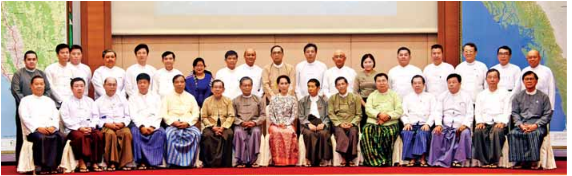
နိုင်ငံတော်၏အတိုင်ပင်ခံပုဂ္ဂိုလ် ဒေါ်အောင်ဆန်းစုကြည်၊ ပြည်ထောင်စုဝန်ကြီး ဦးကျော်တင့်ဆွေ၊ ဒုတိယဝန်ကြီးများ၊ အလှူရှင် စီးပွားရေးလုပ်ငန်းရှင်များနှင့်အတူ မှတ်တမ်းတင်ဓာတ်ပုံရိုက်စဉ်။