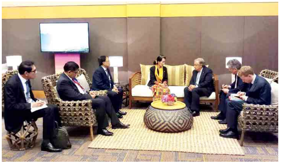
နိုင်ငံတော်၏အတိုင်ပင်ခံပုဂ္ဂိုလ် ဒေါ်အောင်ဆန်းစုကြည်နှင့် ကုလသမဂ္ဂအတွင်းရေးမှူးချုပ် Mr. Antonio Guterres တို့ မနီလာမြို့၌ တွေ့ဆုံစဉ်။