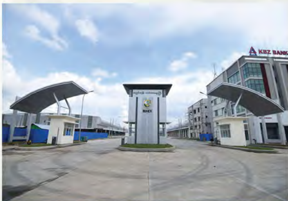
SHOP HOUSE BUILDING (2 UNIT 3 STOREY )

အခန်း (၀၄-၀၃)၊ ၄ လွှာ၊ ဘလောက် (အေ)၊ ဒဂုံစင်တာ (၁)၊ အမှတ် ၂၆၂-၂၆၄၊ ပြည်လမ်း၊ စမ်းချောင်းမြို့နယ်၊ ရန်ကုန်မြို့။ ဖုန်း - ၀၁ - ၅၀၃၉၂၈ ၊ ၅၀၃၉၂၉