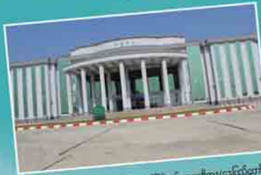
အမျိုးသားပြည်သူ့ပြန်လှူငွေနှင့်အသုံးပြုမှုအဖွဲ့ချုပ် (သို့မဟုတ် အမျိုးသားပြည်သူ့ပြန်လှူငွေနှင့်အသုံးပြုမှုအဖွဲ့ချုပ်)