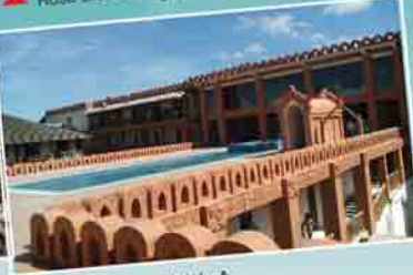
Royal Palace Hotel မှတ်တမ်း