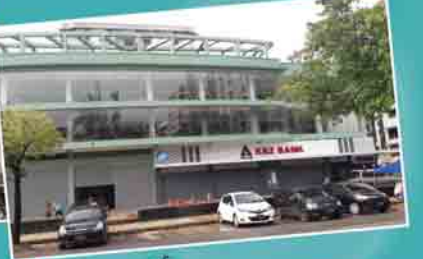
KBZ Bank ဘဏ်