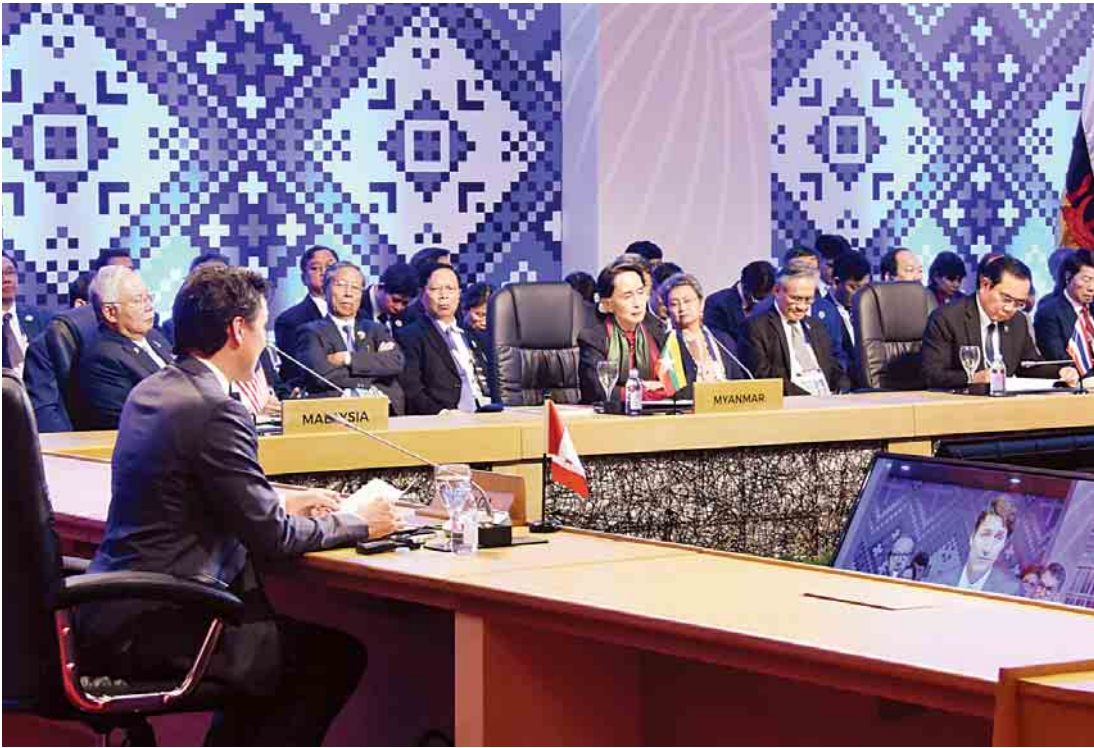
နှစ်(၄၀)ပြည့် အထိမ်းအမှတ် အာဆီယံ-ကနေဒါ ထိပ်သီးအစည်းအဝေးသို့ နိုင်ငံတော်၏အတိုင်ပင်ခံပုဂ္ဂိုလ် ဒေါ်အောင်ဆန်းစုကြည် တက်ရောက်စဉ်။