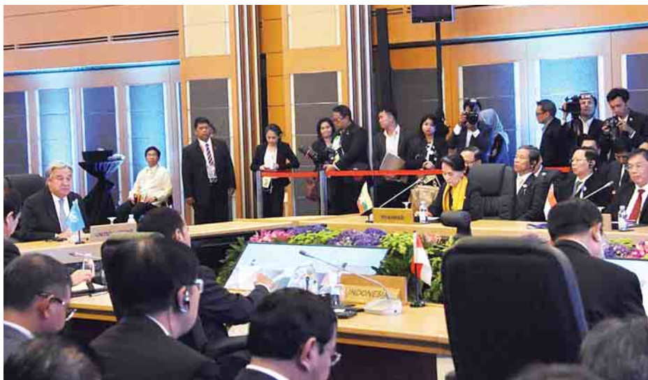
(ဇ)ကြိမ်မြောက် အာဆီယံ-ကုလသမဂ္ဂ ထိပ်သီးအစည်းအဝေး နိုင်ငံတော်၏အတိုင်ပင်ခံပုဂ္ဂိုလ် ဒေါ်အောင်ဆန်းစုကြည် တက်ရောက်စဉ်။