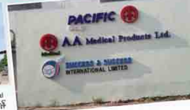
AA Pharmacy Warehouse