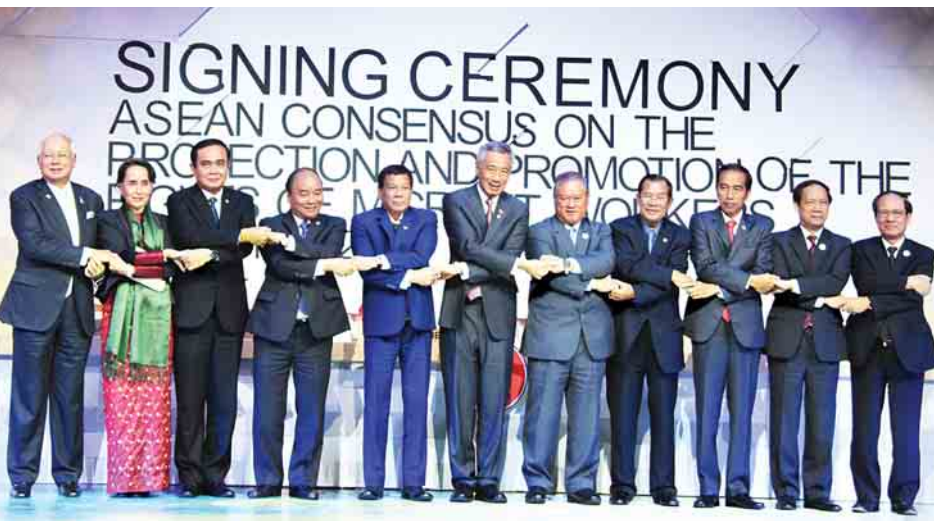
နိုင်ငံတော်၏အတိုင်ပင်ခံပုဂ္ဂိုလ်နှင့် အာဆီယံခေါင်းဆောင်များ အလုပ်သမားများ၏ အခွင့်အရေးကာကွယ်ရေးနှင့် မြှင့်တင်ရေးဆိုင်ရာ ASEAN သဘောတူညီချက်ကို လက်မှတ်ရေးထိုးကြပြီး မှတ်တမ်းတင်ဓာတ်ပုံရိုက်ကြစဉ်။