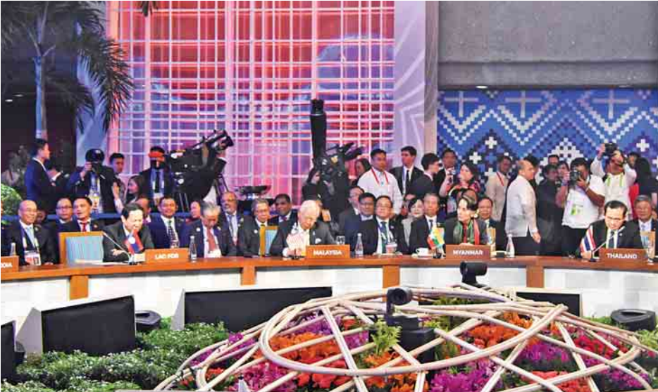
(၁၂)ကြိမ်မြောက် အရှေ့အာရှ ထိပ်သီးအစည်းအဝေးသို့ နိုင်ငံတော်၏အတိုင်ပင်ခံပုဂ္ဂိုလ် ဒေါ်အောင်ဆန်းစုကြည် တက်ရောက်စဉ်။