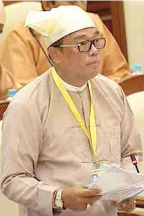
ဒုတိယဝန်ကြီး ဦးကျော်လင်း