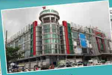
AKK Shopping Mall သယ်ယူပို့ဆောင်ရေး