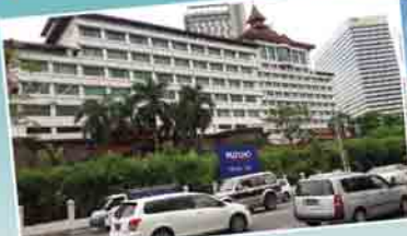
Mizuho Bank ကျွေးမွေးရေးဌာန