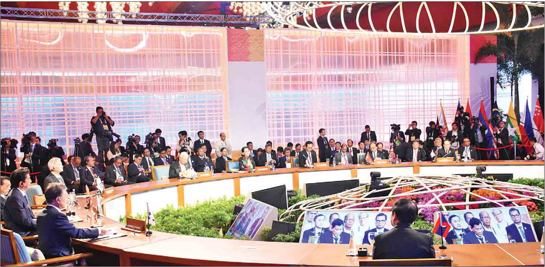
နိုင်ငံတော်၏အတိုင်ပင်ခံပုဂ္ဂိုလ် ဒေါ်အောင်ဆန်းစုကြည် အကြိမ်(၂၀)မြောက် အာဆီယံ + ၃ ထိပ်သီးအစည်းအဝေးသို့ တက်ရောက်စဉ်။

မနီလာ(ဖိလစ်ပိုင်) နိုဝင်ဘာ ၁၄ ဖိလစ်ပိုင်နိုင်ငံ မနီလာမြို့၌ ရောက်ရှိနေသည့် နိုင်ငံတော်၏အတိုင်ပင်ခံပုဂ္ဂိုလ် ဒေါ်အောင်ဆန်းစုကြည်သည် ယနေ့တွင် အကြိမ်(၂၀)မြောက် အာဆီယံ + ၃ ထိပ်သီးအစည်းအဝေး၊ နှစ်(၄၀)ပြည့် အထိမ်းအမှတ် အာဆီယံ-ကနေဒါ ထိပ်သီးအစည်းအဝေး၊ နှစ်(၄၀)ပြည့် အထိမ်းအမှတ် အာဆီယံ-အီးယူ ထိပ်သီးအစည်းအဝေး၊ (၁၂)ကြိမ်မြောက် အရှေ့အာရှထိပ်သီးအစည်းအဝေး၊ (၁၅)ကြိမ်မြောက် အာဆီယံ-အိန္ဒိယ ထိပ်သီးအစည်းအဝေး၊ ရွှေ့ပြောင်း အလုပ်သမားများ၏ အခွင့်အရေးကာကွယ်ရေးနှင့် မြှင့်တင်ရေးဆိုင်ရာ ASEAN သဘောတူညီချက် လက်မှတ်ရေးထိုးပွဲအခမ်းအနားနှင့် အာဆီယံဥက္ကဋ္ဌ ရာထူးလွှဲပြောင်းပေးအပ်ခြင်း အခမ်းအနားတို့သို့ တက်ရောက်သည်။ စာမျက်နှာ ၈ ကော်လံ ၁ သို့ ☆