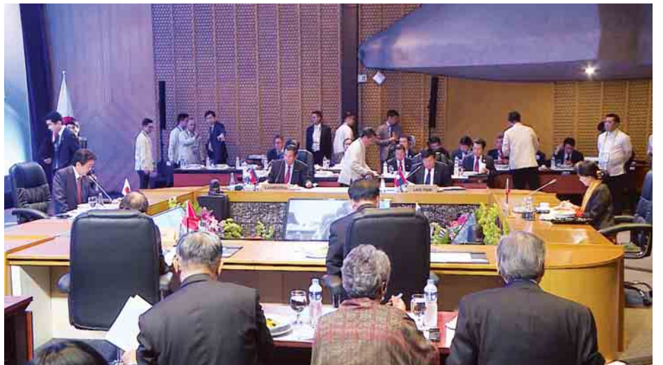
(ဇ)ကြိမ်မြောက် မဲခေါင်-ဂျပန် ထိပ်သီးအစည်းအဝေး နိုင်ငံတော်၏အတိုင်ပင်ခံပုဂ္ဂိုလ် ဒေါ်အောင်ဆန်းစုကြည် တက်ရောက်စဉ်။