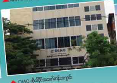
DIAC ကိုယ်ပိုင်အဆောက်အအုံ