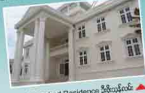
Detached Residence ဦးညိုလင်း