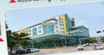
Grand Hantha International Hospital ဆေးရုံကြီးများရှိ MRI စက်ကြီးများနှင့်ပစ္စည်းများကို HITACHI Air Cooled Mini Chiller များကို ပြုပြင်ထိန်းသိမ်းကြသည်။