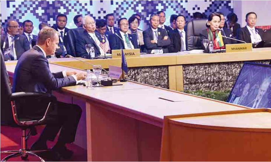
နှစ်(၄၀)ပြည့် အထိမ်းအမှတ် အာဆီယံ-အီးယူ ထိပ်သီးအစည်းအဝေးသို့ နိုင်ငံတော်၏အတိုင်ပင်ခံပုဂ္ဂိုလ် ဒေါ်အောင်ဆန်းစုကြည် တက်ရောက်စဉ်။