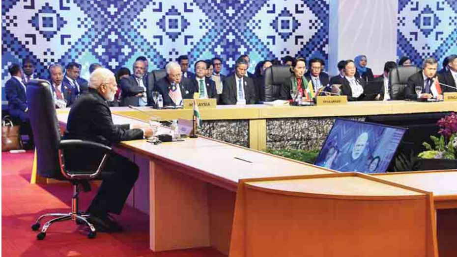
(၁၅)ကြိမ်မြောက် အာဆီယံ-အိန္ဒိယ ထိပ်သီးအစည်းအဝေးသို့ နိုင်ငံတော်၏အတိုင်ပင်ခံပုဂ္ဂိုလ် ဒေါ်အောင်ဆန်းစုကြည် တက်ရောက်စဉ်။