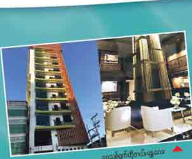
ရွှေသိင်္ခဟိုတယ်မြို့နယ်

MANDALAY BRANCH No ( Pa/28) , Yangon - Mandalay Road, Between Theik Pan St & Phayargyi St Chanmyatharsa Township, Mandalay. 09 257840126 HOTLINE : 09 79 110 7723 oahmandalay@gmail.com