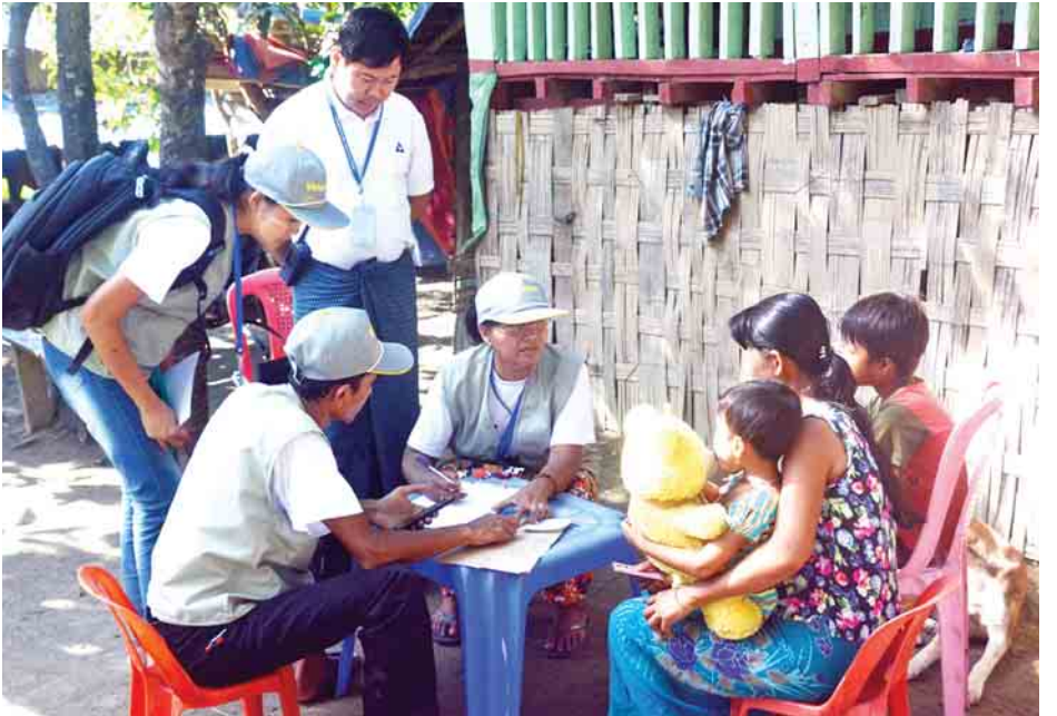
စေတနာ့ဝန်ထမ်းလူငယ်များအဖွဲ့ မောင်တောဒေသခံကျေးရွာ မိသားစုဝင်များအား စာရင်းဇယားကောက်ခံနေစဉ်။

စေတနာ့ဝန်ထမ်းလူငယ်များအဖွဲ့သည် မောင်တောဒေသ၌ နိုဝင်ဘာ ၁၃ ရက်မှ ၂၁ ရက်အထိ ယင်းလုပ်ငန်းစဉ်များကို ရှစ်ရက်လုပ်ဆောင်သွားမည်ဖြစ်