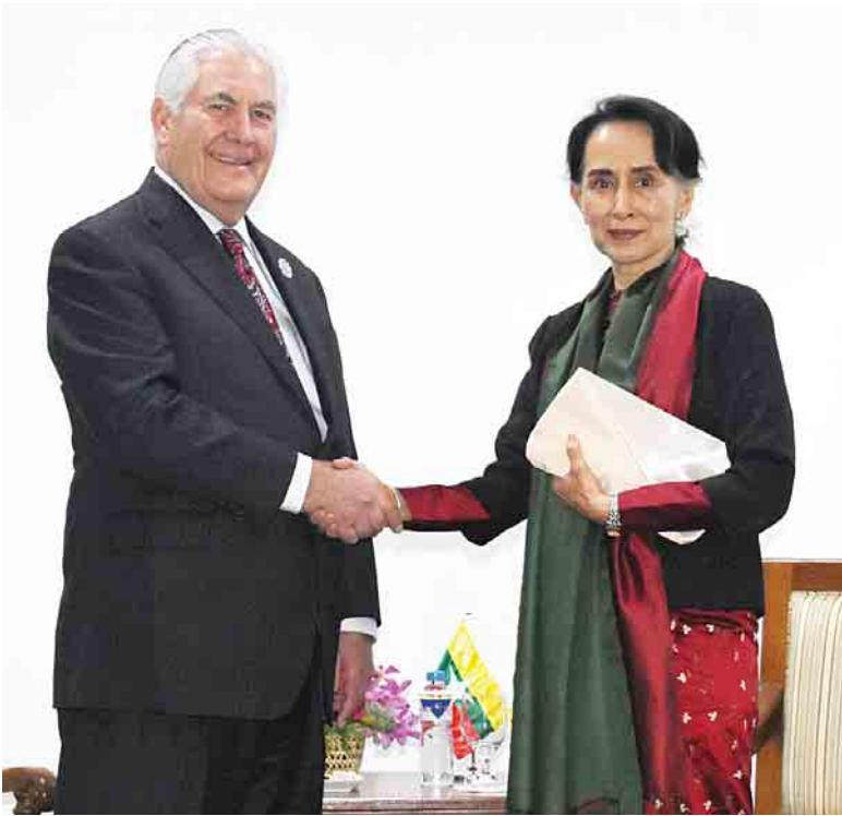
နိုင်ငံတော်၏အတိုင်ပင်ခံပုဂ္ဂိုလ် ဒေါ်အောင်ဆန်းစုကြည်နှင့် အမေရိကန်နိုင်ငံခြားရေးဝန်ကြီး မစ္စတာရစ်ချက် တေလာဆွန်တို့ မနီလာမြို့၌ တွေ့ဆုံစဉ်။