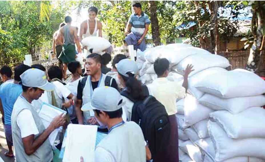
စေတနာ့ဝန်ထမ်းလူငယ်များအဖွဲ့ မောင်တောဒေသသို့ ပြည်သူများအား အခြေခံစားသောက်ကုန်စည်များ ကူညီထောက်ပံ့ပေးစဉ်။