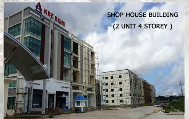
SHOP HOUSE BUILDING (2 UNIT 4 STOREY )

(2 UNIT 3 STOREY) ၂ခန်းတွဲ ၃ထပ်တိုက် အကျယ်အဝန်း - 37'8" X 56' ဧရိယာ - 7564 Sq-ft (HALL TYPE)