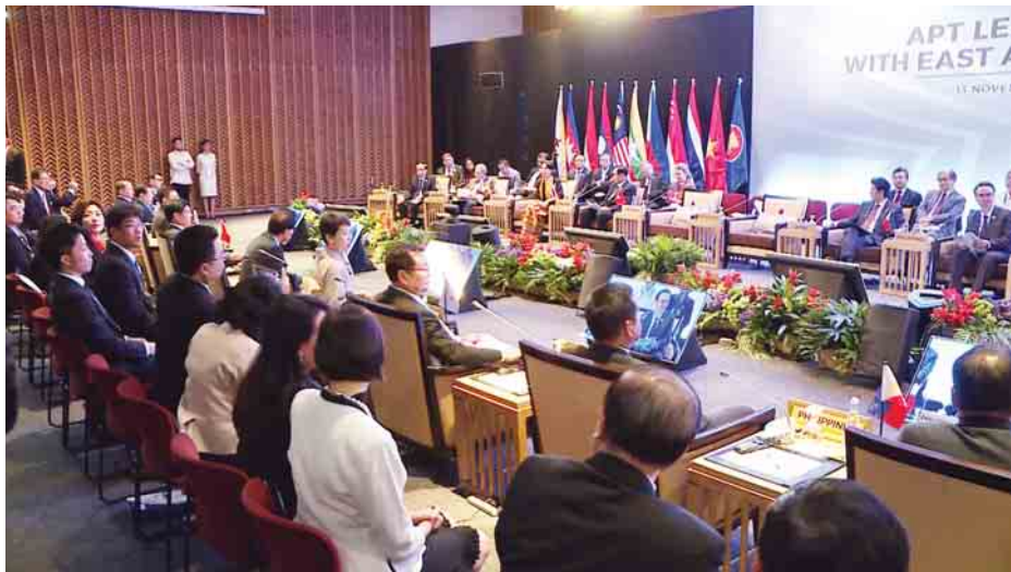
အာဆီယံ+၃ ခေါင်းဆောင်များနှင့် အရှေ့အာရှ စီးပွားရေးကောင်စီ မျက်နှာစုံညီတွေ့ဆုံပွဲ နိုင်ငံတော်၏အတိုင်ပင်ခံပုဂ္ဂိုလ် ဒေါ်အောင်ဆန်းစုကြည် တက်ရောက်စဉ်။