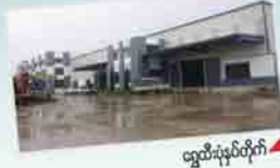
ရွှေသိင်္ခဟိုတယ်မြို့နယ်