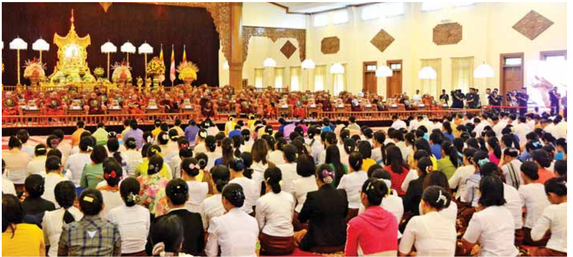
ပြည်ထောင်စုသမ္မတမြန်မာနိုင်ငံတော်အစိုးရ၏ ကထိန်သင်္ကန်း ဆက်ကပ်လှူဒါန်းပွဲ အလှူတော်မင်္ဂလာအခမ်းအနား ကျင်းပစဉ်။