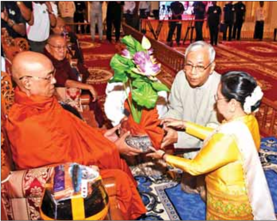
နိုင်ငံတော်သမ္မတ ဦးထင်ကျော်နှင့်ဇနီး ဒေါ်စုစုလွင် ယှဉ်းမနားမြို့ မဟာလယ်တီစံကျောင်းတိုက် ဆရာတော် အဂ္ဂမဟာသဒ္ဓမ္မဇောတိကဓဇ ဂန္ထဝါစက ပဏ္ဍိတ ဘဒ္ဒန္တကုန္ဒာဝုဓအား ကထိန်လျာသင်္ကန်းနှင့် လှူဖွယ်ဝတ္ထုပစ္စည်းများ ဆက်ကပ်လှူဒါန်းစဉ်။

အခမ်းအနားသို့ နိုင်ငံတော်သံဃမဟာနာယကအဖွဲ့ ဥက္ကဋ္ဌ မန္တလေးမြို့ ဗန်းမော်ကျောင်းတိုက် ပဓာနနာယက အဘိဓဇအဂ္ဂမဟာသဒ္ဓမ္မ ဇောတိက ဒေါက်တာဘဒ္ဒန္တကုမာရာဘိဝံသအမျိုးပြုသော ဆရာတော်၊ သံဃာတော်များ ကြွရောက်ချီးမြှင့်တော်မူကြပြီး ဒုတိယ သမ္မတ ဦးမြင့်ဆွေနှင့်ဇနီး ဒေါ်ခင်သက်ဌေး၊ ပြည်သူ့ လွှတ်တော်ဥက္ကဋ္ဌ ဦးဝင်းမြင့်၊ အမျိုးသားလွှတ်တော်ဥက္ကဋ္ဌ မန်းဝင်းခိုင်သန်း၏ဇနီး နန့်ကြင်ကြည်၊ ပြည်ထောင်စု တရားသူကြီးချုပ် ဦးထွန်းထွန်းဦး၊ တပ်မတော်ကာကွယ် ရေး ဦးစီးချုပ် ဗိုလ်ချုပ်မှူးကြီး မင်းအောင်လှိုင်၊ နိုင်ငံ တော်ဖွဲ့စည်းပုံအခြေခံဥပဒေဆိုင်ရာခုံရုံးဥက္ကဋ္ဌ ဦးမျိုးညွန့် နှင့် ဇနီး၊ ပြည်ထောင်စုရွေးကောက်ပွဲကော်မရှင်ဥက္ကဋ္ဌ ဦးလှသိန်းနှင့်ဇနီး၊ ဒုတိယတပ်မတော်ကာကွယ်ရေးဦးစီး ချုပ် ကာကွယ်ရေးဦးစီးချုပ် (ကြည်း) ဒုတိယဗိုလ်ချုပ်မှူးကြီး စိုးဝင်း၊ အမျိုးသားလွှတ်တော်ဒုတိယဥက္ကဋ္ဌ ဦးအေးသာ အောင်နှင့်ဇနီး၊ ပြည်ထောင်စုလွှတ်တော် ဥပဒေရေးရာနှင့် အထူးကိစ္စရပ်များ လေ့လာဆန်းစစ်သုံးသပ်ရေး ကော်မရှင် ဥက္ကဋ္ဌ သူရဦးရွှေမန်းနှင့်ဇနီး၊ ပြည်ထောင်စုဝန်ကြီးများ၊ ပြည်ထောင်စုရွှေ့နေချုပ်၊ ပြည်ထောင်စုစာရင်းစစ်ချုပ်၊ ပြည်ထောင်စု ရာထူးဝန်အဖွဲ့ဥက္ကဋ္ဌနှင့် ၎င်းတို့၏ ဇနီးများ၊ နေပြည်တော်ကောင်စီဥက္ကဋ္ဌ၊ ညှိနှိုင်းကွပ်ကဲရေးမှူး (ကြည်း၊ရေလေ)၊ နေပြည်တော်တိုင်းစစ်ဌာနချုပ်တိုင်းမှူး၊ ဒုတိယဝန်ကြီးများ၊ နေပြည်တော်ကောင်စီဝင်များ၊ ဌာန ဆိုင်ရာအကြီးအကဲများနှင့် တာဝန်ရှိသူများ တက်ရောက် ကြည်ညိုကြသည်။