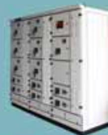
Main Distribution Board