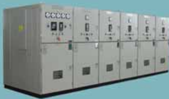
kWh Meter Panel