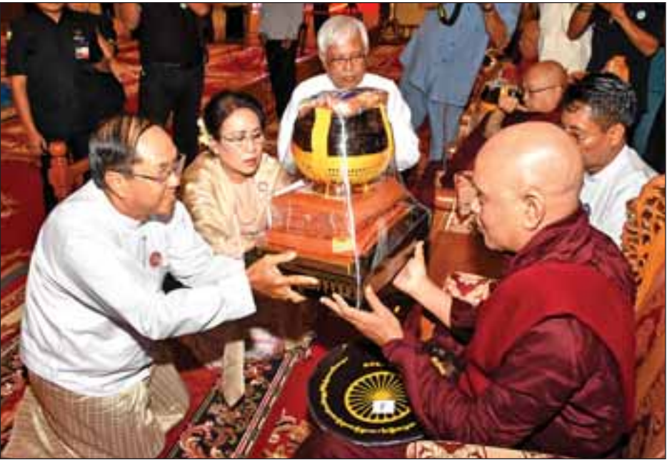
ဒုတိယသမ္မတ ဦးမြင့်ဆွေနှင့်ဇနီးတို့ ဆရာတော်ထံ လှူဖွယ်ပစ္စည်းများ ဆက်ကပ်လှူဒါန်းစဉ်။

ပြည်ထောင်စုဝန်ကြီးများ၊ ပြည်ထောင်စုရွှေ့နေချုပ်၊ ပြည်ထောင်စုစာရင်းစစ်ချုပ်၊ ပြည်ထောင်စုရာထူးဝန် အဖွဲ့ဥက္ကဋ္ဌ၊ နေပြည်တော်ကောင်စီဥက္ကဋ္ဌ၊ ညှိနှိုင်းကွပ်ကဲ ရေးမှူး(ကြည်း၊ရေလေ)နှင့် နေပြည်တော်တိုင်းစစ်ဌာနချုပ် တိုင်းမှူးတို့က လှူဖွယ်ဝတ္ထုပစ္စည်းများကို ဆရာတော်၊ သံဃာတော်များထံ ဆက်ကပ်လှူဒါန်းကြသည်။