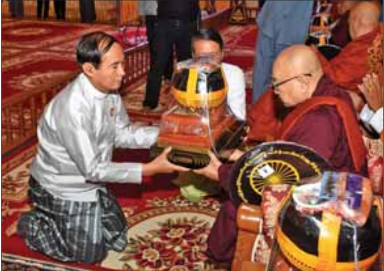
ပြည်သူ့လွှတ်တော်ဥက္ကဋ္ဌ ဦးဝင်းမြင့် ဆရာတော်ထံ လှူဖွယ်ပစ္စည်းများ ဆက်ကပ်လှူဒါန်းစဉ်။

ယနေ့ကျင်းပသည့် ပြည်ထောင်စုသမ္မတမြန်မာနိုင်ငံ တော်အစိုးရ၏ ကထိန်သင်္ကန်း ဆက်ကပ်လှူဒါန်းပွဲတွင် ငွေကျပ် ၃၃၅၄၀၀၀ တန်ဖိုးရှိ လှူဖွယ်ပစ္စည်းများနှင့် နဝကမ္မအလှူငွေကျပ် ၃၆၅၁၉၉၀၀၀တို့ကို လှူဒါန်းခဲ့ ကြောင်း သိရသည်။ (သတင်းစဉ်)