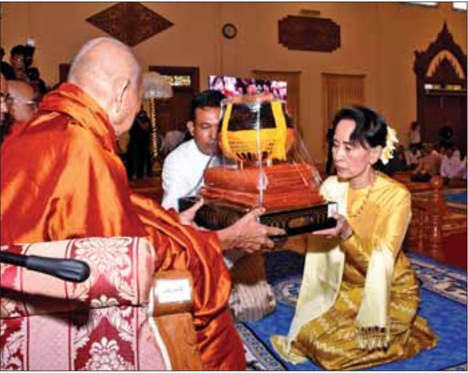
နိုင်ငံတော်၏အတိုင်ပင်ခံပုဂ္ဂိုလ် ဒေါ်အောင်ဆန်းစုကြည် နိုင်ငံတော် သံဃမဟာနာယကအဖွဲ့ဥက္ကဋ္ဌ မန္တလေးမြို့ ဗန်းမော်ကျောင်းတိုက် ပဓာနနာယက အဘိဓဇ မဟာရဋ္ဌဂုရု အဘိဓဇအဂ္ဂမဟာသဒ္ဓမ္မဇောတိက ဒေါက်တာ ဘဒ္ဒန္တကုမာရာဘိဝံသထံ လှူဖွယ်ဝတ္ထုပစ္စည်းများ ဆက်ကပ်လှူဒါန်းစဉ်။

ထို့နောက် နိုင်ငံတော်ဖွဲ့စည်းပုံအခြေခံဥပဒေဆိုင်ရာ ခုံရုံးဥက္ကဋ္ဌ ဦးမျိုးညွန့်နှင့်ဇနီး၊ ပြည်ထောင်စုရွေးကောက်ပွဲ ကော်မရှင်ဥက္ကဋ္ဌ ဦးလှသိန်းနှင့်ဇနီး၊ ဒုတိယတပ်မတော် ကာကွယ်ရေးဦးစီးချုပ် ကာကွယ်ရေးဦးစီးချုပ်(ကြည်း) ဒုတိယဗိုလ်ချုပ်မှူးကြီးစိုးဝင်း၊ အမျိုးသားလွှတ်တော် ဒုတိယ ဥက္ကဋ္ဌ ဦးအေးသာအောင်နှင့်ဇနီး၊ ပြည်ထောင်စုလွှတ် တော် ဥပဒေရေးရာနှင့် အထူးကိစ္စရပ်များ လေ့လာဆန်းစစ် သုံးသပ်ရေးကော်မရှင်ဥက္ကဋ္ဌ သူရဦးရွှေမန်းနှင့်ဇနီး၊