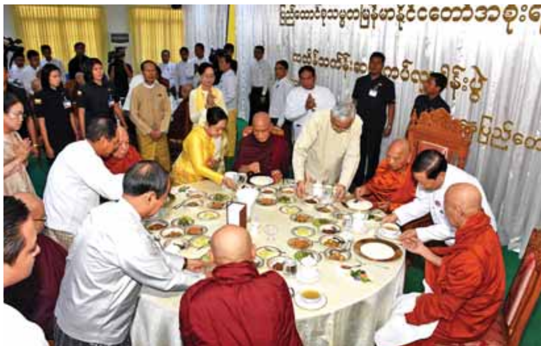
နိုင်ငံတော် သံဃမဟာနာယကအဖွဲ့ဥက္ကဋ္ဌ ဗန်းမော်ဆရာတော် အမှူးပြုသော ဆရာတော်၊ သံဃာတော်များအား နိုင်ငံတော်သမ္မတ ဦးထင်ကျော်နှင့် ဇနီးဒေါ်စုစုလွင်တို့က နေ့ဆွမ်းဆက်ကပ်လှူဒါန်းစဉ်။ (အပေါ်ပုံ)နှင့် နိုင်ငံတော်၏အတိုင်ပင်ခံပုဂ္ဂိုလ် ဒေါ်အောင်ဆန်းစုကြည် သာသနာ့မဟာဗိမာန်တော်အတွင်းရှိ ဗုဒ္ဓရုပ်ပွားတော်မြတ်အား မြသပိတ်ဆွမ်းတော် ဆက်ကပ်စဉ်။ (ယာပုံ)