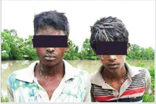
မောင်တောမြို့နယ် ကျီးကျွန်းရဲကင်းစခန်းရှေ့ရှိ အလယ်ချောင်းအတွင်း ဘင်္ဂလားဒေ့ရှ်နိုင်ငံသို့ ဖြတ်ကူးမည့် လောင်းလှေနှစ်စင်းနှင့် ဖမ်းဆီးရမိသူများ၏ မှတ်တမ်းဓာတ်ပုံ။