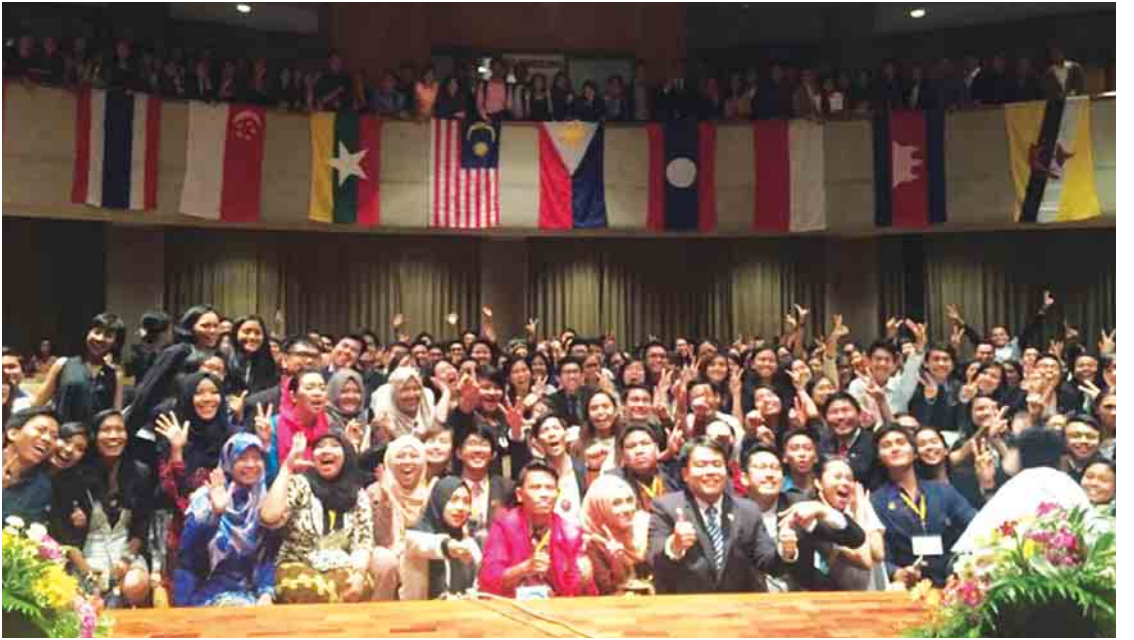
အာဆီယံပြည်သူများအကြားထိတွေ့ဆက်ဆံမှုများပိုမိုတိုးမြှင့်ဆောင်ရွက်ခြင်းဖြင့် အာဆီယံပေါင်းစည်းဆက်သွယ်ရေးကို အထောက်အကူပြုစေမည်ဖြစ်ပါသည်။

ဒါကြောင့် ဒေသတွင်းမှာ ရှိပြီးသားဖြစ်တဲ့ အခြေခံအဆောက်အအုံများကို အဆင့်မြှင့် တင်သွားဖို့၊ အခြေခံ အဆောက်အအုံအသစ် တွေကို တိုးချဲ့တည်ဆောက်သွားဖို့ လိုအပ်လာ