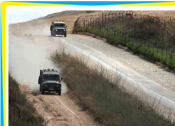
အစွရေး-လက်ဘနွန် နယ်စပ်ဒေသကို တွေ့ရစဉ်။