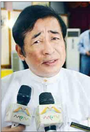
ဒေါက်တာသာဉာဏ်

ကျွန်တော်တို့အနေနဲ့ ဩဂုတ် ၂၅ ရက်က ဖြစ်ခဲ့တဲ့အဖြစ်အပျက်တွေ