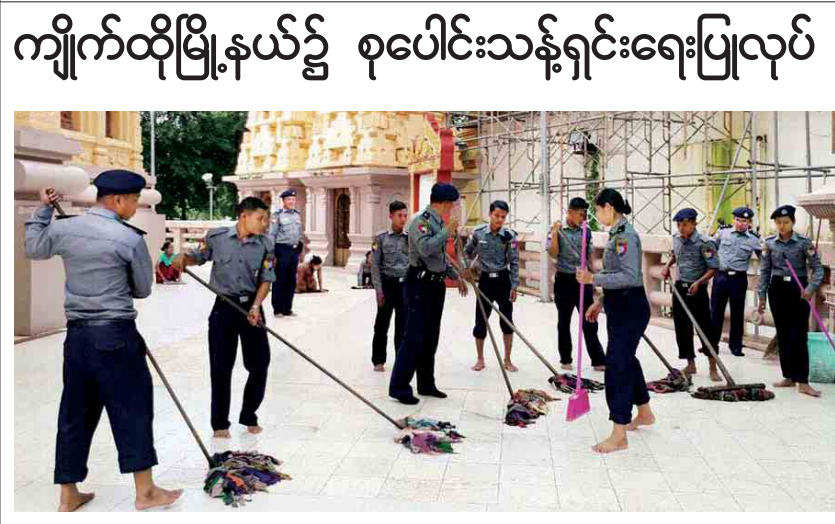
ကျိုက်ထိုမြို့နယ်၌ စုပေါင်းသန့်ရှင်းရေးပြုလုပ်