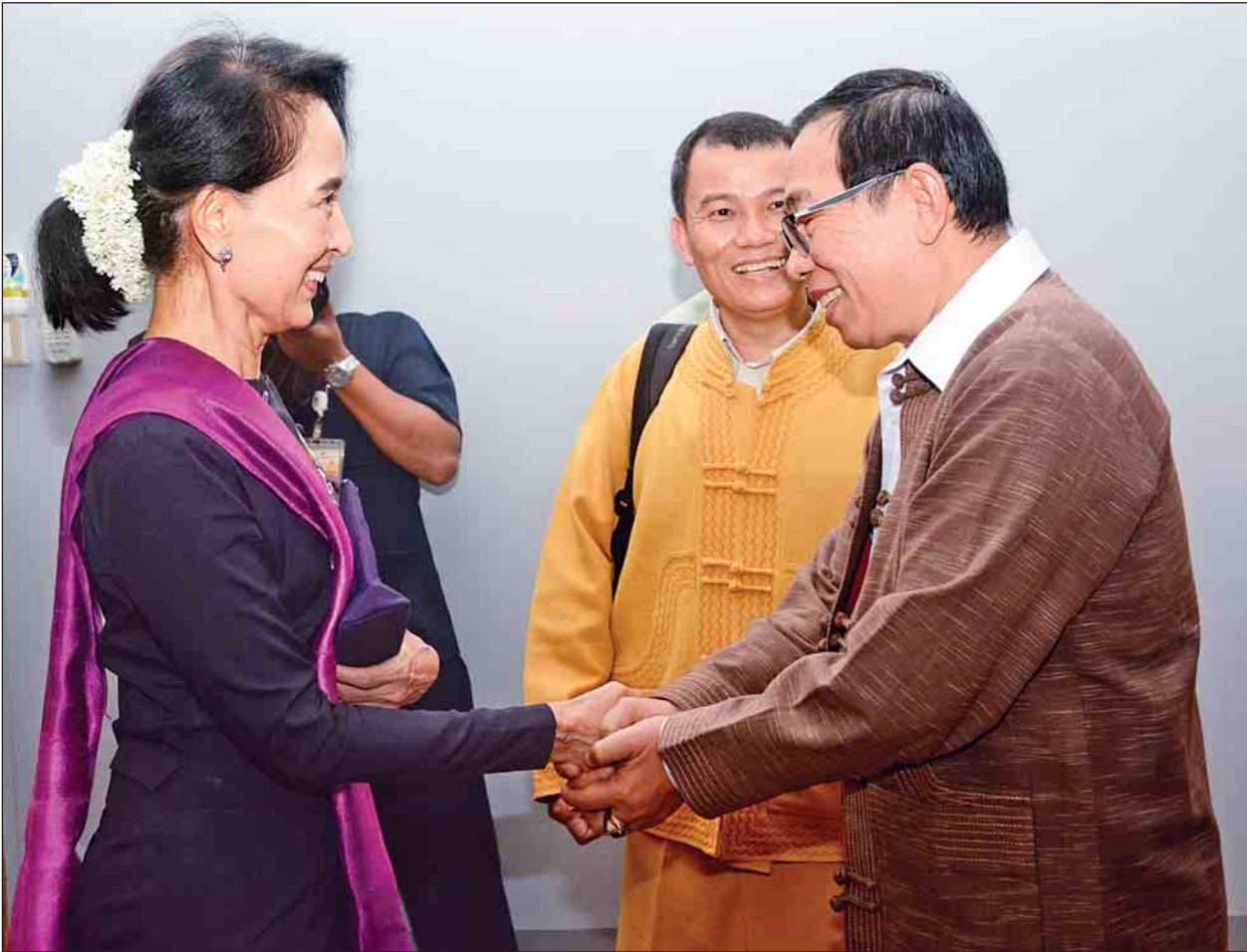
အမျိုးသားပြန်လည်သင့်မြတ်ရေးနှင့် ငြိမ်းချမ်းရေးဗဟိုဌာန ဥက္ကဋ္ဌ နိုင်ငံတော်၏အတိုင်ပင်ခံပုဂ္ဂိုလ် ဒေါ်အောင်ဆန်းစုကြည်နှင့် ရှမ်းပြည်ပြန်လည်ထူထောင်ရေးကောင်စီ/ ရှမ်းပြည်တပ်မတော် (RCSS/SSA)ဥက္ကဋ္ဌ ဦးယွက်စစ်တို့ ရင်းရင်းနှီးနှီးဆက်စဉ်။