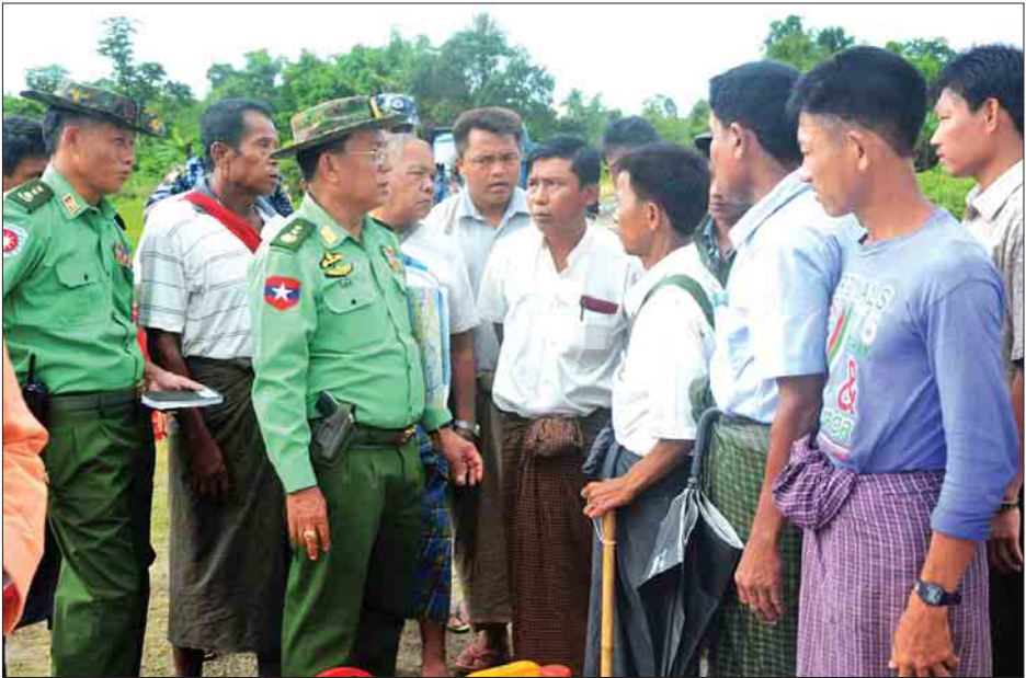
ပြည်ထောင်စုဝန်ကြီး ဒုတိယဗိုလ်ချုပ်ကြီးရဲအောင် ဒေသခံပြည်သူများအား ရင်းရင်းနှီးနှီးတွေ့ဆုံစဉ်။