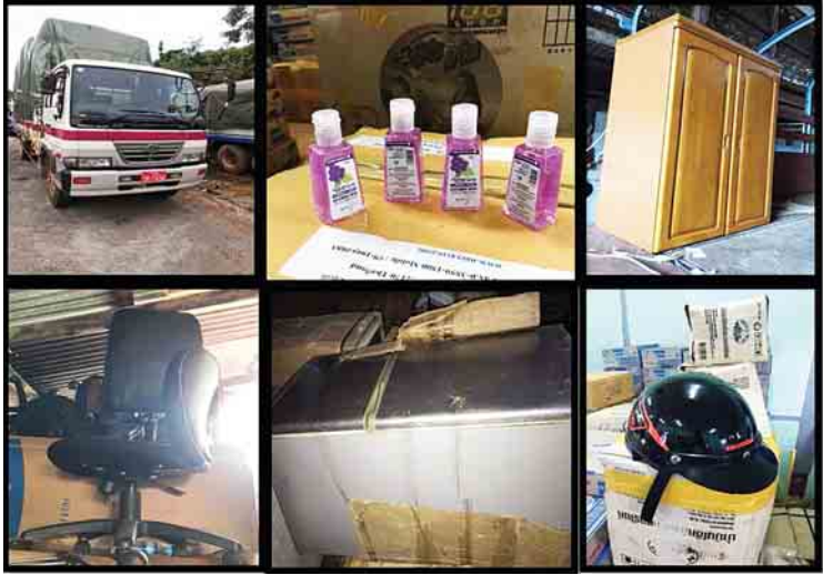
တရားဝင် စာရွက်စာတမ်း အထောက်အထား တစ်စုံတစ်ရာ တင်ပြနိုင်ခြင်းမရှိသည့် လူသုံးကုန်ပစ္စည်းများနှင့် ပစ္စည်းသယ်ဆောင်သည့်ယာဉ်။

တရားမဝင် လူသုံးကုန်ပစ္စည်းများ သယ်ဆောင်လာမှုကို မရမ်းချောင်အမြဲတမ်းစစ်ဆေးရေးစခန်း ပူးပေါင်းစစ်ဆေးရေးအဖွဲ့များက စက်တင်ဘာ ၁၀ ရက်တွင် သိမ်းဆည်းရမိခဲ့ကြောင်း အကောက်ခွန်ဦးစီးဌာနမှ သိရသည်။ မရမ်းချောင်စစ်ဆေးရေး စခန်းကို