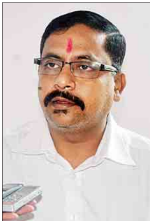
ဦးရာဂူးနေမြင့်

အားလုံးအပေါ်မှာ စာနာစိတ်ထားပြီးတော့ ဘယ်လိုပုံပိုးကူညီဆောင်ရွက် သွားမလဲ။ နိုင်ငံတကာမှာဖြစ်ပေါ်နေတဲ့ ကောလာဟလသတင်းတွေကို အဖြစ်မှန်တွေနဲ့ ဘယ်လိုဖြေရှင်းပေးနိုင်မလဲ။ ဒီမှာ ဒုက္ခရောက်နေတဲ့ ပြည်သူတွေအားလုံးကို အစွဲမထားဘဲနဲ့ ဘယ်လိုအကူအညီပေးနိုင်မလဲ။ အမြန်ဆုံး သူတို့ရဲ့မူလနေရာတွေကိုရောက်အောင် ဘယ်လိုလုပ်ပေးနိုင်မလဲဆိုတဲ့ ကိစ္စရပ်တွေကို သိရအောင်လာရောက်တာပါ။ ကျွန်တော်တို့လာတာဟာ အကူအညီပေးဖို့ သက်သက်သာဖြစ်ပါတယ်။ ကျန်တာဘာမှ မပါဘူး။ ရသေ့တောင်၊ မောင်တောနဲ့ ဘူးသီးတောင်မြို့တွေကိုသွားပြီး ဒေသခံ ဘာသာပေါင်းစုံက ပြည်သူတွေနဲ့ တွေ့ဆုံဆွေးနွေးခဲ့တယ်။ မောင်တောမှာလည်း လူတွေခံစားနေရတာတွေကို တွေ့ရတယ်။ ဒီလိုခံစားနေရတာက အကြမ်းဖက်မှု ကြောင့်ပါ။ ဒီအကြမ်းဖက်မှုတွေကို ကျွန်တော်တို့ လက်မခံပါဘူး။