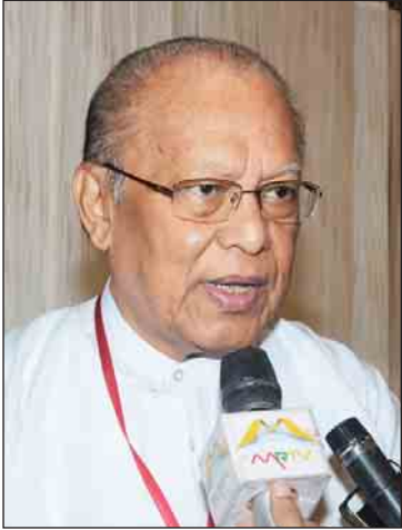
ဦးဝင်းမြ