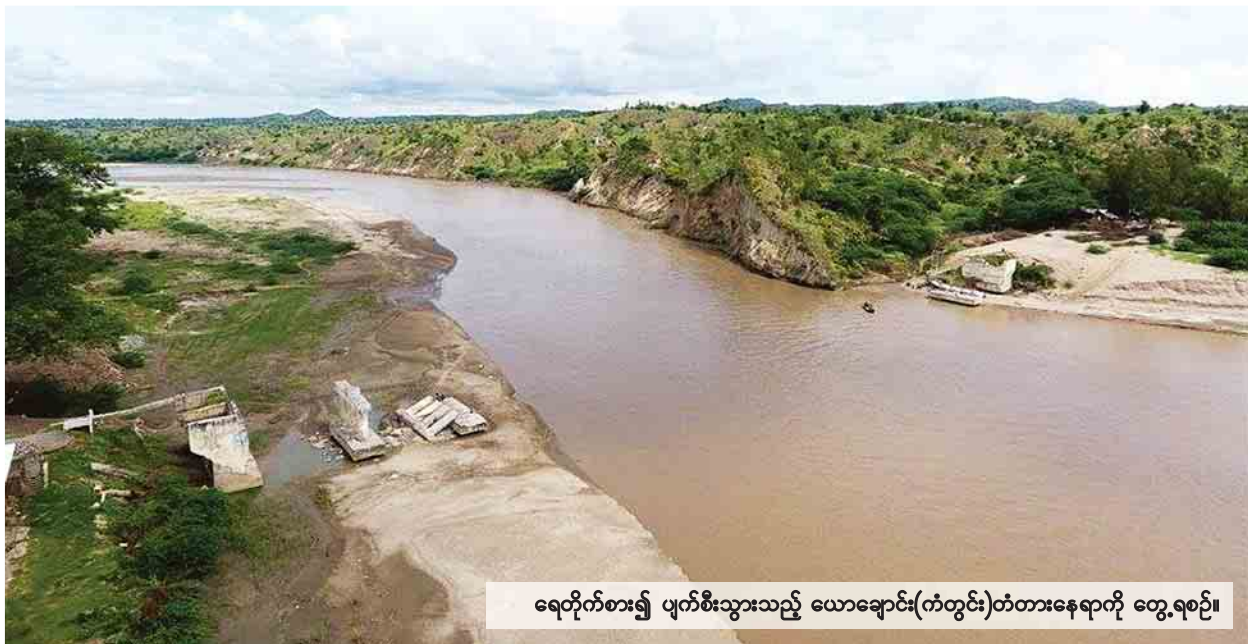
ရေတိုက်စား၍ ပျက်စီးသွားသည့် ယောချောင်း(ကံတွင်း)တံတားနေရာကို တွေ့ရစဉ်။

“အဓိကက ဧရာဝတီလင်းပိုင်ထိန်းသိမ်းရေးဧရိယာတိုးချဲ့ဖို့ကို လိုအပ်တဲ့ အချက်အလက်တွေနဲ့ အသိပညာပေးမှုတွေ ဆောင်ရွက်သွားမယ်။ ပြီးခဲ့တဲ့အခေါက်ကလည်း အဲဒီဒေသတွေမှာ သုတေသနစစ်တမ်းတွေ လုပ်ပါတယ်။ စာမျက်နှာ ၁၁ ကော်လံ ၃ သို့ ♦