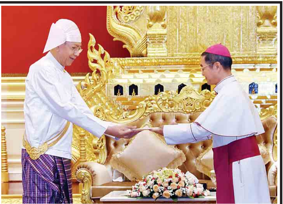
နိုင်ငံတော်သမ္မတဦးထင်ကျော်ထံ ဂျာမနီနိုင်ငံသံအမတ်ကြီး မစ္စ ဒေါ်ရိုလ်သေရာနက်ထ်စခဲ-ဗန်ဆဲလ်(အပေါ်ဝဲပုံ)နှင့် ဗာတီကန်မြို့ပြနိုင်ငံသံအမတ်ကြီး မစ္စတာပေါလ်ချန်အင်-နမ်(အပေါ်ယာပုံ)တို့ သံအမတ်ခန့်အပ်လွှာများ ပေးအပ်စဉ်။ (သတင်း-ရှေ့ဖုံး)