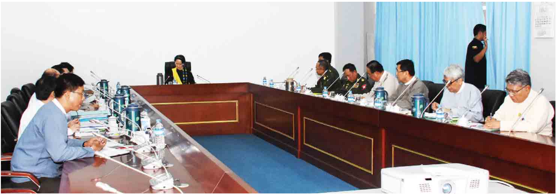
ရခိုင်ပြည်နယ်ဆိုင်ရာညှိနှိုင်းအစည်းအဝေးတွင် နိုင်ငံတော်၏အတိုင်ပင်ခံပုဂ္ဂိုလ် ဒေါ်အောင်ဆန်းစုကြည် အမှာစကားပြောကြားစဉ်။ (သတင်းစဉ်)

ဆက်လက်၍ ပြည်ထဲရေးဝန်ကြီးဌာန ပြည်ထောင်စုဝန်ကြီး ဒုတိယဗိုလ်ချုပ်ကြီးကျော်ဆွေက လုံခြုံရေးအခြေအနေနှင့်စပ်လျဉ်း၍ လည်းကောင်း၊ ဆောက်လုပ်ရေးဝန်ကြီးဌာန ပြည်ထောင်စုဝန်ကြီး ဦးဝင်းခိုင်က ပြန်လည်ထူထောင်ရေးနှင့် တည်ဆောက်ရေးဆောင်ရွက်နေမှု အခြေအနေတို့ကိုလည်းကောင်း ရှင်းလင်းတင်ပြကြသည်။ ထို့နောက် အစည်းအဝေးသို့ တက်ရောက်လာကြသည့် ပြည်ထောင်စုဝန်ကြီးများနှင့် ဌာနဆိုင်ရာတာဝန်ရှိသူများ