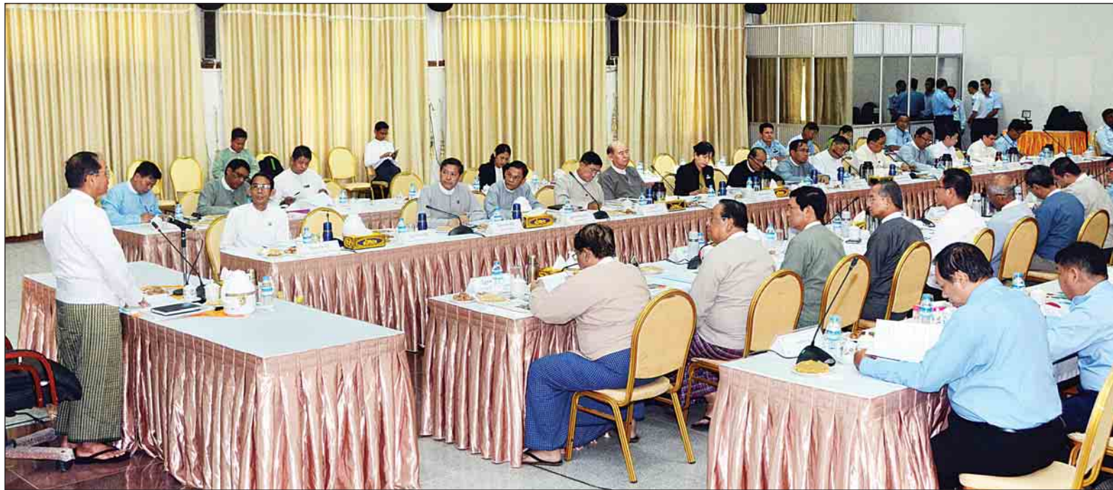
ပုဂ္ဂလိကကဏ္ဍဖွံ့ဖြိုးတိုးတက်ရေးကော်မတီဥက္ကဋ္ဌ ဒုတိယသမ္မတ ဦးမြင့်ဆွေ အမှာစကားပြောကြားစဉ်။

နေပြည်တော် အောက်တိုဘာ ၁၁ ပုဂ္ဂလိကကဏ္ဍဖွံ့ဖြိုးတိုးတက်ရေး လုပ်ငန်းသည် နိုင်ငံတော်၏ စီးပွားရေးကို ဖွံ့ဖြိုးတိုးတက်စေရုံ သာမက ပြည်သူများ၏ လူမှုစီးပွား ဖွံ့ဖြိုးတိုးတက်ရေးအတွက်ပါ အဓိက ကျသည့် မောင်းနှင်အားဖြစ်ကြောင်း ပုဂ္ဂလိကကဏ္ဍ ဖွံ့ဖြိုးတိုးတက်ရေး ကော်မတီဥက္ကဋ္ဌ ဒုတိယသမ္မတ ဦးမြင့်ဆွေက ပြောကြားသည်။ ဒုတိယသမ္မတက “နိုင်ငံ့စီးပွားရေး လုပ်ငန်း ၉၀ ရာခိုင်နှုန်းကျော်ဟာ ပုဂ္ဂလိကကဏ္ဍဖြစ်လို့ လုပ်ငန်းစဉ်တွေ ကူညီဖြေရှင်းဆောင်ရွက်ပေးခြင်း ဖြင့် စီးပွားရေးလုပ်ငန်းတွေ တိုးတက် ကောင်းမွန်လာမှာ ဖြစ်ပါတယ်။ ပုဂ္ဂလိကကဏ္ဍကို ဝန်ဆောင်မှုတွေပေး ရာမှာ ပြည်ထောင်စုဝန်ကြီးဌာနတွေ၊ အဖွဲ့အစည်းတွေအနေနဲ့ အောင်မြင် နေတဲ့နိုင်ငံတွေကို လေ့လာပြီး ပြုပြင် ပြောင်းလဲသင့်တဲ့ ကိစ္စရပ်တွေကို စာမျက်နှာ ၉ ကော်လံ ၁ သို့ *