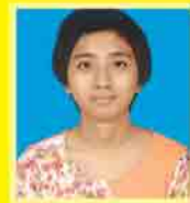
မသူသူဇော် ဆက်ရ - ၆၃၂