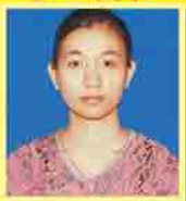
မသင်းမြတ်နိုး ဆက်ရ - ၂၉၂