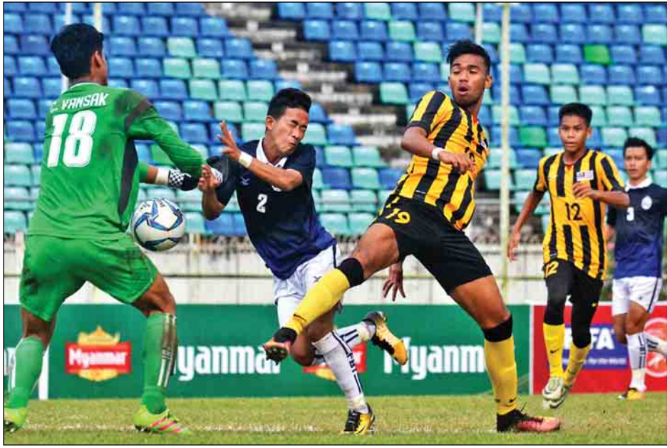
မလေးရှားအသင်းနှင့် ကမ္ဘောဒီးယားအသင်း ယှဉ်ပြိုင်နေစဉ်။