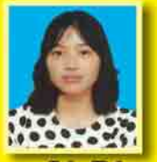
ပပေမြတ်ကျွတ် ဆက်ရ - ၃၆ (အသံခေါင်း)