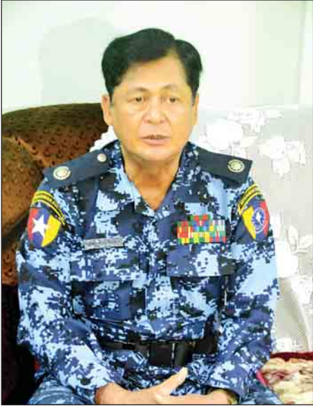
ရဲမှူးချုပ်သူရစန်းလွင် [အမှတ်(၁)နယ်ခြားစောင့်ရဲကွပ်ကဲမှု အဖွဲ့မှူး]

ဖြေ။ ။ဒါနဲ့ပတ်သက်လို့ ရှုပ်ထွေးမှုတွေတော့ ရှိပါ