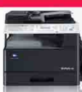
Multifunction A3 Copier bizhub206 Duplex Print | Copy | Scan