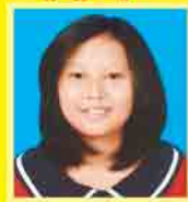
မရွှန်းလဲ့လဲ့လွင် ဆက်ရ - ၇၄၂