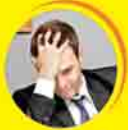
စိတ်ဖိစီးမှုများခြင်း

ဖြန်ဟိုင်ငံ၏ ပထမဦးဆုံး ကိုရီးယား ဂျင်ဆင်းအားဆေး... Feel the Difference with