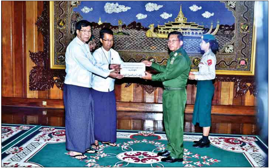
ယနေ့ ကျင်းပသည့် အလှူငွေပေးအပ်ပွဲအခမ်းအနား တွင် စေတနာရှင် ပြည်သူများ၏ လှူဒါန်းမှု စုစုပေါင်းမှာ ငွေကျပ် သိန်းပေါင်း ၄၃၆၀၃ သိန်းဖြစ်ကြောင်း သတင်း ရရှိသည်။ (သတင်းစဉ်)

ယင်းနောက် Mytel စတုတ္ထမြောက် ဆက်သွယ်ရေး လုပ်ငန်း Co.,Ltd.က ငွေကျပ် သိန်း ၁၀၀၊ မြန်မာ့စီးပွားရေး ဦးပိုင်လီမိတက်၏ မိတ်ဖက်ကုမ္ပဏီ ၁၈ ခုက ငွေကျပ် ၆၃ သိန်း၊ စစ်တက္ကသိုလ်အမှတ်စဉ်(၂၀) ကျောင်းဆင်းအရာရှိ များနှင့် မိသားစုများက ငွေကျပ် သိန်း ၅၀၊ နူးလှေမေတ္တာရှင် များဖောင်ဒေးရှင်းက ငွေကျပ် သိန်း ၅၀၊ မြဝတီဘဏ် လီမိတက်က ငွေကျပ် သိန်း ၅၀၊ ကြေးနီသတ္တုတွင်း လုပ်ငန်း (မုံရွာ)က ငွေကျပ် သိန်း ၅၀ နှင့် အလှူရှင်များက အလှူငွေများ ပေးအပ်လှူဒါန်းကြသည်။