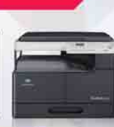
Multifunction A3 Copier bizhub165e Print | Copy | Scan

Your personal sales consultant Su Myat Aye enterprise.teams3@gandamar-mm.com Direct Tel: 09 253 547 980 09 253 547 981