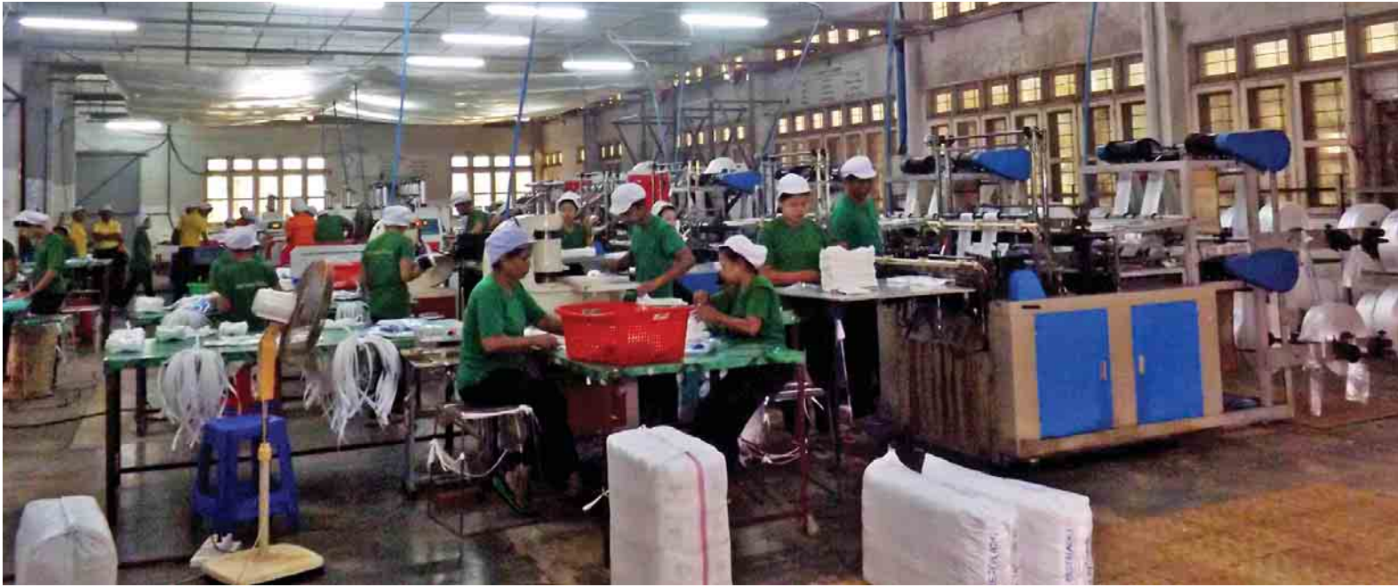
ပလတ်စတစ်အိတ်များထုတ်လုပ်လျက်ရှိသော မှော်ဘီမြို့နယ် အမှတ်(၁) ပလတ်စတစ်စက်ရုံ (ရန်ကုန်)လုပ်ငန်းခွင်အား တွေ့ရစဉ်။

ရန်ကုန် စက်တင်ဘာ ၁၀ စက်မှုဝန်ကြီးဌာန မြန်မာ့ဆေးဝါး လုပ်ငန်းလက်အောက်ရှိ မှော်ဘီမြို့နယ် အမှတ်(၁)ပလတ်စတစ်စက်ရုံ (ရန်ကုန်) စက်ရုံခွဲမှ ထုတ်လုပ်လျက်ရှိသော ပလတ်စတစ်အိတ်များ (shopping bags) အား ပြည်တွင်း ဖြန့်ဖြူးမှုသာမက နိုင်ငံတကာ ဈေးကွက်သို့ ထိုးဖောက်ရန် ကြိုးပမ်း ဆောင်ရွက်လျက်ရှိရာ ဂျပန်နိုင်ငံသို့ တစ်လလျှင် တန်ချိန် ၆၀ နီးပါး တင်ပို့နေပြီဖြစ်ကြောင်း အဆိုပါစက်ရုံမှ သိရသည်။ “ဈေးဝယ်ရင်သုံးတဲ့ ပလတ်စတစ် အိတ်တွေပေါ့။ ပြည်တွင်းထက် နိုင်ငံတကာကိုတင်ပို့နိုင်ဖို့ ကြိုးစား ထုတ်လုပ်နေပါတယ်။ ဂျပန်ကိုတော့ ဈေးကွက်စဖောက်နေပါပြီ။ တစ်လကို တန်ချိန် ၆၀ လောက် ကွန်တိန်နာကား စာမျက်နှာ ၃ ကော်လံ ၅ သို့ ❖