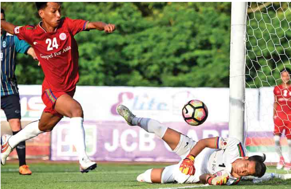
ရန်ကုန်အသင်းနှင့် GFA အသင်းတို့ ယှဉ်ပြိုင်နေစဉ်။