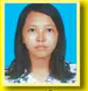
မအေးချမ်းစံ ဆက်ရ - ၁၃၆ (မအသံခေါင်း)