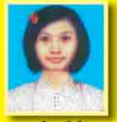
မဝင်းနန္ဒာပိုင် ဆက်ရ - ၆၃၁ (မအသံခေါင်း)