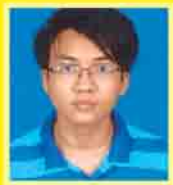
မောင်ရဲစွမ်းရည် ဆက်ရ - ၇၁၁