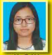
မသီမိတည်နိုင် ဆက်ရ - ၁၈၇ (အသံခေါင်း)