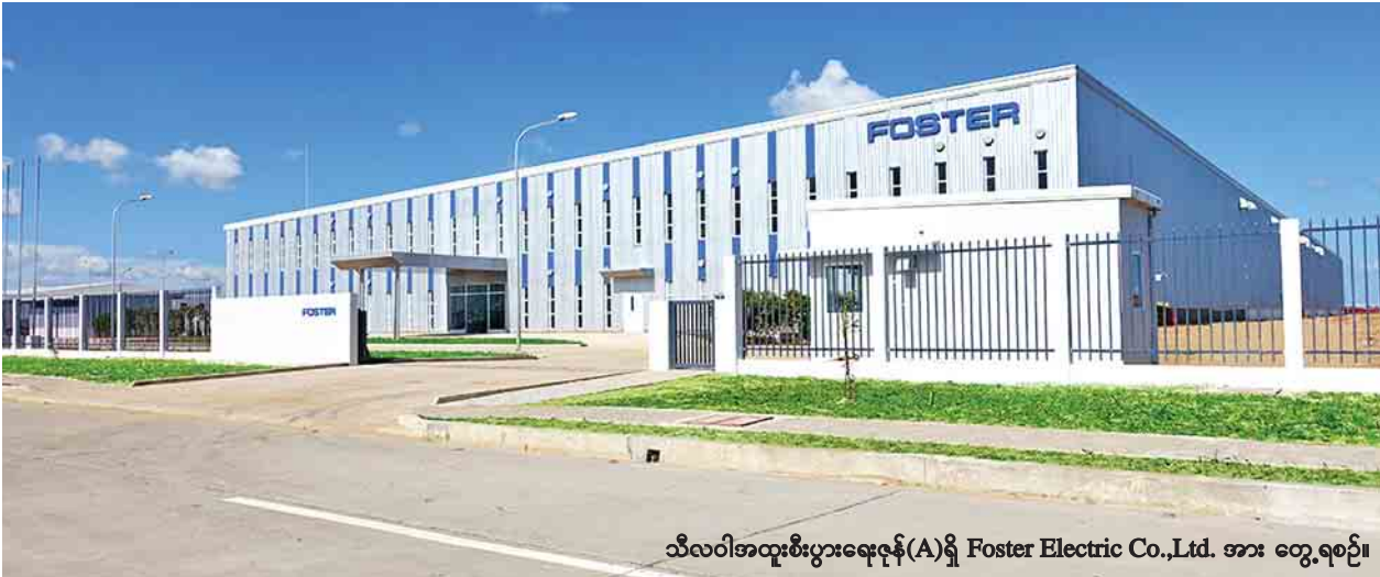
သီလဝါအထူးစီးပွားရေးဇုန်(A)ရှိ Foster Electric Co.,Ltd. အား တွေ့ရစဉ်။

အမျိုးသားလွှတ်တော် ဒုတိယဥက္ကဋ္ဌ ဦးအေးသာအောင် နှင့်အဖွဲ့ ချက်သမ္မတနိုင်ငံမှ ပြန်လည်ရောက်ရှိ စာမျက်နှာ - ၃