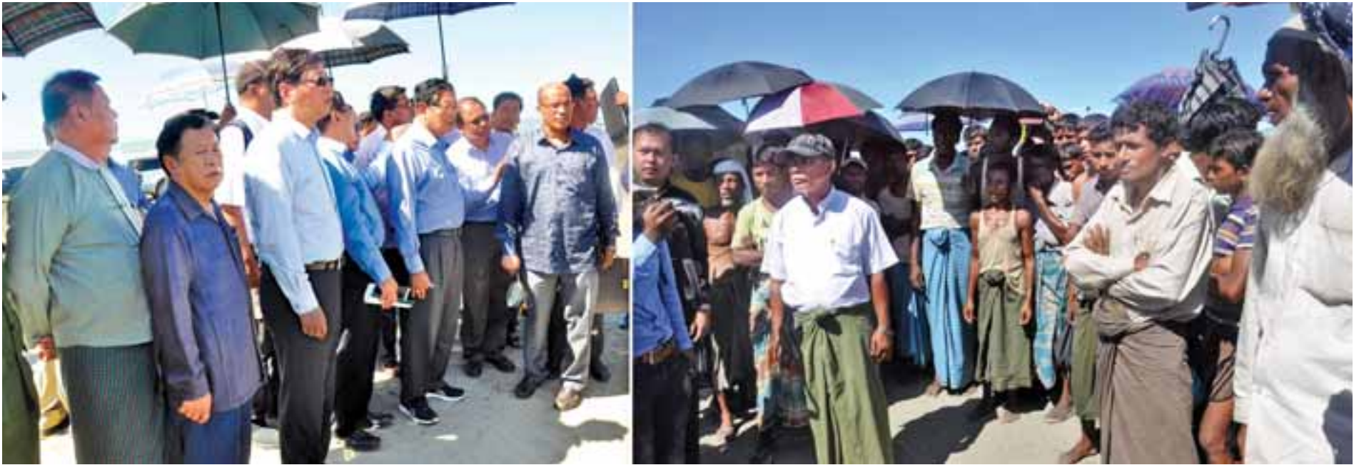
ပြည်ထောင်စုဝန်ကြီးများ၊ သံအမတ်ကြီးများနှင့် သံတမန်များ မောင်တောမြို့နယ် လေယာဉ်ပျံကွင်းကျေးရွာမှ အစ္စလာမ်ဘာသာဝင်များနှင့် ရင်းရင်းနှီးနှီးတွေ့ဆုံစဉ်။

ရေးဖုံးမှ ပြည်တွင်း၊ ပြည်ပ သတင်းမီဒီယာများနှင့်အတူ ယနေ့နံနက်ပိုင်းတွင် မြန်မာ အမျိုးသားလေကြောင်းလိုင်းဖြင့် စစ်တွေမြို့သို့ ရောက်ရှိလာရာ ရခိုင်ပြည်နယ် ဝန်ကြီးချုပ် ဦးညီပုနှင့် တာဝန်ရှိသူများက ကြိုဆိုကြသည်။