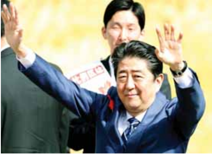
တွင် ဝန်ကြီးချုပ်ရာထူး၌ စတင်ထမ်းဆောင်ခဲ့ချိန်နောက်ပိုင်း ယခင်ရွေးကောက်ပွဲများ၏ အကြိုကာလတွင် ဖူကူရှီးမားပြည်နယ်သို့ သွားရောက်လေ့ရှိသည့်အတိုင်းပင် ယင်းပြည်နယ်သို့ သွားရောက်ခဲ့ပြီး ၂၀၁၁ ခုနှစ် မြေငလျင်နှင့် ဆူနာမီရေလှိုင်းဘေးကြောင့် ဖြစ်ပေါ်ခဲ့ရသော ဆူကူရှီးမားမတော်တဆမှု၏ အကျိုးဆက်ကို တွေ့ကြုံခံစားခဲ့ကြရသည့် မဲဆန္ဒရှင် ပြည်သူများနှင့် တွေ့ဆုံခဲ့သည်။ ကျိုဒို။

ရွယ်အိုဦးရေ တိုးလာနေသော ဂျပန်လူ့အဖွဲ့အစည်းအတွင်း မျိုးဆက်သစ်လူငယ်များအပေါ် ဝန်ထုပ်ဝန်ပိုး ဖိစီးမှုလျှော့ချနိုင်စေရေးအတွက် လူမှုဖူလုံရေးဆိုင်ရာ ပြုပြင်ပြောင်းလဲရေး အစီအစဉ်ကို အကောင်အထည်ဖော်သွားမည်ဖြစ်ကြောင်း ဝန်ကြီးချုပ် အာဘေးက ပြောကြားသည်။ (ယာပုံ) မိမိတို့သည် ကြွေးကြော်သံများကို ဖမ်းဆီးနေလိုသည်မဟုတ်။ တိကျခိုင်မာသော မူဝါဒများအတိုင်း တွေ့ဝေမှုမရှိ ဆောင်ရွက်သွားမည်ဖြစ်ကြောင်း၊ ယင်းမှာ အနာဂတ်ဘဝအတွက် ရည်မြော်ဆောင်ရွက်ခြင်းဖြစ်ကြောင်း ၎င်းက ဆက်လက်ပြောကြားသည်။ အာဘေးသည် ၂၀၁၂ ခုနှစ် နှောင်းပိုင်း