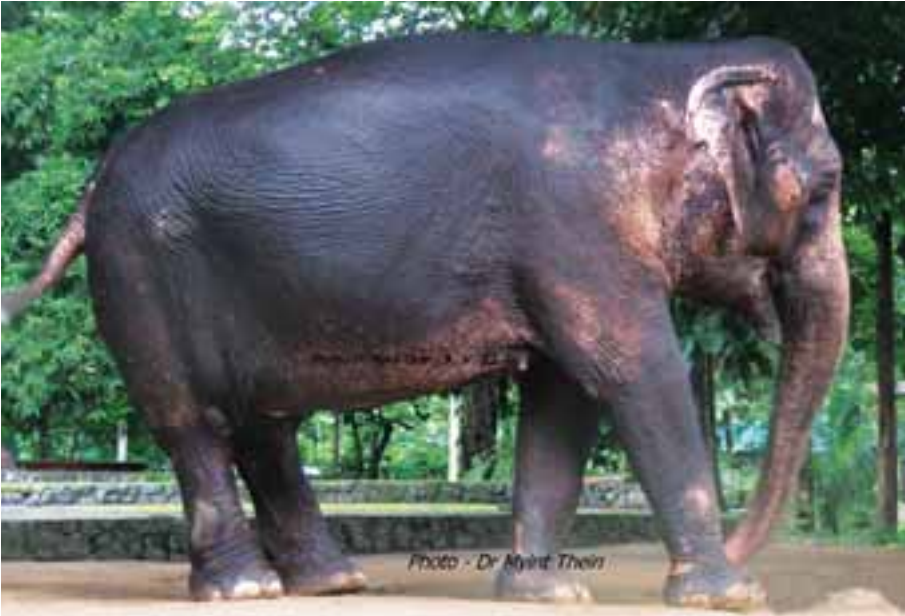
ကပြအသုံးတော်ခံနေဆဲ

ဆင်အားလုံးအပေါ် မောင်နှမရင်းချာပမာ မိသားစု သံယောဇဉ်များထားရှိခဲ့ပြီး ကရုဏာထားခြင်း၊ အပြန်အလှန် ခင်မင်နားလည်မှုပေးခြင်း၊ အများနှင့် သဟဇာတဖြစ် အောင်နေခြင်း၊ ဆင်အားလုံးနှင့်စိတ်သဘောထားညီညွတ် ကြခြင်း၊ ခံစားမှုများကို မျှဝေခံစားကြခြင်း အစရှိသည် (Kinship support) တို့ကို ခေါင်ဆင်မတစ်ဦးသဖွယ် ဦးဆောင်နေထိုင် . . .”