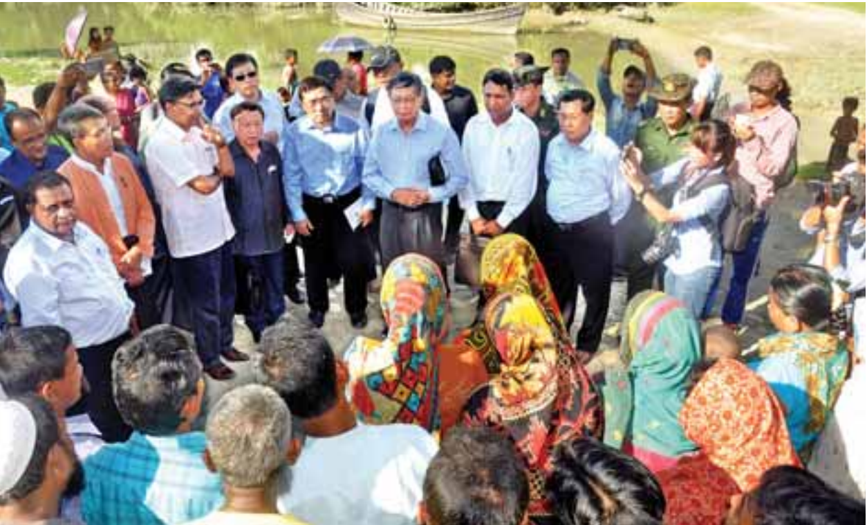
ပြည်ထောင်စုဝန်ကြီးများ၊ သံအမတ်ကြီးများနှင့် သံတမန်များ မောင်တောမြို့နယ် ငါးခူရကျေးရွာမှ ကျေးရွာသူ ကျေးရွာသားများနှင့် ရင်းရင်းနှီးနှီးတွေ့ဆုံစဉ်။

အဆိုပါ ဘင်္ဂလားဒေ့ရှ်နိုင်ငံသို့ သွားရောက်ရန် စုဝေးရောက်ရှိနေသည့် အစ္စလာမ်ဘာသာဝင်များနှင့် တွေ့ဆုံစဉ် ပြည်ထောင်စုဝန်ကြီး ဦးကျော်တင့်ဆွေ က စက်တင်ဘာ ၅ ရက်မှစတင်၍ နယ်မြေရှင်းလင်းရေးလုပ်ငန်းများကို တပ်မတော်မှ ဆောင်ရွက်ခြင်း လုံးဝမရှိပါကြောင်း၊ သို့ရာတွင် တစ်ဖက်နိုင်ငံ သို့ ယခုအချိန်ထိ သွားရောက်နေသော သတင်းများကြားသိရ၍ ယခုကဲ့သို့ လာရောက်တွေ့ဆုံရခြင်းဖြစ်ကြောင်း၊ အစ္စလာမ်ဘာသာဝင်များအနေဖြင့် မိမိတို့ ကျေးရွာ၊ မိမိတို့ နေရာများတွင်ပင် ပြန်လည်နေထိုင်ကြစေလိုကြောင်း၊ လိုအပ်သည့် စားနပ်ရိက္ခာနှင့် လူသားချင်း စာနာထောက်ထားမှုအကူအညီများ ပေးအပ်ဖြည့်ဆည်းဆောင်ရွက်သွားမည်ဖြစ်သလို ဘေးကင်းလုံခြုံစိတ်အေး