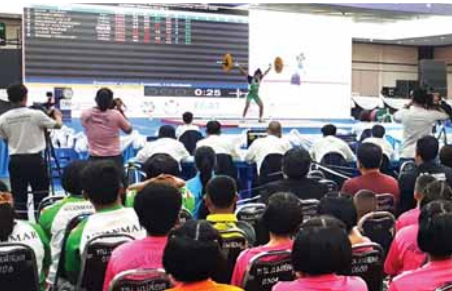
ပထမအကြိမ် ထိုင်းဘုရင့်ဖလား နိုင်ငံတကာအလေးမပြိုင်ပွဲ ယှဉ်ပြိုင်နေမှုကို တွေ့ရစဉ်။