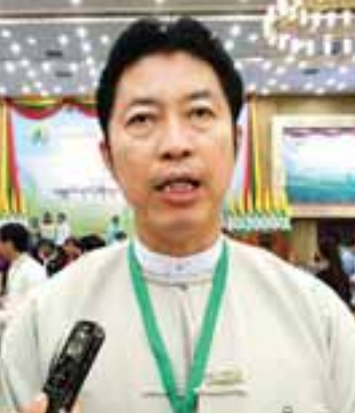
ဦးကျော်မင်းထင်

ဒီနေ့အခမ်းအနားကနေ ကျွန်တော်တို့ နိုင်ငံမှာရှိတဲ့ အစိုးရနဲ့ ပုဂ္ဂလိကကဏ္ဍ နှစ်ခုကြား ဆက်ဆံရေးကို ပိုမိုနီးကပ်အောင် ဆောင်ရွက်ပေးနိုင်တယ်လို့ ယုံကြည်ပါတယ်။ ကျွန်တော်တို့နိုင်ငံက ဖွံ့ဖြိုးဆဲနိုင်ငံတစ်နိုင်ငံဖြစ်ပါတယ်။ ပြီးတော့ အစိုးရနဲ့ ပုဂ္ဂလိကကြား ဆက်ဆံရေးက အားနည်းနေသေးတဲ့အတွက် ဒီနေ့အခမ်းအနားတွေကနေ တွန်းအားပေးနိုင်ပါတယ်။ ကျွန်တော်တို့ရဲ့ ခရီးသွားကဏ္ဍ ဖွံ့ဖြိုးတိုးတက်ဖို့အတွက် နိုင်ငံတကာက သိရှိအောင် ဆောင်ရွက်ဖို့ လိုအပ်နေပါသေးတယ်။ ခရီးသွားတွေ ပိုမိုဝင်ရောက်အောင် ဆောင်ရွက်ရဦးမှာ ဖြစ်ပါတယ်။ ကျွန်တော်တို့ အိမ်နီးချင်း ထိုင်းနိုင်ငံကို တစ်နှစ်မှာ ခရီးသွား ၂၈ သန်းလောက် ဝင်ရောက်တယ်။ ကျွန်တော်တို့ နိုင်ငံကျတော့ ၁ ဒသမ ၂ သန်းလောက်ပဲ ဝင်ရောက်တော့ သူတို့နဲ့နှိုင်းယှဉ်ရင် နည်းနေသေးတယ်။ ဒါကြောင့် ခရီးသွားကဏ္ဍကို ပိုမိုမြှင့်တင်ဖို့၊ ခရီးသွားတွေ ပိုမိုဝင်ရောက်ဖို့ ကြိုးစားရဦးမှာ ဖြစ်ပါတယ်။ ဒီအပိုင်းမှာ အားနည်းနေတာ ဖြစ်ပါတယ်။ နိုင်ငံတော်ရဲ့ ကူညီပံ့ပိုးမှုနဲ့ လုပ်ဆောင်မယ်ဆိုရင် အားနည်း