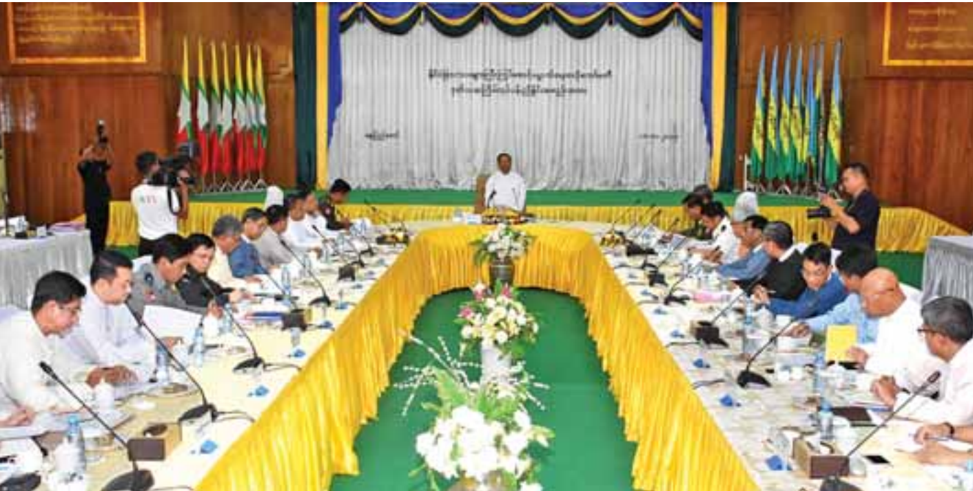
ဒုတိယသမ္မတဦးမြင့်ဆွေ နိုင်ငံခြားသားများ ကြီးကြပ်စောင့်ရှောက်ရေးဗဟိုကော်မတီ ဒုတိယအကြိမ်လုပ်ငန်းညှိနှိုင်းအစည်းအဝေးတွင် အမှာစကားပြောကြားစဉ်။

အပြည်ပြည်ဆိုင်ရာ ဝင်၊ ထွက် ဂိတ်များအနေဖြင့် ရန်ကုန်အပြည်ပြည်ဆိုင်ရာ လေဆိပ်၊ မန္တလေးအပြည်ပြည်ဆိုင်ရာလေဆိပ်၊ နေပြည်တော်အပြည်ပြည်ဆိုင်ရာ လေဆိပ်နှင့် ရန်ကုန်အပြည်ပြည်ဆိုင်ရာ ဆိပ်ကမ်း (သီလဝါ)စသည့် ဂိတ်လေးခု သတ်မှတ်ထားပါကြောင်း။