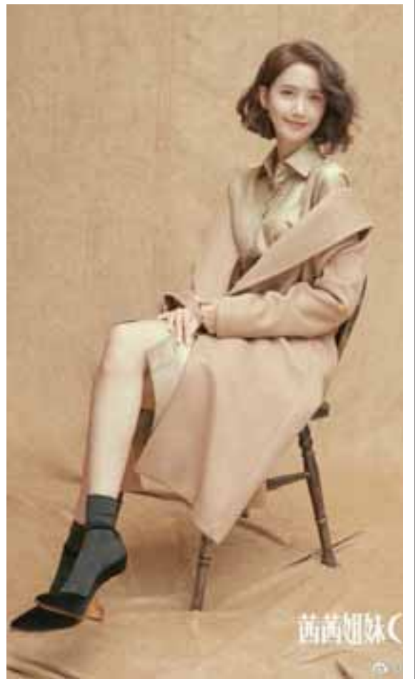
အေးပြည့် ရေးသားသည်

ယွန်နရဲ့ “CeCi China” မဂ္ဂဇင်းမှ မျက်နှာဖုံးဓာတ်ပုံတွေကို ထုတ်ဖော်ပြသခဲ့ပြီး သူ့ရဲ့ အားလပ်ရက်အတွင်း ရိုက်ကူးထားတဲ့ ဓာတ်ပုံတွေကိုလည်း ယွန်နက သူ့ရဲ့ လူမှုကွန်ရက်စာမျက်နှာပေါ်မှာ ဖော်ပြခဲ့တာဖြစ်ပါတယ်။ ဒါ့အပြင် ယွန်နဟာ တောင်ကိုရီးယားနိုင်ငံထုတ် “Marie Claire” မဂ္ဂဇင်းကြီးရဲ့ ဒီဇင်ဘာလထုတ် မဂ္ဂဇင်းမှာလည်း မျက်နှာဖုံးရှင်အဖြစ် ဖော်ပြခံခဲ့ရပါတယ်။ အဆိုပါမဂ္ဂဇင်းနှစ်ခုလုံးရဲ့ မျက်နှာဖုံးဓာတ်ပုံတွေကို ရိုက်ကူးရာမှာတော့ ရွှေရောင်အပြင်အဆင်တွေနဲ့ ဖန်တီးရိုက်ကူးထားတာကိုလည်း တွေ့ရပါတယ်။