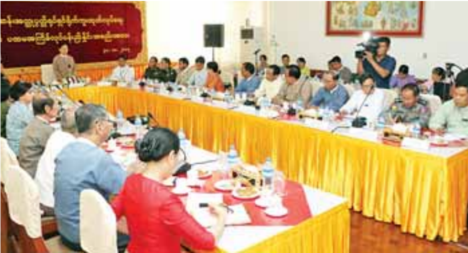
ဗိုလ်ချုပ်အောင်ဆန်းအတ္ထုပ္ပတ္တိရုပ်ရှင် ရိုက်ကူးထုတ်လုပ်ရေးလုပ်ငန်းကော်မတီဥက္ကဋ္ဌ သာသနာရေးနှင့် ယဉ်ကျေးမှု ဝန်ကြီးဌာန ပြည်ထောင်စုဝန်ကြီး သုရဦးအောင်ကို ပထမအကြိမ် လုပ်ငန်းညှိနှိုင်းအစည်းအဝေးတွင် အမှာစကား ပြောကြားစဉ်။

အစည်းအဝေးတွင် ဗိုလ်ချုပ် အောင်ဆန်းအတ္ထုပ္ပတ္တိရုပ်ရှင်ရိုက်ကူး ထုတ်လုပ်ရေးလုပ်ငန်းကော်မတီဥက္ကဋ္ဌ သာသနာရေးနှင့် ယဉ်ကျေးမှုဝန်ကြီး ဌာန ပြည်ထောင်စုဝန်ကြီး သုရ ဦးအောင်ကိုက အမှာစကားပြောကြား ရာတွင် ယခုဆောင်ရွက်မည့် အမျိုးသား ခေါင်းဆောင်ကြီး ဗိုလ်ချုပ်အောင်ဆန်း အတ္ထုပ္ပတ္တိရုပ်ရှင်ရိုက်ကူးရေးတာဝန် သည် ယနေ့အခမ်းအနားသို့ တက်ရောက်လာကြသည့် ကော်မတီ အသီးသီးမှ ပုဂ္ဂိုလ်များအားလုံး၏ ပခုံးထက်တွင် ထိုက်ထိုက်တန်တန် ရောက်ရှိနေပြီဖြစ်ပါကြောင်း၊ ကမ္ဘာ့ နိုင်ငံအသီးသီးတွင်လည်း ၎င်းတို့၏ အမျိုးသားခေါင်းဆောင်ကြီးများကို ဂန္ထဝင်မြောက်သည့် ရုပ်ရှင်ဇာတ်ကား ကြီးများအဖြစ် ရိုက်ကူးထုတ်လုပ်ပြသ ခဲ့သည်များ ရှိခဲ့ပါကြောင်း၊ မြန်မာနိုင်ငံ တွင်လည်း အမျိုးသားခေါင်းဆောင် ကြီး ဗိုလ်ချုပ်အောင်ဆန်းအတ္ထုပ္ပတ္တိ ကို ရုပ်ရှင်အဖြစ် ရိုက်ကူးနိုင်ရန် ၂၀၁၂ ခုနှစ် ဖေဖော်ဝါရီ ၁၃ ရက်က