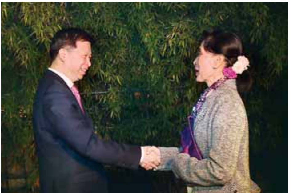
ညစာစားပွဲတက်ရောက်ရန် ရောက်ရှိလာသော နိုင်ငံတော်၏အတိုင်ပင်ခံပုဂ္ဂိုလ် ဒေါ်အောင်ဆန်းစုကြည်အား တရုတ်ကွန်မြူနစ်ပါတီ နိုင်ငံတကာဆက်ဆံရေးဝန်ကြီး Mr. Song Tao က ကြိုဆိုနှုတ်ဆက်စဉ်။