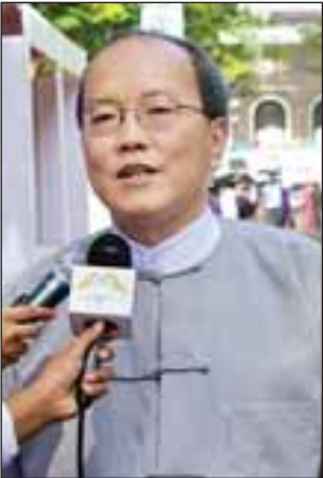
ဒေါက်တာဖိုးကောင်း

ဘွဲ့ရပြီးသူ အများစုက ပညာရေးဝန်ကြီးဌာန၊ ယဉ်ကျေးမှုဝန်ကြီးဌာန၊ အရပ်ဘက် လူမှုအဖွဲ့အစည်းတွေမှာ ပြန်လည် အလုပ်ဝင်လို့ရပါတယ်။