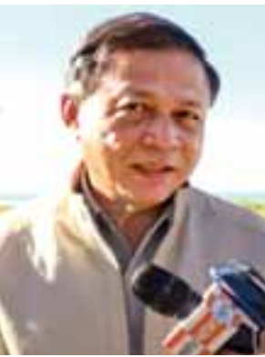
ဦးသိန်းဇော်

နဲ့အညီ နှစ်နိုင်ငံ သဘောတူညီချက်အပေါ် မူတည်ပြီး သေချာစိစစ်မှာ ဖြစ်ပါတယ်။ စိစစ်တဲ့အခါမှာလည်း ဌာနဆိုင်ရာအသီးသီးက ဝန်ထမ်းတွေ ပါလာမယ်။ ပါလာတဲ့ ဝန်ထမ်းတွေရဲ့ နေထိုင်ရေး၊ ရုံးခန်း၊ ဒီအပိုင်းတွေကို ရက်ရှည်လများ လုပ်ရမှာဖြစ်တဲ့အတွက် ခုတော့ ဆောက်လုပ်ရေးလုပ်ငန်းတွေ စတင်နေပါပြီ။ တောင်ပြိုလက်ဝဲမှာ Modular House နေရာတွေလည်း လျာထားပြီး ဒါတွေအားလုံးကို ဒီဇင်ဘာလကုန်မှာ အပြီးဆောင်ရွက်နိုင်မှာ ဖြစ်ပါတယ်။ တောင်ပြိုလက်ဝဲမှာဆို Modular House ၁၆ လုံး၊ အခန်း ၈၀ ပါ ဝန်ထမ်းရုံးခန်းတွေ၊ အဆောက်အအုံတွေကိုလည်း ပြန်လည်ပြုပြင်တာတွေ လုပ်နေပါပြီ။ ပြင်တဲ့အခါမှာလည်း ပုဂ္ဂလိကလုပ်ငန်းအဖွဲ့အောက်မှာရှိတဲ့ အခြေခံအဆောက်အအုံတွေနဲ့ ဆောက်လုပ်ရေးဆိုင်ရာလုပ်ငန်းအဖွဲ့ကနေ ပြန်လည်ပြုပြင်ဆောင်ရွက်ပေးနေပါတယ်။ ဆောက်လုပ်ရေးဝန်ကြီးဌာနအဖွဲ့ကတော့ ဒီ Modular House တွေကို ပြန်ပြီး