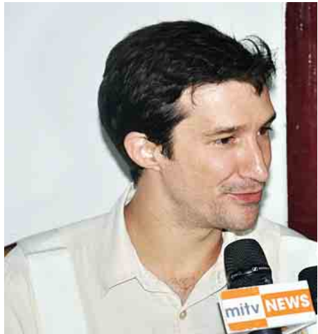
ICRC မောင်တောနဲ့ တာဝန်ခံကိုယ်စားလှယ်

ဖြေ။ အခုရောက်နေတဲ့ သင်္ဘောက ပထမဆုံးအကြိမ် အဖြစ် ထောက်ပံ့ဖို့ရောက်နေတာဖြစ်ပါတယ်။ နောက်ထပ် ထောက်ပံ့ပစ္စည်း တန် ၄၀၀ လောက်ကို သင်္ဘောနဲ့ သယ်ယူပြီးတော့ ထောက်ပံ့သွားဖို့လည်း စီစဉ်ထားပါတယ်။ ဆက်လက်ပြီး ထောက်ပံ့မှာက ပြည်သူတွေ အမှန်တကယ် လိုတဲ့ အခြေခံလိုအပ်ချက်ဖြစ်တဲ့ စားဝတ်နေရေးအတွက် အစားအစာတွေ၊ သောက်ရေသန့်တွေ၊ ကျန်းမာရေးဆိုင်ရာ တွေဖြစ်တဲ့ ရေနဲ့ ပတ်ဝန်းကျင်သန့်ရှင်းရေးတွေအပြင်