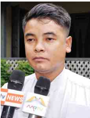
ဦးအောင်လှိုင်