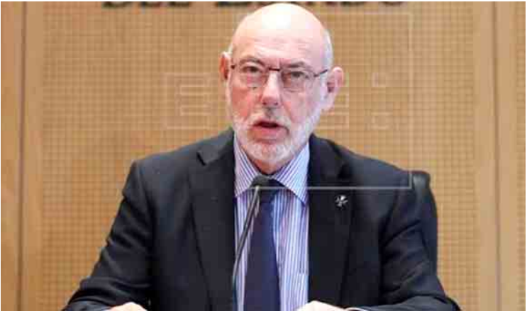
စပိန်ရှေ့နေချုပ် ဟိုဆေးမင်နယ်ယယ်မာဇာ။

ဘာ ၁၁ ရက်က ပြည်သူ့ဆန္ဒခံယူပွဲ ပြုလုပ်ခဲ့ရာမှ ဖြစ်ပေါ်လာသည့် နိုင်ငံရေး အကျပ်အတည်းသည် ဆယ်စုနှစ်ပေါင်းများစွာ ကာလအတွင်း အကြီးအကျယ်ဆုံးသော နိုင်ငံရေးတင်းမာမှု ဖြစ်သည်။ စပိန်ဝန်ကြီးချုပ် မာရီယာနို ရေဂျွိုင်းသည် ကာတာလိုနီးယား ခွဲထွက်ရေးပါတီအစိုးရအဖွဲ့ကို ဖြုတ်ချခဲ့ပြီး ရွေးကောက်ပွဲကို စော၍ ခေါ်ယူခဲ့ကာ ဒီဇင်ဘာ ၂၁ ရက်တွင် ဒေသန္တရရွေးကောက်ပွဲ ပြုလုပ်ရန် ရက်သတ်မှတ်ပေးခဲ့သည်။ ရာထူးမှ ဖယ်ရှားခံခဲ့ရသော ကာတာလိုနီးယား ခေါင်းဆောင်အချို့က ၎င်းတို့အား ရာထူးမှ ဖြုတ်ချမှုကို လက်ခံနိုင်မည်မဟုတ်ဟု ပြောကြားကြသည်။ ရိုက်တာ။