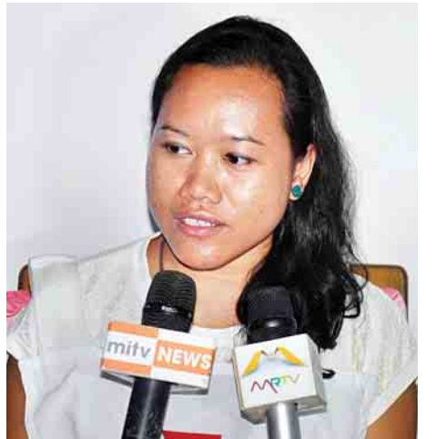
လခြမ်းနီလှုပ်ရှားမှုအသင်းများ ဖက်ဒရေးရှင်းကိုယ်စားလှယ်

မေး။ ထောက်ပံ့မှုတွေပေးတဲ့အခါ တစ်ပြေးညီထောက်ပံ့ မှုတွေပေးပါသလား။ ဘယ်လိုသတ်မှတ်ပြီး ထောက်ပံ့နေပါ သလဲ။ ရေရှည်ဆောင်ရွက်သွားမယ့် အစီအစဉ်ရှိရင်လည်း သိချင်ပါတယ်။