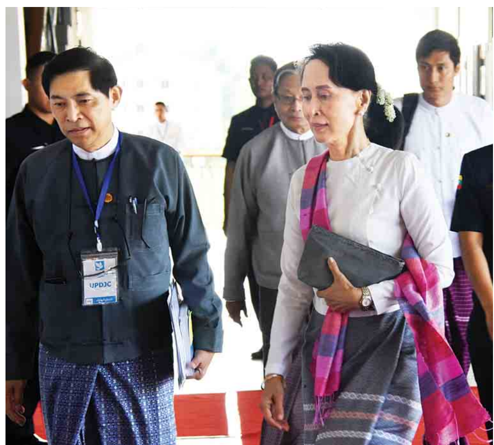
(၁၂)ကြိမ်မြောက် ပြည်ထောင်စုငြိမ်းချမ်းရေးဆွေးနွေးမှု ပူးတွဲကော်မတီအစည်းအဝေးသို့ ကော်မတီဥက္ကဋ္ဌ နိုင်ငံတော်၏အတိုင်ပင်ခံပုဂ္ဂိုလ် ဒေါ်အောင်ဆန်းစုကြည် တက်ရောက်စဉ်။

နေပြည်တော် အောက်တိုဘာ ၃၁ (၁၂)ကြိမ်မြောက် ပြည်ထောင်စုငြိမ်းချမ်းရေးဆွေးနွေးမှုပူးတွဲကော်မတီ (UPDJC) အစည်းအဝေးကို ယနေ့နံနက် ၁၀ နာရီတွင် နေပြည်တော်ရှိ အမျိုးသားပြန်လည်သင့်မြတ်ရေးနှင့် ငြိမ်းချမ်းရေးဗဟိုဌာန(NRPC) ၌ ဆက်လက်ကျင်းပရာ ပြည်ထောင်စုငြိမ်းချမ်းရေးဆွေးနွေးမှုပူးတွဲကော်မတီ (UPDJC) ကော်မတီဥက္ကဋ္ဌ နိုင်ငံတော်၏အတိုင်ပင်ခံပုဂ္ဂိုလ် ဒေါ်အောင်ဆန်းစုကြည် တက်ရောက်သည်။ ယနေ့ အစည်းအဝေးတွင် တက်ရောက်လာကြသူ များက နိုင်ငံရေးဆွေးနွေးမှုဆိုင်ရာမူဘောင်နှင့် လုပ်ငန်းလမ်းညွှန် (ToR)များ ပြန်လည်သုံးသပ်ရေး၊ အမျိုးသားအဆင့် နိုင်ငံရေးဆွေးနွေးပွဲများ ကျင်းပခြင်း နှင့်စပ်လျဉ်းသည့် Standard Operating Procedure (SOP) မူကြမ်းရေးဆွဲရေးနှင့် အလုပ်အဖွဲ့ ဖွဲ့စည်းရေး ကိစ္စ၊ အကြောင်းအရာအလိုက် အမျိုးသားအဆင့် နိုင်ငံရေးဆွေးနွေးပွဲ (CSO Forum) ကျင်းပနိုင်ရေး နှင့် မူဝါဒစာတမ်း တင်ပြနိုင်ရေးကိစ္စ၊ UPDJC Proposal drafting process ကိစ္စနှင့် အထွေထွေ ကိစ္စရပ်များကို ဆွေးနွေးကြသည်။ ထို့နောက် ပြည်ထောင်စုငြိမ်းချမ်းရေးဆွေးနွေးမှု ပူးတွဲကော်မတီ (UPDJC) ဒုတိယဥက္ကဋ္ဌ ဦးသုဝေက (၁၂)ကြိမ်မြောက် UPDJC အစည်းအဝေး အောင်မြင်စွာ ကျင်းပနိုင်ခဲ့ပြီး အစည်းအဝေးက ဆုံးဖြတ်သည်များကို အကောင်အထည်ဖော်ကြရမည်ဖြစ်ပါကြောင်း၊ ထိုသို့ အကောင်အထည်ဖော်ရာတွင် ညီညီညွတ်ညွတ် အကောင်အထည်ဖော်ပါက ရည်မှန်းချက်ဆီသို့ အမြန် ရောက်မည်ဖြစ်ပါကြောင်း၊ UPDJC သည် လုပ်ငန်းတာဝန်အများအပြားကို တာဝန်ယူရသည့်အဖွဲ့အစည်း ဖြစ်သည့်အတွက် လုပ်ငန်းတာဝန်များကို ကျေပွန်အောင် ဆောင်ရွက်ကြရမည်ဖြစ်ပါကြောင်း ပြောကြားသည်။ စာမျက်နှာ ၃ ကော်လံ ၁ သို့