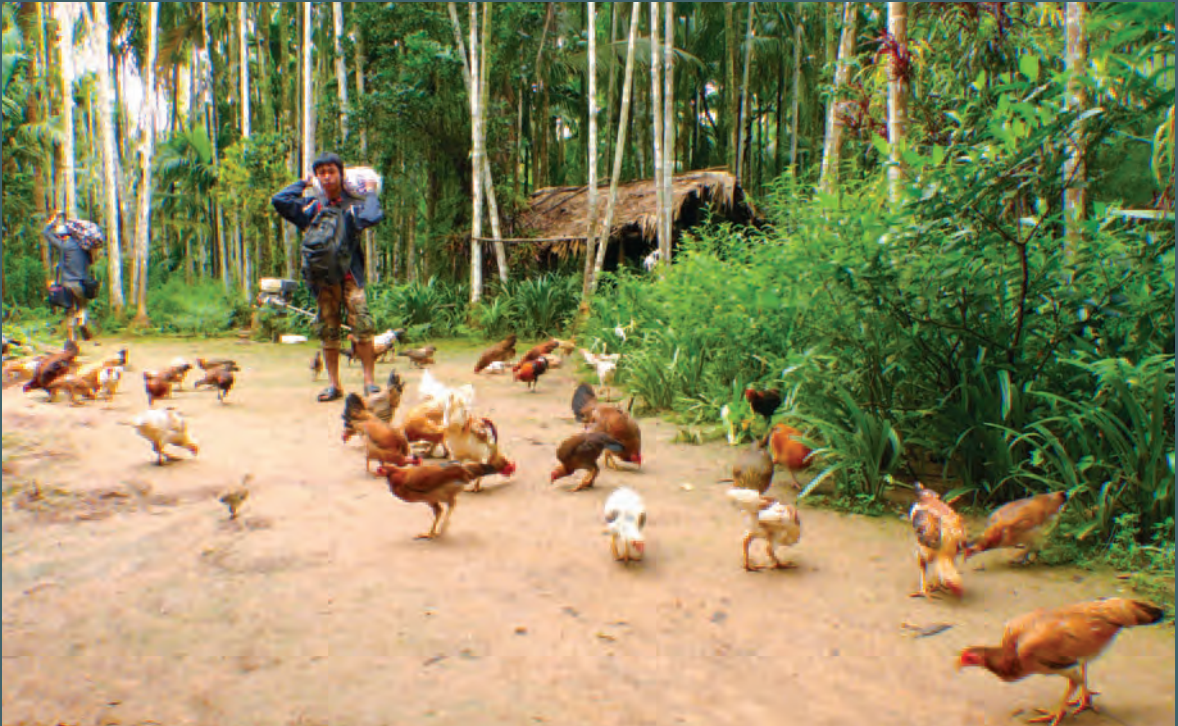
ရောင်းချရန် ကွမ်းသီးသယ်လာသည့် ရွာသားတစ်ဦး