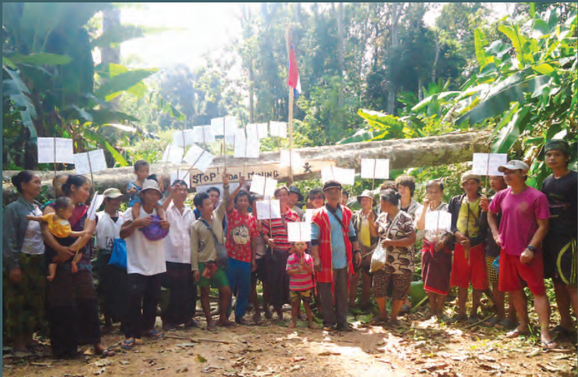
စီမံကိန်းကိုဆန့်ကျင်သည့်အနေနှင့် သတ္တုတူးဖော်သည့်ကုမ္ပဏီများ အသုံးပြုသည့်လမ်းကို ပိတ်ဆို့ထားသည့်ရွာသားများ