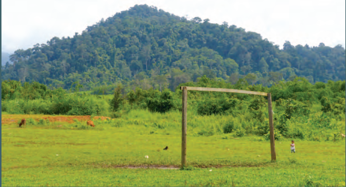
East Star ကုမ္ပဏီက သတ္တုတူးဖော်ရေးလုပ်ငန်းလုပ်ကိုင်ရန် ရည်ရွယ်ထားသည့် ကွမ်းချောင်းကြီးရွာရှိ ဘောလုံးကွင်း