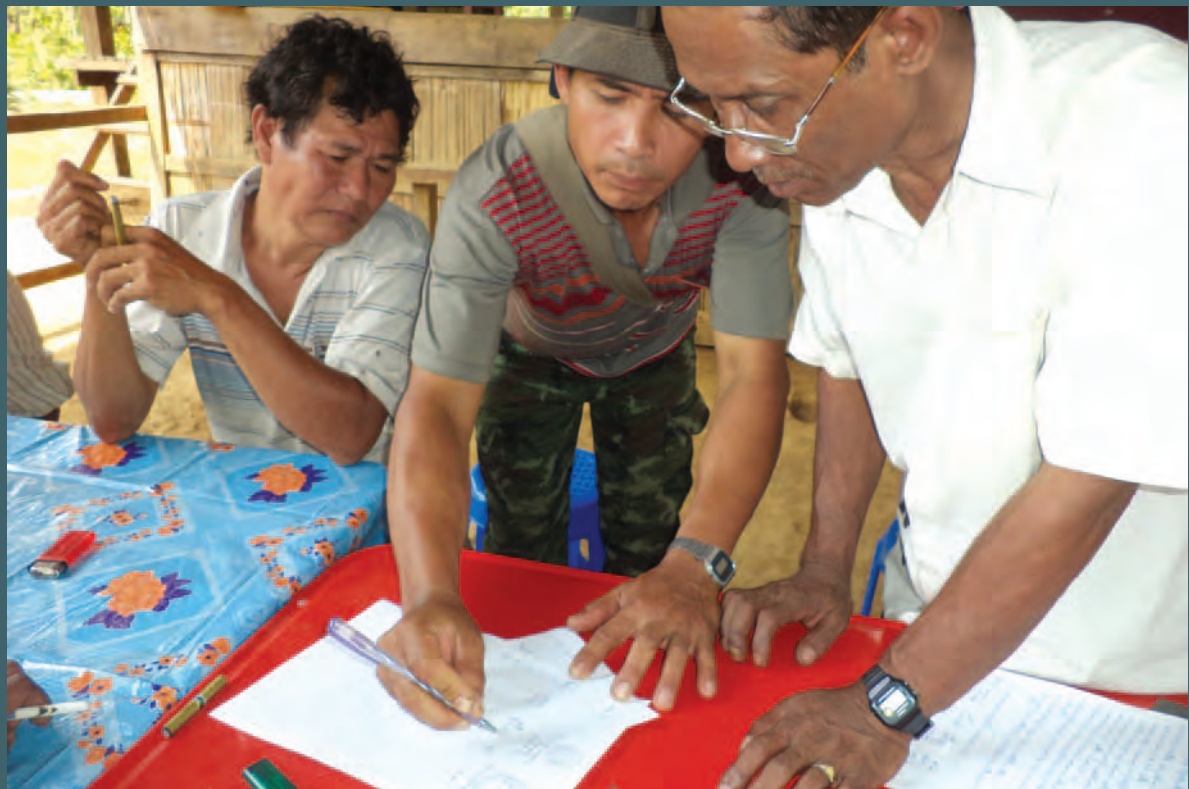
ဧက ၆၀ တွင်သာ လုပ်ငန်းလုပ်ကိုင်ရန် ရွာသူရွာသားများနှင့် East Star ကုမ္ပဏီတို့ လက်မှတ်ရေးထိုးနေစဉ်