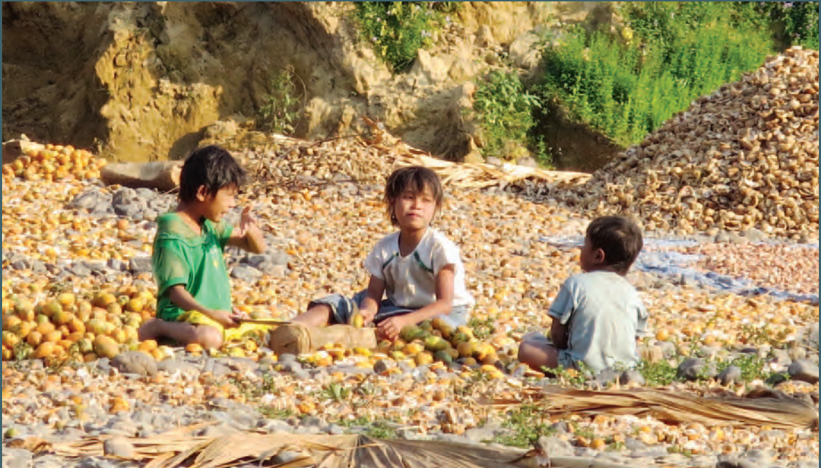
ကွမ်းသီးခြောက် ထုတ်လုပ်မှုလုပ်ငန်းစဉ်တွင် ကူညီနေသည့် ကလေးများ