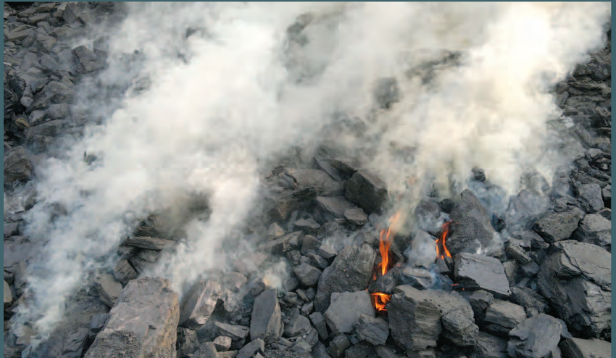
အများကျေးရွာရှိ ကျောက်မီးသွေးပုံမှ ကျောက်မီးသွေးများ လောင်ကျွမ်းနေစဉ်။