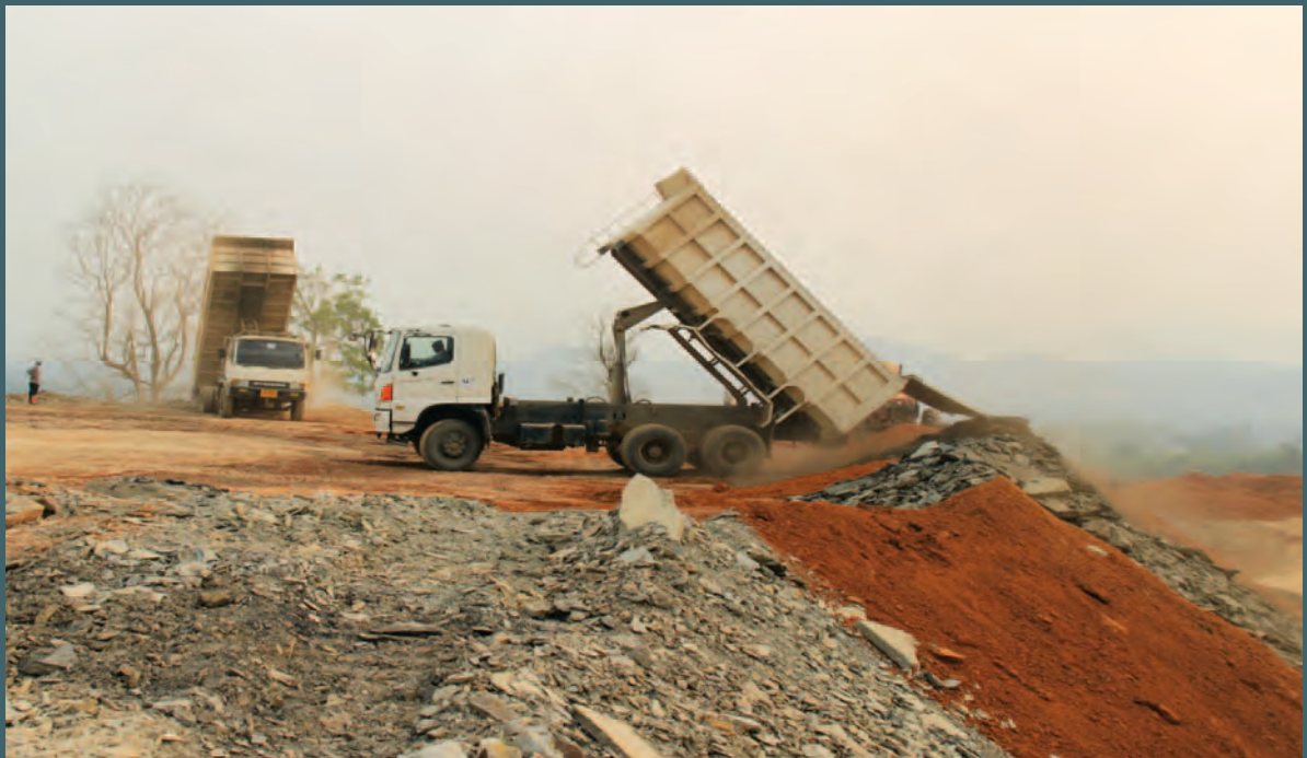
သတ္တုတွင်းထွက်အမှိုက်များကို ကွမ်းချောင်းကြီးသတ္တုတွင်းတွင် အစုအပုံလိုက် စွန့်ပစ်ထားသည်။