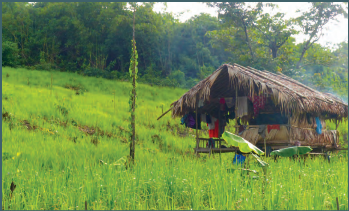
ကွမ်းချောင်းကြီး ကျေးရွာရှိ သတ္တုတွင်းအနီးရှိ (ခု) သို့မဟုတ် ရွှေ့ပြောင်းတောင်ယာစိုက်ပျိုးမြေ