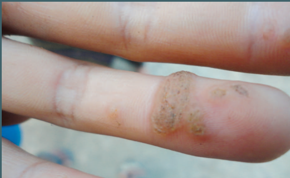
သတ္တုတွင်းအမှိုက်ပုံများအနီး ကစားခဲ့သည့် ကလေးတစ်ဦး၏ လက်ပေါ်တွင် အရေပြားရောဂါဖြစ်လာပုံ။