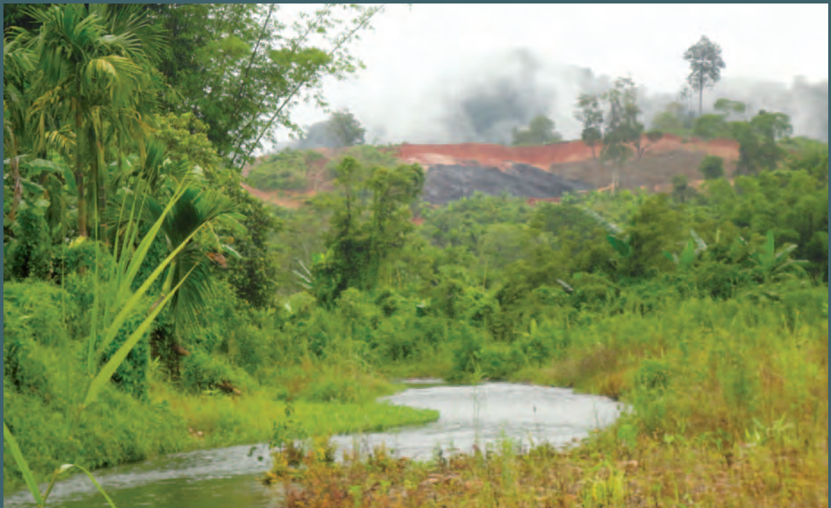
ကွမ်းချောင်းကလေးစမ်းချောင်း (သယ်ဘလုဖိုးကလိုး) စမ်းချောင်းသည် သတ္တုတွင်းမှ အောက်ဘက်သို့ စီးဆင်းသည်။