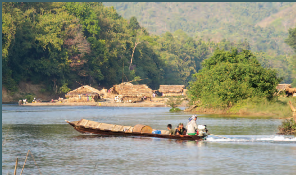
ကထောင်းနီရွာရှိ ကွမ်းသီးလုပ်ငန်းသို့ လှေဖြင့်ခရီးသွားနေသည့် ရွာသားများ။