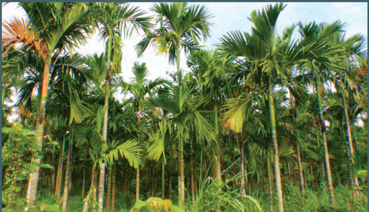
ကွမ်းသီးခြံ