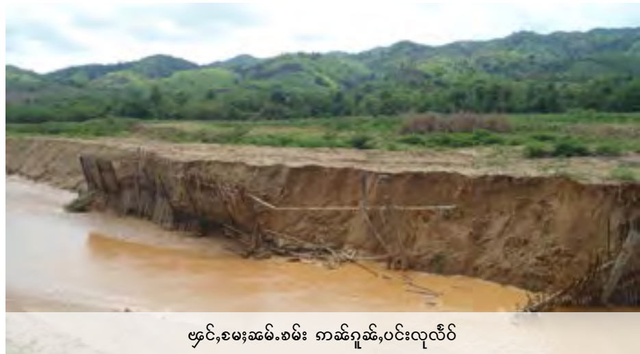
ဗွင်, စမးဆမ်းစမ်း ကမ်ရှမ်း, ပင်းလုလိပ်

ပိုဝ်းတု၊ တေသိုပ်, တုန်းယွမ်းတမ်းစော့တုန်းယွမ်းရှမ်းဝါးကမ်ရှုံးရှိုတ်းကမ် စုတ်းစမ်းဆမ်း ရှမ်းဝါးလုံးဂံးပံးရှမ်းစော့ရှမ်းလွင်းတင်းလှိုင်ရှပ်, စိုဆ်းပီဆ် မုးဆွဲစပ်တင်းသမ်ပီပံးဆမ်းသေ နှိတ်းကွပ်, ပီဆ်ဗိုဆ်ပပ်. ကွမ်, ဗိုဆ်ဆ်. ယပ်။