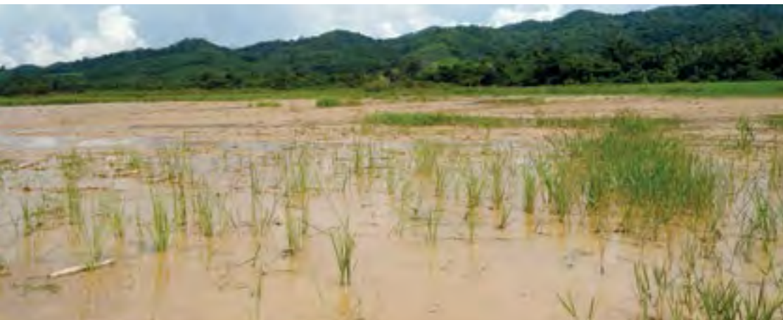
တီးလိမ်ရှုးဆုး ကမ်လုဂ် ယွမ်.စီးလိမ်စီးသီးကွင်းတီးစုတ်စမ်းထုမ်သို၊

မိုဝ်းမီးဂမ်သီးတံဆီးဝမ်းထိ 06/12/2014 ဆဆမ်. ဖုဂ်းစွမ်းစလးဝ်းတုးစီးလီဂ်း ရှုလ်းထုဆီးထုဆီးဝ်း လာတ်းတုဂ်.ရှုဆမ်.တုလ်းလှိုင်တေသီးတံဆီး ဆွင်ပုလး တီးလိမ်လှိုင်းလံးလှိုင်ဆဆမ်.ယု၊ ဆွဲစာဝ်းတင်းဝိုင်းဝိုင်းဆေ.တေလှိုင်ရှုလ်းထုဆီး ထုလ်းထိုင်တုးဆေ။ ဝမ်းထိ 18/12/2014 ဖုဂ်းစွမ်းစလးဝ်း တုးလှိုင်၊ ရှုလ်းလှိုင် လုဂ်၊ ထုဆီး စလးလံးဆုးတီးလှိုင်ပွင်လှိုင်တင်းတုဂ်တံဆီးစွမ်းပဆီးစပ်လံးလှိုင် ရှုလ်းထုဆီးတီးလိမ်လှိုင်းရှိုက်ဝ်.ဆဆမ်. သေလာတ်းတုး တေကပ် ခေးမုဆီး လှိုင်းဆဆမ်.တင်၊ စဆပုးဆိုင်ဂွမ်ဆေ။ ဆွဲဂ်းသေဆဆမ်.စပ်ယင်းလာတ်းထိုင်တုး တေသီးတံဆီးပဆ်ဆွင်ရှုဂ်းလုဂ်၊ ကမ် လုဂ်ဆဆမ်.ပုးဆံယဝ်.။