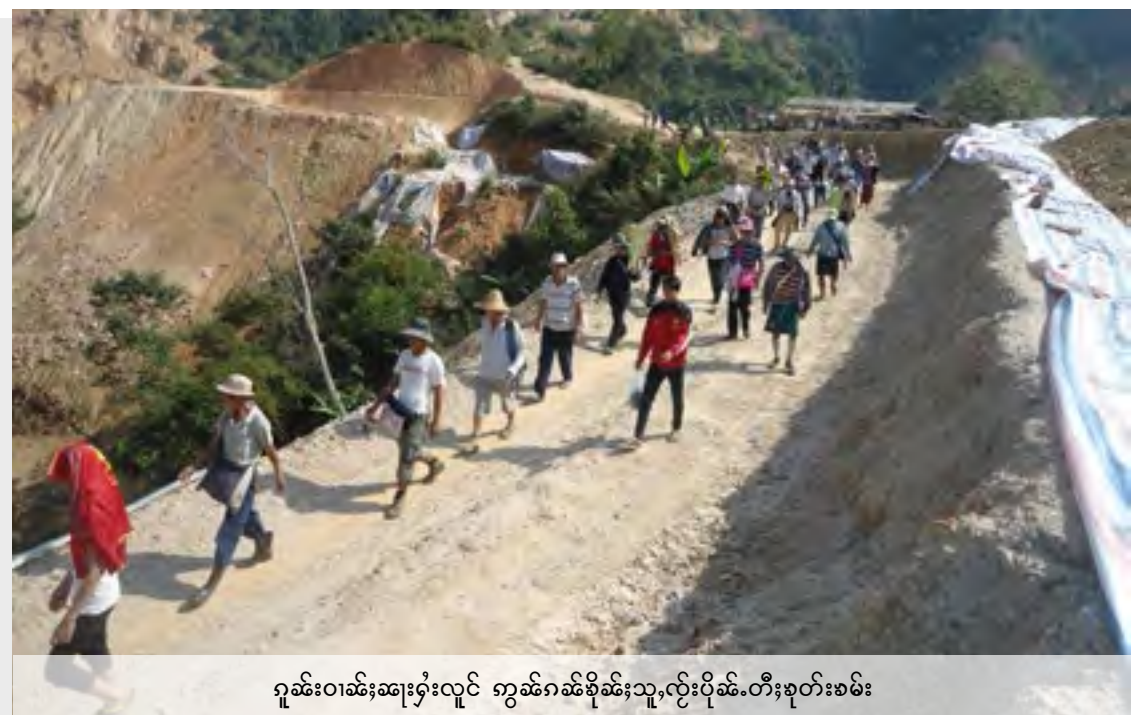
ဂူဆးဝါဆးဆးရှပ်လှိုင်း ကွမ်ဂါဆးစိုဆးသူ,လှိုင်းပိုဆ်.တီးစုတးစမ်း

ထိုင်ဂမ်းလိုဆးသုတးမဆးမုး လှိုင်းရှပ်ဂေးလီ တမ်တုပ်လံးကံးပမ်းလံးလှိုင်းလေ, ယီမ်းတုလှိုင်းဝါဆးဆးရှပ်လှိုင်းမိုင်းဝမ်းထိ 28/05/2015 ပွက်ကွမ် တင်းသုတးတု, မဆးသေ မဆးလတ်းလီင်းစဆဂူဆးဝါဆးဂူဆးမိုင်းဝုး တုပ်မဆးစတ.တိုဆးကမ်, လင်းရှပ်တပ်, ရှပ်ဂါဆးစုတးစမ်း တီးလွံစမ်းဆံ. ရှပ်ယိုတးလံး ရှပ်ပိုင်းဝုး စွမ်းပဆီးလှိုင်းဆံ.လံးရှပ်.တု,သိုပ်,စုတးစမ်းတီးဆဆ,ပီးတေး,မုးဆယပ်.။ လှိုင်း ဆဆ.မဆးယင်းပံလတ်းဂူဆးဝါဆးလှိုင်း ရှပ်ဂါဆးသမ်စတးဂါဆးစုတးစမ်းဝုး “ယု,သင်းပဆ်ရှပ်ထီင်းယပ်.” မဆးဂေးလှိုင်းဂူဆးဝါဆးတိမ်တီးမုးယပ်. ဝုးဆံ.။