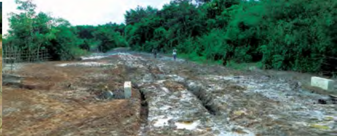
သီဆီးတင်းကမ်လုဂ် ယွမ်.စီးလိမ်စီးသီးကွင်းတီးစုတ်စမ်းထုမ်သို၊

လိုဆီးသုတ်း မိုဝ်းဝမ်းထိ 28/05/2015 ဖုဂ်းလံးကံးပဝ်း ဖုဂ်းလှိုင်ဖုဂ်၊ စုတ်းမိုင်းစုး စလးပု၊ မိုင်းတီး လှိုင်တုလ်းတီးဝါးဆုးရှုးလှိုင် ကမ်ပုးလွမ်းလံးဆုးတီး