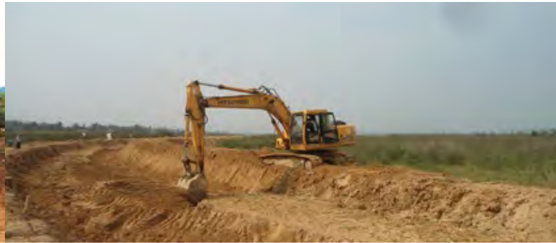
ဗွင်းတိုက်၊ စုတ်းလူင်စီးလိဆီးဆွဲဆီးမီးမဆီးစမ်း

ဆွဲလွမ်းပုးတီးဆွဲ. စဆပဆ်စေးမုဆီးလှိုင်းရှမ်းဝါးဆီးလံးဂီဝ်းရှမ်းတွမ်မုးလှိုင်းဂီဝ်, ဂမ်းလွင်းတူင်ဆိုင်စုတ်းစမ်းတီးဆွဲပိုဆီးတီးလွဲးစမ်း ဝါးဗွင်းလူင်ဗွဲ, စုတ်းမိုင်းစုတ်း လံးကားပဝ်းလိသင်, ရှုံးဂိုတ်းယင်. ဂါဆီးစုတ်းစမ်းဆဆ်. ယူ.။ ဆွဲစုတ်းလှိုင်းကေး ဂါတ်. 2014 စလ; ဆွဲလှိုင်းမေ, 2015 လှိုင်းဆွဲ. ရှမ်း ဝါးဆီး လံးဂျာ, ဂုတ်, ထတ်း တူလ်းဆွဲပိုဆီးတီးစုတ်းစမ်းလှိုင်းဆဆ်. 11 ပွတ်းသေ တူလ်းလွမ်းငဝ်းလံးဂါဆီးစုတ်း စမ်းကဆ်ရှမ်းပုးလွမ်းလဝ်းဆူးတီး လူင် ပွင်လှိုင်းစပ်ဆဆ်. ပွတ်းဆိုင်.။ ဆွဲလွမ်းစေး မတ်းမံဆ်. ကေးယင်းလိလီင်းစဆပလွင်းကဆ်လဝ်းဆူးတီးလူင်ပွင်လှိုင်းစပ် လွင်းလေ, တူလ်းဆွဲပိုဆီးတီး စုတ်းစမ်းဆွဲလှိုင်းကွတ်းလူင်ပွင် 2014 ဆဆ်. သေ လူလွမ်းတူလ်းလွမ်းငဝ်းလံးမဆီးဆဆ်. ယူ.။