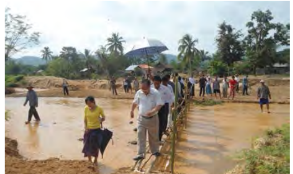
ဖွင့်လှစ်လှူဒါန်း, ပျို, မီး.လေး မိုင်းစုတ်းမိုင်းတီး လားကားပပ် လေး, ယိမ်းဝါးဆွဲမိုင်းလှူဒါန်း

ဝမ်းထိ 14/08/2014 ဖွင့်လှစ်လှူဒါန်း.ကပ်.တူင်းရှက်, ရှိသေး ဆွဲ.စိုမ်းလုပ်, ကပ်စီးလိမ်းစီးသားလွမ်းလှူဒါန်း, လှူဒါန်းပတ်စမ်းစမ်းစိုမ်းယမ်း. ဝါးဆွဲ. စွမ်းပဆီးလွဲစမ်းလှူဒါန်း လွဲ.ဂူတ်.ထုတ်, မမ်းသေစုတ်, ကပ်စီးလိမ်းသားဆွဲစမ်းဆွဲစမ်းစိုမ်းကွက်, ထိင်းဂမ်းဆိုင်, တေး, ထိုင်ဝမ်းထိ 25/08/2014။ ဝါးဆွဲ.မမ်းစိုမ်းကပ်ဂူတ်.ထုတ်, မမ်းစိုမ်းဆိုင်လွဲစမ်း စိုမ်းယမ်း.ယမ်း.။