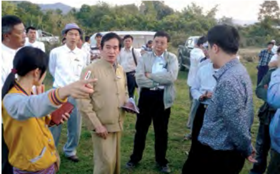
ဖွင့်လှစ်လှူဒါန်း၊ ဇေးစုတ်းစမ်း လားသု၊ လူ၊ လေး၊ ယိမ်းဝါးဆွဲမိုင်းလှူဒါန်း

ရှက်ယွံး ရာဆဲးကမ်းစွမ်းပဆီးစက်လုံးနှိတ်း