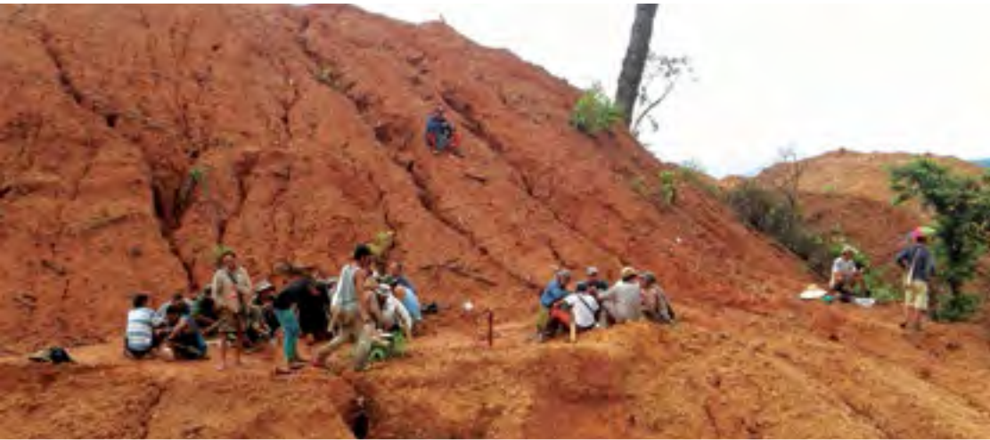
ရှမ်းဝါးဆီးဆူးရှုံးလူင် ကွမ်ဂါဆီးခိုဆီးသူ၊ လွဲးပိုဆီးတီးစုတ်းစမ်း