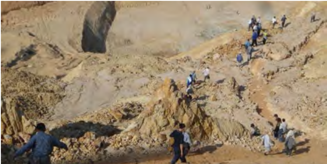
ရှမ်းဝါးဆူးရှုံးလှိုင် ကွမ်ကမ်စိုဆ်းယူ, လှိုင်ပိုဆ်. တီးစုတ်းစမ်း

စော့တုမ်းတွပ်, လှိုင်စော့တုန်းယွမ်းရှမ်းဝါး- လှိုင်ကေးဂတ်. 2014 ထိုင် လှိုင်ရှမ်းလံး 2015