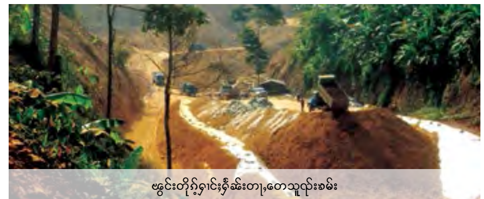
ဗွဲင်းတိုက်ရှင်းရှီဆးတု,တေသုလုးစမ်း