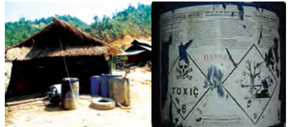
သမ်ဆေးမီး သံးယုဆ်း ကမ်မီးရှိုင်းရှို. လု. တေ, ရှမ်း ခလး သတ်း

မိုဝ်းဝမ်းထိ 08/08/2014 ဆမ်း. ဇုတ်းစမ်းစလးဝိုင်းတု, လှိုင်း, ကူးကေးမိမ်းထုမ်း. လင်းဆုတ်းတီးရှိုင်းဂမ်ဗွင်, တီးလိမ် ကွင်, ရှပ်, လတ်.၊ ဇုတ်.။ ပူ, စဂ, ဝမ်းဆုတ်း လူင်စလးတူင်တိမ်းခွမ်းပဆီးလှိုဆိုင်, ကေး. လူင်းဂူတ်, ထတ်းတူင်းတီးလိမ်လှိုင်း လှို။ ကမ်ဂူတ်, ထတ်းဆမ်း. လှို. စားတင်းသီ, ဝမ်း။ စပ်လတ်းတု, ဆွမ်းတီးလိမ် ကမ်လံးတု. တိုဝ်. တု, 300 ကေးဂေးဆမ်း. လှိုင်းတု. တိုဝ်. ၄၁၀.၅၆၆ ဂမ်းသိုဝ်းမီး 168.45 ကေးဂေးယွမ်း. ကမ် ခုတ်းစုတ်/စမ်းဆမ်း. ယဝ်.။