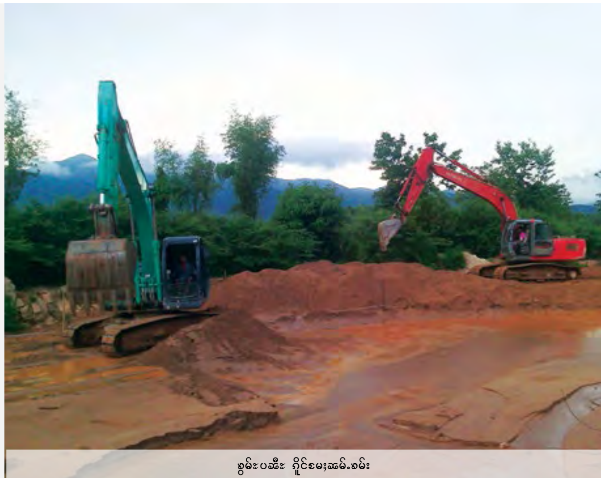
ခွမ်းပဆီး ရှိုင်လေးဆင်းစမ်း