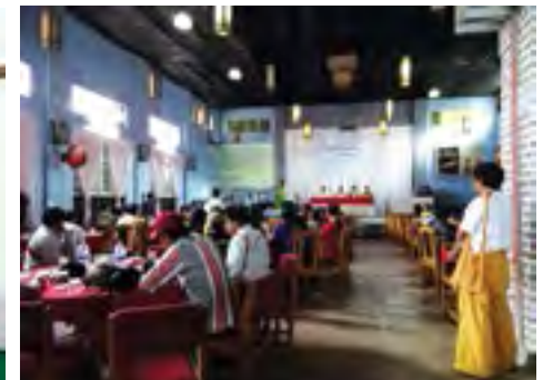
မိုင်းဗွဲင်းပီးဆွဲဆးရှေးလုင်ရှပ်ထူပ်း လင်းလံးကံးပပ်း ဗွဲင်းလုင်ဗမ်,မိုင်းစုး