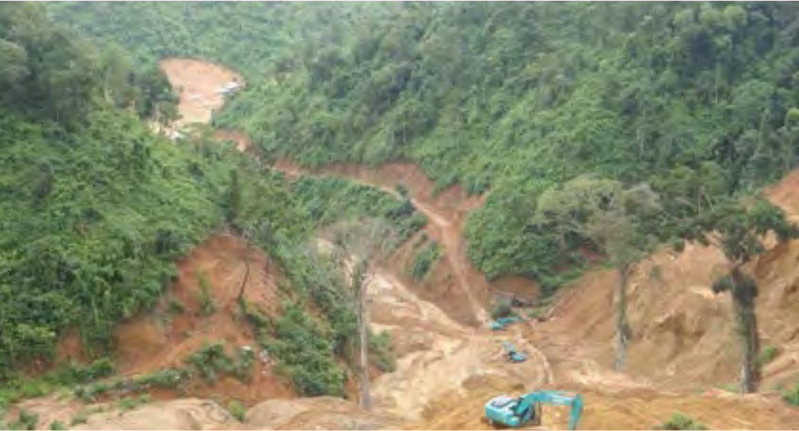
ရှပ်းလွင်စုတ်း ကမ်တိုက်.လွင်စုတ်းစမ်းတီးပိုဆ်းတီးစုတ်းစမ်း

ပိုင်းတု၊ ပီဆ်ကမ်တုမ်. တွပ်, လွံးစုးစံပဆ်လွင်; ရှမ်းမိုင်းသမ်ဆတ်း ကမ်စုတ်း စမ်းဆွဲမိုင်းလီဆီး လိုင်းတံးပွတ်းကွက်, ဆဲသေ ဗွင်းလွင်ဗွံ, မိုင်းတံးလံး လိသင်, ရှပ်းဂိုတ်းယင်. ကမ်စုတ်းစမ်းမိုင်းဆွဲလို့ဆ်ဂျူးလံး 2014 ဆမ်.ယူ, ယပ်.။ ပီဂ်.သမ်.မီးကမ် လိသင်, ရှပ်းဂိုတ်းယင်. ဆဲသေတု. လွင်; စုတ်းစမ်း စတ. ကမ်, ယွမ်း ဂိုတ်းယင်. လျးလျးသေတိုက်. သိုပ်, စုတ်းယူ, ဆွဲပိုဆ်းတီးတေ, ထိုင်မိုင်းလီပ်. ရွပ်းဝုး လံးစွာင်. မုးတီးဆေ, ပျီတေ, ဆဲသေကမ်စုတ်းစမ်း ဆဲ. သိုပ်, ပီဆ်လွင်; တုမ်. တိုဝ်. ယွံ, လွင်တေ, ပံးယူ, လီစလ; ကမ်ရှပ်.လီ.တွင်. ပီဆွင်. ရှမ်းမိုင်းဆွဲဝမ်းဆွဲစွင်, ယူ, ယပ်.။ ပပ်.ကွမ်, ဗိုဆ်ဆဲ. လံးဂိုပ်းရွမ်တွမ်လွင်; ရှမ်းမိုင်းလုက်. တိုဆ်, သမ်ဆတ်း ပိုင်းတု, ရှပ်းစွမ်းပဆီး စုတ်းစမ်းစပ်သပ်းလီင်းလတ်းစဆလွင်; တင်းပိုင်ပီဆ် စလ; လွင်; စွမ်းပဆီး တင်းလပ်းဆုးတီး လွင်ပွင်လိုင်းစပ် ကမ်, သွံ, လွံတု, ရှမ်းဂိုတ်, စစ လွင်; ပူဆ်. ပီဆ်သုဆ်, လံးသုဆ်, ပီဆ်တူင်, ပူင်းရှမ်းဆမ်. ယပ်.။