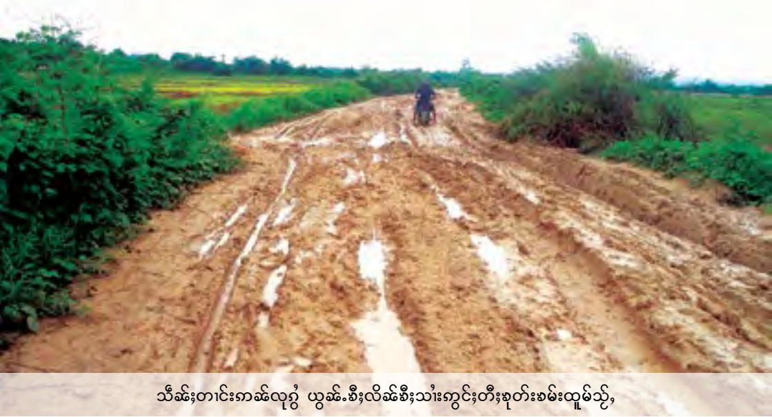
သီဆီးတင်းကန်လှေ ယွမ်းစီးလိဆီးစီးသုံးကွင်းတီးစုတ်စမ်းထူမ်သို့

စလးဝိုင်းစပ်လှိုင်းလွမ်းဆဆ။ မဆီးလတ်တီးဂူခင်းဝါးဝါး၊ ကမ်၊ ထုဂ်၊ လီမုင်းမွင်း တုဂ်းယွမ်းဂုးသုံးတီးသင်ထီင်းယပ်။ လှိုပ်ဆဆ။ မဆီးယင်းပံလီ၊ ဖေးဂူခင်း ဝါးဝါး၊ တိုဆီးတင်းလှိုပ်ပွဲ၊ နှိုင်းတီးလိဆီးစီးဆေး ကမ်၊ လင်းဖုဂ်၊ သွမ်းသင်ဂူဂ်း ယွမ်းစီးလံးငိုဆီးသုံးတီးဆဆထီင်းသေ လှိုင်း၊ ဂူခင်းဝါးဝါးဖုဂ်၊ သွမ်းဆေးစပ်စိုဆီး။