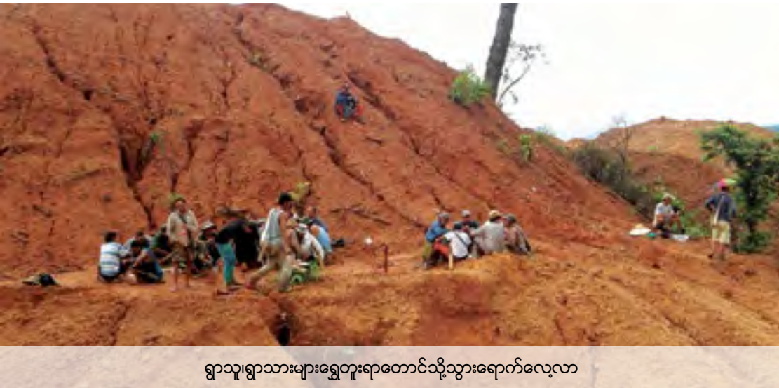
ရွာသူရွာသားများရွှေတူးရာတောင်သို့သွားရောက်လေ့လာ

တကြိမ်မှာအစိုးရအရာရှိများနှင့်အတူသွားခဲ့သည်။ဇယားတွင်ရွှေတူးရာဒေသသို့အစိုးရအရာရှိများ၏၂၀၁၄ခုနှစ်အောက်တိုဘာလတွင် စစ်ဆေးမှုကိုလည်းမှတ်တမ်းတင်ထားသည်။