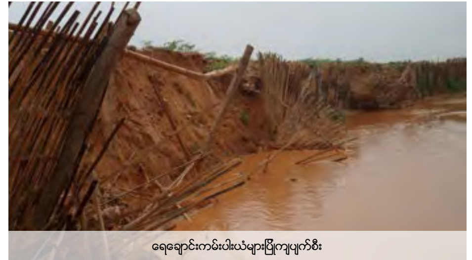
ရေချောင်းကမ်းပါးယံများပြိုကျပျက်စီး

တုန့်ပြန်ချက် - ကုမ္ပဏီတို့ကရွာနားရှိနမ့်ခမ်းချောင်းကိုခေတ္တရေကြောင်းလွှဲပြောင်းပေးခဲ့သည်။သို့သော်မိုးရွာသွန်းမှု၊မိုင်းမှစွန့်ပစ်ပစ္စည်းများထုတ်လွှတ်နေမှုတွေကရေကိုညစ်ညမ်းစေသည်။