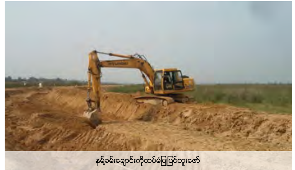
နမ့်ခမ်းချောင်းကိုထပ်မံပြုပြင်တူးဖော်

စိုင်းတစ်ကုမ္ပဏီ - စိုင်းတစ်ကုမ္ပဏီအားစောင့်ကြည့်ခြင်းအလုပ်ကို၂၀၁၄ခုဩဂုတ်လ၊ စက်တင်ဘာလနှင့်နိုဝင်ဘာလအထိလုပ်ခဲ့သည်။သန့်စင်ရေးကန်များကိုဆက်လက်အသုံးပြုနေသည်။သို့သော်၂၀၁၄ဒီဇင်ဘာလတွင်အလုပ်သမားများနှင့်ပစ္စည်းကိရိယာတို့ကိုပြန်သိမ်းသွားကြသည်။ရွှေတူးဖော်သည့်လုပ်ငန်းကိုဆက်မလုပ်တော့ပါ။