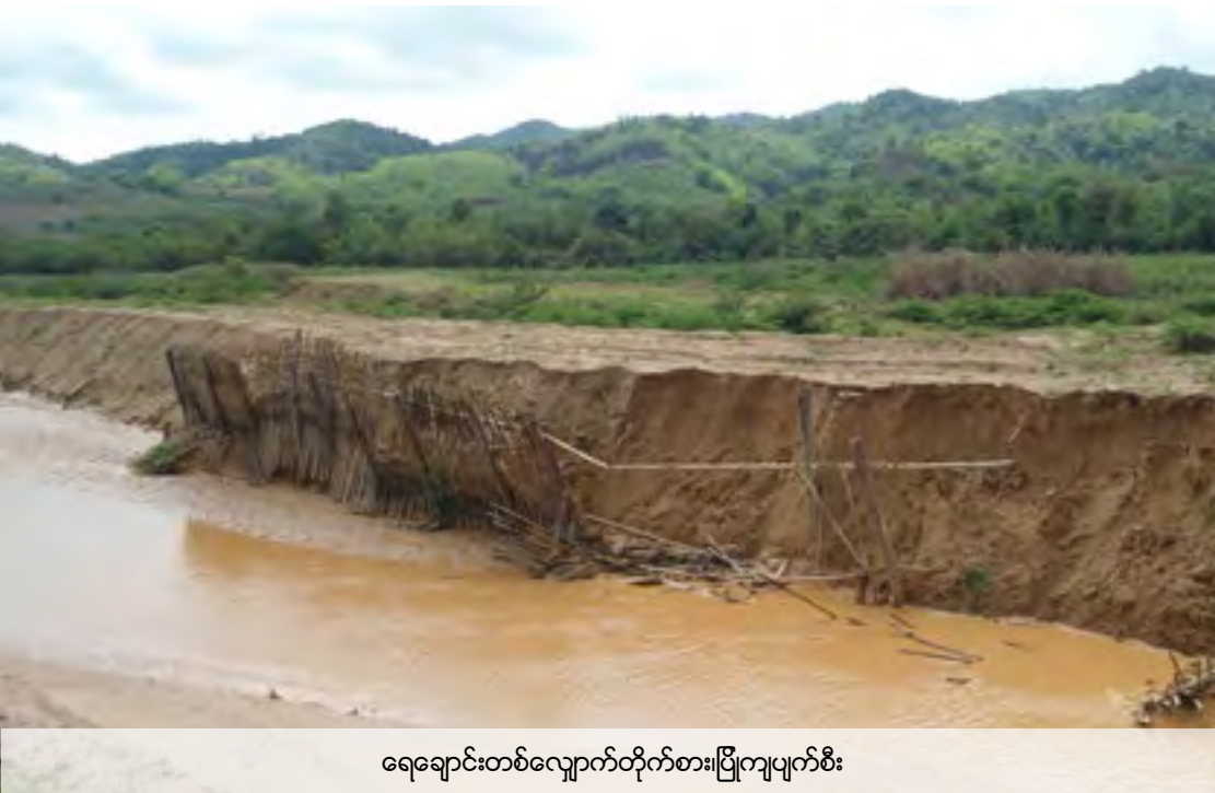
ရေချောင်းတစ်လျှောက်တိုက်စား၊ပြိုကျပျက်စီး

ရွှေတူးဖော်ရေးလုပ်ငန်းရပ်တန့်စေရန်တောင်းဆိုချက်ကိုဆက်လက်လုပ်ဆောင်နိုင်ရန်တွက်ရွာသားများလွန်ခဲ့သည့်နှစ်အတွင်းလက်တွေ့ဖြစ်စဉ်များကိုမှတ်တမ်းတင်ခါသတင်းအချက်အလက်ကိုဤစာအုပ်ငယ်ကစုဆောင်းတင်ပြထားသည်။