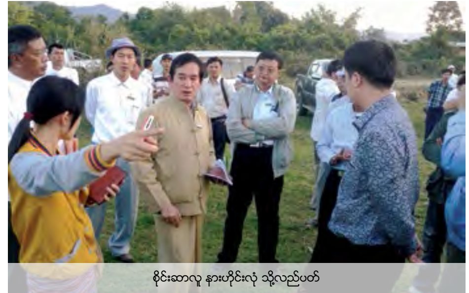
စိုင်းဆာလူ နားဟိုင်းလုံ သို့လည်ပတ်