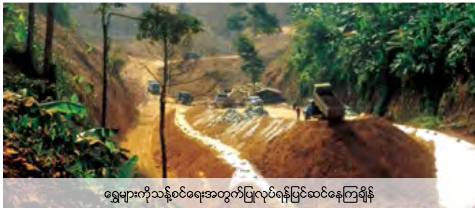
ရွှေများကိုသန့်စင်ရေးအတွက်ပြုလုပ်ရန်ပြင်ဆင်နေကြချိန်