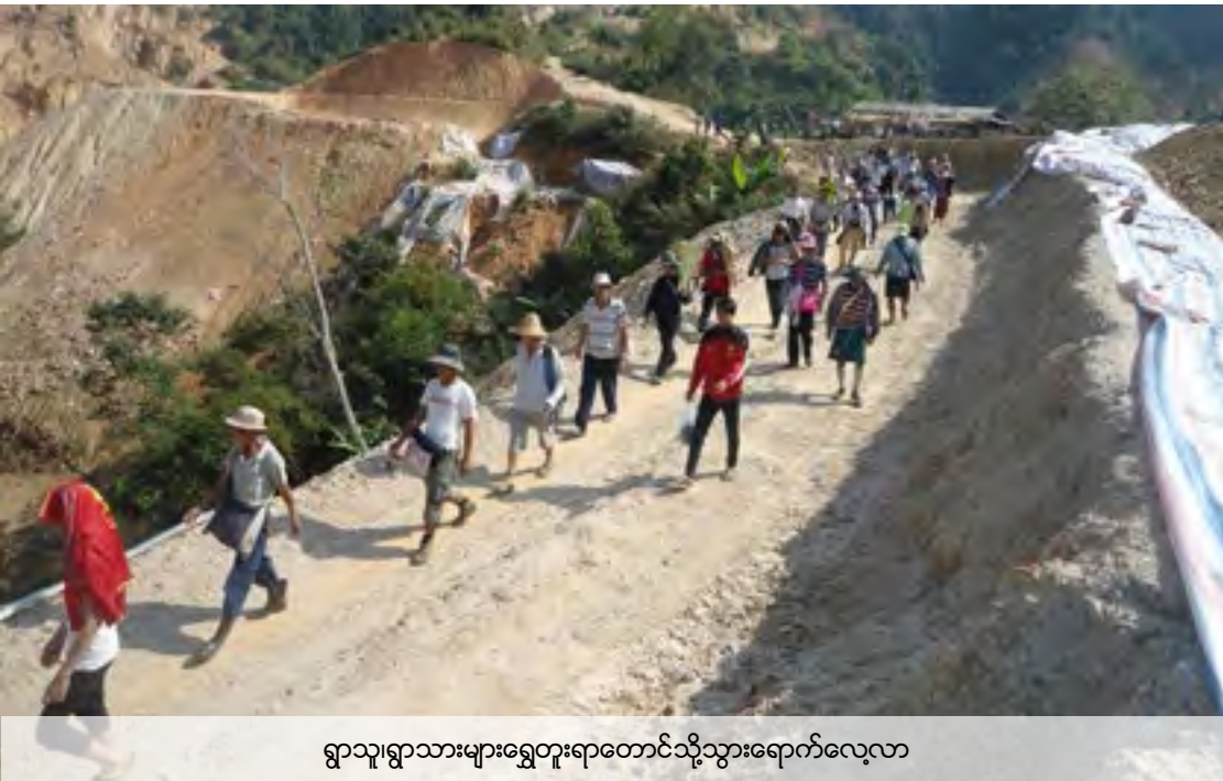
ရွာသူ၊ရွာသားများရွှေတူးရာတောင်သို့သွားရောက်လေ့လာ

၂။ ရေစီးရေလာလမ်းပြုပြင်ရေးကိုထိထိရောက်ရောက်မလုပ်ခြင်း။