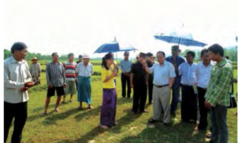
သတ္တုဝန်ကြီး စိုင်းအိုက်ပေါင်း နားဟိုင်းလုံကိုလည်ပတ်

စိုင်းတစ်ကုမ္ပဏီကိုလည်း ကတိအတိုင်း ချောင်းဆယ်ရေးလုပ်ငန်းဆက်လုပ်ရန် စိုင်းဆာလူက ၂၀၁၅ခုနှစ် ဇန်နဝါရီလ ၂၉ရက်နေ့တွင် ပထမအကြိမ် အမိန့်ပေးခဲ့သည်။ စိုင်းတစ်ကုမ္ပဏီသည် မြေညီစက်တစ်စီး ယူလာခါ နမ့်ခမ်းချောင်း၏ အောက်ပိုင်းကို မတ်လ ၁၅ ရက်အထိ ဆယ်သည်။