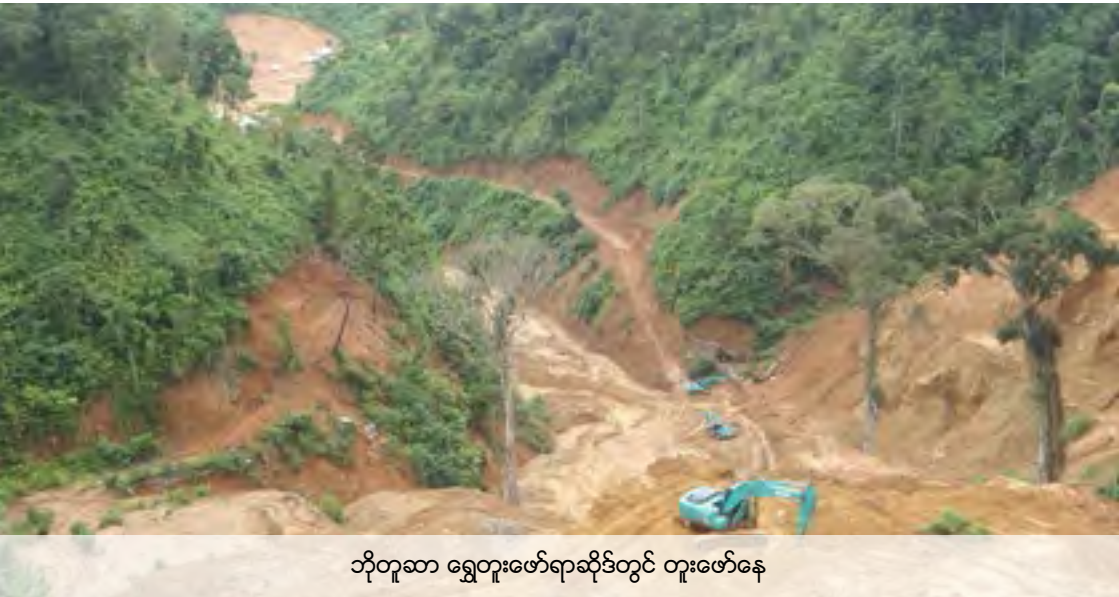
ဘိုတူဆာ ရွှေတူးဖော်ရာဆိုဒ်တွင် တူးဖော်နေ