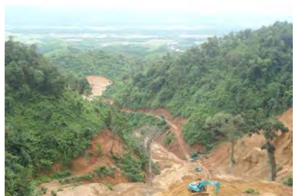
ဘိုတူဆာ ရွှေတူးဖော်ရာဆိုင်တွင် တူးဖော်နေ