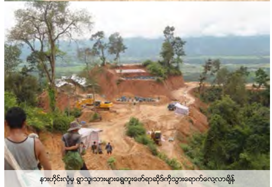
နားဟိုင်းလုံမှ ရွာသူ၊သားများရွှေတူးဖော်ရာဆိုင်ကိုသွားရောက်လေ့လာချိန်