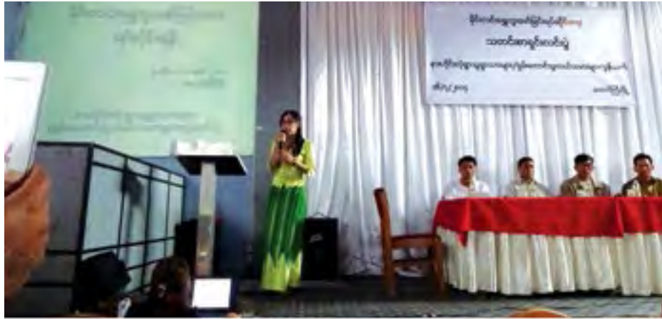
နားဟိုင်းလုံမှရွာသူ၊ရွာသားတောင်ကြီးတွင် ရွှေတူးဖော်မှုနှင့်ပတ်သက်ပြီးသတင်းစာရှင်းလင်းပွဲ