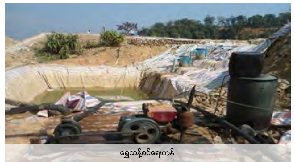
ရွှေသန့်စင်ရေးကန်

မှတ်ချက် - အောက်ပါဇယားတွင်ဖော်ပြထားသောသန့်စင်ကန်များမှာမြေကြီးထဲတွင်တွင်းတူးပြီးပလပ်စတစ်ဖျင်ဖြင့်ခံထားခါရေဖျော်ထားသောဆိုက်အာနိုက်ကိုထည့်ထားသည်။ရလာသောမြေဇာမှ ကျောက်တုံးများကို ရွှေနှင့်ခွဲခြားရန်ဖြစ်သည်။ထိုကန်တို့မှအဆိပ်ရေကို မစစ်တော့ဘဲ အခါအားလျှော့စွာနမ့်ခမ်း ချောင်းထဲထုတ်လွှတ်သဖြင့်အောက်ပိုင်းရှိ နားဟိုင်းလုံရွာသို့စီးဆင်းရောက်ရှိလာသည်။