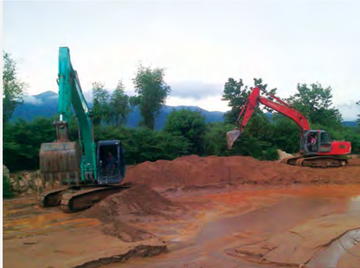
နမ့်ခမ်းချောင်း တွင်းရှိသဲနှုန်းကို ကုမ္ပဏီကကုတ်ထုတ်