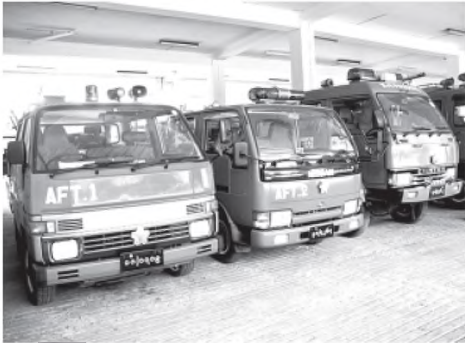
မီးဘေးအန္တရာယ်ကာကွယ်ရန် အသင့်ရှိနေသည့် မီးသတ်ယာဉ်များကို တွေ့ရစဉ်။

မြန်မာနိုင်ငံမီးသတ်တပ်ဖွဲ့၏ စွမ်းဆောင်ရည်မြှင့်တင်မှုနှင့် ခေတ်မီယာဉ်ယန္တရား အထောက်အကူပြုကိရိယာများ ဖြည့်တင်းထားမှုကို မြန်မာနိုင်ငံ မီးသတ်တပ်ဖွဲ့မှ ညွှန်ကြားရေးမှူးချုပ် ဦးတင်ဦးအား တွေ့ဆုံမေးမြန်းခဲ့ပါသည်။