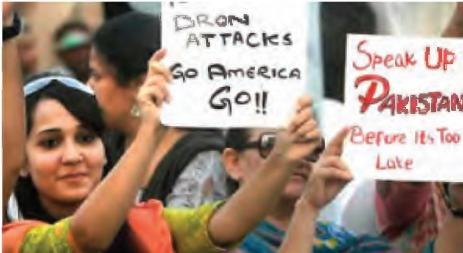
မောင်းသူမဲ့လေယာဉ်ဖြင့် တိုက်ခိုက်မှုများကို ပါကစ္စတန်နိုင်ငံ ဟိုက်ဒရာဘတ်မြို့၌ ကန့်ကွက်ဆန္ဒပြကြစဉ်။

အစ္စလာမာဘတ် မေ ၃၀ အမေရိကန်မောင်းသူမဲ့ လေယာဉ်ဟု ယူဆရသော လေယာဉ်တစ်စင်း၏ တိုက်ခိုက်မှုကြောင့် ပါကစ္စတန်တာလီဘန် အဖွဲ့၏ ခုတိယတပ်မှူးတစ်ဦး သေဆုံးခဲ့ကြောင်း တာလီဘန်သတင်းရပ်ကွက်က ဘီဘီစီသို့ ကြာသပတေးနေ့တွင် ပြောကြားသည်။ ခုတိယတပ်မှူး ဝါလီယာရက်ချ်မန်သေဆုံးခြင်းကို ပါကစ္စတန်တာလီဘန်ခေါင်းဆောင်ပိုင်းက ယခုအချိန်အထိ အတည်မပြုသေးပေ။ စောစောပိုင်းက ပါကစ္စတန်လိုမြို့နေတာဝန်ရှိသူများက အဆိုပါမောင်းသူမဲ့လေယာဉ်တိုက်ခိုက်မှုတွင် သေဆုံးခဲ့ကြသူများအနက် ဒေသဆိုင်ရာ တာလီဘန်တပ်မှူးတစ်ဦးပါဝင်ကြောင်း ပြောကြားသည်။ ပါကစ္စတန်နိုင်ငံ အနောက်မြောက်ပိုင်း ဇီရန်လားမြို့အနီး နေထိုင်သည့် လူကို ဗုဒ္ဓဟူးနေ့ စောစောပိုင်း၌ ခံ့ကျည်ထိခိုက်ခဲ့ခြင်းဖြစ်သည်။ ခြောက်ပတ်နီးပါးကြာအချိန်အတွင်း ပထမဆုံးအကြိမ် တိုက်ခိုက်ခြင်းဖြစ်သည်။ အမေရိကန်သမ္မတ ဘာရက်အိုဘားမားက အမေရိကန်မောင်းသူမဲ့ လေယာဉ်အစီအစဉ်ကို အသေးစိတ် စိစစ်ရန်ညွှန်ကြားခဲ့ပြီး တိကျသော ပစ်ခတ် ရေစည်းမျဉ်းများအတွက်ညွှန်ကြားချက်အသစ်များထုတ်ပြန်ပြီးနောက် ရက်သတ္တ တစ်ပတ်အကြာ ယင်းသို့ တိုက်ခိုက်မှု ပေါ်ပေါက်လာခြင်းဖြစ်သည်။ ဘီဘီစီ။