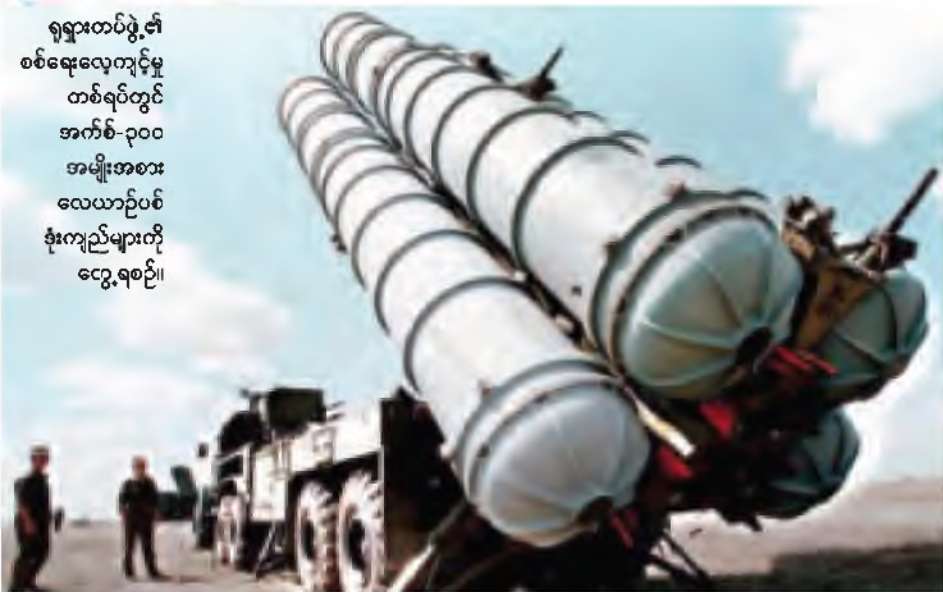
ရုရှားတပ်ဖွဲ့၏ စစ်ရေးလေ့ကျင့်မှု တစ်ရပ်တွင် အက်စ်-၃၀၀ အမျိုးအစား လေယာဉ်ပစ် ခံ့ကျည်များကို တွေ့ရစဉ်။

ဒမတ်စကတ် မေ ၃၀ ဆီးရီးယားနိုင်ငံသည် ရုရှားက သဘောပြု ပေးပို့လိုက်သော ခေတ်မီလေကြောင်းရန် ကာကွယ်ရေးစနစ် ပထမဆုံးအသုတ်ကို လက်ခံရရှိခဲ့ကြောင်း ဆီးရီးယားသမ္မတ ဘာရှားအယ်လ်အာဆာက ကြာသပတေးနေ့နောင်းပိုင်း၌ လက်ဘနွန် ရပ်ဘဲနှင့်တွေ့ဆုံမေးမြန်းခန်းတွင် ပြောကြားခဲ့သည်။ ပထမဆုံးသဘောတူပေးလိုက်သည့် ရုရှားလေယာဉ်ပစ် အက်စ်-၃၀၀ ခံ့ကျည်များကို ဆီးရီးယား ရရှိပါပြီဟု လက်ဘနွန်သတင်းစာ အဲလ်အတ္တဘာက ကြာသပတေးနေ့နောင်းပိုင်း၌ ထုတ်လွှင့်မည့် တွေ့ဆုံမေးမြန်းခန်းကို ကိုးကား၍ ဖော်ပြသည်။ ကျန်ခံ့ကျည်များလည်း မကြာမီရောက်ရှိလာမည် ဟုဆိုသည်။ ဆီးရီးယားအစိုးရသို့ ခံ့ကျည်စနစ်များ ပေးပို့ခြင်းအပေါ် အနောက်အာရှစုက ဆန့်ကျင်ကန့်ကွက်မှုရှိနေသော်လည်း ၎င်းတို့အနေဖြင့် ပေးပို့မည်ဖြစ်ကြောင်း ရုရှားက ပြောဆိုထားပြီးဖြစ်သည်။ ဥရောပသမဂ္ဂက ဆီးရီးယားအပေါ် လက်နက်တင်ပို့ရောင်းချမှု ပိတ်ပင်ထားခြင်းကို သက်တမ်းတိုးခြင်းပြောဆိုသည့်အတွက် အနောက်အာရှစုက သူပုန်များကို လက်နက်ထောက်ပံ့ပေးလျက်ရှိသော အနောက်အာရှစု၏ ကန့်ကွက်မှုကို ပိုမိုအလေးထားခြင်းဖြစ်ဟန်တူသည်။ အမေရိကန်ပြည်ထောင်စု၊ ပြင်သစ်နှင့် အစ္စရေးနိုင်ငံတို့က ဆီးရီးယားသို့ ခံ့ကျည်များပေးပို့ခြင်းကို ရပ်ဆိုင်းရန် ရုရှားအား တောင်းဆိုခဲ့သည်။ ဥရောပသမဂ္ဂ၏ လက်နက်တင်ပို့မှု သက်တမ်းမတိုးခြင်းသည် ဆီးရီးယားအစိုးရနှင့် အတိုက်အခံတို့အကြား ခြိမ်းခြမ်းနေသည့်လက်ခံကျွမ်းပိုင်ရေးအတွက် အမေရိကန်နှင့် ရုရှားတို့ ဦးဆောင်ကြိုးပမ်းနေခြင်းကို ရှုပ်ထွေးမှုဖြစ်စေလိမ့်မည်ဟု ဖော်စကတို့က ပြောကြားသည်။ ရိုက်တာ။