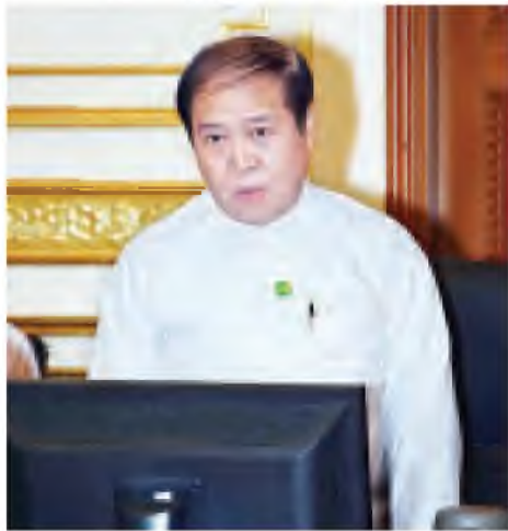
ဝတ်မှုန်ကြီးဌာန ပြည်ထောင်စုဝန်ကြီး ဦးအေးမြင့် စီမံကိန်း ရှေ့ဆက်ဆောင်ရွက်မည့် လုပ်ငန်း အဆင့်များနှင့် ပတ်သက်၍ ရှင်းလင်းတင်ပြစဉ်။ (သတင်းစဉ်)

မြန်မာအထူးစီးပွားရေးဇုန်ဆိုင်ရာ ဗဟိုအဖွဲ့အစည်းအဝေးသို့ တက်ရောက်သူများအား တွေ့ရစဉ်။ (သတင်းစဉ်)