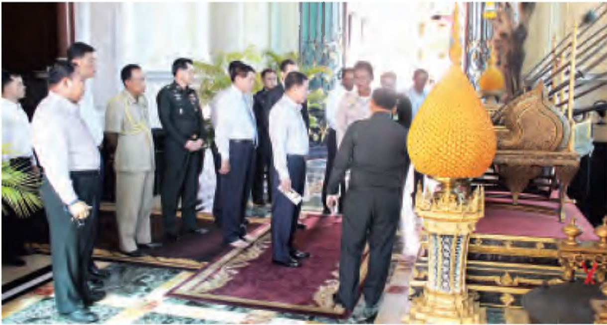
တပ်မတော်ကာကွယ်ရေးဦးစီးချုပ် ဗိုလ်ချုပ်မှူးကြီးမင်းအောင်လှိုင် Grand Palace အတွင်း လှည့်လည်ကြည့်ရှုလေ့လာရာ တာဝန်ရှိသူများက ရှင်းလင်းပြသစဉ်။

နေပြည်တော် မေ ၃၀ တပ်မတော်ကာကွယ်ရေးဦးစီးချုပ် ဗိုလ်ချုပ်မှူးကြီးမင်းအောင်လှိုင် သည် မေ ၂၉ ရက် နံနက်ပိုင်းတွင် ပန်ကောက်မြို့ရှိ Grand Palace သို့ ရောက်ရှိကာ စည်သူတော် မှတ်တမ်းစာအုပ်တွင် လက်မှတ်ရေးထိုးပြီး လှည့်လည်ကြည့်ရှုလေ့လာခဲ့သည်။ ထို့နောက် တပ်မတော်ကာကွယ်ရေးဦးစီးချုပ်သည် မြဘုရားအား