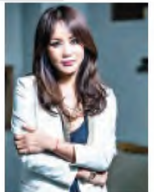
Montage ဇာတ်ကားမှ သရုပ် ဆောင် အမ်ဂျန်ဟွာ။

ယခုလက်ရှိတွင်တောင်ကိုရီးယားနိုင်ငံ ရှင်ရင်ရံများ၌ Fast & Furious ၆ ဇာတ်ကားက ဝင်ငွေအများဆုံးနေရာတွင်လည်းကောင်း၊ လီယိုနာဒို၏ The Great Gatsby ဇာတ်ကားက တတိယနေရာတွင် လည်းကောင်း၊ ဟောလိဝုဒ် နာမည်ကြီးဇာတ်ကား