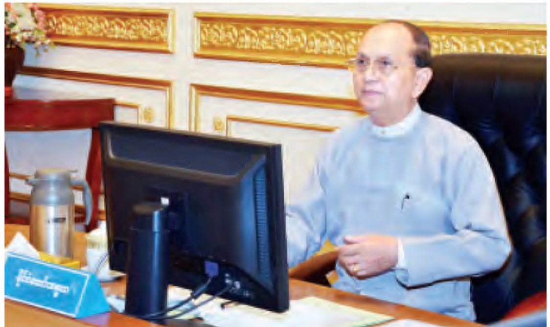
မြန်မာအထူးစီးပွားရေးဇုန်ဆိုင်ရာ ဗဟိုအဖွဲ့ဥက္ကဋ္ဌ နိုင်ငံတော်သမ္မတ ဦးသိန်းစိန် မြန်မာအထူးစီးပွားရေးဇုန်ဆိုင်ရာ ဗဟိုအဖွဲ့ အစည်းအဝေးတွင် အမှာစကားပြောကြားစဉ်။

သို့သော်လည်း ပြီးခဲ့သည့်နှစ်နှစ်တာကာလအတွင်း နိုင်ငံခြားရင်းနှီးမြှုပ်နှံမှု ဥပဒေပေါ်ပေါက် ရောက်ရှိမှုနှင့် စီးပွားရေးပတ်ဝန်းကျင်ဆိုင်ရာများ ပြေလျော့ရေးကိစ္စတို့ကို ကြိုးပမ်းဆောင်ရွက်နေရသည့်အတွက် ပြည်ပရင်းနှီးမြှုပ်နှံမှုလုပ်ငန်းများ နှေးကွေးတုံ့ဆိုင်းခဲ့ပါကြောင်း၊ ယင်းအတားအဆီးများကို ဖယ်ရှား နိုင်မှသာ ရင်းနှီးမြှုပ်နှံမှုများ ဝင်ရောက်လာမည်ဖြစ်သည့်အတွက် နှစ်နှစ်တာကာလကျော်သည်အထိ EU နိုင်ငံများမှ စီးပွားရေးပတ်ဝန်းကျင်ဆိုင်ရာဆောင်ရွက်ခဲ့ရသည့်အပြင် အမေရိကန် အစိုးရ၏ ပြေလျော့ပေးမှုများကိုလည်း စာမျက်နှာ ၃ ကော်လံ ၁ သို့ ○