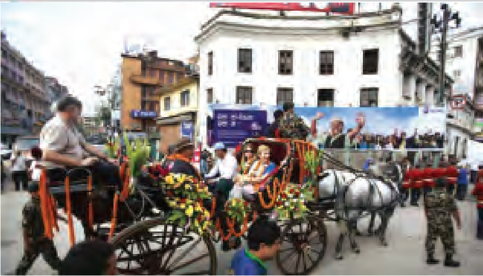
ဝေရက်တောင်ထွတ်ပေါ်သို့ လူသားခြေချနိုင်မှုအထိမ်းအမှတ်အဖြစ် စီတန်းလှည့်လည်ပွဲ ပြုလုပ်စဉ်။