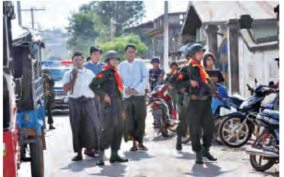
ရှမ်းပြည်နယ် လားရှိုးမြို့၌ အုပ်ချုပ်ရေးအဖွဲ့အစည်းများ၊ ဘာသာရေး၊ လူမှုရေးအဖွဲ့အစည်းများ၊ ပြည်သူများနှင့် လုံခြုံရေးတာဝန်ရှိသူများက ဝိုင်းဝန်းထိန်းသိမ်းဆောင်ရွက်နေစဉ်။ (သတင်းစဉ်)

လူစုလူဝေးများသည် အမှတ်(၃) ရပ်ကွက် လမ်းမတော်လမ်းနှင့် ကြာနီလမ်းထောင့်ရှိ မိဘမဲ့ကလေးများ ကျောင်းအောက်ရှိ ဈေးဆိုင်ခန်းများ၊