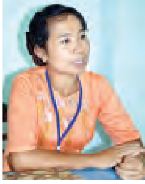
ဒေါ်ဆွေဇင်အိ ဒုတိုင်းရင်းဆေးမှူး