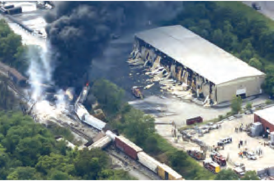
ဘော်လံတီမိုးမြို့အနီးတွင် လမ်းချော်သည့် ကုန်ရထားတစ်စင်း မီးလောင်လျက်ရှိစဉ်။