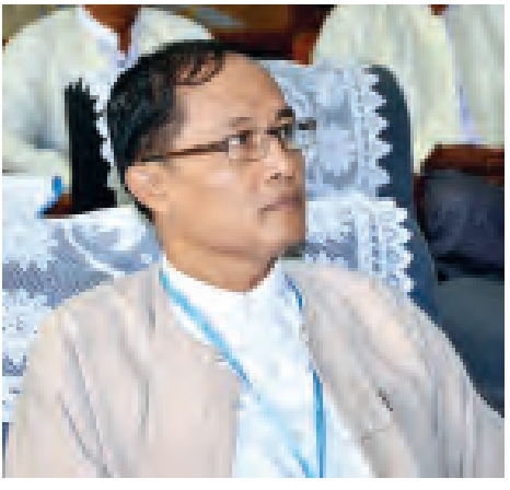
ဒေါက်တာ သန်းမောင် ပါမောက္ခချုပ် မန္တလေး တိုင်းရင်းဆေး တက္ကသိုလ်

မြန်မာတိုင်းရင်းဆေး ဖွံ့ဖြိုးတိုးတက်လာစေရန်နှင့် ပြည်သူများအား တိုင်းရင်းဆေးဖြင့် ကျန်းမာရေးစောင့်ရှောက်မှုပေးနိုင်ရန် တိုင်းရင်းဆေးပညာအခန်းကဏ္ဍကို အားပေးမြှင့်တင်လျက်ရှိသည်။ မြန်မာတိုင်းရင်းဆေး တိမ်ကောပပျောက်မသွားစေရန်အတွက် တိုင်းရင်းဆေးပညာရှင်များ၊ တိုင်းရင်းဆေးသုတေသီများ အဖွဲ့အလိုက်၊ တစ်ဦးချင်းအလိုက် သုတေသနပြုကြိုးပမ်း ဖော်ထုတ်နေကြသည်ကို မေ ၂၇ ရက်၊ ၂၈ ရက်က မန္တလေးတိုင်းရင်းဆေးတက္ကသိုလ်တွင်ကျင်းပသော စတုတ္ထအကြိမ် တိုင်းရင်းဆေးသုတေသန စာတမ်းဖတ်ပွဲတွင် တွေ့မြင်ခဲ့ရသည်။