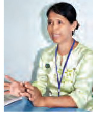
ဒေါ်မြင့်မြင့်စန်း သစ်တောသုတေသန