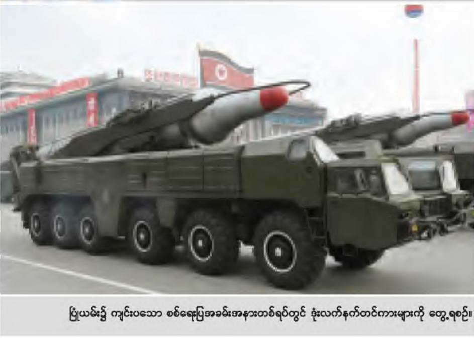
ပြည်ထောင်စုတစ်ခုလုံးအတွက် စစ်ရေးအခန်းကဏ္ဍတစ်ခုတွင် ဗိုလ်ချုပ်တပ်ကားများကို တွေ့ရစဉ်။