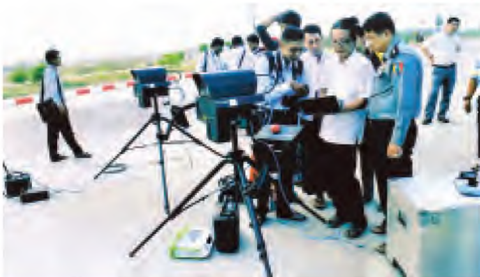
အမြန်လမ်းတစ်လျှောက်၌ ယာဉ်မတော်တဆမှုများ ဝပျောက်အောင် မော်တော်ယာဉ်အချိန်ထိန်းတိုင်းတာသည့် တိရိယာများ တပ်ဆင်စာသုံးပြုနေမှုကို ဤသို့ တွေ့ရစဉ်။

သတင်းဆောင်သစ်နှင့် ဓာတ်ပုံ သရုပ်ဆွဲခြင်း