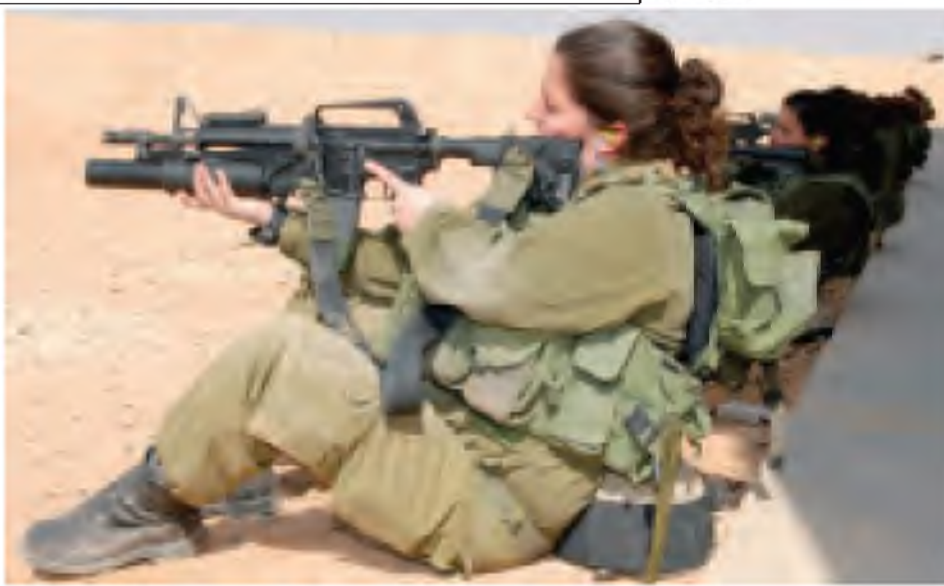
အစ္စရေးကာကွယ်ရေးတပ်ဖွဲ့မှ စစ်သမီးများကို တွေ့ရစဉ်။