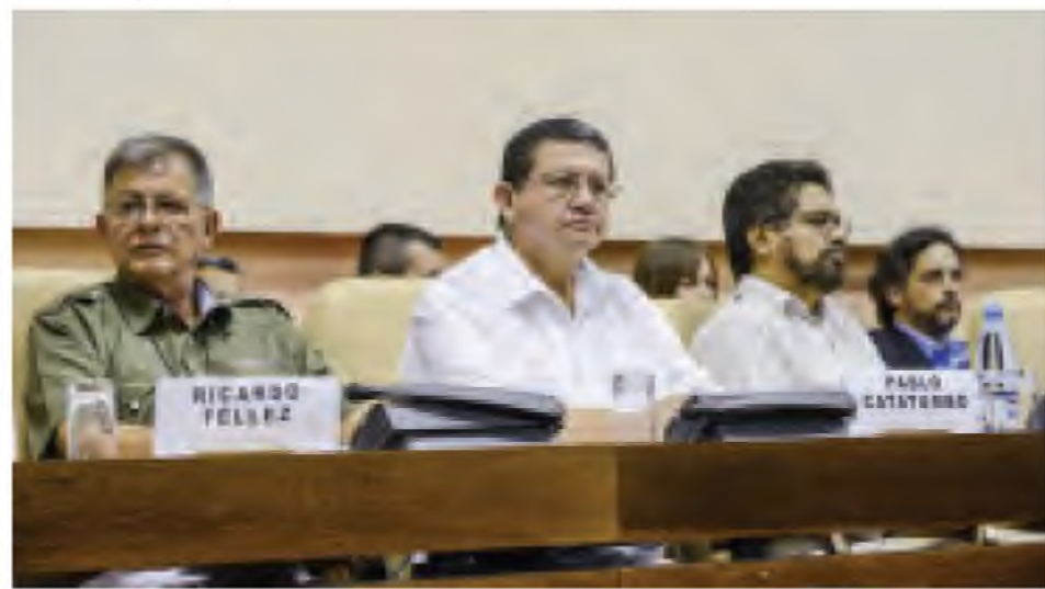
ကိုလံဘီယာအစိုးရနှင့် လက်ဝဲသူပုန်အဖွဲ့တို့ ငြိမ်းချမ်းရေးဆွေးနွေးပွဲကျင်းပစဉ်။

ဘိုဂိုဒါ မေ ၂၇ ကိုလံဘီယာအစိုးရနှင့် လက်ဝဲယမ်း အက်မ်အေအာစီသူပုန်များသည် ခြိမ်းခြမ်းရေးဆွေးနွေးပွဲကျင်းပပြီးနောက် ဖြေယာပြုပြင်ပြောင်းလဲရေး ပြုလုပ်ရန် သဘောတူညီခဲ့ကြသည်ဟု မေ ၂၇ ဘီဘီစီသတင်းတွင် ဖော်ပြသည်။