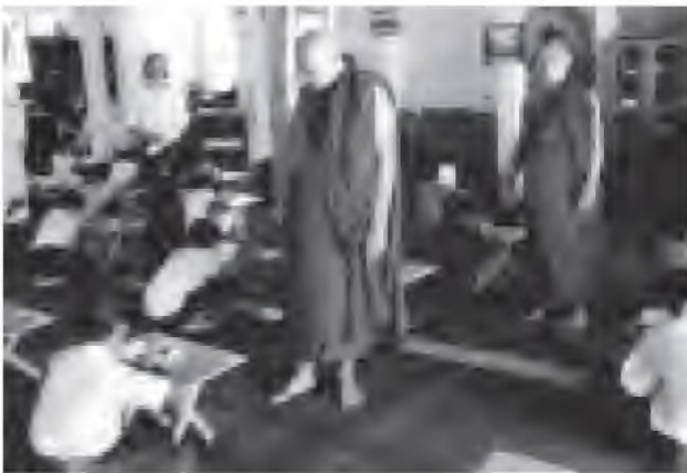
ပုဇွန်တောင်မြို့နယ်၌ ယဉ်ကျေးမှုစာမေးပွဲကျင်းပနေသည့် အခါ။ ရန်ကုန် အရှေ့ပိုင်းခရိုင် မြသိန်းတန် ပရိယတ္တိစာသင်တိုက်ရှိ စာမေးပွဲနေ့တွင်လည်း ကျောင်းသား (ဝေဒနာရှင်)များ ဝင်ရောက်ဖြေဆိုကြကြောင်း သိရသည်။ (အပေါ်ပုံ)

နိုင်ငံတော် သံဃမဟာနာယက အဖွဲ့က ကြီးပွားကျင်းပသော ပုဇွန်တောင် ယဉ်ကျေးမှုစာမေးပွဲကို မေ ၂၅ ရက် မှ ၂၇ ရက်အထိ သုံးရက်တိုင်တိုင် တိုင်းဒေသကြီးများနှင့် ပြည်နယ်များရှိ မြို့နယ်အသီးသီး၌ ကျင်းပလျက်ရှိရာ ပထမနေ့တွင် ယဉ်ကျေးမှုကျင့်ဝတ် ဘာသာ၊ ဗုဒ္ဓဘာသာ ဖြစ်ပေါ်လာမှု၊ ဘာသာ၊ တရား၊ ဘာသာရပ်များ ဖြေဆိုခဲ့ကြကြောင်း သိရသည်။