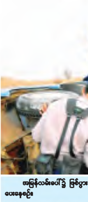
အမြန်လမ်းမကြီး ပြန်ပွားခဲ့သော ယာဉ်မော်တော်တစ်စီးအား အမြန်လမ်းရံတပ်ဖွဲ့မှ ကူညီမှုပေးနေစဉ်။

စီးရေ ၈၆၀ စီးအရေးယူဆောင်ရွက်ခဲ့ရကြောင်း၊ ထိုသို့ အရေးယူဆောင်ရွက်ရာ၌ အင်းစိန်ယာဉ်စည်းကမ်း၊ တရားရုံး၊ နေပြည်တော် ယာဉ်စည်းကမ်းတရားရုံး၊ မန္တလေးတိုင်းဒေသကြီး ယာဉ်စည်းကမ်းတရားရုံး စီနင်းသူများအား ပညာပေးကာလ နှစ်ပတ်သတ်မှတ်၍ ဖမ်းဆီးပြီး ပြန်လည်လွှတ်ပေးခဲ့ကြောင်း၊ ပညာပေးတာဝန်များကို အမြန်လမ်းမကြီးပေါ်၌ ဆိုင်ကယ်စီးနင်းသူများအား ဖမ်းဆီး၍ တရားစွဲဆို အပြစ်ပေးအရေးယူမှုများ ပြုလုပ်ခဲ့ရာ ၁-၁-၂၀၁၃ ရက်နေ့မှ ၂၀-၅-၂၀၁၃ ရက်နေ့အထိ ဆိုင်ကယ်စီးရေ ၂၀၈၈ စီးအရေးယူနိုင်ခဲ့ကြောင်း၊