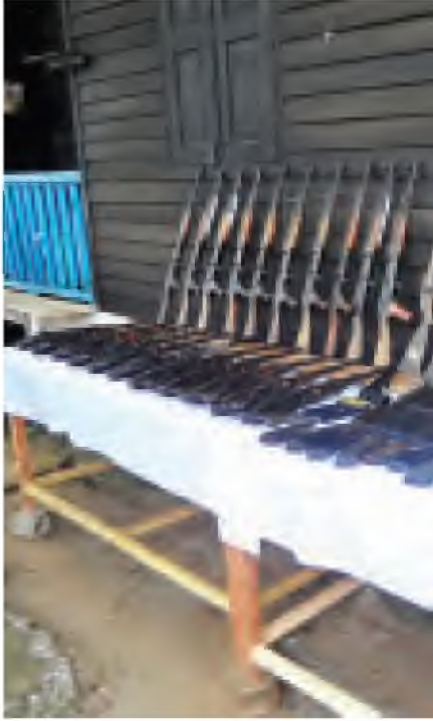
၈၈ ၂၃ ရက် တ သိန်းနဲ့ဖြန့်နယ် ဝိုင်းလံကျော့မှ ရရှိသည့် လက်နက်ခဲယမ်းများ ဖုတ်တစ်ခတ်တို

ဆက်လက်၍ သတင်းဖော်ထုတ်ချက်များအရ နားဆော့ ဘုန်းကြီးကျောင်း ခြံစည်းရိုးအပြင်ဘက်တွင် အခဲ ၂၂ လက်နက်ငယ် ၁၀ လက်၊ ၅ ဒဏ်မ ၅၆ ကျည်