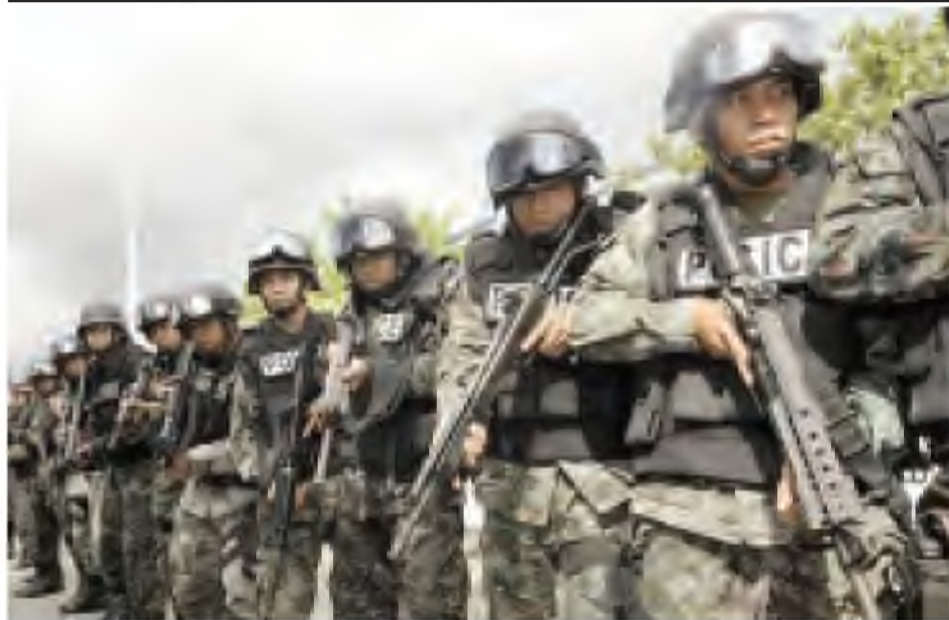
ဖိလစ်ပိုင်နိုင်ငံ ကာဂါယန်ပြည်နယ်၌ ကွန်မန်ဒိုရဲတပ်ဖွဲ့ဝင်များကို တွေ့ရစဉ်။

အက်မ်အေအာစီညှိနှိုင်းရေးခေါင်းဆောင် အီတန်မာ ကွက်(စ်)က မမြေရှင်းရသေးသော ပြဿနာများကျန်ရှိနေဆဲ ဖြစ်ကြောင်း၊ ဆက်လက်ဆွေးနွေးခြင်းဖြင့် သဘောတူညီမှု ရရှိမည်ဖြစ်ကြောင်း ပြောကြားခဲ့သည်။ ဘီဘီစီ။