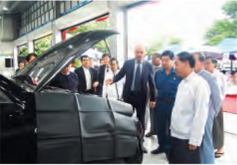
ရန်ကုန်တိုင်းဒေသကြီး ဝန်ကြီးချုပ် ဦးမြင့်ဆွေနှင့် အဖွဲ့ဝင်များ Mitsubishi Motor Service Station အတွင်း ကြည့်ရှုစဉ်။ (သတင်းစဉ်)

○ ရွှေ့ဖို့မှ အမှတ်အသားများ၊ ညအခါ လင်းလက်ပြီး တွေ့ရန်လမ်းညွှန်ပြပေးသည့် အလိုအလျောက် မီးလုံးများ၊ မီးခြောက်များ၊ ရောင်ပြန်လမ်းညွှန် အမှတ်အသားများ အမြန်လမ်းတစ်လျှောက် ထားရှိသလို ယခုအခါ အမြန်လမ်းရံတပ်ဖွဲ့တို့လည်း ဖွဲ့စည်းတာဝန်ပေးခဲ့ပြီး အမြန်လမ်းတစ်လျှောက် လုံခြုံရေးတာဝန်များနှင့် ယာဉ်စည်းကမ်း၊ လမ်းစည်းကမ်း ထိန်းသိမ်းရေးတာဝန်များကို ထမ်းဆောင်လျက်ရှိရာ