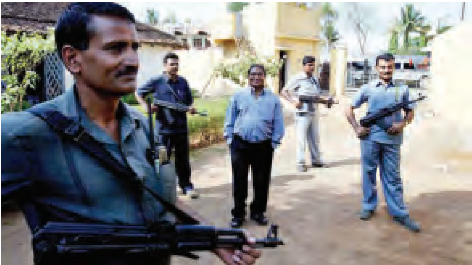
ကွန်မြူနစ်သူပုန်အဖွဲ့အား တိုက်ခိုက်ရန် ဖွဲ့စည်းထားသည့် ပြည်သူ့စစ်အဖွဲ့ဝင်များကို တွေ့ရစဉ်။

မနီလာ မေ ၂၆ ဖိလစ်ပိုင်နိုင်ငံတောင်ပိုင်းတွင် မေ ၂၇ ရက်က ဖိလစ်ပိုင်အစိုးရကမ်းတက် တပ်ဖွဲ့ဝင်များနှင့် အဘူဆေယက်ဖ်လက်နက်ကိုင်အုပ်စု၏ တပ်ဖွဲ့ဝင်များ တိုက်ခိုက်မှုဖြစ်ပွားရာ ကမ်းတက်တပ်ဖွဲ့ဝင်ငါးဦးနှင့် စစ်သွေးကြွင်းဦးတို့ သေဆုံးကြောင်း ဖိလစ်ပိုင်စစ်ဘက်က ပြောကြားသည်။ တိုက်ခိုက်မှုတွင် ဖိလစ်ပိုင်အစိုးရကမ်းတက်တပ်ဖွဲ့ဝင်ကိုးဦးနှင့် အဘူဆေ ယက်ဖ် လက်နက်ကိုင်အဖွဲ့မှအဖွဲ့ဝင်လည်းထိခိုက်ဒဏ်ရာရရှိကြောင်း ဖိလစ်ပိုင် တပ်ဖွဲ့မှ ဒေသဆိုင်ရာတပ်မှူးတစ်ဦးက ပြောကြားသည်။ အဘူဆေယက်ဖ်အဖွဲ့ ဟုအမည်ရှိသည့် အစ္စလာမစ်စစ်သွေးကြွလက်နက်ကိုင်အဖွဲ့သည် မကြာသေးမီ က ပြန်ပေးဆွဲမှုများပြုလုပ်ပြီး ပြန်ပေးရွေးငွေများတောင်းခံခဲ့သည်ဟုဆိုသည်။ ဖိလစ်ပိုင်ကမ်းတက်တပ်ဖွဲ့များက အဘူဆေယက်ဖ် လက်နက်ကိုင်အဖွဲ့ကို လိုက်လံရှာဖွေလျက်ရှိသည်။ ယင်းဒေသတွင် မကြာသေးမီက ဖြစ်ပွားခဲ့သော ပြန်ပေးဆွဲမှုများ၏ နောက်ကွယ်တွင် ၎င်းတို့ရှိနေမည်ဟု ယုံကြည်ရသည်။ အေဘီ။