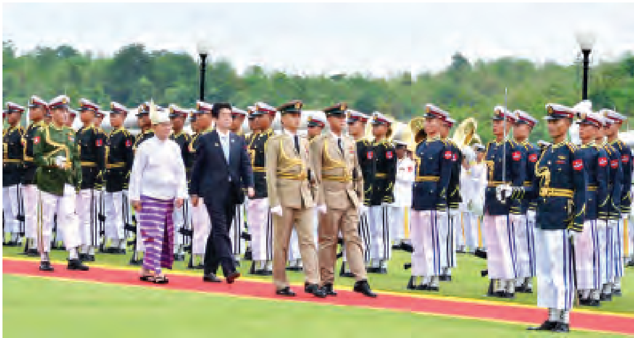
နိုင်ငံတော်သမ္မတ ဦးသိန်းစိန်နှင့် ဂျပန်နိုင်ငံဝန်ကြီးချုပ် မစ္စတာ ရှင်ဒိုအာဘေးတို့ ဂုဏ်ပြုတပ်ဖွဲ့ကို စစ်ဆေးကြစဉ်။