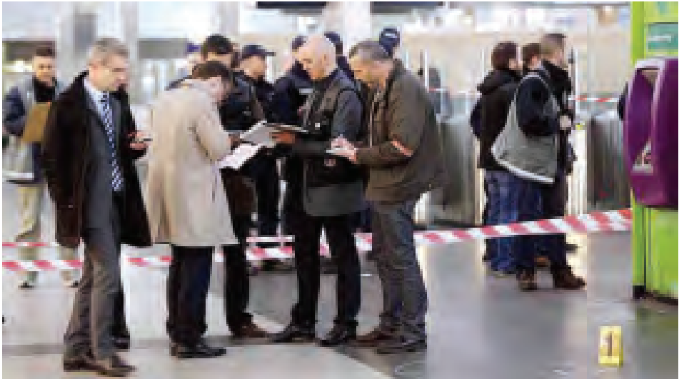
ရဲတပ်ဖွဲ့များနှင့် ကျွမ်းကျင်သူများ အခင်းဖြစ်ပွားနေရာ၌ စစ်ဆေးမှုများ ပြုလုပ်နေကြစဉ်။

အသက် ၂၃နှစ်အရွယ် ပြင်သစ် စစ်သားကို ဓားဖြင့်ထိုးသည့် အခင်း ဖြစ်နေရာမှ ထွက်ပြေးသွားခဲ့ပြီး ယင်း ဖြစ်ရပ်သည် မေ ၂၅ရက် ဖွန်းလွှဲပိုင်း တွင် ကာဒီဖန်အမည်ရှိ စီးပွားရေး ဆိုင်ရာ ရပ်ကွက်တွင် ဖြစ်ပွားခဲ့ခြင်းဖြစ် သည်။ ဓားဖြင့် အထိုးခံရသူ ပြင်သစ် စစ်သားမှာ စစ်ဝတ်စုံအပြည့်ဝတ်ဆင် ထားပြီး လက်နက်ကိုင်ထားသူဖြစ် ကြောင်း၊ ပြင်သစ်စစ်တပ်၌ အကြမ်း ဖက်နှိမ်နင်းရေးအစီအစဉ်အရ ကမ္ဘာ လှည့်ခရီးသည်များ ထူထပ်ရာနေရာ၊ စီးပွားရေးလုပ်ငန်းများနှင့် ပို့ဆောင် ရေးငှာများရှိရာ မြို့တော်တစ်ခုတွင် ဖြန့်ကြက်လှုပ်ရှားနေသည့်တပ်ဖွဲ့မှ ဖြစ်ကြောင်း သတင်းတွင် ဖော်ပြထား သည်။ အေအက်ဖ်ဘီ။