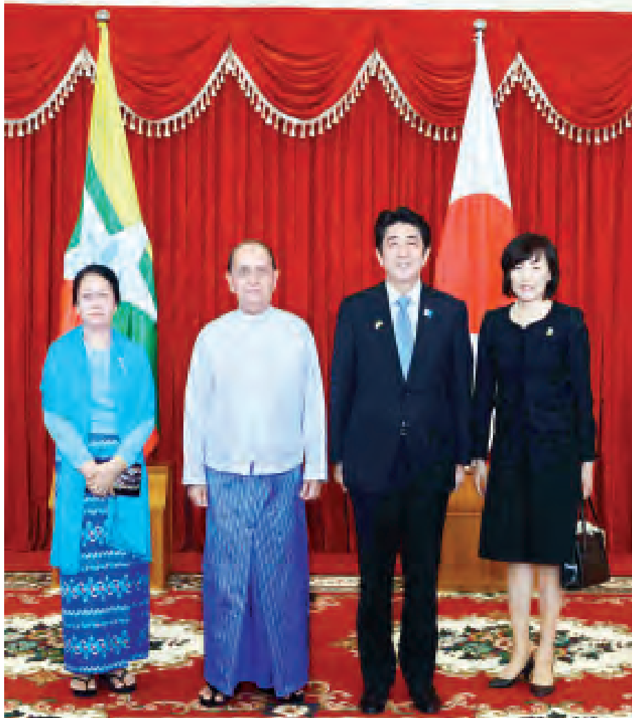
နိုင်ငံတော်သမ္မတ ဦးသိန်းစိန်နှင့် ဇနီး ဒေါ်ခင်ခင်ဝင်း ဂုဏ်ပြု နေ့လယ်စာစားပွဲသို့ တက်ရောက်လာသည့် ဂျပန်နိုင်ငံဝန်ကြီးချုပ်နှင့် ဇနီးတို့ မှတ်တမ်းတင်ဓာတ်ပုံရိုက်ကြစဉ်။ (သတင်းစဉ်)