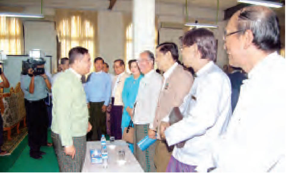
မြန်မာနိုင်ငံ စာကြည့်တိုက်များ ဖောင်ဒေးရှင်းနာယက၊ ပြန်ကြားရေးဝန်ကြီးဌာန ပြည်ထောင်စုဝန်ကြီး ဦးအောင်ကြည် မြန်မာနိုင်ငံစာကြည့်တိုက်များ ဖောင်ဒေးရှင်း စာကြည့်တိုက်များအတွက် အလှူငွေနှင့် စာအုပ်စာပေများ ပေးအပ်လှူဒါန်းပွဲ တက်ရောက်လာကြသူများအား ရင်းရင်းနှီးနှီး နှုတ်ဆက်စဉ်။ (သတင်းစဉ်)

စာကြည့်တိုက်များ ဖွံ့ဖြိုးတိုးတက်အောင် ယခုကဲ့သို့ အလှူငွေများ၊ စာအုပ်စာပေများ ပေးအပ်လှူဒါန်းခဲ့ကြသည့် စေတနာရှင်၊ အလှူရှင်များကိုလည်း လှိုက်လှဲစွာကျေးဇူးတင်ရှိကြောင်းဖြင့် ပြောကြားသည်။ ထို့နောက် မြန်မာနိုင်ငံ စာကြည့်တိုက်များ ဖောင်ဒေးရှင်း ဥက္ကဋ္ဌ ဦးမောင်မောင်က မြန်မာနိုင်ငံတစ်ဝန်းလုံးတွင် ဖွင့်လှစ်ထားသည့် စာပေရေချမ်းစင်များ ရှင်သန်ဖွံ့ဖြိုးရေးအတွက် ငွေကျပ် ၁၇၂၈၀၀၀ ကို ပေးအပ်လှူဒါန်းရာ ပြန်ကြားရေးဝန်ကြီးဌာန ပြည်ထောင်စုဝန်ကြီး ဦးအောင်ကြည်က လက်ခံသည်။