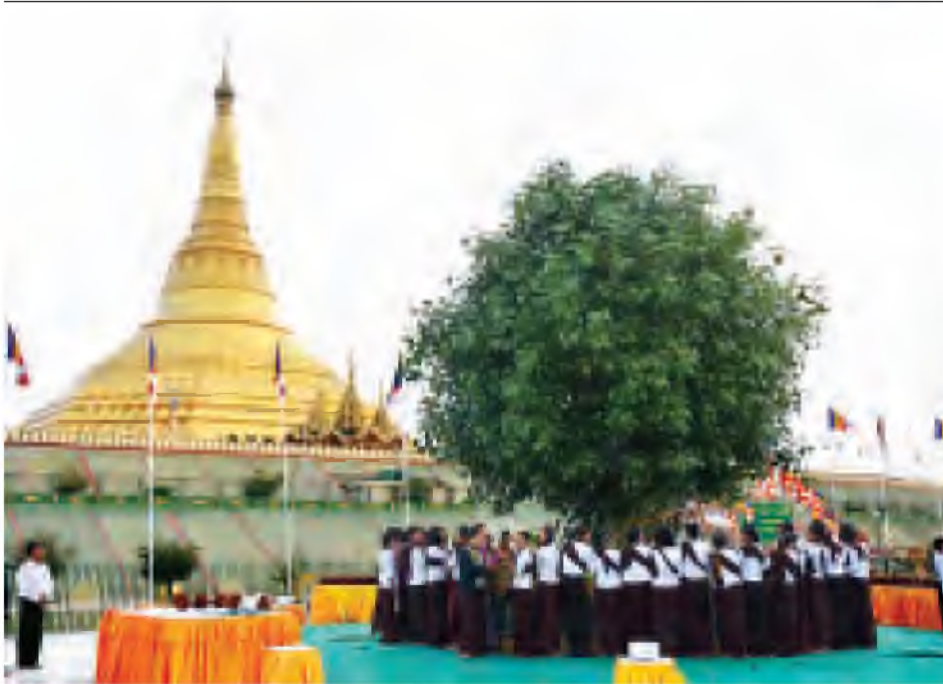
ကဆုန်လပြည့် (ပုဗ္ဗနေ)တွင် နေပြည်တော်ရှိ ဥပ္ပါတသန္တိစေတီတော်မြတ်ကြီး ပရိဝုတ်အတွင်းရှိ မဟာဗောဓိညောင်ပင်အား ကဆုန်ညောင်ရေသွန်းလောင်းပူဇော်ကြစဉ်။ (သတင်းစဉ်)