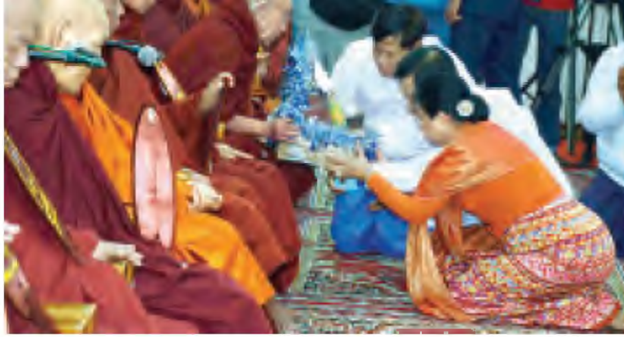
တပ်မတော်ကာကွယ်ရေးဦးစီးချုပ် ဗိုလ်ချုပ်မှူးကြီးမင်းအောင်လှိုင်နှင့် ဇနီး ဒေါ်ကြူကြူလှတို့ လှူဖွယ်ပစ္စည်းများအား ဆရာတော်ထံ ဆက်ကပ်လှူဒါန်းစဉ်။ (သတင်းစဉ်)