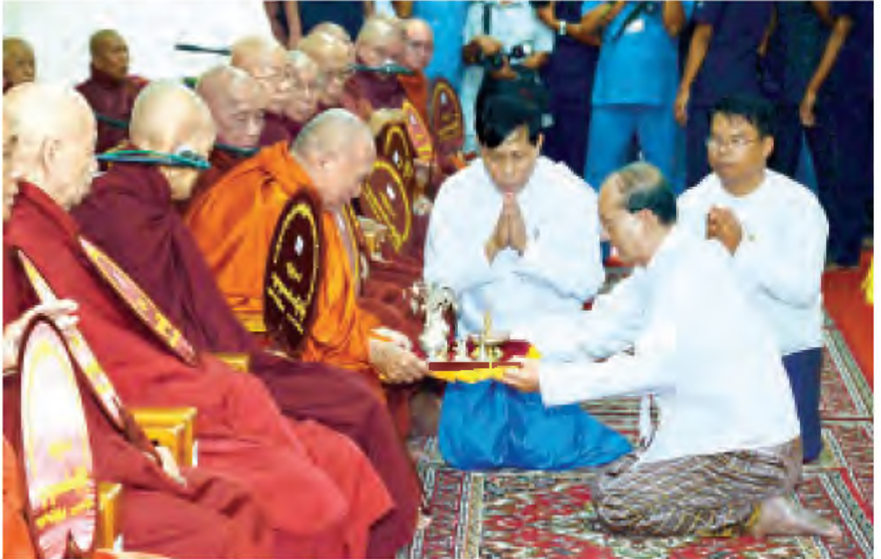
နိုင်ငံတော်သမ္မတ ဦးသိန်းစိန် ရတနာစိန်ဖူးတော်၊ ရွှေထီးတော်နှင့် သတ္တသတ္တာဟ မဟာဗောဓိစေတီတော်မြတ်ကြီးအား သာယာဏိကဒါနမြောက်အောင် ဆက်သွယ်စီစဉ်ထားသည့် အထက်ဌာပနာရုပ်ပွားတော်များအား ဗန်းမော်ကျောင်းတိုက်ဆရာတော်ကြီးထံ ဆက်ကပ်လှူဒါန်းစဉ်။ (သတင်းစဉ်)

ထို့နောက် နိုင်ငံတော်သမ္မတနှင့် ဇနီးတို့က အခမ်းအနားအောင်မြင်မှုအထိမ်းအမှတ်အဖြစ် ရတနာရွှေမိုး၊ ငွေမိုးများ သွန်းပြီးပေးကြသည်။