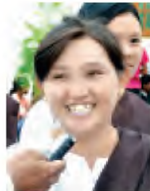
ထန်းတောကြီးဝတ်အဖွဲ့ (တပ်တန်းမြို့နယ်)

ထူးခြားချက်မှာကား ဓေတီတော် မြတ်ကြီး၏ ဌာပနာတော်တိုက် အတွင်း၌ သီရိလင်္ကာနိုင်ငံတွင် ကိန်းဝပ်စံပယ်တော်မူသည့် မြတ်ဗုဒ္ဓ ၏ စွယ်တော်ပွားတစ်ချု၊ တရုတ်ပြည် သုဿမ္မတနိုင်ငံမှ ဗုဒ္ဓမြတ်စွယ်တော် ကို ပွားယူထားသည့် စွယ်တော်ပွား တစ်ဆူနှင့် ရန်ကုန်မြို့ ဝိဿိတထောင့် ဓေတီတော်တွင် ကိန်းဝပ်စံပယ်တော်