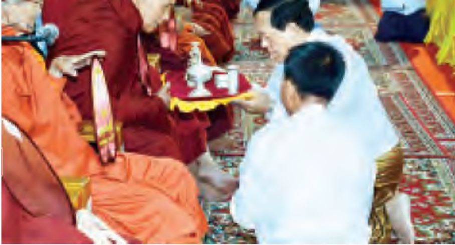
ပြည်ထောင်စုတရားသူကြီးချုပ် ဦးထွန်းထွန်းဦး ဌာပနာတော်များအား ဆရာတော်ထံ ဆက်ကပ်လှူဒါန်းစဉ်။ (သတင်းစဉ်)