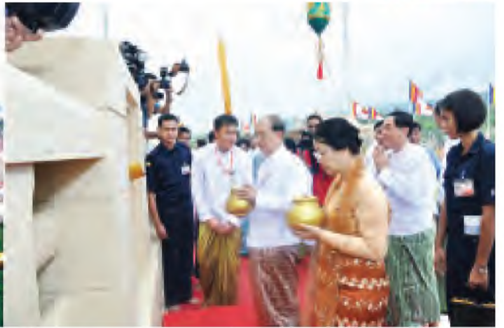
နိုင်ငံတော်သမ္မတ ဦးသိန်းစိန်နှင့် အဖွဲ့ဝင်များ သတ္တသတ္တာဟ မဟာစေတီတော်ရှိ မဟာဗောဓိ ညောင်ပင်အား ညောင်ရေသွန်းလောင်းပူဇော်ကြစဉ်။ (သတင်းစဉ်)