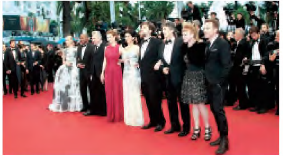
ကိန်းနိုင်ငံတကာရုပ်ရှင်ပွဲတော်သို့ တက်ရောက်လာကြသည့် အနုပညာရှင်များနှင့် ရုပ်ရှင်ချစ်ပရိသတ်များ။

အဆိုပါ လေဆင်နှာမောင်းတိုက်ခတ်မှုကြောင့် လူနေအိမ်အလုံး ၁၃၀၀၀ ခန့် ပျက်စီးခဲ့ပြီး ပျက်စီးမှုတန်ဖိုး အမေရိကန်ဒေါ်လာ နှစ်ဘီလီယံကျော်အထိ ရှိနိုင်ကြောင်း တာဝန်ရှိသူတစ်ဦးက မေ ၂၂ ရက်တွင် ပြောကြားခဲ့သည်။