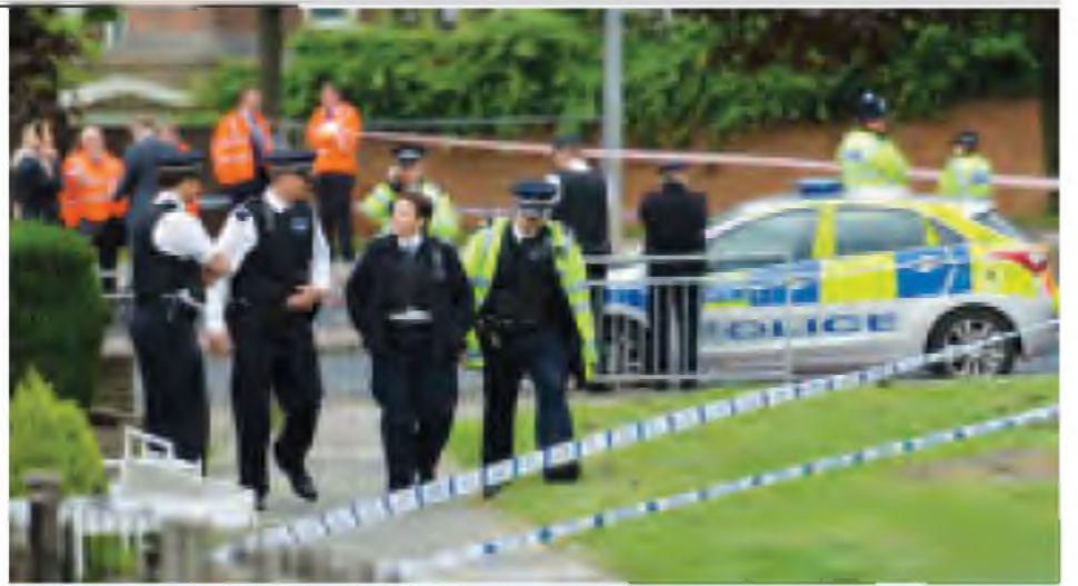
လူသတ်မှုဖြစ်ပွားခဲ့သည့် နေရာကို ဝိတ်ဆို၍ ခဲတပ်ဖွဲ့က စုံစမ်းစစ်ဆေးမှုများ ပြုလုပ်လျက်ရှိပါသည်။