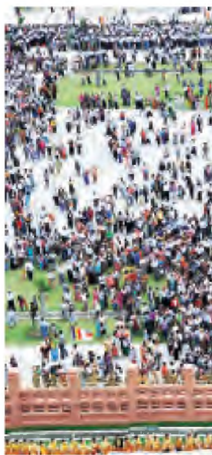
သတ္တသတ္တာဟ မဟာဓေတီတော်မြတ်အာခမ်းအနား စည်ကားသိုက်မြိုက်စွာ ကျင်းပစဉ်။

ခင်းကျင်းပြသထားသော မြတ်ဗုဒ္ဓ၏ မဇ္ဈိမခရီးစဉ်ဓာတ်ပုံပြခန်းကို လှည့်လည်ကြည့်ညိကြပြီး သတ္တသတ္တာဟ မဟာဓေတီစေတီတော်ရှိ မဟာဓေတီညောင်ပင်၊ အပေါ်လညောင်ပင်နှင့် လင်းလွန်းပင်တို့အား ညောင်ရေသွန်းလောင်းပူဇော်ကြသည်။