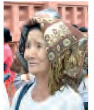
အဘွားခေါ် ခိုခို (ဒဟတ်ကုန်ကော့ရာ တပ်ကုန်မြို့နယ်)

သဒ္ဓါမရှိသည့် မြန်မာတို့၏ခြေ တွင် သုံးလောကထွတ်တင် ခြတ်ပုဒ် အရှင်၏ ဂုဏ်ကျေးဇူးတော်တို့ကို ဥဒ္ဓိဿရည်မှန်းကာ ဓါတုစေတီ၊ ဓမ္မစေတီ၊ ပရိဘောဂစေတီ၊ ဥဒ္ဓိဿ စေတီဟူ၍ စေတီပထီးများစွာ တည်