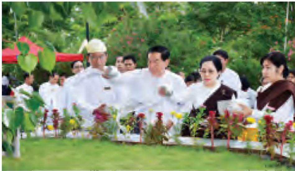
နေပြည်တော်ရှိ ဥပ္ပါတသန္တီစေတီတော်မြတ်ကြီး ပရိသတ်အတွင်းရှိ မဟာဗောဓိညောင်ပင်များအား သဗ္ဗကဏ္ဍ ဝန်ကြီးဌာန၊ ပြည်ထောင်စုဝန်ကြီး ဦးသိန်းညွန့်၊ ညောင်ရေသွန်းလောင်းပူဇော်စဉ်။ (သတင်းစဉ်)

နေပြည်တော်ရှိ ဥပ္ပါတသန္တီစေတီတော်မြတ်ကြီး ပရိသတ်အတွင်းရှိ မဟာဗောဓိ ညောင်ပင်များအား ပဉ္စမအကြိမ် ကဆုန်ညောင်ရေသွန်းလောင်းပူဇော်ခြင်း မင်္ဂလာအခမ်းအနားကို ယနေ့ညနေ ၅ နာရီတွင် အဆိုပါ မဟာဗောဓိပင်များ၌ စည်ကားသိုက်မြိုက်စွာ ကျင်းပရာ မြတ်စွာဘုရားရှင်အား ရည်မှန်း၍ မဟာဗောဓိပင်များတွင် တဆန်ညောင်ရေသွန်းလောင်းကြသူများ၊ အနယ်နယ်အရပ်ရပ်မှ ဘုရားဖူးလာပြည်သူများ၊ ကုသိုလ်ပုညပြုကြသူများ၊