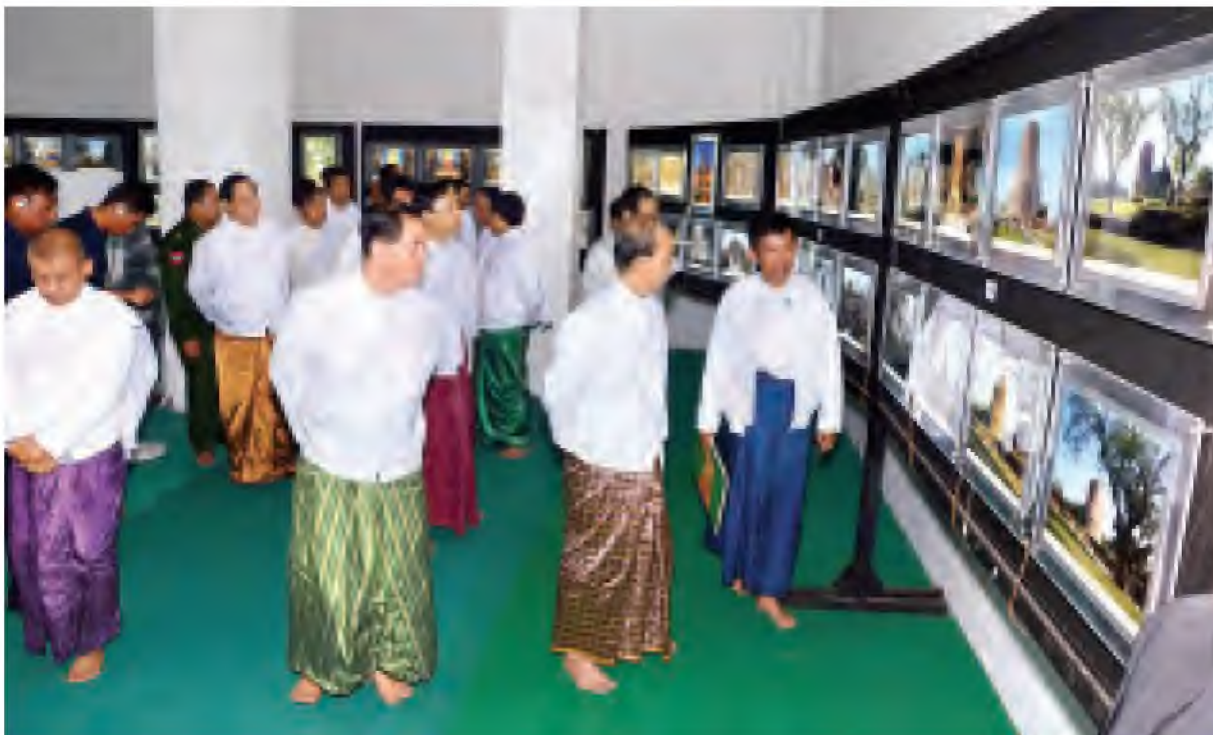
နိုင်ငံတော်သမ္မတ ဦးသိန်းစိန်နှင့် အဖွဲ့ဝင်များ စေတီတော်ဝန်တို့တို့အတွင်း ခင်းကျင်းပြသထားသော မြတ်ဗုဒ္ဓ၏ မဇ္ဈိမခရီးစဉ် ဓာတ်ပုံများကို လှည့်လည်ကြည့်ရှုကြစဉ်။ (သတင်းစဉ်)