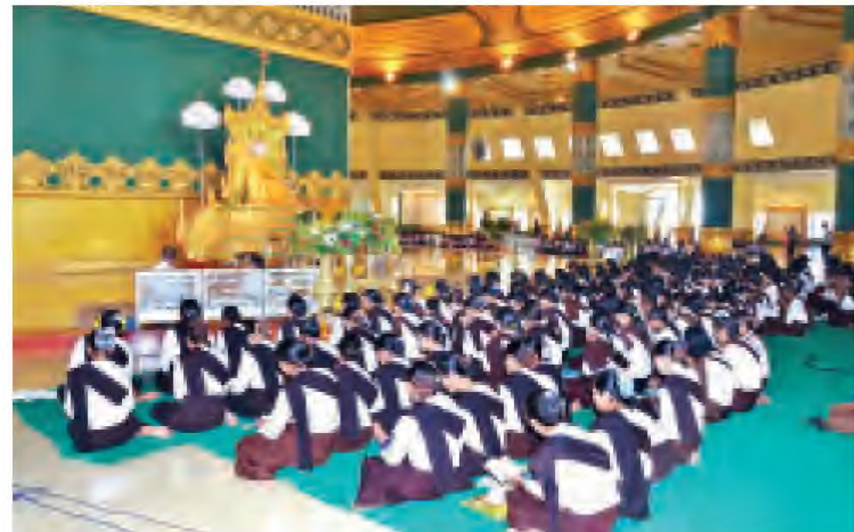
ဥပ္ပါတသန္တီစေတီတော်မြတ်ကြီးအတွင်း ဘာသာရေးအသင်းအဖွဲ့များက ဝတ်ရွတ်ပူဇော်စဉ်။ (သတင်းစဉ်)

ကဆုန်ညောင်ရေသွန်းလောင်းပူဇော်ကြသည်။ အလားတူ ပျဉ်းမနားမြို့ပေါ်ရှိ ဘုရား၊ စေတီ၊ ပုထိုးများတွင်လည်း မြို့ပေါ်ရပ်ကွက်များနှင့် ပတ်ဝန်းကျင်ရပ်ကွက်၊ ကျေးရွာများမှ ဆွမ်း၊ သစ်သီး၊ ပန်း၊ ရေချမ်းဆက်ကပ်လှူဒါန်း၍ ဒါန၊ သီလ၊ ကုသိုလ်ပုည ပြုကြသူများ၊ သမထ၊ ဝိပဿနာ ဘာဝနာပွားများကြသူများ၊ မိသားစုအလိုက် ဘုရားဖူးလာကြသူများဖြင့် စည်ကားလျက်ရှိသည်။ (သတင်းစဉ်)