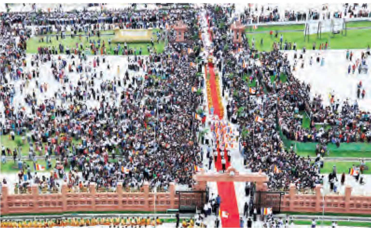
သတ္တသတ္တာဟ မဟာစေတီတော်မြတ်ကြီး အထက်ဌာပနာတော်သွင်း၊ ရွှေထီးတော်တင်၊ မြသပိတ်ရွှေကြာသင်္ကန်းတော်တင်နှင့် ဗုဒ္ဓါဘိသေတ အနောက်ဇာတင် မဟာမင်္ဂလာ အခမ်းအနား စည်ကားသိုက်မြိုက်စွာ ကျင်းပစဉ်။ (သတင်းစဉ်)

ရန်ကုန် မေ ၂၄ ရန်ကုန်အနောက်ပိုင်းခရိုင် ကြည့်မြင်တိုင်မြို့နယ် မဟာသက္ကမနိ ဗုဒ္ဓရုပ်ပွားတော်မြတ်ကြီးအနီး ကျောင်းကြီး တိုက်ကျောင်းဝင်းအတွင်း၌ ကျောင်းကြီးတိုက်ဂေါပကအဖွဲ့များနှင့် မဟာသက္ကမနိ ဂေါပကအဖွဲ့များစုပေါင်း၍ ပဉ္စမအကြိမ်မြောက် ညောင်ရေသွန်းလောင်း အလှူတော်ကို မေ ၂၄ ရက် (ကဆုန်လပြည့်) နံနက် ၆ နာရီမှ ညနေ ၆ နာရီ အထိ မြို့နယ်သူ၊ မြို့နယ်သားများအားလုံး ညောင်ရေသွန်းလောင်းလှူခဲ့ကြောင်း သိရသည်။ (စန်းလွင်)