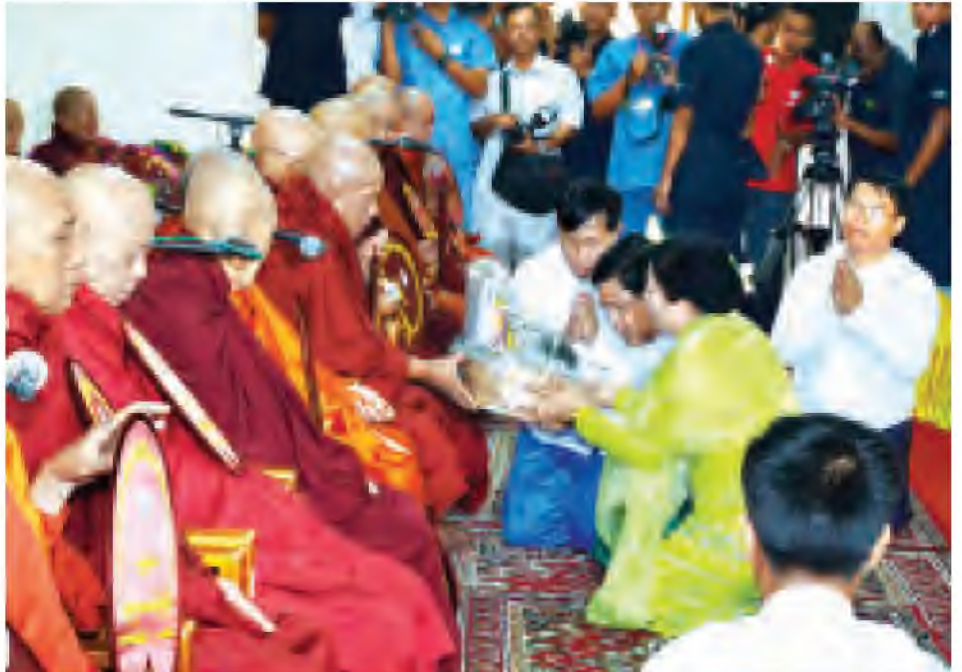
ဒုတိယသမ္မတ ဦးညွှတ်ထွန်းနှင့် ဇနီး ဒေါ်ခင်အေးမြင့်တို့ လှူဖွယ်ပစ္စည်းများအား ဆရာတော်ထံ ဆက်ကပ်လှူဒါန်းစဉ်။ (သတင်းစဉ်)