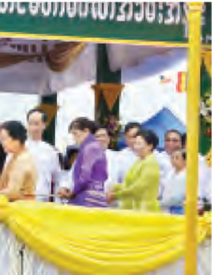
စိန်ဖူးတော်၊ သာသနာ့အောင်လံတော်နှင့် ရွှေကြာ (သတင်းစဉ်)