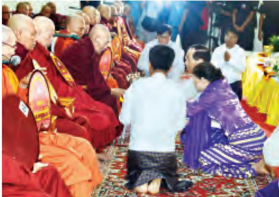
ဒုတိယသမ္မတ ဒေါက်တာစိုင်းမောက်ခမ်းနှင့် ဇနီး ဒေါ်နန်းရွှေမူတို့ ဌာပနာတော်များအား ဆရာတော်ထံ ဆက်ကပ်လှူဒါန်းစဉ်။ (သတင်းစဉ်)

ထို့နောက် နိုင်ငံတော်သမ္မတနှင့် အဖွဲ့ဝင်များသည် စေတီတော် ဂန္ဓကုဋီတိုက်အတွင်း စာမျက်နှာ ၈ ကော်လံ ၁ သို့ ●