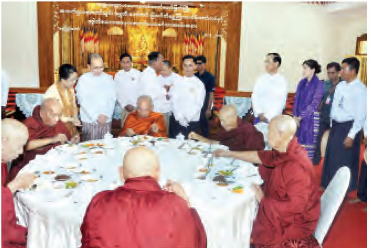
နိုင်ငံတော်သမ္မတ ဦးသိန်းစိန်နှင့် ဇနီးတို့ အမွှာပေးသည့် ဘုရားရှိခိုးသီချင်းများ အစုမောင်းစု သာသနာ့ဗိမာန်တော်၌ နေ့ဆန်းဆက်တင်လှူဒါန်းစဉ် (သတင်းစဉ်)

ယင်းနောက် နိုင်ငံတော်သမ္မတ ဦးသိန်းစိန်က ရတနာစိန်ဖူးတော်၊ ရွှေထီး တော်နှင့် သတ္တသတ္တာဟ မဟာဗောဓိစေတီတော်မြတ်ကြီးအား သာယာဝိတိကဝါဒ ပြောတော်အောင် ဆက်သွယ်စီစဉ်ထားသည့် စာမျက်နှာ ၇ တော်ဝင် ဝ သို့