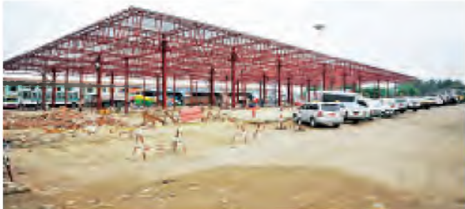
ကားများအတွက် အောင်မင်္ဂလာ အဝေးပြေး ယာဉ်ရပ်နားစခန်းအတွင်း တည်ဆောက်လျက်ရှိကြောင်း သက်ဆိုင်ရာဌာနမှ သိရသည်။ (အပေါ်ပုံ) စနစ်သစ် (ARRIVAL TERMINAL) နှင့် ထွက်ခွာ (DEPARTURE) စနစ် သစ်နှစ်ခုကို နိုင်ငံတကာလေဆိပ်များနှင့် မီးရထားဘူတာရုံများ၌ ကျင့်သုံးအဆင့်မြင့် ARRIVAL TERMINAL အဆောက်အအုံကို (Myint & Paing) ကုမ္ပဏီနှင့် အကျိုးတူပူးပေါင်းဆောင်ရွက်ခဲ့ရာ ယခုအခါ ၆၀

သည့် စနစ်အတိုင်း ကျင့်သုံးနိုင်ရန် အတွက် ရန်ကုန်မြို့တော် စည်ပင်သာယာရေးကော်မတီက အောင်မင်္ဂလာအဝေးပြေး ယာဉ်ရပ်နားစခန်း အတွင်း ပထမအစီအစဉ်အရ ခေတ်မီ