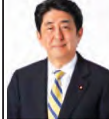
ဂျပန်နိုင်ငံဝန်ကြီးချုပ် မစ္စတာ ရှင်ဇိုအာဘေး

ဂျပန်နိုင်ငံဝန်ကြီးချုပ် မစ္စတာ ရှင်ဇိုအာဘေးသည် ၁၉၅၄ ခုနှစ် စက်တင်ဘာ ၂၁ ရက်တွင် တိုကျိုမြို့၌ မွေးဖွားခဲ့သည်။ ၁၉၉၃ ခုနှစ်မှစတင်၍ ရာမဂူချီ အမှတ်(၄)ခရိုင် မဲဆန္ဒနယ်မှ အောက်လွှတ်တော်အမတ်အဖြစ် ခုနစ်နှစ်ဆက်တိုက်ရွေးချယ်ခံခဲ့ရသည်။ ၁၉၉၇ ခုနှစ်တွင် Seikei တက္ကသိုလ်ဥပဒေရေးရာဌာနမှ နိုင်ငံရေးသိပ္ပံဖြင့် ဘွဲ့ရရှိခဲ့သည်။ ၁၉၉၉ ခုနှစ်တွင် မစ္စတာ အာဘေးသည် Kobe သံမဏိကုမ္ပဏီ၌ ဝင်ရောက်အလုပ်လုပ်ကိုင်ခဲ့သည်။ ၁၉၈၂ ခုနှစ်တွင် နိုင်ငံခြားရေးဝန်ကြီး၏ လက်ထောက်အမှုဆောင်အဖြစ် နိုင်ငံရေးလမ်းကြောင်းပေါ်သို့ စတင်ရောက်ရှိခဲ့ပြီး ၁၉၉၃ ခုနှစ်တွင် ရာမဂူချီ အမှတ်(၄)ခရိုင်မဲဆန္ဒနယ်မှ အောက်လွှတ်တော်အမတ်အဖြစ် ပထမအကြိမ် ရွေးချယ်ခံခဲ့ရသည်။ ၁၉၉၉ ခုနှစ်တွင် စာမျက်နှာ ၈ ကော်လံ ၁ သို့