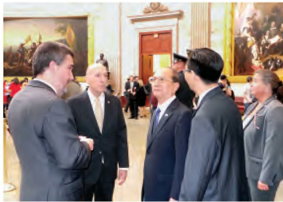
နိုင်ငံတော်သမ္မတ ဦးသိန်းစိန် အမေရိကန်ပြည်ထောင်စု ဝါရှင်တန်မြို့ရှိ ကွန်ဂရက်လွှတ်တော်အဆောက်အအုံအတွင်း လှည့်လည်ကြည့်ရှုစဉ်။ (သတင်းစဉ်)

နေပြည်တော် မေ ၂၃ ပြည်ထောင်စုသမ္မတ မြန်မာနိုင်ငံတော် နိုင်ငံတော်သမ္မတ ဦးသိန်းစိန်သည် မေ ၂၁ ရက် ဒေသစံတော်ချိန် နံနက် ၈ နာရီခွဲတွင် အမေရိကန်ပြည်ထောင်စု ဝါရှင်တန်မြို့ရှိ လွှတ်တော်အဆောက်အအုံ (Capitol Hill) ၌ အမေရိကန်အောက်လွှတ်တော်ဥက္ကဋ္ဌ Ms. Nancy Pelosi ဦးဆောင်သော အောက်လွှတ်တော်ခေါင်းဆောင် များနှင့် တွေ့ဆုံသည်။ ထို့နောက် နိုင်ငံတော်သမ္မတသည် ကွန်ဂရက်လွှတ်တော်အဆောက်အအုံအတွင်း လှည့်လည်ကြည့်ရှုသည်။