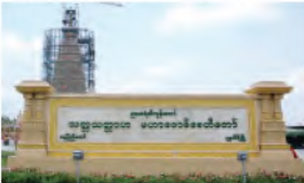
မဟာဗောဓိစေတီတော်ကြီးအား နေပြည်တော်-တပ်ကုန်း အမှတ်(၁) ကားလမ်းမှ ဖူးတွေ့ရပုံ။

ဤ(ဝိဂါဟနီ)ဌာန၌ မြတ်စွာဘုရား သည် အမြတ်ဆုံးဖြစ်သောတရားတော် မဃစက်ကို ဟောကြားတော်မူ၏။ အာနန္ဒာ ဤဌာနသည်လည်း သဒ္ဓါ တရားရှိသော အမျိုးသားသည်