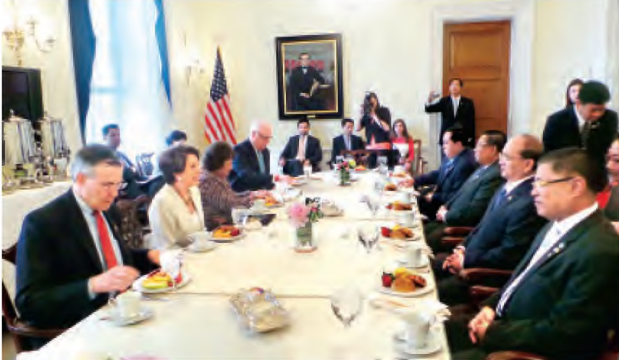
နိုင်ငံတော်သမ္မတ ဦးသိန်းစိန် အမေရိကန်ပြည်ထောင်စု ဝါရှင်တန်မြို့ရှိ လွှတ်တော်အဆောက်အအုံ(Capitol Hill) ၌ အမေရိကန် အောက်လွှတ်တော်ဥက္ကဋ္ဌ Ms. Nancy Pelosi ဦးဆောင်သော အောက်လွှတ်တော်ခေါင်းဆောင်များနှင့် တွေ့ဆုံဆွေးနွေးစဉ်။ (သတင်းစဉ်)

မည်သို့ဆိုစေ မြန်မာ့စီးရထားက ကြိုးပမ်းဆောင်ရွက်လျက်ရှိသော မြို့ပတ်ရထားများ အဆင့်မြှင့်တင်ရေးစီမံချက်ကို မြို့ပတ်ရထားမြင့် စိတ် ချမ်းမြေ့စွာစီးနင်းလိုက်ပါလိုကြသော ခန့်သွားများက ကြိုဆိုကြပါကြောင်း နှင့် မြို့ပတ်ရထားများမှ အထူးတွဲများကိုလည်း ခန့်သွားများက နှစ်ခြိုက် လျက်ရှိကြောင်း လေ့လာရေးသားတင်ပြလိုက်ရပါသည်။