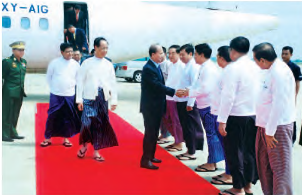
နိုင်ငံတော်သမ္မတ ဦးသိန်းစိန် ရန်ကုန်မြို့မှတစ်ဆင့် နေပြည်တော်သို့ပြန်လည်ရောက်ရှိရာ ဇုတ်ယသမ္မတများဖြစ်ကြသည့် ဒေါက်တာစိုင်းမောင်ခမ်းနှင့် ဦးညက်ထွန်း၊ တပ်မတော်ကာကွယ်ရေးဦးစီးချုပ် ဗိုလ်ချုပ်မှူးကြီးမင်းအောင်လှိုင်၊ ပြည်ထောင်စုဝန်ကြီးများ၊ နေပြည်တော်တိုင်းစစ်ဌာနချုပ်တိုင်းမှူးနှင့် ဌာနဆိုင်ရာအကြီးအကဲများနှင့် တာဝန်ရှိသူများက နေပြည်တော်လေဆိပ်တွင် ကြိုဆိုနှုတ်ဆက်ကြစဉ်။