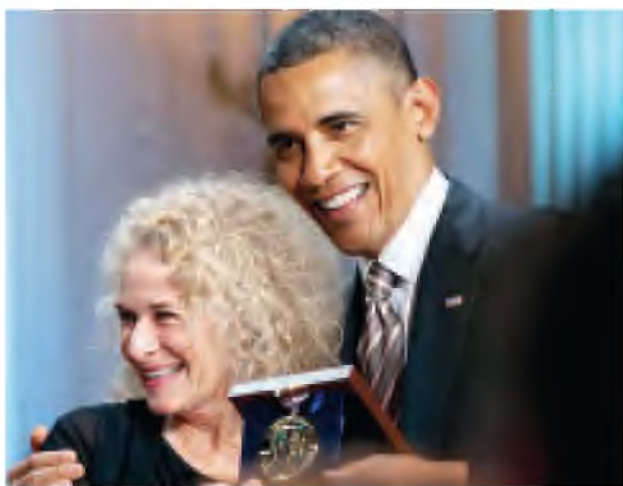
များဖြင့် သီဆိုဖျော်ဖြေခဲ့ကြကြောင်း သိရသည်။ “ထူးခြားလှတဲ့ အနုပညာရှင် ကာရိုက်ကင်းအား ဂုဏ်ပြုတဲ့ပွဲကို တက်ရောက်အားပေးကြတဲ့ အနုပညာ

ဂုဏ်ပြုသောအားဖြင့် ၂၀၀၇ ခုနှစ်မှ စတင်ကာ ပေးအပ်ချီးမြှင့်ခဲ့ခြင်း ဖြစ်သည်။ “George တို့လိုပဲ သူမဘဝထဲမှာ ဂီတကနေတာ မဟုတ်ပါဘူး။ ဂီတထဲမှာ သူမဘဝရပ်တည်ထားတာပါ” ဟု သမ္မတအိုဘားမားက ပြောကြားခဲ့သည်။