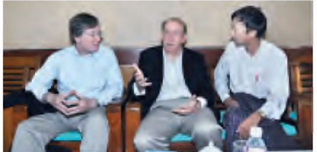
နယူးလိုက်အော့ဖ်မြန်မာ သတင်းစာမှ သတင်းအဖွဲ့၊ အမေရိကန်နိုင်ငံမှ ဥပဒေရေးရာ၊ ICT နည်းပညာနှင့် မီဒီယာကျွမ်းကျင်သူပညာရှင်နှစ်ဦး ကို တွေ့ဆုံမေးမြန်းစဉ်။ (သတင်းစဉ်)

သတင်းများကို ပွင့်လင်းမြင်သာစွာ ပေးနိုင်ရန်အတွက် လည်းကောင်း၊ ဆောင်ရန်နှင့်ရွှေ့ပြောင်းရန် နည်းလမ်းများကို လက်တွေ့သရုပ်ပြမှုအပါအဝင် အပြန်အလှန်ဆွေးနွေးခဲ့ကြသည်။