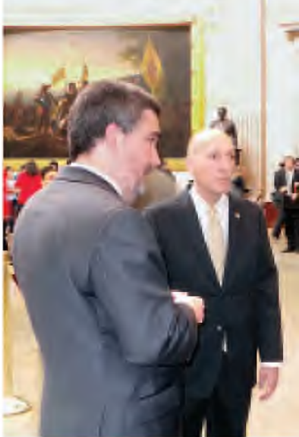
နိုင်ငံတော်သမ္မတ ဦးသိန်းစိန် အမေရိကန်ပြည်ထောင်စု အစိုးရအတွင်း လှည့်လည်ကြည့်ရှုစဉ်။

မေ ၂၂ ရက်ထုတ် ကြေးမုံသတင်းစာ စာမျက်နှာ(၈)တွင် ပါရှိသော "နိုင်ငံတော်သမ္မတ ဦးသိန်းစိန် ဝါရှင်တန်မြို့ရှိ ဂျွန်ဟော့ကင်းတက္ကသိုလ် တွင် မိန့်ခွန်းပြောကြား" သတင်းမှ မိန့်ခွန်းပထမစာပိုဒ်တွင် ပါရှိသော SIAS အစား SAIS ဟု ပြင်ဆင်ဖတ်ရှုပါရန်။ (ကြေးမုံ)