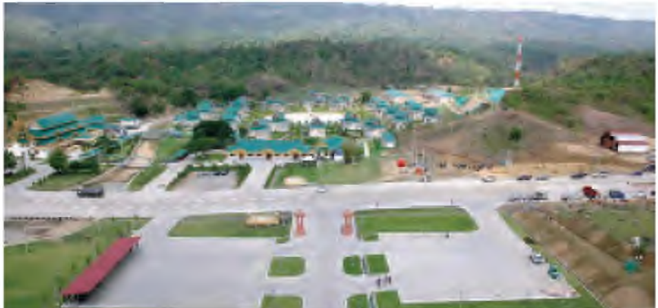
စေတီတော်အနီး ယာဉ်ရပ်နားရန်နေရာနှင့် တရားစခန်းအား ဝေဟင်မှ မြင်တွေ့ရပုံ။

အချုပ်အားဖြင့်ဆိုရသော် ယခု အခါ ဥဒယရံသီကုန်းတော်၌ တည် ထားသည့် သတ္တသတ္တဟ မဟာ ဗောဓိစေတီတော် ရွှေထီးတော်တင် လှူပွဲနှင့်ဘုရားအနေကဇာတင်ပွဲကို မေ ၂၄ ရက်(ယနေ့)တွင် ကျင်းပနိုင်ပြီ ဖြစ်ရာ စာရေးသူတို့ နိုင်ငံအတွက် ဂုဏ်ယူစရာဆုထူးကြီးကို ဆောင်ကြဉ်း ပေးလိုက်နိုင်ခြင်းပင် ဖြစ်ပါသည်။ သို့အတွက် အနယ်နယ်အရပ်ရပ်မှ ဘုရားဖူးပြည်သူများ လာရောက် ဖူးမြော်ကုသိုလ်ယူနိုင်ကြပြီ ဖြစ်ပါ ကြောင်း၊ ပြည်သူအပေါင်း စိတ်အေး ချမ်းသာပြီး ကြည်ညိုသဒ္ဓါ ပွားများနိုင် ကြပါစေကြောင်း၊ ငြိမ်းချမ်းသာယာပြီး မဟာမင်္ဂလာအပေါင်းနှင့် ခညောင်း နိုင်ပါစေကြောင်း ဆုမွန်ကောင်း တောင်းရင်း ကုသိုလ်တရားပွားများ နိုင်ရန် နိဗ္ဗာန်အကျိုးမျှော်၍ ကုသိုလ် စေတနာရွှေ့ထားလျက် သတင်း ကောင်း ပါးလှိုက်ရကြောင်းပါ ခင်ဗျား။ ။