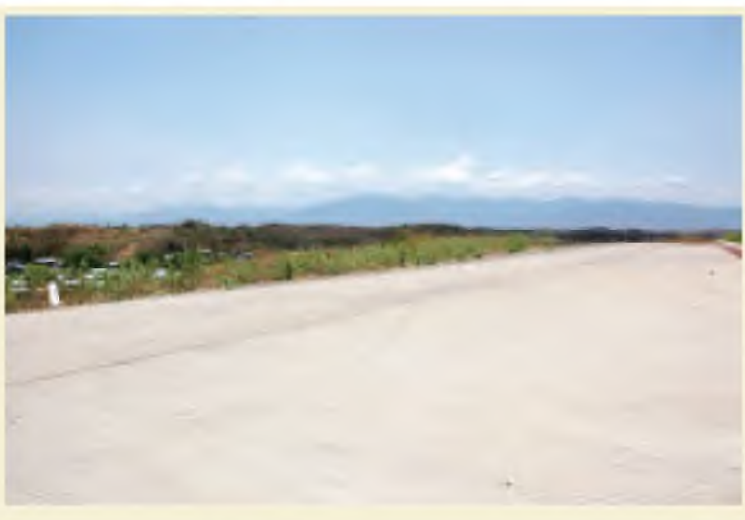
မြတ်ကြီးနှင့် ၇ ဖာလုံခန့်အကွာတွင် တည်ရှိပြီး မိုင်တိုင်အမှတ် ၆ မိုင် ၆ ဖာလုံတွင် တည်ရှိသည့် အောင်သီရိကျေးရွာနှင့် တစ်ဖာလုံခန့်သာ ကွာဝေးကြောင်း၊ ထူးဆန်းဖွယ်နေရာတစ်နေရာ ဖြစ်သည့်အတွက် ဗဟုသုတရှာဖွေ လေ့လာလိုသူများ သွားရောက်လေ့လာကြည့်ရှုနိုင်ပါ ကြောင်းဖြင့် ရေးသားတင်ပြအပ်ပါသည်။

အဆိုပါနေရာသည် နေပြည်တော်တွင်တည်ထား ကိုးကွယ်သည့် သတ္တသတ္တာဟ မဟာတေဓိစေတီတော်