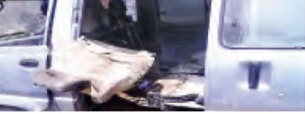
ခြင်ဆေးရွေးသုံးလျှင် သတိယှဉ် အောက်တွင်ခံခွက် ပပေနှင့်