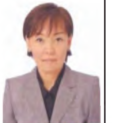
ဂျပန်နိုင်ငံဝန်ကြီးချုပ်၏ ဇနီး မစ္စမ အာကီအာဘေး

ဂျပန်နိုင်ငံဝန်ကြီးချုပ် မစ္စတာ ရှင်ဇိုအာဘေးသည် ၁၉၅၄ ခုနှစ် စက်တင်ဘာ ၂၁ ရက်တွင် တိုကျိုမြို့၌ မွေးဖွားခဲ့သည်။ ၁၉၉၃ ခုနှစ်မှစတင်၍ ရာမဂူချီ အမှတ်(၄)ခရိုင် မဲဆန္ဒနယ်မှ အောက်လွှတ်တော်အမတ်အဖြစ် ခုနစ်နှစ်ဆက်တိုက်ရွေးချယ်ခံခဲ့ရသည်။ ၁၉၉၇ ခုနှစ်တွင် Seikei တက္ကသိုလ်ဥပဒေရေးရာဌာနမှ နိုင်ငံရေးသိပ္ပံဖြင့် ဘွဲ့ရရှိခဲ့သည်။ ၁၉၉၉ ခုနှစ်တွင် မစ္စတာ အာဘေးသည် Kobe သံမဏိကုမ္ပဏီ၌ ဝင်ရောက်အလုပ်လုပ်ကိုင်ခဲ့သည်။ ၁၉၈၂ ခုနှစ်တွင် နိုင်ငံခြားရေးဝန်ကြီး၏ လက်ထောက်အမှုဆောင်အဖြစ် နိုင်ငံရေးလမ်းကြောင်းပေါ်သို့ စတင်ရောက်ရှိခဲ့ပြီး ၁၉၉၃ ခုနှစ်တွင် ရာမဂူချီ အမှတ်(၄)ခရိုင်မဲဆန္ဒနယ်မှ အောက်လွှတ်တော်အမတ်အဖြစ် ပထမအကြိမ် ရွေးချယ်ခံခဲ့ရသည်။ ၁၉၉၉ ခုနှစ်တွင် စာမျက်နှာ ၈ ကော်လံ ၁ သို့