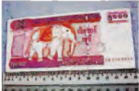
ငွေစက္ကူအတုများဖြစ်သော ငါးထောင်တန် ရွှေဘက်နှင့် ကျောဘက် (အပေါ်ပုံ)၊ တစ်ထောင်တန် ရွှေဘက်နှင့် ကျောဘက် (အောက်ပုံ) တို့ကို တွေ့ရစဉ်။