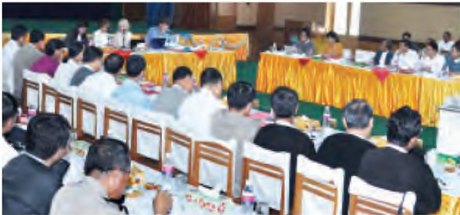
ဥပဒေရေးရာ ICT နည်းပညာနှင့် မီဒီယာဆွေးနွေးပွဲကို ပြန်ကြားရေးဝန်ကြီးဌာန အစည်းအဝေးခန်းမ၌ ကျင်းပရာ အမေရိကန်မှ မီဒီယာဥပဒေနှင့် လူထုဆက်ဆံရေး ကျွမ်းကျင်ပညာရှင်များက ဆွေးနွေးပွဲချခဲ့သည်။ (သတင်းစဉ်)

ဝန်ကြီးဌာနများရှိ သတင်းထုတ်ပြန်ရေး အဖွဲ့များမှ တာဝန်ရှိသူများ အနေဖြင့် သက်ဆိုင်ရာ သတင်းအချက်အလက်များကို အများပြည်သူများ အချိန်နှင့်တစ်ပြေးညီ သိရှိနိုင်စေရန်နှင့် ပြစ်ပေါ်ပြောင်းလဲမှုများကို ပွင့်လင်းမြင်သာမှုဖြင့် ပြန်ကြားနိုင်စေရန် ရည်ရွယ်ချက်ဖြင့် ပြစ်ကြားရေးသိရသည်။ ဆွေးနွေးပွဲသို့ ပြည်ထောင်စု ဝန်ကြီးဌာနများနှင့် ပြည်ထောင်စုအဆင့် အဖွဲ့အစည်းများရှိ သတင်းထုတ်ပြန်ရေးအဖွဲ့များမှ တာဝန်ရှိသူများ တက်ရောက်ကြသည်။