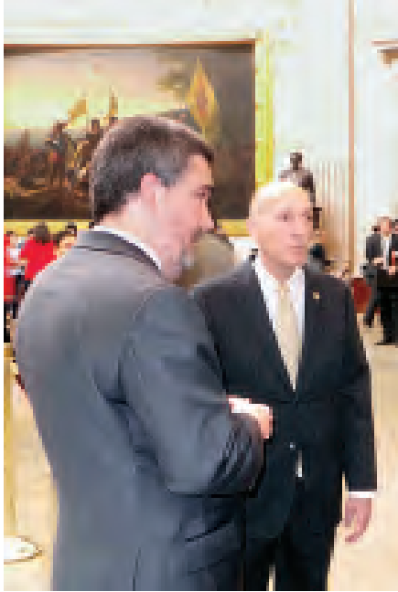
နိုင်ငံတော်သမ္မတ ဦးသိန်းစိန် အမေရိကန်ပြည်ထောင်စု အစိုးရအတွင်း လှည့်လည်ကြည့်ရှုစဉ်။