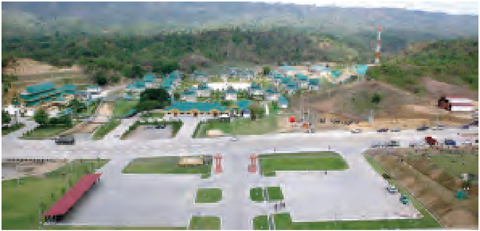
စေတီတော်အနီး ယာဉ်ရပ်နားရန်နေရာနှင့် တရားခန်းအား ဝေဟင်မှ မြင်တွေ့ရပုံ။

အချုပ်အားဖြင့်ဆိုရသော် ယခုအခါ ဥဒယရံသီကုန်းတော်၌ တည်ထားသည့် သတ္တသတ္တဟ မဟာဗောဓိစေတီတော် ရွှေထီးတော်တင်လှူပွဲနှင့်ဘုရားအနေကဇာတင်ပွဲကို မေ ၂၄ ရက်(ယနေ့)တွင် ကျင်းပနိုင်ပြီဖြစ်ရာ စာရေးသူတို့ နိုင်ငံအတွက် ဂုဏ်ယူစရာဆုထူးကြီးကို ဆောင်ကြဉ်းပေးလိုက်နိုင်ခြင်းပင် ဖြစ်ပါသည်။ သို့အတွက် အနယ်နယ်အရပ်ရပ်မှ ဘုရားဖူးပြည်သူများ လာရောက်ဖူးမြော်ကုသိုလ်ယူနိုင်ကြပြီ ဖြစ်ပါကြောင်း၊ ပြည်သူအပေါင်း စိတ်အေးချမ်းသာပြီး ကြည်ညိုသဒ္ဓါ ပွားများနိုင်ကြပါစေကြောင်း၊ ငြိမ်းချမ်းသာယာပြီး မဟာမင်္ဂလာအပေါင်းနှင့် ခညောင်းနိုင်ပါစေကြောင်း ဆုမွန်ကောင်းတောင်းရင်း ကုသိုလ်တရားပွားများနိုင်ရန် နိဗ္ဗာန်အကျိုးမျှော်၍ ကုသိုလ်စေတနာရှေ့ထားလျက် သတင်းကောင်း ပါးလိုက်ရကြောင်းပါခင်ဗျား။ ။