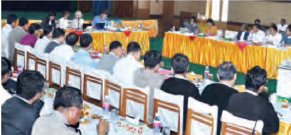
ဥပဒေရေးရာ ICT နည်းပညာနှင့် မီဒီယာဆွေးနွေးပွဲကို ပြန်ကြားရေးဝန်ကြီးဌာန အစည်းအဝေးခန်းမ၌ ကျင်းပရာ အမေရိကန်မှ မီဒီယာဥပဒေနှင့် လူထုဆက်ဆံရေး ကျွမ်းကျင်ပညာရှင်များက ဆွေးနွေးပို့ချကြစဉ်။ (သတင်းစဉ်)

ယင်းတွေ့ဆုံဆွေးနွေးပွဲတွင် အမေရိကန်အဖွဲ့မှ Winning Strategies ၏ ဥက္ကဋ္ဌ Jim Mc Queeny နှင့် ဥက္ကဋ္ဌ Ms. Barbarar Swann တို့သည် ဝန်ကြီးဌာနများရှိ သတင်းထုတ်ပြန်ရေးအဖွဲ့များအနေဖြင့် သတင်းသမားများနှင့် တွေ့ဆုံရာတွင်လည်းကောင်း၊ ပြည်သူများအတွက် ဌာနဆိုင်ရာ