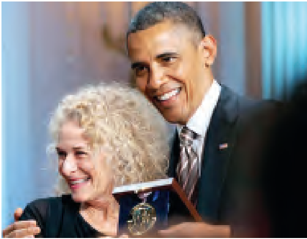
များဖြင့် သီဆိုဖျော်ဖြေခဲ့ကြကြောင်း သိရသည်။ “ထူးခြားလှတဲ့ အနုပညာရှင် ကာရိုလ်ကင်းအား ဂုဏ်ပြုတဲ့ပွဲကို တက်ရောက်အားပေးကြတဲ့ အနုပညာ

ဂုဏ်ပြုသောအားဖြင့် ၂၀၀၇ ခုနှစ်မှ စတင်ကာ ပေးအပ်ချီးမြှင့်ခဲ့ခြင်း ဖြစ်သည်။ “George တို့လိုပဲ သူမဘဝထဲမှာ ဂီတကနေတာ မဟုတ်ပါဘူး။ ဂီတထဲမှာ သူမဘဝရပ်တည်ထားတာပါ” ဟု သမ္မတအိုဘားမားက ပြောကြားခဲ့သည်။