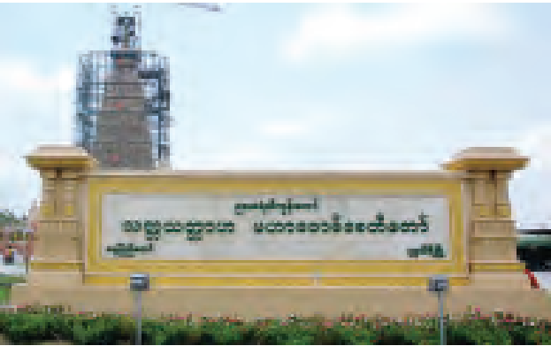
မဟာဗောဓိစေတီတော်ကြီးအား နေပြည်တော်-တပ်ကုန်း အမှတ်(၁) ကားလမ်းမှ ဖူးတွေ့ရပုံ။

ဤ(မိဂဒါဝုန်)ဌာန၌ မြတ်စွာဘုရားသည် အမြတ်ဆုံးဖြစ်သောတရားတော် ဓမ္မစက်ကို ဟောကြားတော်မူ၏။ အာနန္ဒာ ဤဌာနသည်လည်း သဒ္ဓါတရားရှိသော အမျိုးသားသည်