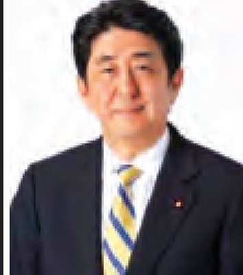
ဂျပန်နိုင်ငံဝန်ကြီးချုပ် မစ္စတာ ရှင်ဇိုအာဘေး

ဂျပန်နိုင်ငံဝန်ကြီးချုပ် မစ္စတာ ရှင်ဇိုအာဘေးသည် ၁၉၅၄ ခုနှစ် စက်တင်ဘာ ၂၁ ရက်တွင် တိုကျိုမြို့၌ မွေးဖွားခဲ့သည်။ ၁၉၉၃ ခုနှစ်မှစတင်၍ ရာမဂူချီ အမှတ်(၄)ခရိုင် မဲဆန္ဒနယ်မှ အောက်လွှတ်တော်အမတ်အဖြစ် ခုနစ်နှစ်ဆက်တိုက်ရွေးချယ်ခံခဲ့ရသည်။ ၁၉၉၇ ခုနှစ်တွင် Seikei တက္ကသိုလ်ဥပဒေရေးရာဌာနမှ နိုင်ငံရေးသိပ္ပံဖြင့် ဘွဲ့ရရှိခဲ့သည်။