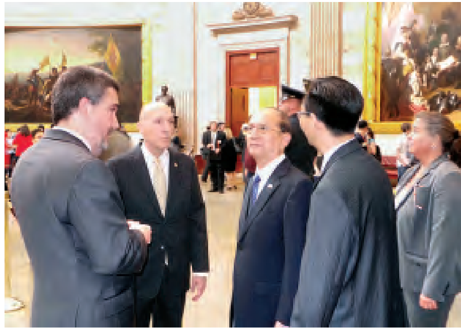
နိုင်ငံတော်သမ္မတ ဦးသိန်းစိန် အမေရိကန်ပြည်ထောင်စု ဝါရှင်တန်မြို့ရှိ ကွန်ဂရက်လွှတ်တော်အဆောက်အအုံအတွင်း လှည့်လည်ကြည့်ရှုစဉ်။ (သတင်းစဉ်)