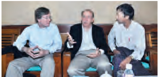
နယူးလိုက်အော့ဖ်မြန်မာ သတင်းစာမှ သတင်းအဖွဲ့၊ အမေရိကန်နိုင်ငံမှ ဥပဒေရေးရာ၊ ICT နည်းပညာနှင့် မီဒီယာကျွမ်းကျင်သူ ပညာရှင်နှစ်ဦး ကို တွေ့ဆုံမေးမြန်းစဉ်။ (သတင်းစဉ်)

သတင်းများကို ပွင့်လင်းမြင်သာစွာ ပေးနိုင်ရန်အတွက် လည်းကောင်း၊ ဆောင်ရန်နှင့်ရှောင်ရန် နည်းလမ်းများကို လက်တွေ့သရုပ်ပြမှုအပါအဝင် အပြန်အလှန်ဆွေးနွေးခဲ့ကြသည်။