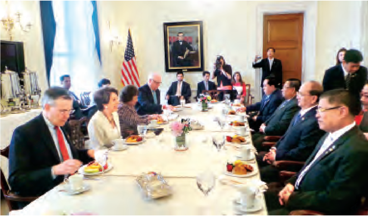
နိုင်ငံတော်သမ္မတ ဦးသိန်းစိန် အမေရိကန်ပြည်ထောင်စု ဝါရှင်တန်မြို့ရှိ လွှတ်တော်အဆောက်အအုံ(Capitol Hill) ၌ အမေရိကန် အောက်လွှတ်တော်ဥက္ကဋ္ဌ Ms. Nancy Pelosi ဦးဆောင်သော အောက်လွှတ်တော်ခေါင်းဆောင်များနှင့် တွေ့ဆုံဆွေးနွေးစဉ်။