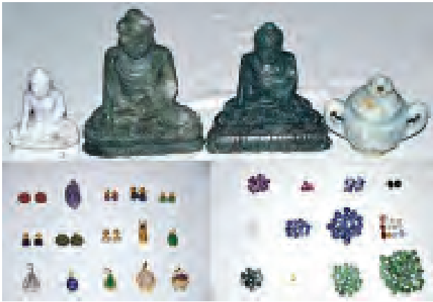
ရွှေထီးတော်တွင် ပူဇော်ရန် ခေါ်မြင့်မြင့်၊ ခေါ်စိန်ငွေ့၊ ပါဝါမင်းစိုးမင်း မိသားစုက လှူဒါန်းသည့် ခန့်မှန်းငွေကျပ် ၃၉၃၄၇၀၀ တန်ဖိုးရှိ ကျောက်စိမ်း ဗုဒ္ဓရုပ်ပွားတော်နှင့် ရတနာပစ္စည်းများကို တွေ့ရစဉ်။

ဘုရားဖူးပြည်သူများအပန်းဖြေနိုင်ရန်အတွက် မဟာဗောဓိစေတီအနီးရှိ သပြေစမ်း ဆည်ပတ်လမ်းကို ကွန်ကရစ်ဖြင့် ဖောက်လုပ်ထားပြီး အရှည်ပေ ၆၈၀၀ ရှိပါသည်။ မြန်မာပြည်အနှံ့မှ ဘုရားဖူးများလာရောက်လျှင် တည်းခိုနိုင်ရန်အတွက် အမျိုးသား အိပ်ဆောင်တစ်ဆောင်နှင့် အမျိုးသမီး အိပ်ဆောင် နှစ်ဆောင်ကို တည်ဆောက်ပေးထားပါသည်။ ၎င်းအဆောင်များတွင် လေဝင်လေထွက် ကောင်းအောင် ပြတင်းပေါက်များကို အောက်ခြေကြမ်းခင်းနှင့်တစ်ညီတည်း