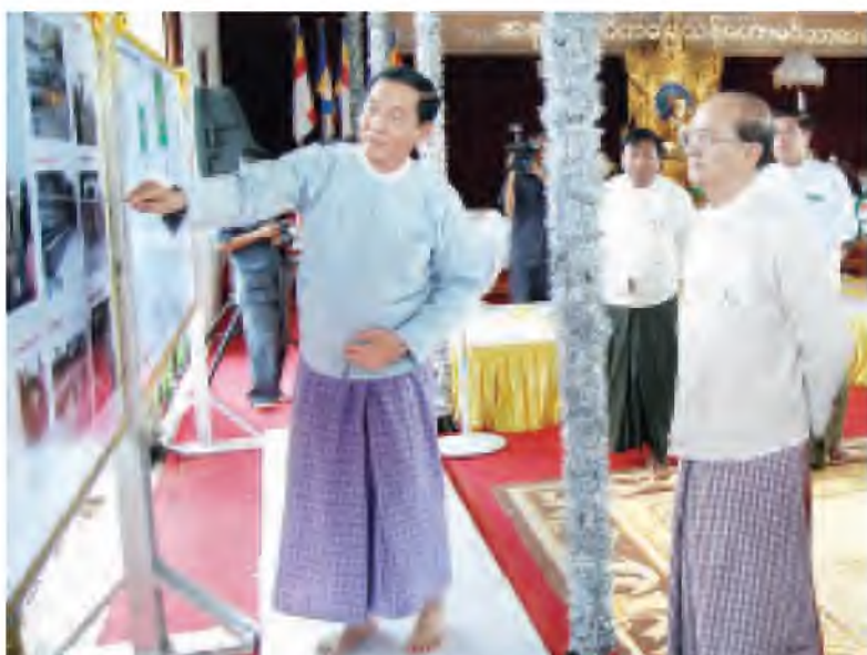
သတ္တသတ္တဟတည်ဆောက်မည့် စီမံကိန်းနှင့် ပတ်သက်၍ နေပြည်တော် ကောင်စီ ဥက္ကဋ္ဌက နိုင်ငံတော်သမ္မတအား ဓာတ်ပုံမှတ်တမ်းများဖြင့် ရှင်းလင်းတင်ပြခဲ့စဉ်။

စတုတ္ထသတ္တဟဟတော့ ဘုရားရှင်တို့သီတော်မြတ်က လေးခုမြောက် ခုနစ်ရက်ရောက်တဲ့ အခါကျတော့