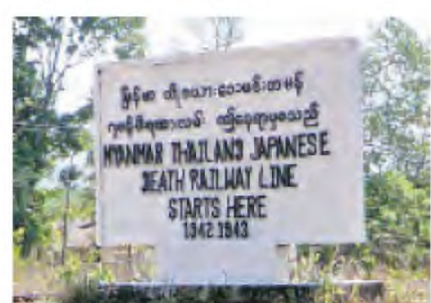
သေမင်းတမန်ရထားလမ်းနယ်နိမိတ်အစပ်အား မွန်ပြည်နယ် သံဖြူ ဇရပ်မြို့အနီး၌ တွေ့ရစဉ်။

တင်စားခေါ်ဝေါ်နေသော ကမ္ဘာ လှည့်ခရီးသွားလုပ်ငန်းအား နိုင်ငံ တော်အစိုးရ၊ ပြည်နယ်/တိုင်း ဒေသကြီးအသီးသီးရှိ သက်ဆိုင်ရာ အစိုးရ အဖွဲ့အစည်းအနေဖြင့် “အမြန် ဆုံး စနစ်တကျ မြှင့်တင်အကောင် အထည်ဖော်ပေးပါရန်”၊ တိုင်းရင်း သားလုပ်ငန်းရှင်များအနေဖြင့် “အမြန်ဆုံးရင်းနှီးလုပ်ကိုင်ကြပါ ရန်”၊ လူငယ်လူရွယ်များအနေဖြင့် မကြာမီပေါ်ပေါက်လာတော့မည့် အဆင့်မြင့်သောအလုပ်အကိုင်နေရာ များတွင် မိမိကိုယ်မိမိ အသင့်အနေ အထား (Ready to Work )ဖြစ်နေ စေရေးအတွက် လိုအပ်သောဘာသာ စကားနှင့် အထွေထွေစာပေများ ကျွမ်းကျင်စွာ တတ်မြောက်နေဖို့ အမြန်ဆုံးကြိုးစားကြရန်” အလေး အနက်အကြံပြုထုတ်ဖော်တွန်းတင်ပြ လိုက်ရပါသည်။ ။