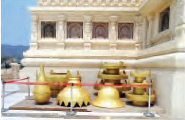
နမူနာပုံစံပြ ထီးတော်အစိတ်အပိုင်းများကို မဟာဗောဓိစေတီတော်၌ ပြသထားသည့်ကို မြင်တွေ့ရပုံ။

ကွာဝေးတဲ့အရှေ့အရပ်မှာ ရှိတာပါ။ ဒါပေမယ့် မဟာဗောဓိစေတီကို လာရောက်ဖူးမြော်တဲ့ သူတော်စင်တွေ အဝေါလသတ္တဟကိုပါ ပူဇော်နိုင်အောင် အသောကမင်းကြီးက မဟာဗောဓိအနီးအနားမှာ ဆိတ်ကျောင်းညောင်ပင်ကို ပူဇော်ခဲ့သလို ကျွန်တော်တို့ကလည်း ဒီအနီးအနားမှာပဲ အလားတူ ပူဇော်ခဲ့ပါတယ်။ အဲဒီလို ပူဇော်တဲ့အခါ ထူးခြားချက်က ကျွန်တော်တို့က ညောင်ပင်ကိုလည်းစိုက်ပျိုးပြီးတော့ ပူဇော်ထားတဲ့အတွက် ပူဇော်မှုက ပိုပြီး သဗ္ဗာယ်ပါတယ်။ မြတ်စွာဘုရားက ဆဋ္ဌသတ္တဟခြောက်ကြိမ်မြောက်တဲ့ ခုနစ်ရက်