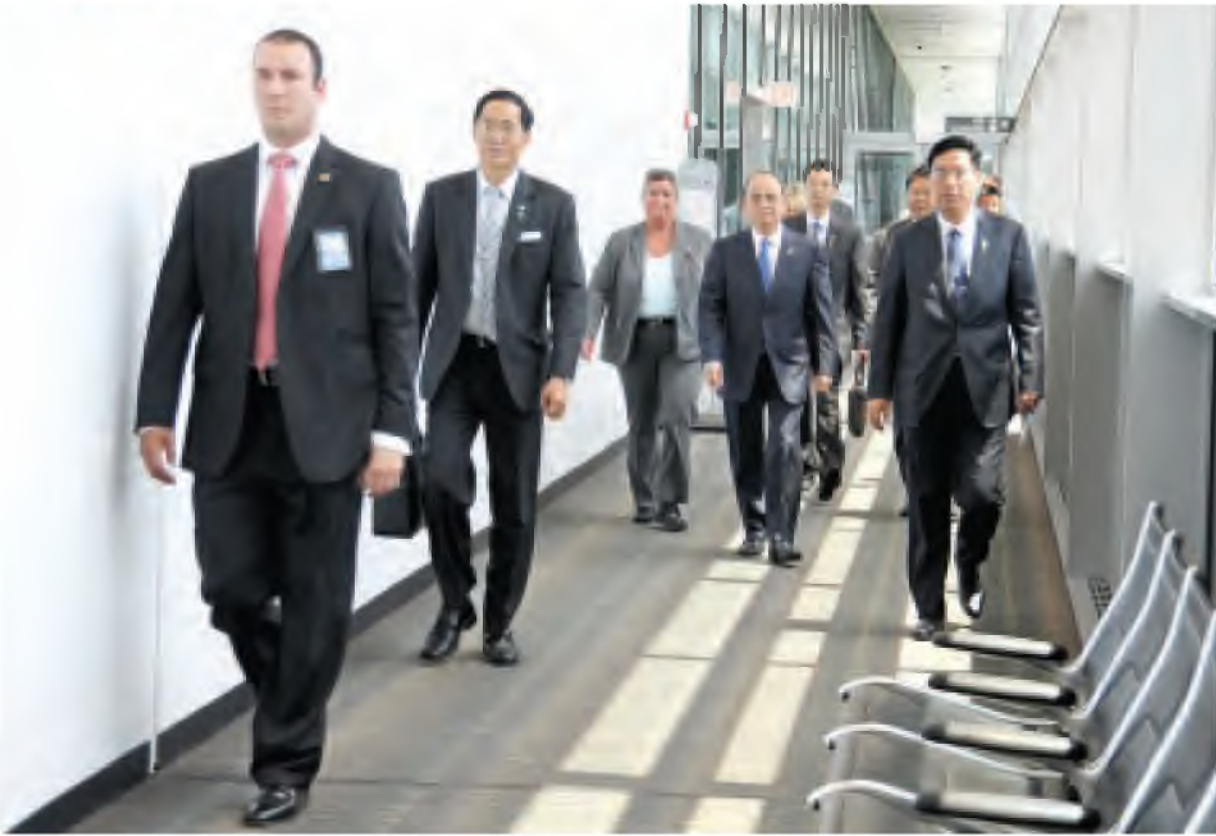
နိုင်ငံတော်သမ္မတ ဦးသိန်းစိန် အမေရိကန်ပြည်ထောင်စု ဝါရှင်တန်လေဆိပ်မှ ထွက်ခွာလာရာ တာဝန်ရှိသူများက ပို့ဆောင်နှုတ်ဆက်ကြစဉ်။ (သတင်းစဉ်)

◆ နိုင်ငံတော်သမ္မတမှ လက်မှတ်ရေးထိုးခဲ့ကြပြီး အဆိုပါသဘောတူညီချက်မှာ မြန်မာနိုင်ငံနှင့် အမေရိကန်ပြည်ထောင်စုတို့၏ နှစ်နိုင်ငံအောင်မြင်မှု ရလဒ်တစ်ခုပင်ဖြစ်သည်။ (သတင်းစဉ်)