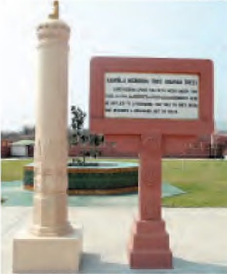
အိန္ဒိယနိုင်ငံကဲ့သို့ အပေါလသတ္တဟအဖြစ် ကျောက်တိုင်တစ်ခု စိုက်ထားသည့် အပြင်ညောင်ပင်ကိုပါ စိုက်ပျိုးပူဇော်ထားသည့် ကိုတွေ့ရပုံ။

မေး။ မဟာဗောဓိပင်သမိုင်းကြောင်းကိုလည်း ပြောပြပေးပါ။ ဖြေ။ သတ္တသတ္တဟစေတီတော်ကြီးတည်ဆောက်ပူဇော်တော့မယ်ဆိုတဲ့ အခါကျတော့ သီရိလင်္ကာနိုင်ငံကနေ ပို့ဆောင်ပူဇော်လိုက်တဲ့ မဟာဗောဓိပင်ကိုပဲ နိုင်ငံတော်သမ္မတကြီးကိုယ်တိုင် စိုက်ပျိုးပူဇော်ထားတာ ဖြစ်ပါတယ်။ ပန္နတ်တော်တင်ပို့အပြီး မဟာဗောဓိပင်ကြီးကိုစိုက်ပျိုးပူဇော်ပြီးတဲ့အခါမှာ သက်ဆိုင်ရာတာဝန်ရှိတဲ့ သစ်တောက တာဝန်ခံပုဂ္ဂိုလ်တွေရယ်၊ ACE က တာဝန်ခံပုဂ္ဂိုလ်တွေနဲ့ အမြဲမပြတ်စောင့်ရှောက်ပူဇော်ခဲ့ပါတယ်။ (ဆက်လက်ဖော်ပြပါမည်)