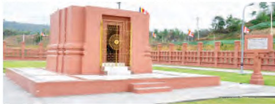
စတုတ္ထသတ္တဟဖြစ်သည့် ရတနာရွှေအိမ်တော် တည်ဆောက်ထားပုံ။

ဒုတိယသတ္တဟဟတော့ ဘုရားရှင်က ဗောဓိပင်မှာ ခုနစ်ရက်သီတင်းသုံးပြီးတဲ့အခါမှာ ဗောဓိပင်ရဲ့ အရှေ့မြောက်အရပ်မှာ သဗ္ဗညုတဉာဏ်ရတော်မူခဲ့တဲ့ မဟာဗောဓိပင်ကို အရှေ့မြောက်အရပ်ကနေပြီး ဗောဓိပင်ကိုမျက်နှာမူပြီး မမှိတ်မသန်ကြည့်ရှုတော်မူခဲ့ပါတယ်။ ခုနစ်ရက်လုံးလုံး မတ်တတ်ရပ်ပြီးတော့ မမှိတ်မသန်ကြည့်ရှုခဲ့တဲ့ ခုနစ်ရက်ကိုတော့