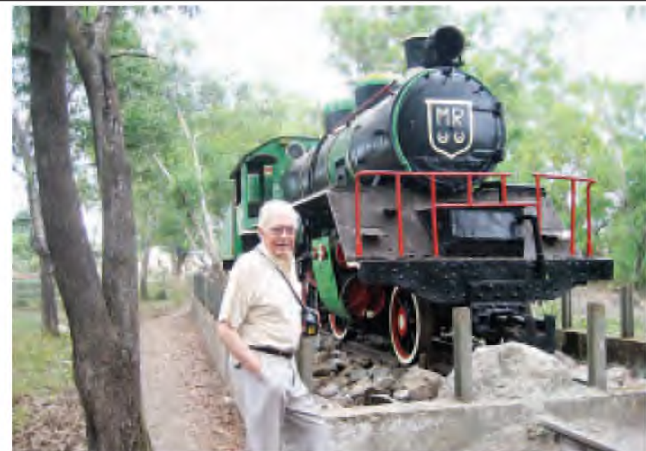
မြန်မာ့ခရီးသွားစက်ခေါင်းတွဲအား မွန်ပြည်နယ် သံဖြူဇရပ်မြို့ရှိ သေမင်းတမန်ရထားလမ်းအနီး၌တွေ့ရစဉ်။

ကမ္ဘာစစ်အတွင်း၌ ဂျပန်တို့သည် ၎င်းတို့၏ စစ်ရေးအတွက် အမြန် တည်ဆောက်ခဲ့သော (Nov 1942 မှ Oct 1943) သေမင်းတမန် ရထားလမ်း(The Death Railway) သည် သံဖြူဇရပ်မြို့ (မြန်မာနိုင်ငံ၊ မွန်ပြည်နယ်)မှ ဘန်ပေါင်းမြို့ (ထိုင်း နိုင်ငံ၊ ကန်ချာနဘူရီ)အထိ ၂၅၇ မိုင် (415 km ) ရှည်လျားသည်။ သေမင်းတမန်ရထားလမ်း (The Death Railway)သည် ကမ္ဘာပေါ်၌ အလွန်ကျော်ကြားခဲ့သော ကျော် ကြားနေဆဲ၊ စိတ်ဝင်စားမှုခံနေရဆဲ ဖြစ်ပြီး နှစ်စဉ် ထိုင်းဘက်အခြမ်းသို့ ကမ္ဘာတစ်ဝန်းမှ လာရောက်လေ့လာ သူပေါင်း တစ်သိန်းနှင့်အထက် ရှိနေ ပါသည်။ ၂၀၁၂ ခုနှစ်အတွက် ကန်ချာနဘူရီ (Kanchanaburi) မြို့နှင့် ယင်းဒေသတစ်ဝိုက်၏ ကမ္ဘာ လှည့်ခရီးသွားလုပ်ငန်းမှ ပင်ငွေမှာ ထိုင်းဘက်ငွေ ၂ ဒသမ ၂ ဘီလီယံ (အမေရိကန်ဒေါ်လာ ၈၄ သန်း) ရရှိခဲ့ကြောင်း ထိုင်းအစိုးရမှ ထုတ်ပြန်ခဲ့ပါသည်။ မြန်မာဘက် အခြမ်း(သံဖြူဇရပ်)သို့ လာရောက် လေ့လာသူမှာ အခြေအနေအကြောင်း အမျိုးမျိုးကြောင့် နှစ်စဉ်ထောင်ဂဏန်း အထိသာရှိနေခဲ့ပါသည်။ မြန်မာနိုင်ငံဘက် အခြမ်း၌ အကယ်၍ အခြေခံအဆောက်အအုံ များ (Upgrade)မြှင့်တင်ပြုပြင်ဆည်း နိုင်ပါက (ဥပမာ-ဘုရားသုံးဆူနှင့် သံဖြူဇရပ်အထိ ကားလမ်း၊ ယခင်