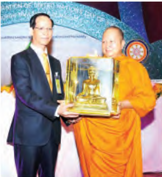
ဒုတိယသမ္မတ ဒေါက်တာစိုင်းမောက်ခမ်းအား မဟာချူလာ လောင်ကွန်တက္ကသိုလ်မှ ပါမောက္ခချုပ်ဆရာတော်က ဗုဒ္ဓဆင်းတုတော် လက်ဆောင်ပေးအပ်စဉ်။ (သတင်းစဉ်)