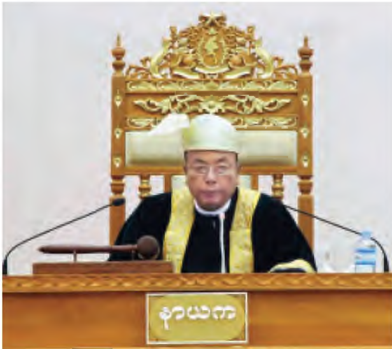
ပြည်ထောင်စုလွှတ်တော် ဒုတိယနေ့အစည်းအဝေးကျင်းပစဉ်။ (သတင်းစဉ်)

ကမာရွတ်မဲဆန္ဒနယ်မှ ခေါက်တာစိုးရင်က ဆွေးနွေးရာတွင် နိုင်ငံတော်သမ္မတအနေဖြင့် ဥပဒေကိုသို့အာဏာတည်သောအမိန့်ကို ထုတ်ပြန်ခဲ့သော်လည်း လွှတ်တော်၏ အတည်ပြုချက် လိုအပ်ပါကြောင်း၊ နိုင်ငံတော်သမ္မတ၏ ဥပဒေကိုသို့ အာဏာတည်သောအမိန့် (၁/၂၀၁၃) အရေးပေါ်အခြေအနေကို လွှတ်တော်က အတည်ပြုမည်ဆိုပါက အချိန်ကာလကြေညာခြင်းကို သတ်မှတ်ရန် လိုအပ်ပါကြောင်း၊ အာဏာပိုင်အဖွဲ့အနေဖြင့် အရေးပေါ်အခြေအနေကြေညာရသည့် လူစုလူဝေးအကြမ်းဖက်မှုများကို ဥပဒေပြဌာန်းချက်အတိုင်း အကောင်အထည်ဖော်မှုအားကောင်းအောင် ဆောင်ရွက်နိုင်ခြင်းရှိ မရှိလေ့လာပြီး အားနည်းချက်များရှိပါက မည်သို့ဆောင်ရွက်သင့်သည်ကို လွှတ်တော်က ဆန်းစစ်ပိုင်းဝန်း ဆောင်ရွက်သင့်ပါကြောင်းနှင့် မိတ္တီလာကဲ့သို့ လူစုလူဝေးအကြမ်းဖက်မှုများ ထပ်မံမဖြစ်ပေါ်အောင် အစိုးရနှင့်ပြည်သူ့ကိုယ်စားလှယ်များက ပိုင်းဝန်းဆောင်ရွက်သင့်ပါကြောင်းဖြင့် ဆွေးနွေးခဲ့သည်။