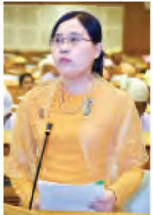
မွန်ပြည်နယ် အမှတ်(၁)မှ ဆွေးနွေးစဉ်။ (ယာဝုံ) (သတင်းစဉ်)

အဆိုနှင့်စပ်လျဉ်း၍ ပြည်ထောင်စုလွှတ်တော်အထူးအစည်းအဝေးကို နေပြည်တော်စုဝန်ကြီး သာသနာရေးဝန်ကြီးဌာန ပြည်ထောင်စုဝန်ကြီး ဦးဆန်းဆင့်က ပဋိပက္ခဖြစ်ပွားမှုများအနေဖြင့် အချိန်ကာလများစွာ ကြာမြင့်သော်လည်း ပျက်စီးဆုံးရှုံးမှုများသည်အတွက် တည်ငြိမ်အေးချမ်းမှု