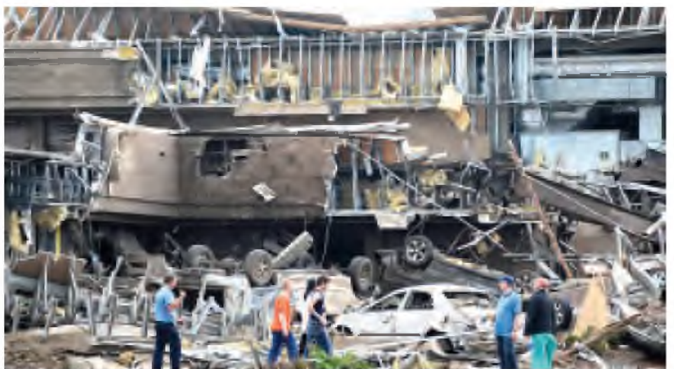
အိုကလာဟိုးမားမြို့ ဆင်ခြေပုံးဒေသများ၌ လေဆင်နှာမောင်း တိုက်ခတ်မှုအပြီး အပျက်အစီးများကို တွေ့ရစဉ်။