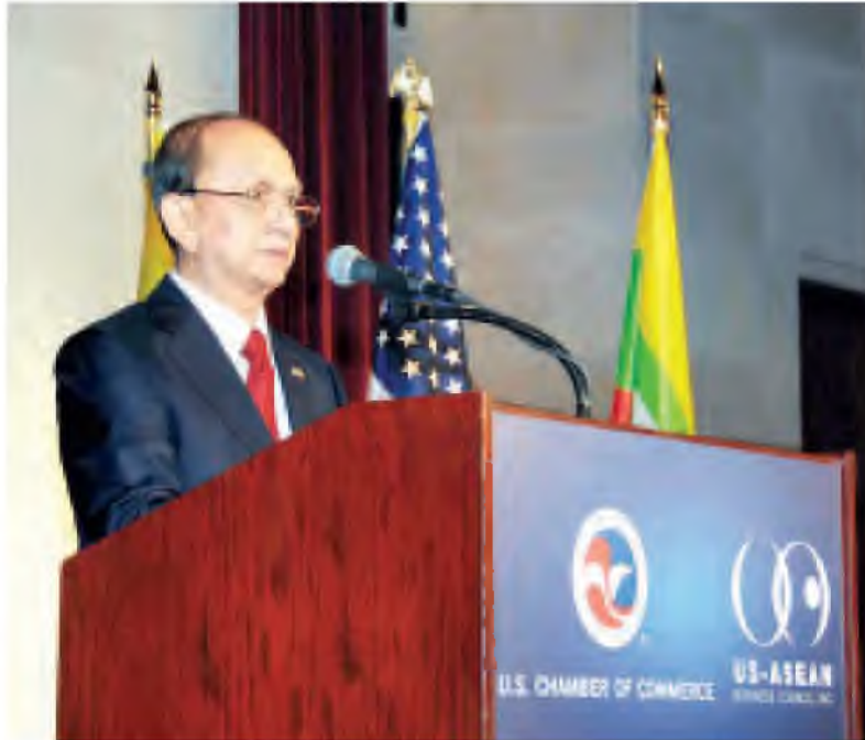
နိုင်ငံတော် သမ္မတ ဦးသိန်းစိန် အမေရိကန်-အာဆီယံ စီးပွားရေး ကောင်စီနှင့် အမေရိကန် ကုန်သည် ကြီးများ အသင်း တို့က ပူးပေါင်း ကျင်းပသည့် စားပွဲဝိုင်း ဆွေးနွေးပွဲ၌ အမှာစကား ပြောကြားစဉ်။ (သတင်းစဉ်)

ပြည်ထောင်စုသမ္မတမြန်မာနိုင်ငံတော် နိုင်ငံတော်သမ္မတ ဦးသိန်းစိန်သည် မေ ၂၀ ရက် ဖေသစ်တော်ချိန် ညနေ ၅ နာရီ မိနစ် ၂၀ တွင် အမေရိကန်ပြည်ထောင်စု ဝါရှင်တန်မြို့ရှိ အမေရိကန်ကုန်သည်ကြီးများအသင်း (US Chamber of Commerce)နှင့် ကျင်းပသည့် အမေရိကန်-အာဆီယံ စီးပွားရေးကောင်စီ(US-ASEAN Business Council)နှင့် အမေရိကန်ကုန်သည်ကြီးများအသင်းတို့ ပူးပေါင်းကျင်းပသည့် စားပွဲဝိုင်းဆွေးနွေးပွဲသို့ တက်ရောက်သည်။