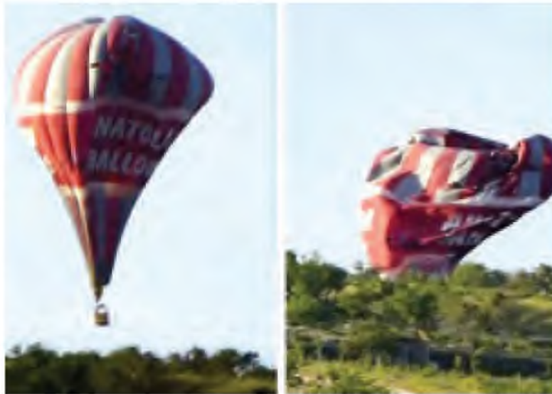
ဝေဟင်အတွင်း လူစီးဓာတ်ငွေ့ဘောလုံးပွဲ နှစ်စဉ် တိုက်မိပြီးနောက် တစ်စင်းပျက်ကျခဲ့သည့် ချုံကို တွေ့ရစဉ်။