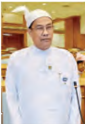
ရန်ကုန်တိုင်းဒေသကြီး ကမာရွတ်မြို့နယ် မဲဆန္ဒနယ်မှ ခေါက်တာစိုးရင် ဆွေးနွေးစဉ်။ (ဒီပုံ) (သတင်းစဉ်)

ယခင် ၂၀၁၃ ခုနှစ် ဇန်နဝါရီ ၁၀ ရက်က အသုံးပြုခဲ့သည့် ပြည်ထောင်စုလွှတ်တော်စာတန်းပါ ရင်ထိုးတံဆိပ်အစား အပေါ်ဘက်တွင် ပြည်ထောင်စုသမ္မတမြန်မာနိုင်ငံတော်စာတန်း၊ အလယ်တွင် နိုင်ငံတော်အထိမ်းအမှတ်တံဆိပ်နှင့် အောက်ဘက်တွင် ပြည်ထောင်စုလွှတ်တော်စာတန်းပါ ရင်ထိုးတံဆိပ်ကို ပြောင်းလဲအသုံးပြုရမည်ဖြစ်ပြီး မိမိ၏လွှတ်တော်သက်တမ်းကာလအတွင်း လွှတ်တော်အစည်းအဝေးတက်ရောက်ခြင်းအပါအဝင် တာဝန်ချိန်များတွင် အဆောင်အယောင်တစ်ခုအနေဖြင့် တပ်ဆင်အသုံးပြုရန်ဖြစ်ကြောင်း သိရသည်။