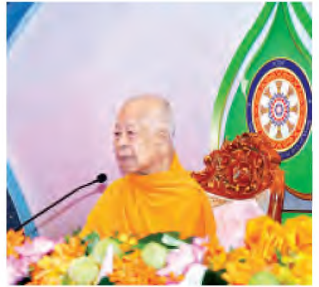
အပြည်ပြည်ဆိုင်ရာ ဗုဒ္ဓနေ့ကောင်စီဥက္ကဋ္ဌ ဆရာတော် Somdet Phra ဩဝါဒစကား မြတ်ကြားစဉ်။

အဆိုပါအခမ်းအနားကို မေ ၂၂ ရက်အထိ ကျင်းပမည်ဖြစ်သည်။ ကုလသမဂ္ဂဗုဒ္ဓနေ့ အခမ်းအနားကို ၂၀၀၄ ခုနှစ်မှ စတင်ကျင်းပခဲ့ပြီး နှစ်စဉ်ကျင်းပလာကြောင်းကြောင်း သိရ