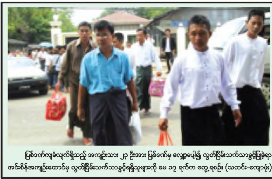
မြစ်ဝကျွန်းပေါ်ရှိသည့် အကျဉ်းသား ၂၃ ဦးအား မြစ်ဝကျွန်းပေါ်ရှိ လွတ်ငြိမ်းသက်သာခွင့်ပြုခဲ့ရာ အင်းစိန်အကျဉ်းထောင်မှ လွတ်ငြိမ်းသက်သာခွင့်ရရှိသူများကို မေ ၁၇ ရက်က တွေ့ရစဉ်

မုန်တိုင်းပိတ်မီနေခဲ့သော တံငါ လှေ ၆၀ ကျော်ကို ရေတပ်စစ် သင်္ဘောများက တယ်တင်ပေးခဲ့ ကြောင်း ကုမာရက ပြောကြားသည်။ မိုးသည်းထန်စွာ ရွာသွန်းမှု ကြောင့် လမ်းများရေနစ်မြုပ်ခဲ့ရပြီး ယာဉ်ပိတ်ဆို့မှုများ ဖြစ်ပေါ်ခဲ့ရ သည်။