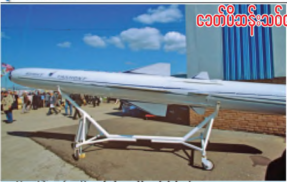
ရုရှားနိုင်ငံမှ ဆီးရီးယားသို့ ခေတ်မီဆုံးလက်နက်များ တင်ပို့ရာတွင် ပါဝင်သည့် သင်္ဘောပျက် ချိုးကျည်အမျိုးအစားတစ်ခုကို တွေ့ရစဉ်။