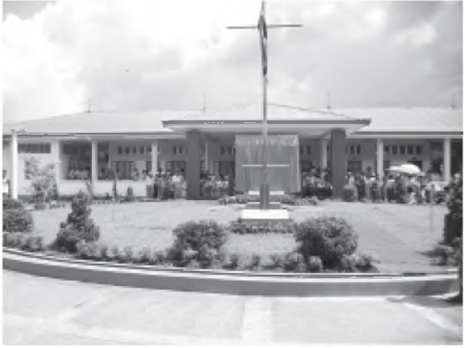
ဘိုကလေးမြို့နယ် မြင်းကကုန်းစံပြကျေးရွာရှိ ခုတင် (၄၀) ဆံ့ တိုက်နယ်ဆေးရုံ။

ခန်း၊ အမျိုးသမီးလူနာသီးသန့်ဆောင်၊ အမျိုးသားလူနာသီးသန့်ဆောင် နှစ်ဆောင်၊ မီးဖွားခန်း တစ်ခန်း၊ မီးဖွားပြီးလူနာခန်း တစ်ခန်း၊ အစည်းအဝေးခန်းမ တစ်ခန်း၊ ခွဲစိတ်ခန်းနှစ်ခန်း၊ ဘုရားခန်း၊ ဓာတ်ခွဲခန်း၊ ဆေးသို