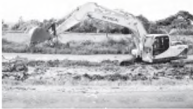
တွံတေးမြို့နယ်၌ စပါးစိုက်ခင်းများရေနှစ်မြုပ်မှုမှ ကာကွယ်ရေးအတွက် ရေနုတ်မြောင်းများကို စက်ကြီးများဖြင့် ဖောက်လုပ်နေစဉ်။

တွံတေး မေ ၁၇ တွံတေးမြို့သည် ရန်ကုန်တိုင်းဒေသကြီးအတွင်း၌ရှိပြီး ရန်ကုန်နှင့် ကားလမ်း ၁၇ မိုင်၊ ရေလမ်း ၁၅ မိုင်ခန့်သာဝေးသည့်မြို့ဖြစ်သည်။ မြို့အကျယ်အဝန်းမှာ စတုရန်းမိုင် ၂၇၉ ဒသမ ၉၄ မိုင် ကျယ်ဝန်း၍ လူဦးရေ ၂၁၄၆၀၀ နေထိုင်လျက်ရှိပြီး လူဦးရေ ၈၁ ရာခိုင်နှုန်းမှာ ကောက်လယ်သမားများဖြစ်ကြသည်။