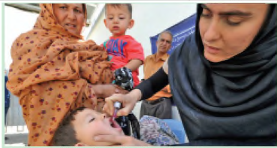
အာဖဂန်နစ္စတန်နိုင်ငံတွင် ပိုလီယိုရောဂါ ကာကွယ်ဆေးတိုက်ကျွေးမှုကို တွေ့ရစဉ်။

ကဟက်ဂ် မေ ၁၇ ဘိုလီးဗီးယားနိုင်ငံ၏ ဆင်းရဲမွဲတေမှုနှုန်းသည် နိုင်ငံလူဦးရေ စုစုပေါင်းအနက် ၂၀ ရာခိုင်နှုန်း လျော့ကျခဲ့ကြောင်း၊ ပင်စင်တိုးမြှင့်ခဲ့သည့် အစီအစဉ်ကြောင့် ပြည်သူများ ပိုမိုအဆင်ပြေလာခြင်းဖြစ်ကြောင်း ဘိုလီးဗီးယားအစိုးရက မေ ၁၆ ရက်တွင် ပြောကြားခဲ့သည်။ တစ်နေ့လျှင် အမေရိကန်ဒေါ်လာ ၁.၁၁၁၂၅ ဝင်ငွေမရှိသူသည် ဆင်းရဲမှု အခြေအနေရှိကြောင်း၊ တောင်အမေရိကတိုက်၏ အဆင်းရဲဆုံးနိုင်ငံဖြစ်သော ဘိုလီးဗီးယား၌ အဆိုပါ ဆင်းရဲမွဲတေမှုနှုန်းကို ၂၀၁၅ ခုနှစ်မတိုင်မီ အမြင့်မြတ် လုပ်ဆောင်သွားမည်ဖြစ်ကြောင်း စီးပွားရေးနှင့် ဘဏ္ဍာရေးဝန်ကြီးဌာန လူစာဆက်စာတိုက်ရာက ပြောကြားသည်။ မျက်မှောက်ဆင်းရဲမွဲတေမှုနှုန်းသည် ၂၀၀၇ခုနှစ်စာရင်းထက် ထက်ဝက်မျှ လျော့ကျပြီး ၃၈ဒဿမ ၂ ရာခိုင်နှုန်းသာ ရှိသည်ဟု သိရှိရသည်။ ဂုဏ်သိက္ခာရှိသော ဝင်ငွေအမည်ဖြင့် စီမံချက်ချ ဆောင်ရွက်ခဲ့သဖြင့် မကြာသေးမီနှစ်များအတွင်းက ပြည်သူတို့၏ လူနေမှုဘဝ တိုးတက်လာရခြင်း ဖြစ်ကြောင်း၊ ၂၀၁၇ ခုနှစ်မတိုင်မီ စီမံချက်ကြောင့် လူဦးရေတစ်သန်းထက်မနည်း ဆင်းရဲတွင်းမှ လွတ်မြောက်လာနိုင်မည်ဟု မျှော်မှန်းထားကြောင်း ၎င်းက ပြောကြားခဲ့သည်။ ထိုစီမံချက်ကို ကျေးလက်ဒေသတွင် အောင်မြင်အောင် ဆောင်ရွက်နိုင်ခဲ့ကြောင်း၊ စီမံချက်ကို အကောင်အထည်ဖော်ရာတွင် ပထမဦးစွာကာလတွင်ကျေးလက်ဒေသ၌ ဆင်းရဲမွဲတေမှုနှုန်း ၄၀ ရာခိုင်နှုန်း လျော့ကျခဲ့ကြောင်း ကာတာကိုရာက ပြောဆိုခဲ့သည်။ ဆင်ယွာ။