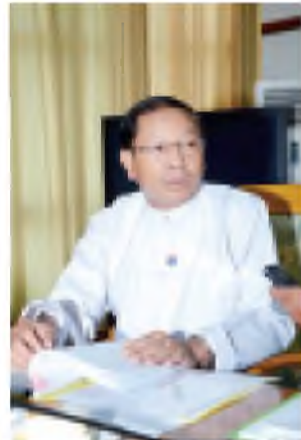
အကောက်ခွန်ဦးစီးဌာန ညွှန်ကြားရေးမှူးချုပ် ဦးထွန်းသိန်း ရှင်းလင်းပြောကြားစဉ်။

အသင့်ပြုပြင်ပြီးကားများ တင်သွင်းခွင့် ပြုခဲ့သော်လည်း လေလံဆွဲစဉ်ကပင်