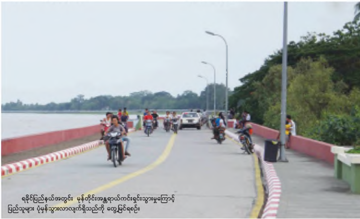
ရခိုင်ပြည်နယ်အတွင်း မုန်တိုင်းအန္တရာယ်ကင်းရှင်းသွားမှုကြောင့် ပြည်သူများ ပုံမှန်သွားလာလျက်ရှိသည်ကို တွေ့မြင်ရစဉ်။

ကြော်ငြာ စာမျက်နှာ အပိုပါရှိ ယနေ့ထုတ် ကြေးမုံသတင်းစာ တွင် ကြော်ငြာ ကားခရီးယ လေးမျက်နှာ အပိုပါရှိပါသည်။