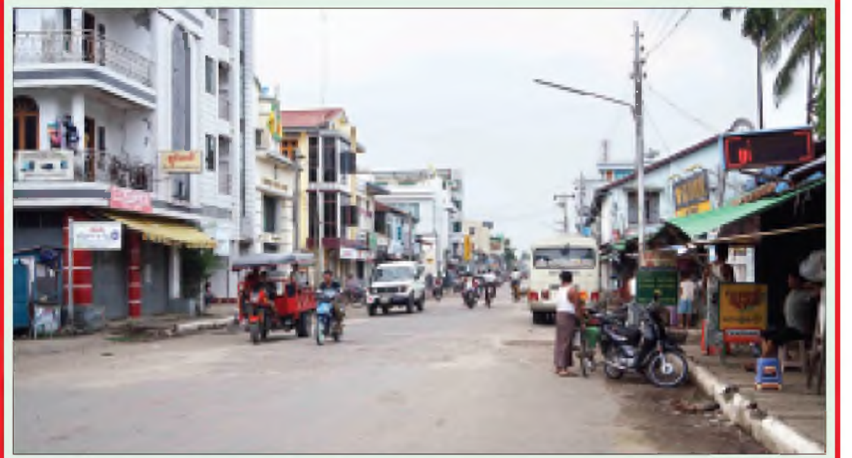
ရခိုင်ပြည်နယ်အတွင်း မုန်တိုင်းအန္တရာယ်ကင်းရှင်းသွားမှုကြောင့် ပုံမှန်သွားလာလျက်ရှိသည်ကို တွေ့ရစဉ်။ (သတင်း-ကျော့ဖုံး)

အမျိုးအစား တစ်မျိုး၊ ထွန်စက် ၆၅ စီးတို့အား ဂျပန်သံအမတ်ကြီးမှ လွှဲပြောင်းပေးအပ်ကာ မြန်မာနိုင်ငံ တွင် ၂၀၁၁ ခုနှစ်က ဖြစ်ပွားခဲ့သော (၀၃၇)