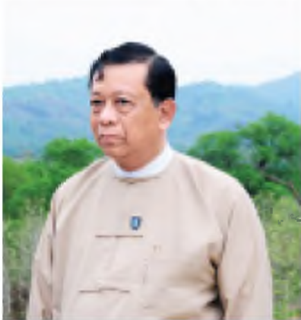
ဒုတိယဝန်ကြီး ဒေါက်တာ ဝင်းမြင့် ရှင်းလင်း ပြောကြားစဉ်။ (သတင်းစဉ်)

ဖြေ။ ဗဟိုမှာ Rapid Response Team အဖွဲ့တွေကို အဆင်သင့် စုစည်း