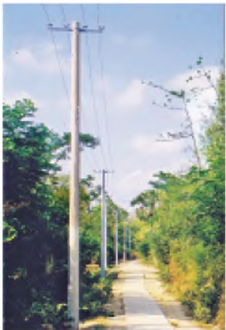
ပြည်သူပါဝင်သော လျှပ်စစ်စွမ်းအားကဏ္ဍမြှင့်တင် ရေးအစီအစဉ်ဖြင့် မီးလင်းတော့မည့် ပေါက်ကုန်းရွာ၌ လျှပ်စစ်ဓာတ်တိုင်နှင့်ဓာတ်ကြိုးများ စိုက်ထူသွယ်တန်း ထားသည်ကို တွေ့ရစဉ်။

နေပြည်တော် မေ ၁၆ အားကစားဝန်ကြီးဌာန ဒုတိယဝန်ကြီး ဦးသောင်းထိုက်သည် မေ ၁၄ ရက် နံနက် ၉ နာရီတွင် နေပြည်တော် ဝဏ္ဏသိဒ္ဓိအားကစားပြိုင်ပွဲဝင်းရှိ ဘောလုံး လေ့ကျင့်ရေးကွင်းအမှတ်(၂)၌ စခန်းသွင်းလေ့ကျင့်လျက်ရှိသည့် အမျိုးသမီး ဘောလုံးအားကစားသမားများ လေ့ကျင့်နေမှုကို ကြည့်ရှုအားပေးသည်။ ထို့နောက် ဝန်ကြီးဌာန အစည်းအဝေးခန်းမ၌ကျင်းပသည့် (၂၇)ကြိမ် မြောက်အရှေ့တောင်အာရှ အားကစားပြိုင်ပွဲအကြို ဆန်းစစ်တာဝေးစက်ဘီး ပြိုင်ပွဲကျင်းပနိုင်ရေး ညှိနှိုင်းအစည်းအဝေးတွင် အမှုစကား ပြောကြားသည်။ ယင်းနောက် တာဝန်ရှိသူများက ဆန်းစစ်စက်ဘီးပြိုင်ပွဲကျင်းပမည့် အစီအစဉ်ကို ရှင်းလင်းတင်ပြကာ ကော်မတီများမှ ကိုယ်စားလှယ်များက ဆောင်ရွက်ထားမှုများအား တင်ပြဆွေးနွေးခဲ့ကြကြောင်း သတင်းရရှိသည်။ (သတင်းစဉ်)