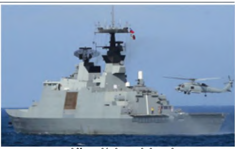
တရုတ်တိုင်ပင်ပေရေတပ်၏ စစ်ရေးလေ့ကျင့်မှုကို တွေ့ရစဉ်။