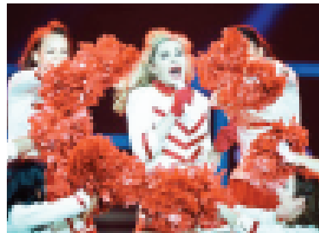
မက်ဒေါနား၏ MDNA ကမ္ဘာလှည့်ဂီတဖျော်ဖြေ ရေး ခရီးစဉ်များအနက်မှ ဖျော်ဖြေပွဲတစ်ပွဲကို တွေ့ရစဉ်။

ထို့ပြင် မင်ဒေါနားသည် မြောက်မြားစွာသော Billboard ဆုများကို ဆွတ်ခူးရယူခဲ့သူတစ်ဦးဖြစ်ကာ တစ်နှစ်တာလုံးအတွက် အကောင်းဆုံးတစ်ကိုယ်တော် အယ်လ်ဘမ်များစာရင်းတွင်လည်း ပါဝင်နိုင်ခဲ့သူတစ်ဦး ဖြစ်သည်။