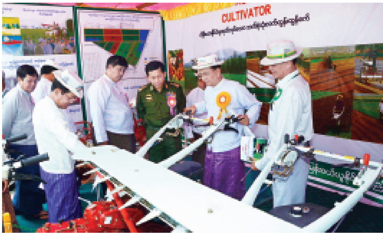
နိုင်ငံတော်သမ္မတ ဦးသိန်းစိန် လယ်ယာသုံးစက်ကိရိယာများ ခင်းကျင်းပြသထားမှုကို လှည့်လည်ကြည့်ရှုအားပေး စဉ်။ (သတင်းစဉ်)

ရောင်းဝယ်ရေး၊ စိုက်ပျိုးရေးလုပ်ငန်း သုံး စက်ကိရိယာများ၊ သွင်းအားစု များပံ့ပိုးရေးနှင့် အသေးစားငွေချေး လုပ်ငန်းများကို ကျယ်ကျယ်ပြန့်ပြန့် ဆောင်ရွက်လျက် ရှိပါကြောင်း၊ အသင်းဝင်အသင်းပေါင်း ၉၉၆ သင်း ရှိပြီး အသင်းသား ကိုးသန်းကျော်ရှိ သည်ဟု သိရပါကြောင်း။ အလားတူ အိန္ဒိယနိုင်ငံ၌ India Farmers Fertilizer Cooperative - IFFCO ဓာတ်မြေဩဇာ ထုတ်လုပ် ရောင်းချရေး သမဝါယမအသင်းသည် အောင်မြင်နေသော သမဝါယမ အသင်းတစ်သင်းဖြစ်ပြီး အသင်း ပေါင်း ၃၉၈၂၄ သင်း၊ အသင်းသား လယ်သမား သန်း၆၀ ကျော်ရှိသည်ဟု သိရပါကြောင်း။ ယင်းတို့မှာ ဥပမာအနေဖြင့် အနည်းငယ် ထုတ်နုတ်တင်ပြခြင်း ဖြစ်ပြီး သမဝါယမလုပ်ငန်း အောင်မြင် နေသောနိုင်ငံအများအပြား ရှိနေသေး