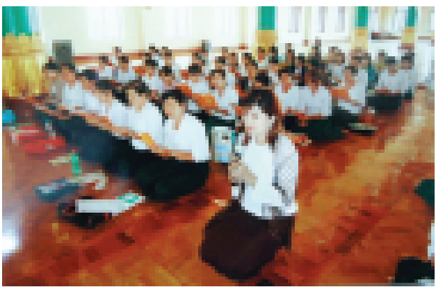
ရှမ်းပြည်နယ် တောင်ကြီးမြို့နယ် အေးသာယာမြို့သစ်၌ ဧပြီလအတွင်း မြန်မာနိုင်ငံလုံးဆိုင်ရာ ထေရဝါဒ ဗုဒ္ဓဘာသာအဖွဲ့ချုပ်နှင့် နတ်စင်တောင် တန်းဒေသ ရှမ်းပြည်နယ် သာသနဓနုဂ္ဂဟအသင်း၏ ဦးဆောင်မှုဖြင့် ဖွင့်လှစ် သော ယဉ်ကျေးလိမ္မော်(ယဉ်ကျေးမှုကျင့်ဝတ်ဘာသာရပ်)ဆရာဖြစ်မွမ်းမံ သင်တန်း၌ ဆရာ ဆရာမ ၈၀ တို့ တက်ရောက်ကြစဉ်။ (ကြေးမုံ)

အစည်းအဝေး၏ ဆုံးဖြတ်ချက်အရ ဆေးဘက်ဆိုင်ရာကော်မတီဖွဲ့စည်းရေး နှင့် လစဉ် အစည်းအဝေးကျင်းပရေး၊ ဆရာဝန်နှင့်သူနာပြုများ ခန့်အပ် တာဝန်ပေးရေးတို့အား မြန်မာနိုင်ငံ ဘောလုံးအဖွဲ့ချုပ် ပါမောက္ခ ဆရာဝန် ကြီးများနှင့် ကျွမ်းကျင်သူများမှ ဆက်လက်ဆောင်ရွက်သွားမည်ဖြစ် ကြောင်းသိရသည်။ (ဇော်မင်းအောင်)