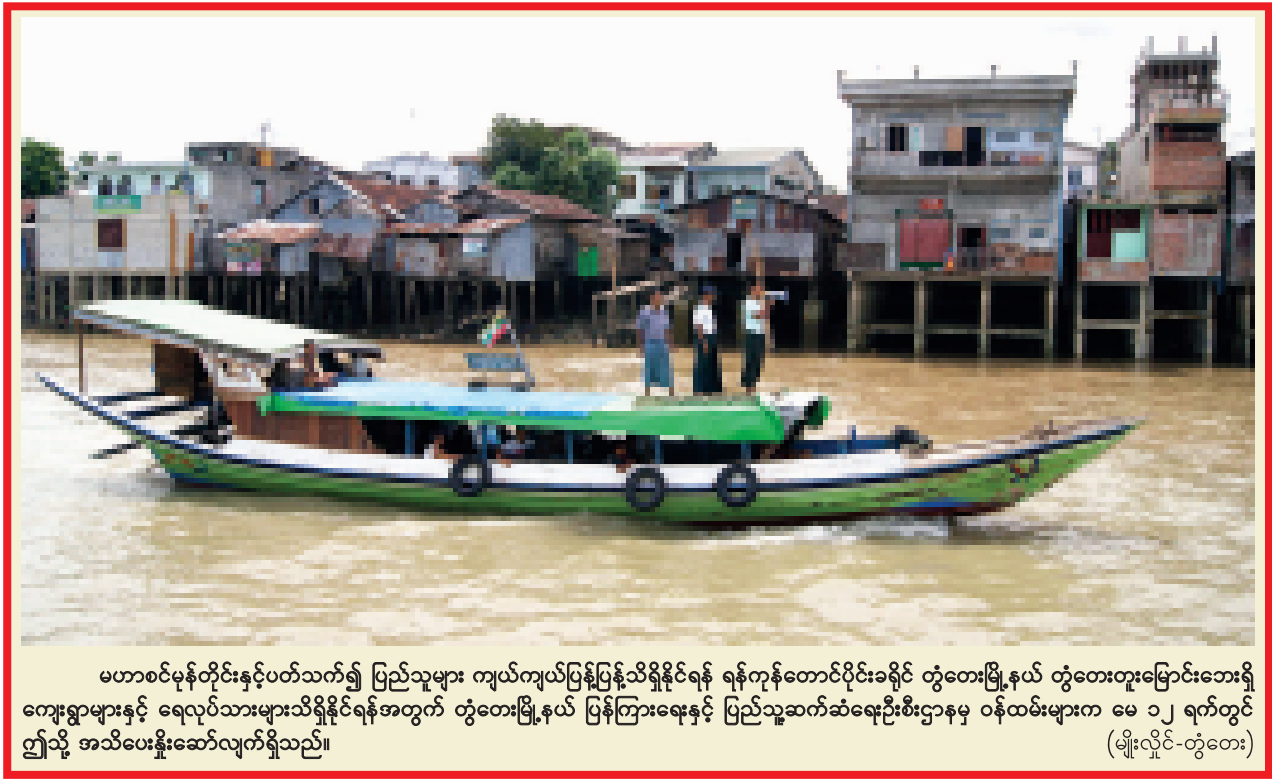
မဟာစင်မုန်တိုင်းနှင့်ပတ်သက်၍ ပြည်သူများ ကျယ်ကျယ်ပြန့်ပြန့်သိရှိနိုင်ရန် ရန်ကုန်တောင်ပိုင်းခရိုင် တွဲတေးမြို့နယ် တွဲတေးတူးမြောင်းဘေးရှိ ကျေးရွာများနှင့် ရေလုပ်သားများသိရှိနိုင်ရန်အတွက် တွဲတေးမြို့နယ် ပြန်ကြားရေးနှင့် ပြည်သူ့ဆက်ဆံရေးဦးစီးဌာနမှ ဝန်ထမ်းများက မေ ၁၂ ရက်တွင် ဤသို့ အသိပေးနှိုးဆော်လျက်ရှိသည်။ (မျိုးလှိုင်-တွဲတေး)