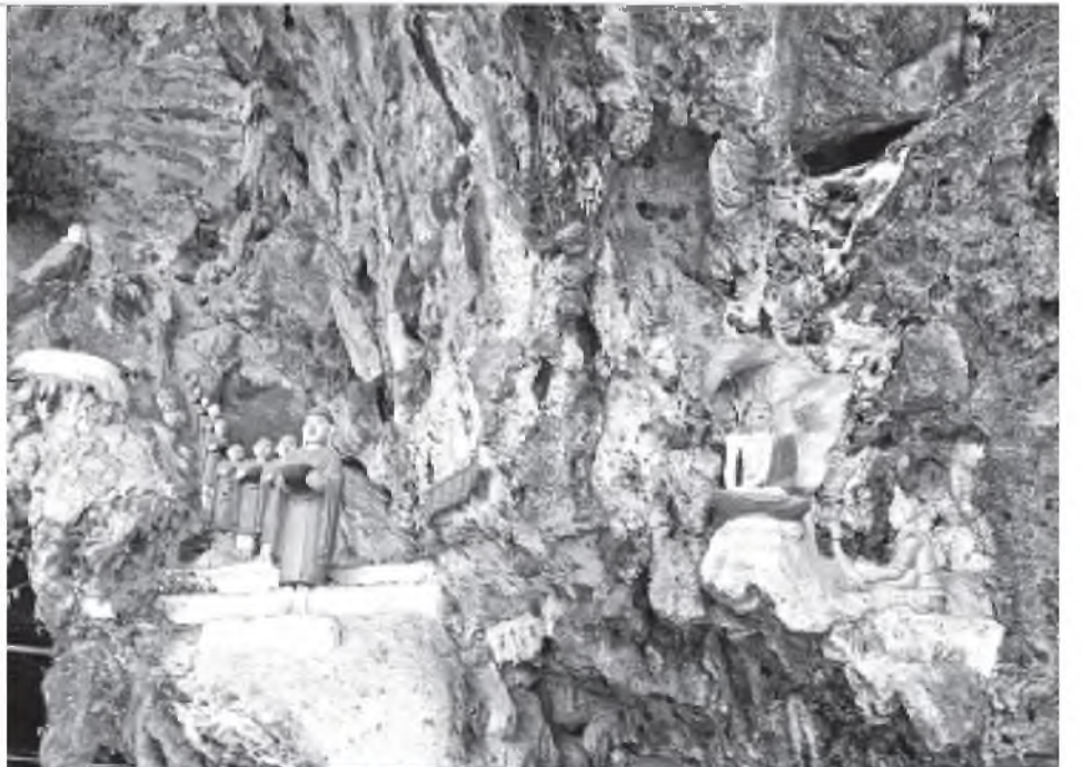
ကရင်ပြည်နယ် ဘားအံမြို့နယ် ကော့ကသောင်ကျေးရွာရှိ ကော့ကသောင်လိုက်ဂူတော်ကို တွေ့ရစဉ်။

ကော့ကသောင်လိုက်ဂူတော်သည် ဗုဒ္ဓယဉ်ကျေးမှုအမွေအနှစ်များကိုနားလည်လျက်ရှိပြီး ဗုဒ္ဓရုပ်ပွားတော်များ၊ ဆင်းတုတော်များ၊ ရုပ်တော်များ၊ လျောင်းတော်မူဘုရားအမျိုးမျိုးနှင့်မြတ်ဗုဒ္ဓ၏ဓာတ်တော်မွေတော်များကို ဖူးမြော်ကြည့်ည့်နိုင်ပြီး ဝန်ရံထုံးကျောက်ပုံသဏ္ဌာန် အရောင်အမျိုးအစားနှင့် နံရံဆေးရေးပန်းချီကားချပ်တို့မှာ ခရီးသွားပြည်သူများနှင့် ဗဟုသုတလေ့လာလိုက်စားသူများကို အထူးဆွဲဆောင်လျက်ရှိသည်။ ကော့ကသောင်လိုက်ဂူ၏တောင်ထိပ်တွင် အောင်သိဒ္ဓိဆူတောင်မြည်စေတီတော်ကို တည်ထားပြီး ဉာဏ်တော်အမြင့်မှာ ကိုးတောင်ရှိ၍ ရွေးလူကြီးများက ကိုးတောင်မြည်စေတီဟု တင်စားခေါ်ဝေါ်ကြသည်။ ကိုးတောင်မြည်စေတီကို ဖူးမြော်ကြည့်ည့်နိုင်ရန်