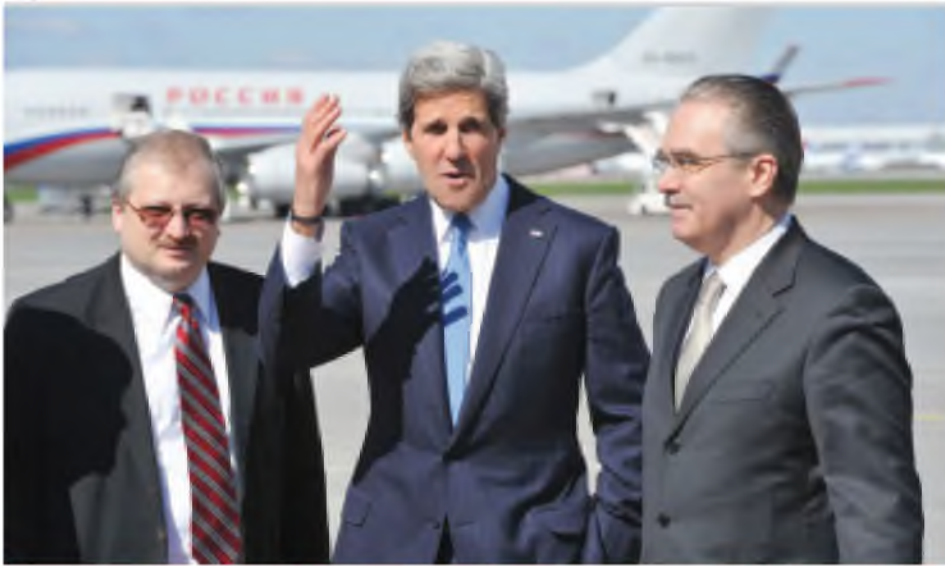
မေ ၇ ရက်က မြို့တော်မော်စကိုရှိ ဗီဇူလိုဝ်လေဆိပ်သို့ ဆိုက်ရောက်လာသော အမေရိကန်နိုင်ငံခြားရေးဝန်ကြီး ဂျွန်ကယ်နီ(အလယ်)။