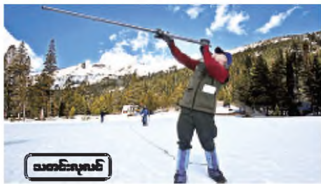
သတင်းလူပုဂ္ဂိုလ်