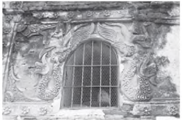
သိရသည်။ စစ်ကိုင်းမြို့တွင် ရှေးမြန်မာမင်းများလက်ထက်က စစ်ပွဲများ အောင်မြင်ရာမှ ခေါ်ဆောင်လာသည့် သူပုန်းများ၊ လက်မူပညာရှင်များကို နေရာချထားခဲ့ကြောင်း၊ လင်းလင်း၊ ဒါးဝယ်ရွေး၊ ကန္တာတော်၊ ဘော်ဂါ၊ ချင်းစ၊ ပုဏ္ဏားစု၊ အင်ချင်စု စသည့်ရပ်ကွက်၊ ကျေးရွာများ တည်ရှိခဲ့ကြောင်း သိရသည်။

သိမ်တော်ကြီး၏ အရှေ့ဘက်မျက်နှာနှင့် အနောက်ဘက်မျက်နှာတွင် ပြတင်းလေးပေါက်စိပ်ပါရှိပြီး ပြတင်းပေါက်ပေါင်ခွေများကို ပန်းတော့ပညာဖြင့် ပုံသဏ္ဌာန်အမျိုးမျိုး တန်ဆာဆင်ထားသည်။ ပြတင်းပေါက် ရှစ်ပေါက်ရှိရာ ပြတင်းတစ်ပေါက်စီတွင် အဆင်တန်ဆာတစ်မျိုးစီဖြင့် ခြယ်မှုန်းပြုလုပ်ထားသည်။ ပြတင်းပေါင်ခွေအရပ်များကို ဂဠုန်၊ နဂါး၊ သုတ်ချီထားဟန်၊ နဂါးကျေးနင်းပုံ၊ မကွေးအမြီးယုတ်ပုံ၊ ကျေးပန်းကိုက်ပုံ၊ ဟင်္သာအမြီးဆိုင်ပုံ စသည်တို့နှင့် အပြင်နံရံများတွင် ပန်းပွင့်များနှင့် အမွှေးအပြောင်ပြုလုပ်ထားသည်။ အမိုးထောင့်စွန်းနှင့် အလယ်တွင် တူရင်၊ စိုင်ပေါင်များ၊ ကိန္နရီရုပ်၊ နယားရုပ်၊ နတ်ရုပ်များဖြင့် အလှဆင်ထားသည်ကို တွေ့ရသည်။ သိမ်တော်ကြီး၏ တံတိုင်းမီးတား၏ ထောင့်လေးထောင့်တိုင်နှင့် တောင်ဘက်၊ မြောက်ဘက် အဝင်ပေါက်တို့တွင် စိုက်ထူထားသည့် တူရိယာတိုင်များမှာ ယိုးဒယားလက်ရာဆန်ကြောင်း