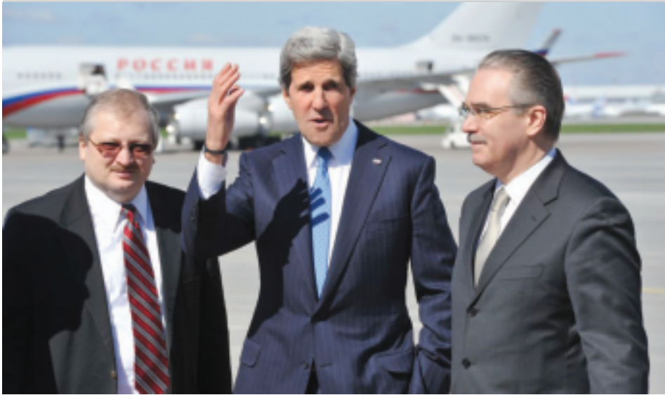
မေ ၇ ရက်က မြို့တော်မော်စကိုရှိ ဗီဇီယိုဗိုလေဆိပ်သို့ ဆိုက်ရောက်လာသော အမေရိကန်နိုင်ငံခြားရေးဝန်ကြီး ဂျွန်ကယ်နီ(အလယ်)။