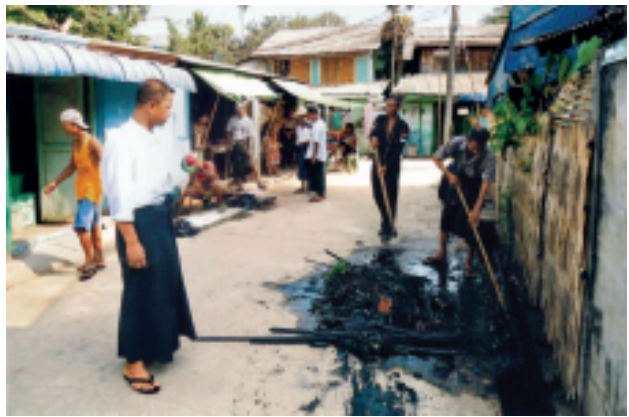
ရန်ကုန်မြို့ အင်းစိန်မြို့နယ် ရွာမအနောက်ရပ်ကွက်အတွင်း အုပ်ချုပ်ရေးမှူး ဦးဆောင်ပြီး ဆယ်အိမ်မှူး၊ ရာအိမ်မှူးများ၊ ရပ်ကွက်နေပြည်သူများနှင့် အရန်မီးသတ်တပ်ဖွဲ့ဝင်များ ပူးပေါင်းပြီး ရေစီးရေလာကောင်းမွန်ရေး လုပ်ငန်းများကို စုပေါင်းဆောင်ရွက်ကြစဉ်။ (၆၈၆)

ရန်ကုန်မှ မူဆယ်သို့ ကားခများ ကျဆင်းပြီး မူဆယ်မှ ရန်ကုန်သို့ ကားခမှာ မြင့်တက်ခြင်းမရှိကြောင်း၊ မူဆယ်မှ မန္တလေးသို့ကားခမှာ တစ်ပိဿာ ၆၅ ကျပ်ဝန်းကျင်၊ မူဆယ်မှ ရန်ကုန်သို့ ကုန်တစ်ပိဿာ ကားခ ၉၅ ကျပ်ဝန်းကျင်သာရှိရာ ရန်ကုန်-မူဆယ်ခရီးစဉ်တွင် အသွားအပြန်ကားခ ကုန်တစ်တန်လျှင် ကျပ် တစ်သိန်း နှစ်သောင်းဝန်းကျင် ရှိပြီး ယခင်နှစ်ထက်ကုန်တစ်တန်လျှင် ကျပ် ငါးသောင်းဝန်းကျင် လျော့နည်းလာကြောင်း ရန်ကုန်-မန္တလေး မူဆယ်ကိတ်ပိုင်ရှင်တစ်ဦးက ဆိုသည်။