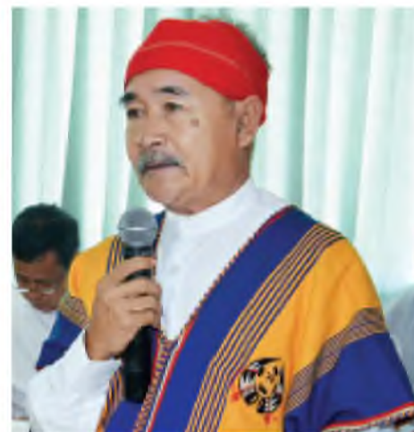
ဦးစောသိန်းအောင် (မလုံစပေါ်ပါတီ ဥက္ကဋ္ဌ)