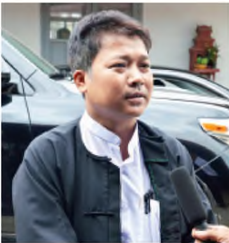
ဦးနေမျိုးဝေ (မတူကွဲပြားခြင်းနှင့် ငြိမ်းချမ်းရေးပါတီ ဥက္ကဋ္ဌ)