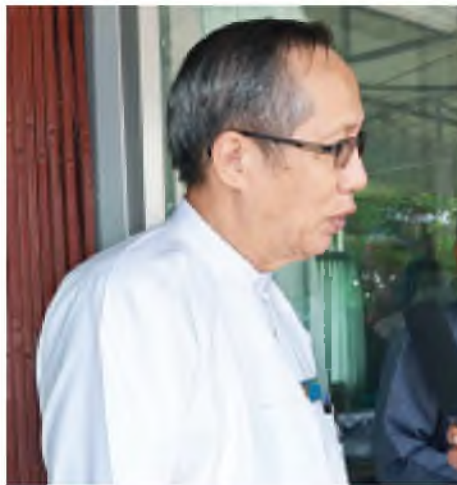
ဦးဟန်ရွှေ (တိုင်းရင်းသားစည်းလုံးညီညွတ်ရေးပါတီ ဗဟိုအလုပ်အမှုဆောင်)