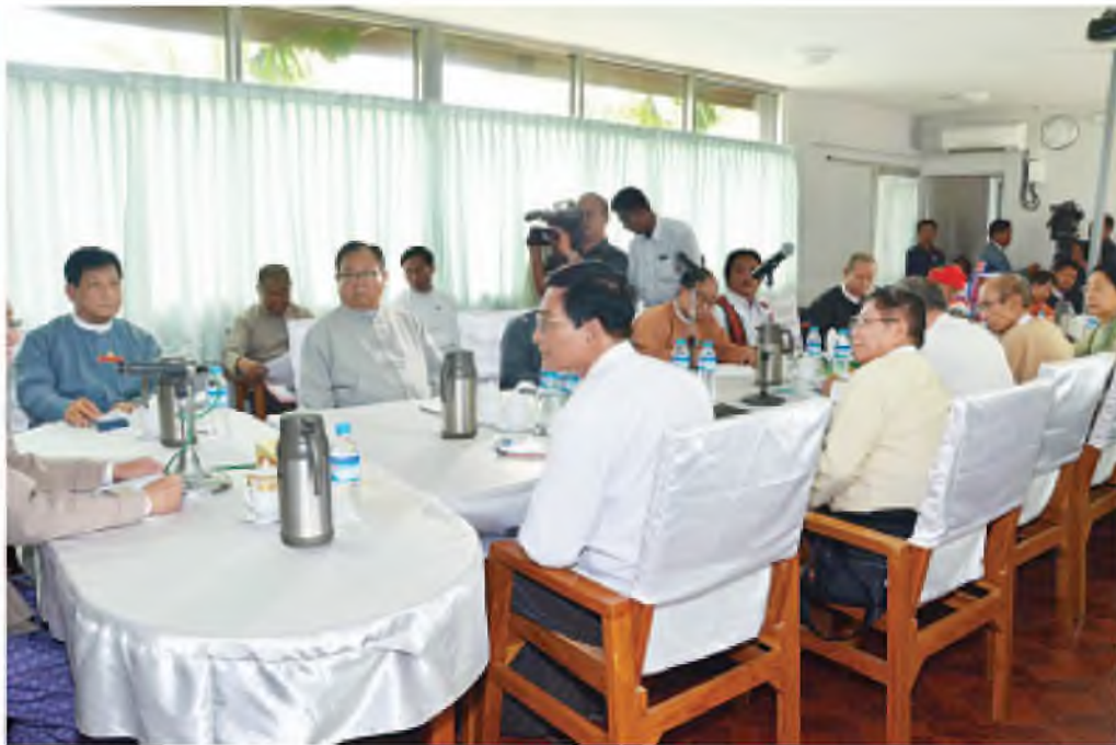
နိုင်ငံတော်သမ္မတ ဦးသိန်းစိန် နိုင်ငံရေးပါတီများမှ တာဝန်ရှိသူများနှင့် တွေ့ဆုံပွဲတွင် အမှာစကား ပြောကြားစဉ်။

★ အမျိုးသားရေးမှ လုပ်ငန်းများကို ရှာဖွေစမ်းသပ်လုပ် ဆောင်ခဲ့ရပါကြောင်း၊ မိမိတို့အနေ ဖြင့် ငြိမ်းချမ်းရေး၊ နိုင်ငံရေး၊ စီးပွား ရေးကဏ္ဍ အားလုံးတွင်မျှော်လင့် ချက်ရှိသည့် အနာဂတ်ကိုဖော် ဆောင်နိုင်ရေး ကြိုးပမ်းဆောင်ရွက် နေပါကြောင်း၊ ပြုပြင်ပြောင်းလဲရေး လုပ်ငန်းများ ဆောင်ရွက်ရာတွင် အစိုးရတစ်ဖွဲ့တည်းက ဆောင်ရွက် နေခြင်းမဟုတ်ပါကြောင်း လွှတ်တော်