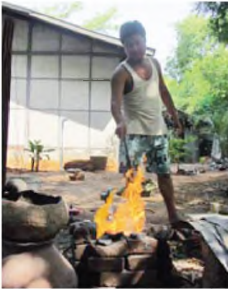
အဖြစ် ဝတ်ဆင်ခြင်းတို့တွင် အသုံးပြုကြပြီး ပြည်တွင်း ဈေးကွက် အတွင်းတွင်သာမက ထိုင်း၊ အိန္ဒိယနိုင်ငံတို့ကပါ ဝယ်ယူမှုရှိသည်။ ယင်းဘော်ဈေးအတက်အကျမှာ ရွှေဈေး နှင့် ဆက်စပ်မှုရှိပြီး မေ ၃ ရက်ထိ ဘော်တစ်ကျပ်သားလျှင် ကောက်ဈေး ကျပ် ၈၆၀၀ (တိုလာချိန်ဖြင့်) သာရှိကြောင်း သိရသည်။ ဝသန်ထွန်း(မကွေးကိုယ်ပွား)

ဖလှယ် ဓာတ်မှန်ဆေးရည် (ဖလှယ်ကိုဆေးသော Filter ဆေးရည်ဟောင်း) ဓာတ်ပုံကူးစက်မှု ကျသော စက်ကျရေ (P2)တို့မှ ဓာတုပစ္စည်းများနှင့်ဖမ်းပြီး ရလာသောအန္တရာယ်ကို အရှိန်တိုးထားသည့် လုံ့လ ဖိသွေးတို့နှင့်တိုင်း ဘော်ကို ထုတ်ယူကြရခြင်းဖြစ်သည်။(အပေါ်ယာပုံ) ဘော်ကို ရွှေချွတ်ရာ(သန့်စင်)ရာတွင် အသုံးပြုကြခြင်း၊ လက်ဝတ်ရတနာ(ရွှေရည်စိမ့်၍)အဖြစ် အသုံးပြုခြင်း၊ ဖန်စီ