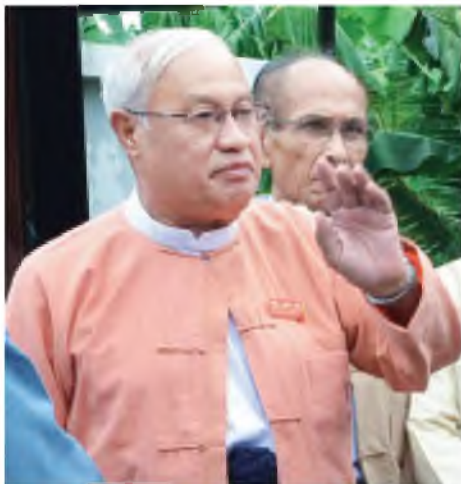
ဦးသိန်းညွန့် (အမျိုးသားဒီမိုကရေစီပါတီသစ် ဥက္ကဋ္ဌ)

ဒီလို နီးနီးကပ်ကပ်ပြောဆိုဆွေးနွေးတင်ပြခွင့်ရတာရယ်၊ ပြီးတော့ သမ္မတကြီးနဲ့လည်း ပွင့်ပွင့်လင်းလင်း ပြောခွင့်ရတာရယ်၊ ကိုယ့်အင်အား အမှန်တွေကိုလည်း သမ္မတကြီး သိနားလည်အောင် တင်ပြခွင့်ရတာရယ်