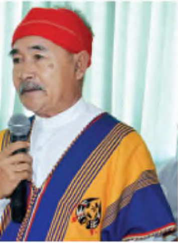
ဦးစောသိန်းအောင် (ဖလုံစေတီ ပါတီ ဥက္ကဋ္ဌ)

အာရှနှင့် ပစိဖိတ်ဌာန အိုင်အမ်အက်စ် ဒါရိုက်တာအဖွဲ့အစည်းက မြန်မာအစိုးရအနေဖြင့် မေခရီးစီးပွားရေး တည်တည်ငြိမ်ငြိမ်ဖွံ့ဖြိုးတိုးတက်ရန်အတွက် ငွေကြေးဖောင်းပွမှုကို ထိန်းချုပ်သင့်ကြောင်း၊ ဗဟိုဘဏ်နှင့် ပုဂ္ဂလိက ငွေကြေးရန်ပုံငွေအဖွဲ့တို့ကိုသို့ နိုင်ငံပိုင်နှင့် ပုဂ္ဂလိကပိုင်စီးပွားရေးလုပ်ငန်းရှင်များ ပူးပေါင်း၍ မေခရီးစီးပွားရေးတည်ငြိမ်ရန်အတွက် ငွေကြေးအဖွဲ့အစည်းများစတင်ဖွဲ့စည်းနေသည်ကိုတွေ့မြင်ရသည်မှာ ဝမ်းမြောက်ဖွယ်ရာဖြစ်ကြောင်း ပြောကြားသည်။ (ဆင်တွာ)