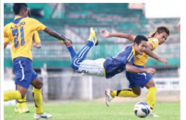
ဇွဲကပင်အသင်းတက်သို့ မကွေးတိုက်စစ်ဆင်နေစဉ်။