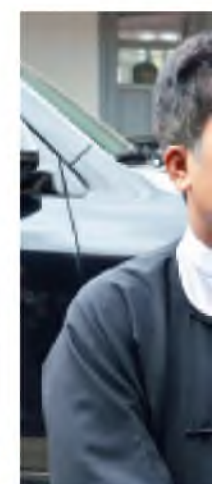
(မတူကွဲပြားခြင်းနဲ့)

ကြောင့် အလွန်ကောင်းပါတယ်။ အားရကျေနပ်ပါတယ်။