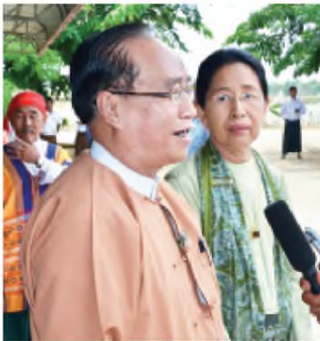
ဦးစိုင်းအိုက်ပေါင်း (ရှမ်းတိုင်းရင်းသားများ ဒီမိုကရက်တစ်ပါတီဥက္ကဋ္ဌ)