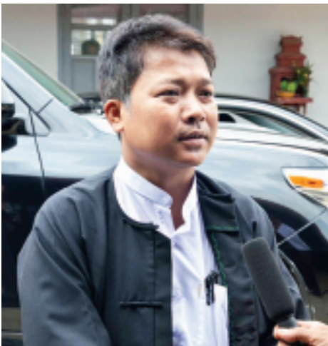
ဦးနေမျိုးဝေ (မတူကွဲပြားခြင်းနှင့် ငြိမ်းချမ်းရေးပါတီ ဥက္ကဋ္ဌ)