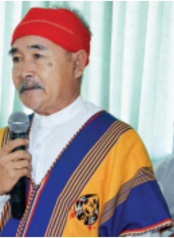
ဦးစောသိန်းအောင် (ဖလုံစပေါ်ပါတီ ဥက္ကဋ္ဌ)

အာရှနှင့် ပစိဖိတ်ဌာန အိုင်အမ်အက်ဖ် ဒါရိုက်တာအန္တင်ဆင်းက မြန်မာအစိုးရအနေဖြင့် မေခရီးစီးပွားရေး တည်တည်ငြိမ်ငြိမ်ဖွံ့ဖြိုးတိုးတက်ရန်အတွက် ငွေကြေးဖောင်းပွမှုကို ထိန်းချုပ်သင့်ကြောင်း၊ ဗဟိုဘဏ်နှင့် ပုဂ္ဂလိက ငွေကြေးရန်ပုံငွေအဖွဲ့တို့ကိုသို့ နိုင်ငံပိုင်နှင့် ပုဂ္ဂလိကပိုင်စီးပွားရေးလုပ်ငန်းရှင်များ ပူးပေါင်း၍ မေခရီးစီးပွားရေးတည်ငြိမ်ရန်အတွက် ငွေကြေးအဖွဲ့အစည်းများစတင်ဖွဲ့စည်းနေသည်ကိုတွေ့မြင်ရသည်မှာ ဝမ်းမြောက်ဖွယ်ရာဖြစ်ကြောင်း ပြောကြားသည်။ (ဆင်ဖွာ)