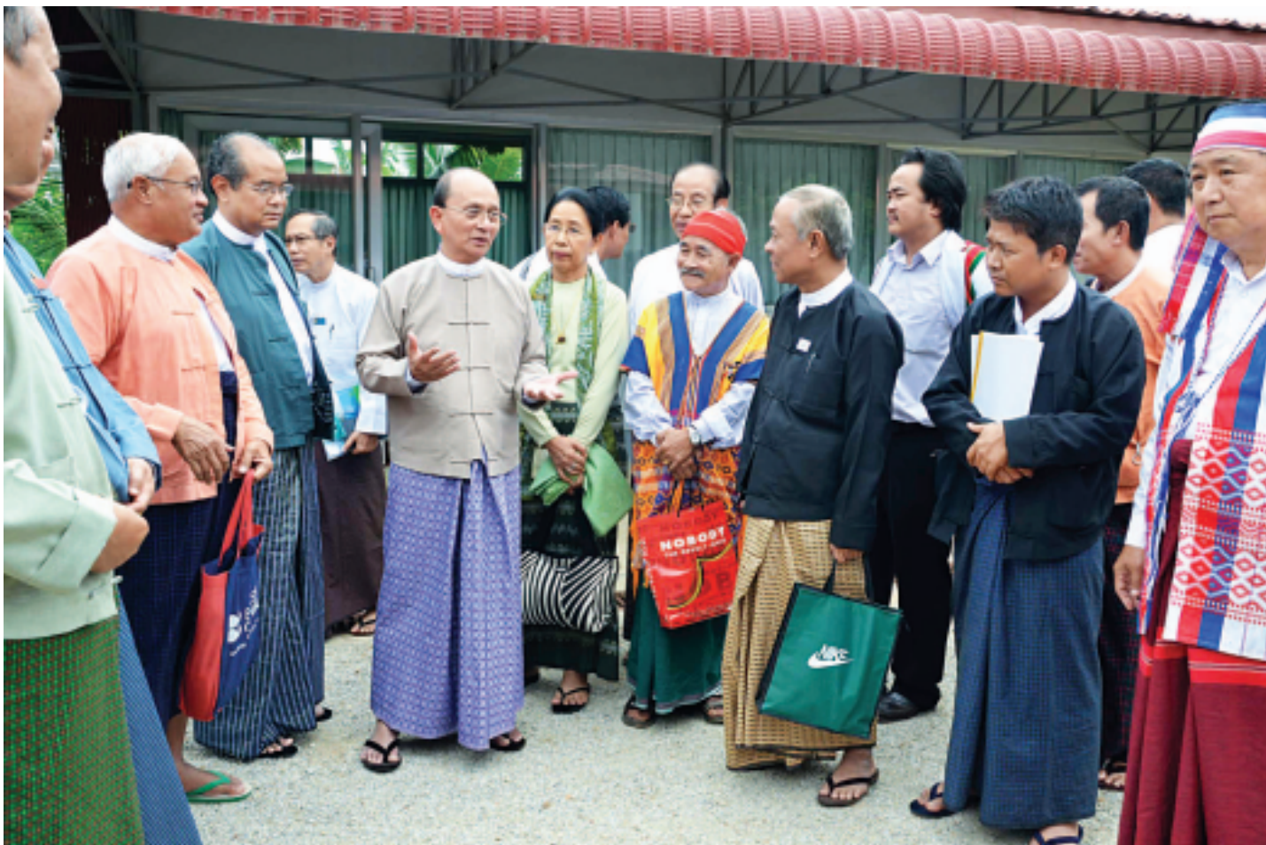
နိုင်ငံတော်သမ္မတ ဦးသိန်းစိန် နိုင်ငံရေးပါတီများမှ တာဝန်ရှိသူများအား ရင်းရင်းနှီးနှီး နှုတ်ဆက်စဉ်။

ပြည်ထောင်စုသမ္မတမြန်မာနိုင်ငံတော် နိုင်ငံတော်သမ္မတ ဦးသိန်းစိန်သည် နိုင်ငံရေးပါတီများမှ တာဝန်ရှိသူများနှင့် ယနေ့နံနက် ၁၀ နာရီခွဲတွင် နေပြည်တော်ရှိ တောင်သူပညာပေး ဧက ၅၀၀ စက်မှုလယ်ယာစံပြစိုက်ခင်း အစည်းအဝေးခန်းမ၌ တွေ့ဆုံသည်။