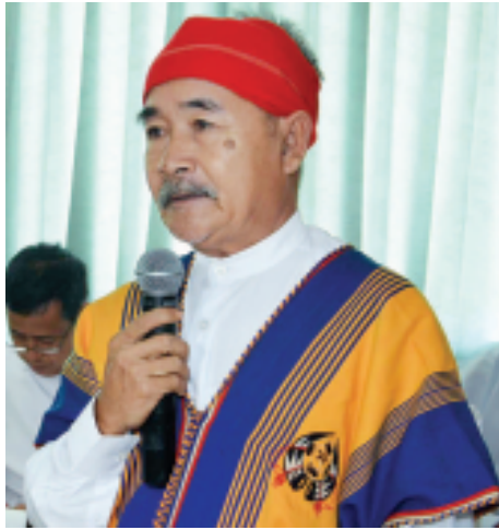
ဦးစောသိန်းအောင် (ဖလုံစပေါ်ပါတီ ဥက္ကဋ္ဌ)