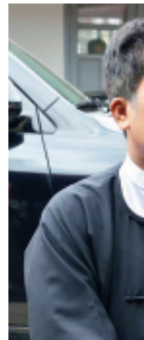
ဦးကျော်စော (မတူကွဲပြားခြင်းနားပါတီ ဥက္ကဋ္ဌ)

ကြောင့် အလွန်ကောင်းပါတယ်။ အားရကျေနပ်ပါတယ်။ ဦးကောင်းမြင့်ထွဋ် (မြန်မာအမျိုးသားကွန်ဂရက်ပါတီ ဥက္ကဋ္ဌ) နိုင်ငံရေးပါတီများနဲ့တွေ့ဆုံတာ အခုဆို သုံးကြိမ်ရှိပါပြီ။ ကျွန်တော့်အနေနဲ့ တွေ့ဆုံခွင့်ရတာ နှစ်ကြိမ်ရှိပါပြီ။ အကြိမ်တိုင်းမှာ တိုးတက်အောင်မြင်မှုတွေ ရှိပါတယ်။ နိုင်ငံတော်သမ္မတကြီးအနေနဲ့အခုလို နိုင်ငံရေးပါတီတွေနဲ့ နွေးနွေးထွေးထွေး တွေ့ဆုံတာဟာ တိုင်းပြည်ရဲ့ အနာဂတ်အတွက် ကောင်းတဲ့အလားအလာလို့ မြင်ပါတယ်။ ကျေးဇူးတင်ပါတယ်။ ဦးနေမျိုးဝေ (မတူကွဲပြားခြင်းနှင့် ငြိမ်းချမ်းရေးပါတီ ဥက္ကဋ္ဌ) သမ္မတကြီးနဲ့ ပြောရတာကတော့ ကျွန်တော်တို့ (၅) မိနစ်ပေါ့ဗျာ။ ဒါပေမယ့် အရင်ထဲက စာအုပ်စာတမ်းတွေ ပေးထားတာရှိတာကိုး။ အဲဒီတော့ အဲဒါလေးတွေကို အလေးအနက်ထားပြီးတော့ ပြောပြပါတယ်။ အဓိကပြောပြတာကတော့ ဘာသာရေးနဲ့ ပတ်သက်ပြီး ပြဿနာလေးတွေ၊ နောက်တစ်ခါ မြေသိမ်း၊ ယာသိမ်းတဲ့ ကိစ္စလေးတွေ၊ လက်ပံတောင်းတောင် ကိစ္စလေးတွေပေါ့ဗျာ။ နောက် ငြိမ်းချမ်းရေးနဲ့ ပတ်သက်တာလေးတွေ၊ စာတွေလည်း ပေးထားပြီးသား။ အခုလို လူ့အခွင့်အရေး ပြောလိုက်ရတော့ ပိုပြီးအလေးအနက်ဖြစ်သွားတယ်လို့ ထင်ပါတယ်။