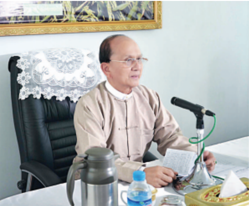
နိုင်ငံတော်သမ္မတ ဦးသိန်းစိန် နိုင်ငံရေးပါတီများမှ တာဝန်ရှိသူများနှင့် တွေ့ဆုံပွဲတွင် အမှာစကား ပြောကြားစဉ်။