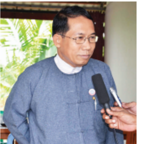
ဒေါက်တာအေးမောင် (ရခိုင်တိုင်းရင်းသားများ တိုးတက်ရေးပါတီ ဥက္ကဋ္ဌ)

ဦးခင်မောင်ဆွေ အမျိုးသားဒီမိုကရေစီအင်အားစုပါတီ ဥက္ကဋ္ဌ)