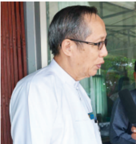
ဦးဟန်ရွှေ (တိုင်းရင်းသားစည်းလုံးညီညွတ်ရေးပါတီ ဗဟိုအလုပ်အမှုဆောင်)