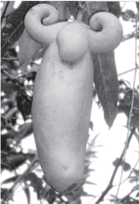
ကြောင်း သိရသည်။

ယခုအခါအဆိုပါကျွဲခေါင်းပုံသဏ္ဌာန်ရှိ သရက်သီး သီးသော ပန်းဒကာကြီးနေအိမ်သို့ လာရောက်ကြည့်ရှု လေ့လာသူများဖြင့် တစ်နေ့တခြား စည်ကားလျက်ရှိ