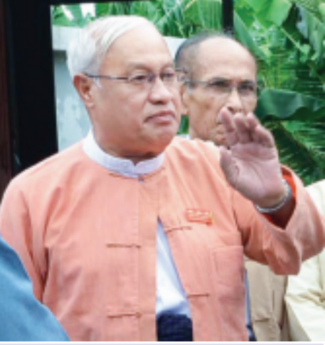
ဦးသိန်းညွန့် (အမျိုးသားဒီမိုကရေစီပါတီသစ် ဥက္ကဋ္ဌ)