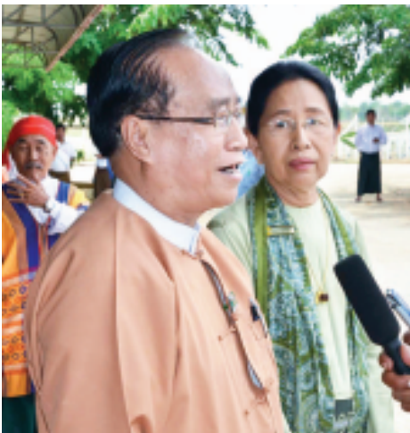
ဦးစိုင်းအိုက်ပေါင်း (ရမ်းတိုင်းရင်းသားများ ဒီမိုကရက်တစ်ပါတီဥက္ကဋ္ဌ)