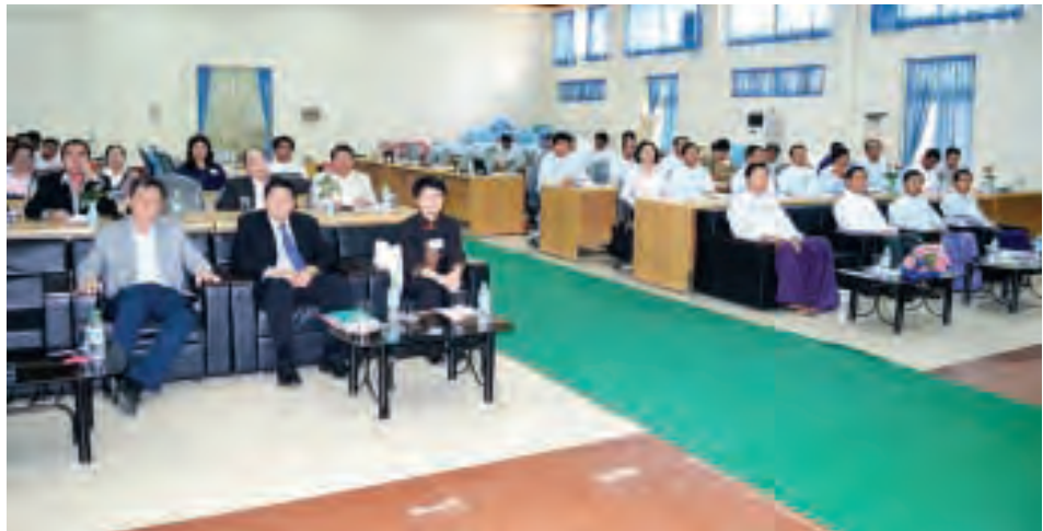
ကြက်ငှက်တုပ်ကွေးရောဂါ ဘေးအန္တရာယ်ဆိုင်ရာ အကြံပြု အလုပ်ရုံဆွေးနွေးပွဲ ကျင်းပစဉ်။