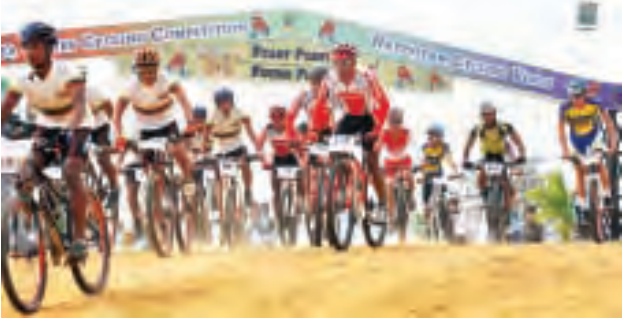
(သတင်း) စာမျက်နှာ ၇ သို့