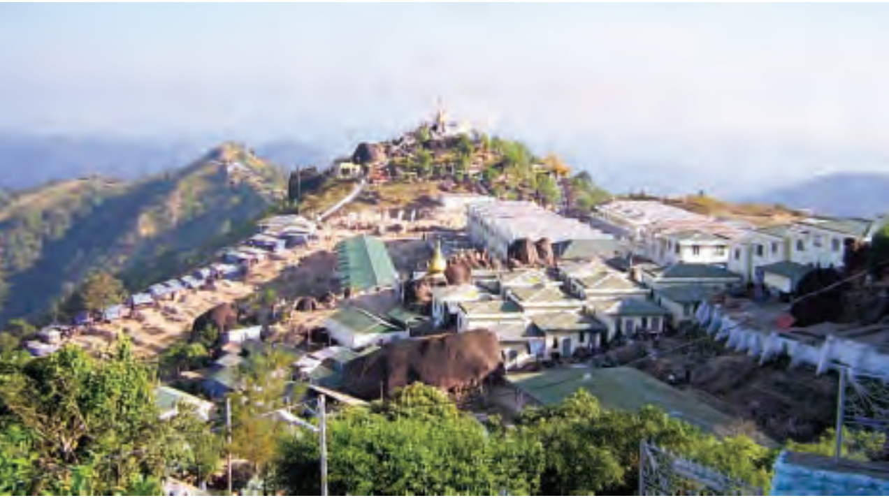
ဘုရားလည်းဖူး၊ အပန်းလည်းဖြူ ဗဟုသုတလည်းရမည့် ကျိုက်ထီးရိုးဘုရားပတ်ဝန်းကျင် သဘာဝထိန်းသိမ်းရေးနယ်မြေ။