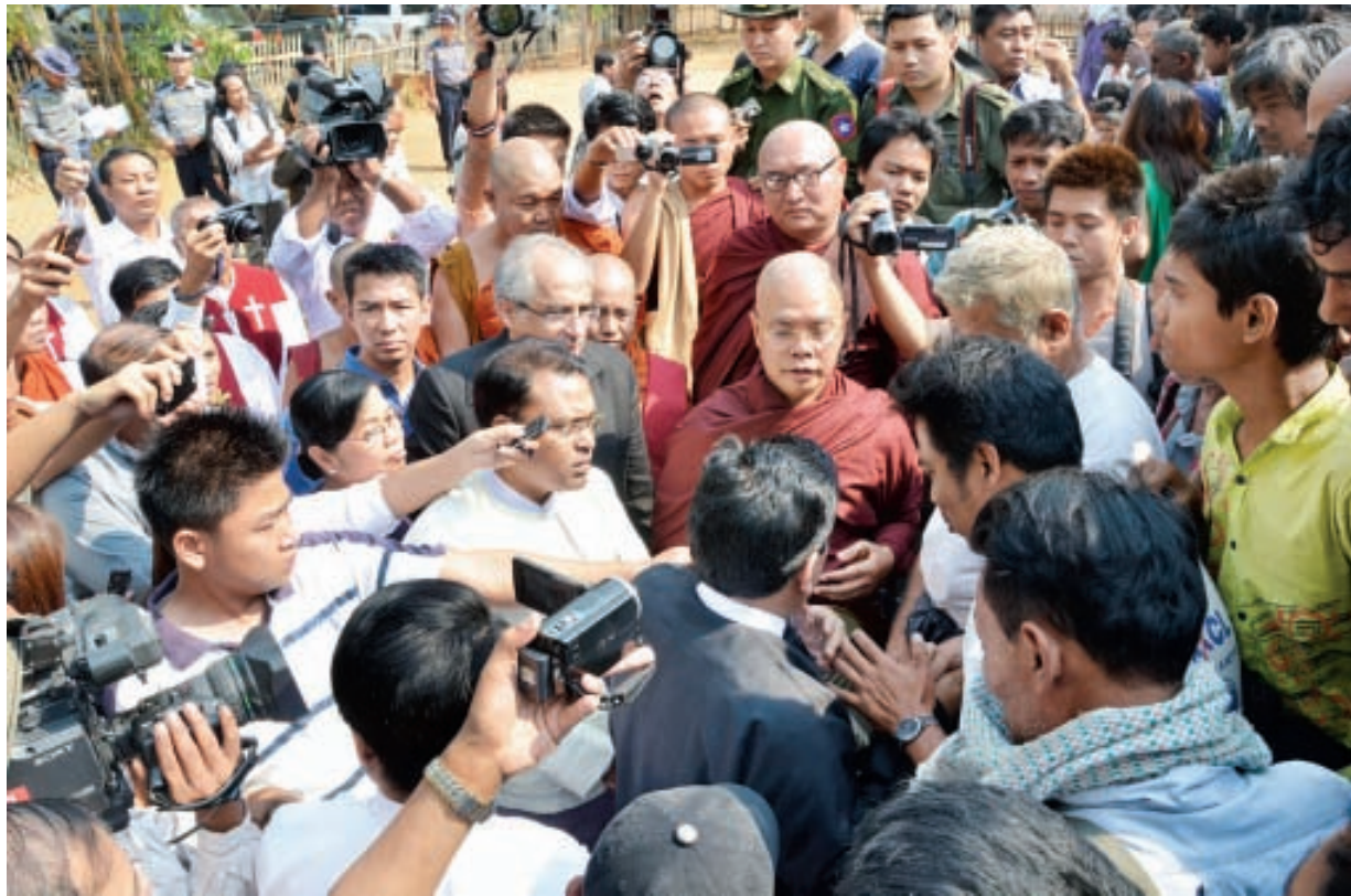
ကုလသမဂ္ဂအထွေထွေအတွင်းရေးမှူးချုပ်၏ အထူးကိုယ်စားလှယ် မစ္စတာ ဗီဂျေနမ်ဘီးယား၊ သမ္မတရုံးဝန်ကြီးဌာန ပြည်ထောင်စုဝန်ကြီး ဦးအောင်မင်း၊ ဆရာတော် ဓမ္မဒူတ ဒေါက်တာအရှင်ဆေကိန္ဒနှင့် တာဝန်ရှိသူများက မိတ္ထီလာမြို့ရှိ ဒုက္ခသည်များ နေထိုင်စားသောက်မှုအခြေအနေများကို မေးမြန်း၍ အားပေးစကား ပြောကြားစဉ်။

ယင်းနောက် အထူးကိုယ်စားလှယ်နှင့် အဖွဲ့ဝင်များသည် မိတ္ထီလာမြို့၌ ဖြစ်ပွားခဲ့သည့် ဆူပူအကြမ်းဖက်မှုဖြစ်စဉ်ကြောင့် မီးလောင်ပျက်စီးသွားသော နေအိမ်အဆောက်အအုံများအား ကြည့်ရှုသည်။ ဆက်လက်၍ အထူးကိုယ်စားလှယ်နှင့် အဖွဲ့ဝင်များသည် မိတ္ထီလာမြို့သာသနဓဇာတိကျောင်းတိုက်၌ ယာယီဖွင့်လှစ်ထားသည့် ကယ်ဆယ်ရေးစခန်းသို့ ရောက်ရှိကြပြီး ဒုက္ခသည်များအား မေးမြန်း၍ အားပေးစကား ပြောကြားသည်။