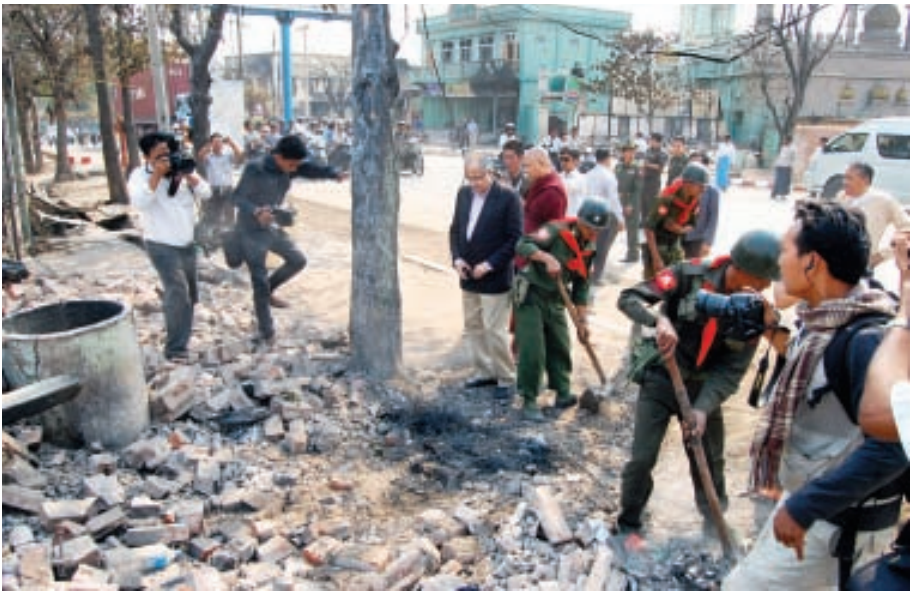
မိတ္ထီလာမြို့၌ လုံခြုံရေးတာဝန်ကျ ဝန်ထမ်းများနှင့် နယ်မြေခံတပ်မတော်သားတို့က အပျက်အစီးများအား ရှင်းလင်းခြင်း၊ သန့်ရှင်းရေးလုပ်ငန်းများ ဆောင်ရွက်ခြင်းတို့ကို ဆောင်ရွက်နေစဉ်။ (သတင်းစဉ်)

နေပြည်တော် မတ် ၂၄ မြန်မာနိုင်ငံတွင် ရောက်ရှိနေသော ကုလသမဂ္ဂအထွေထွေအတွင်းရေးမှူးချုပ်၏ အထူးကိုယ်စားလှယ် မစ္စတာ ဗီဂျေနမ်ဘီးယားသည် သမ္မတရုံးဝန်ကြီးဌာန ပြည်ထောင်စုဝန်ကြီး ဦးအောင်မင်း၊ ဆရာတော် ဓမ္မဒူတ ဒေါက်တာ အရှင်ဆေကိန္ဒနှင့် တာဝန်ရှိသူများ လိုက်ပါလျက် ယနေ့နံနက် ၈ နာရီ ၁၅ မိနစ်တွင် မန္တလေးတိုင်းဒေသကြီး မိတ္ထီလာမြို့ မိတ္ထီလာလေတပ်စခန်း ဌာနချုပ်သို့ အထူးလေယာဉ်ဖြင့် ရောက်ရှိလာရာ မန္တလေးတိုင်းဒေသကြီးဝန်ကြီးချုပ် ဦးရဲမြင့်၊ ပြည်ထောင်စုဝန်ကြီး ဦးခင်ရီ၊ ကာကွယ်ရေးဦးစီးချုပ်ရုံး(ကြည်း)မှ ဒုတိယဗိုလ်ချုပ်ကြီးမြင့်စိုးနှင့် ဒုတိယဝန်ကြီးများက ကြိုဆိုကြသည်။