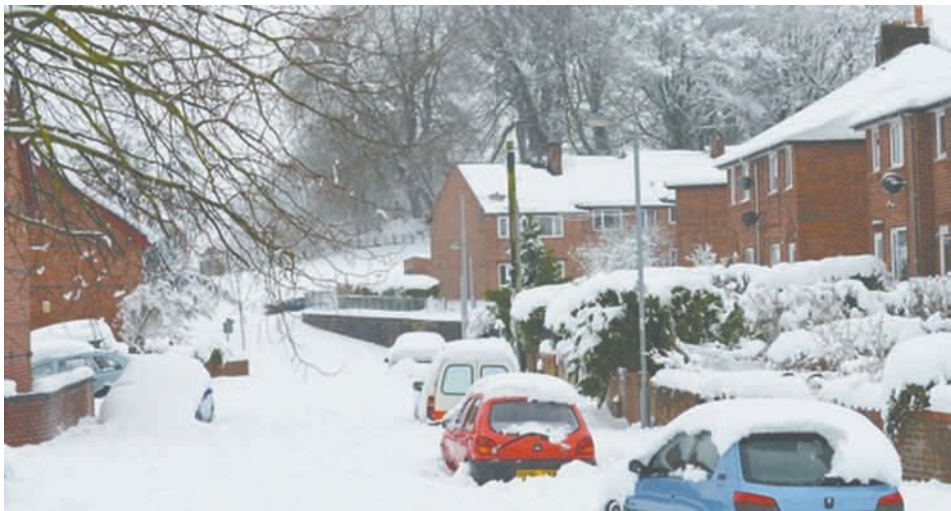
ဆီးနှင်းများ လွန်ကဲစွာကျဆင်းသောကြောင့် ဆီးနှင်းဖုံးနေသော လမ်းများ၊ အိမ်များ၊ ကားများကို တွေ့ရစဉ်။

ဖော်ပြ အကြိမ်ကြိမ် ဝင်ရောက်စီးနင်းခဲ့ ရာတွင် မူးယစ်ဆေးဝါး ၉၂ ပေါင်၊ ကာဗီနီသင်္ဘောပေါ်မှ ဒေါ်လာငွေ အမြောက်အမြား၊ တန်ဖိုးကြီးမားသော ကျောက်မျက်ရတနာများနှင့် ဇိမ်ခံကား တစ်စီးကိုပါ သိမ်းဆည်းရရှိခဲ့သည်။ အဆိုပါဂိုဏ်းသည် ဩစတြေးလျ နိုင်ငံ၌ လှုပ်ရှားနေသည်မှာ နှစ်များ စွာကြာခဲ့ပြီဖြစ်ကြောင်း၊ တရားမဝင် မူးယစ်ဆေးဝါးများကို နိုင်ငံအတွင်း သို့သွင်း၍ ဖြန့်ဖြူးလျက်ရှိကြောင်း၊ အမြတ်ငွေများကို ပြည်ပသို့တရားမဝင် ငွေလွှဲပို့လျက်ရှိကြောင်း ရဲတပ်ဖွဲ့၏ ကြေညာချက်တွင် ဖော်ပြထား သည်။ ထပ်မံဖမ်းဆီး စုံစမ်းစစ်ဆေးမှု ဆက်လက်ဆောင် ရွက်လျက်ရှိပြီး ထပ်မံဖမ်းဆီးမှုများ ဖြစ်လာဖွယ်ရာရှိသည်ဟု ရဲတပ်ဖွဲ့က ပြောသည်။ ဘီဘီစီ။