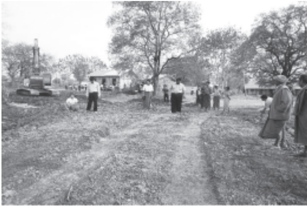
မိတ္ထီလာမြို့နယ် စည်ပင်သာယာရေးအဖွဲ့၏ ၂၀၁၂-၂၀၁၃ ဘဏ္ဍာ ရေးနှစ် ဖြည့်စွက်ရန်ပုံငွေဖြင့် ဆောင်ရွက်သည့် ကျေးလက်လမ်း လုပ်ငန်း ဖြစ်သော သရက်ပင်-ကျောက်ဖူးမြေသားလမ်း ပေ (၆၀၆၀x၂၀x၃) ခင်းခြင်းကို ကုန်ကျငွေကျပ် ၁၂၇၁၇၀၀၀ ဖြင့် လုပ်ငန်းဆောင်ရွက် ကြစေ။