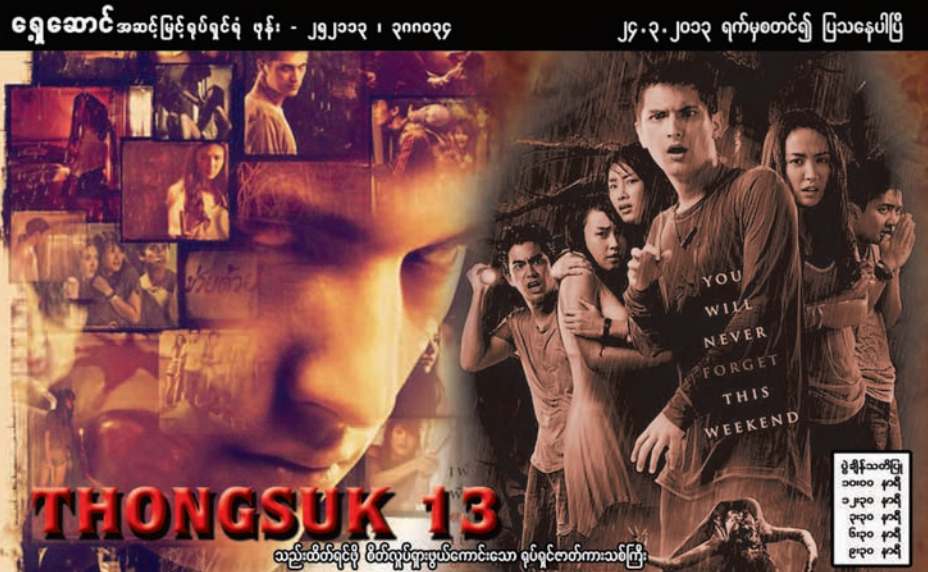
ရှေ့ဆောင်အဆင့်မြင့်ရုပ်ရှင် ၄ နီး - ၂၅၂၀၁၃ ၊ ၃၈၈၀၃၄ ၂၅-၃-၂၀၁၃ ရက်မှစတင်၍ ပြသနေပါပြီ

လေးကိုပဲ သံယောဇဉ်ရှိ နေတုန်းဖြစ်နေတယ်ဗျာ၊ (ကျွန်တော် ကတော့ အရည်ကျိုကားအပိုပြီး ကားသစ်ဝယ်ဖို့ ငွေလည်း မလိုက်နိုင်သေးတဲ့အတွက် ကျန်းမာရေးကိစ္စ ပေါ်လာရင် အရေးပေါ်သုံးနိုင်ရန် မအပ်သေးဘဲ ထားရှိနေခြင်းပဲ ဖြစ်ပါတယ်။) အခုတော့ဗျာ သူလည်းပဲ သူကားလိုပဲ အရည်ကျို အဆင့်ရောက်နေပြီဗျာ၊ အိပ်ရာပေါ်လဲနေပြီ၊ မကြာခင် ရေဝေး ဒါမှမဟုတ် ထိန်ပင်မှာ အရည်ကျိုရတော့မှာပါ။ သူ့အရည်ကျိုဖို့ အရင်သွားရင်တော့ သူကားအရည်ကျိုဖို့ ကိစ္စ အမြန်ဖြစ်မှာပို့ တစ်ခါတလေတော့ သူ့ကို အရည် ကျိုဖို့ ရေဝေးကိုအရင်ပို့ရင် ကောင်းမလားလို့ စဉ်းစားမိ တယ်ဗျာဟု ရယ်သလို မောသလိုနဲ့ပြောတာ ကြားရတော့ ကျွန်တော်ဘုရားတမိပါရဲ့။ တကယ်တော့ ကျွန်တော်တို့လို နာတာရှည်လူနာ အဘိုးအို၊ အဘွားအိုတွေဟာ ကားဟောင်းအဆင့် အတန်းနဲ့ဆိုရင် အရည်ကျိုအဆင့်(ကားနံပါတ် ဆ၊ဇ အဆင့်တွေဖြစ်မယ်ထင်ပါတယ်)ရောက်ရှိနေပြီဖြစ်ပါ တယ်။ ကားဟောင်းတွေလိုတော့ သံမဏိစက်ရုံအပ်ပြီး ကားသစ်ပြန်ဝယ်လို့မရဘဲ လူသားအရည်ကျို အဆင့်တွေ ဖြစ်တော့ နောင်ဘဝကောင်းစားဖို့အတွက်ကတော့ ဘုရားတရားကိုပဲ ကြိုးစားအားထုတ်အာရုံပြုနေရပါ တော့မယ်။ ဒါ့ကြောင့် အရည်ကျိုအဆင့်ရောက်နေပြီး အသုံး မဝင်တော့တဲ့ (ကားဟောင်းလောက်တောင် တန်ဖိုးမရှိ တော့တဲ့) ကျွန်တော်တို့လို အဘိုးအို၊ အဘွားအို မိတ်ဆွေ များကို မကြာခင်အရည်ကျိုခံရတော့မည်ဖြစ်တဲ့အတွက် (ကားဟောင်းက ကားသစ်ဖြစ်ရသလို) ပိုမိုမြင့်မြတ်တဲ့ နိဗ္ဗာန်ကို ရောက်ရှိအောင်သာ ဘုရား၊ တရား ကြိုးစား အားထုတ်နေကြပါလို့ စေတနာကောင်းနဲ့ပဲ သတိပေး ပါရစေခင်ဗျာ။