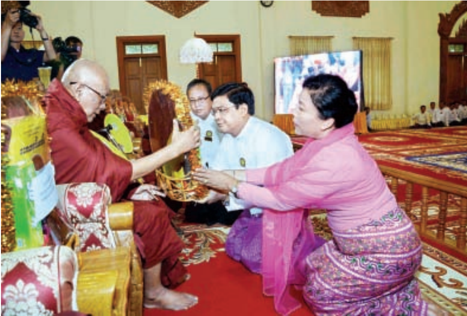
ဒုတိယသမ္မတ ဦးညွှန်ထွန်းနှင့် ဇနီး ဒေါ်ခင်အေးမြင့်တို့ ဆရာတော်ထံ လှူဖွယ်ပစ္စည်းများ ဆက်ကပ်လှူဒါန်း စဉ်။ (သတင်းစဉ်)

တက်ရောက်လာကြသူများက ဆရာတော်၊ သံယာတော်များ၊ သီလရှင်ဆရာကြီးများအား လှူဖွယ်ပစ္စည်းများ ဆက်ကပ် လှူဒါန်းကြသည်။ ယင်းနောက် နိုင်ငံတော်ဩဝါဒါစရိယ ပျဉ်းမနားမြို့ မဟာဝိသုတာရာမဈေးကွန်းကျောင်းတိုက် ပဓာနနာယက ဆရာတော် အဘိဓဇမဟာရဋ္ဌဂုရု ဘဒ္ဒန္တကဝိသာရထံမှ ပရိသတ်များက အနုမောဒနာတရား နာယူကြပြီး လှူဒါန်းမှု အစုစုတို့အတွက် ရေစက်သွန်းချ အမျှပေးဝေကြသည်။ အခမ်းအနားအပြီးတွင် နိုင်ငံတော်သမ္မတနှင့် အဖွဲ့ဝင် များသည် ဆရာတော်ကြီးများအား နေ့ဆွမ်းဆက်ကပ် လှူဒါန်းကြသည်။ (သတင်းစဉ်)