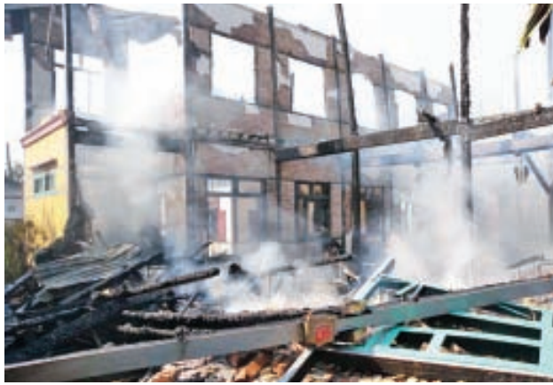
နာရီခွဲတွင် မီးလုံးဝငြိမ်းသွားကြောင်း သိရသည်။ (အပေါ်ပုံ) (ကျော်သီတ)

သည်။ အဆိုပါ မီးလောင်ကျွမ်းမှုအား အင်းတော်မြို့နှင့် ဗန်းမောက်မြို့တို့မှ မီးသတ်ကားနှစ်စီး၊ မဲဇာအရန်မီးသတ်တပ်ဖွဲ့မှ ရေစုပ်စက် နှစ်လုံး၊ ပြည်သူများမှ ရေစုပ်စက် လေးလုံး၊ FCGC (IGE) Co.,Ltd. မှ ရေသယ်ယာဉ်တစ်စီး၊ မြန်မာအဓိပတိ ဆောက်လုပ်ရေးကုမ္ပဏီမှ ကားတစ်စီး၊ မြို့နယ်စည်ပင်သာယာမှု ရေသယ်ယာဉ်တစ်စီး စုပေါင်း၍ ဝိုင်းဝန်းငြိမ်းသတ်ခဲ့ရာ ညနေ ၃ နာရီ ၁၅ မိနစ်တွင် မီးညွှန့်ကျိုးသွားပြီး ညနေ ၃