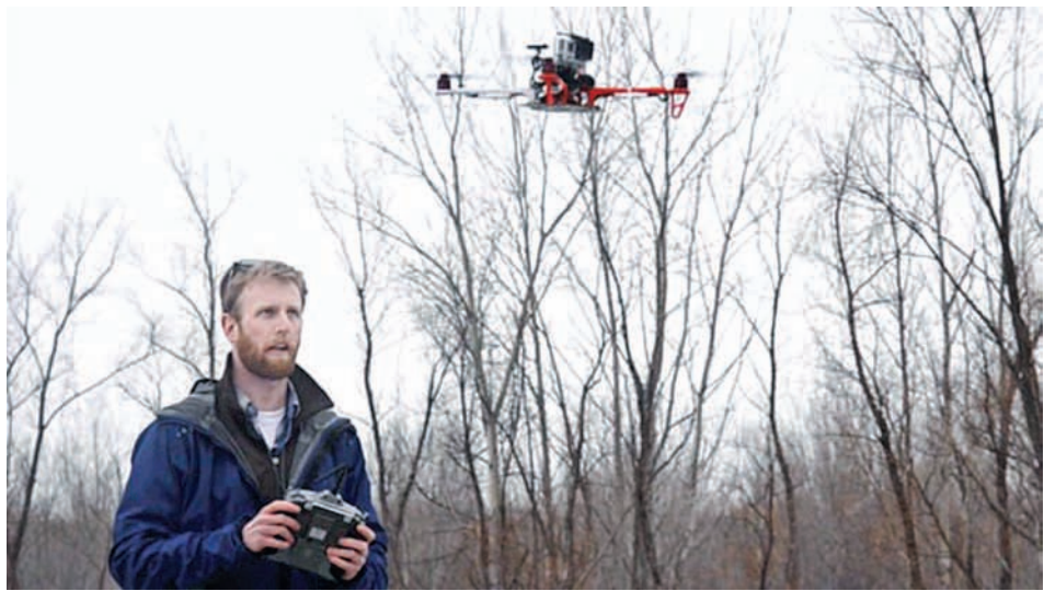
သတင်းရယူစုဆောင်းရာတွင် မောင်းသူမဲ့စက်ရုပ်လေယာဉ်ငယ်ကို အသုံးပြုနိုင်ရန် သုတေသနပြု လေ့လာနေစဉ်။