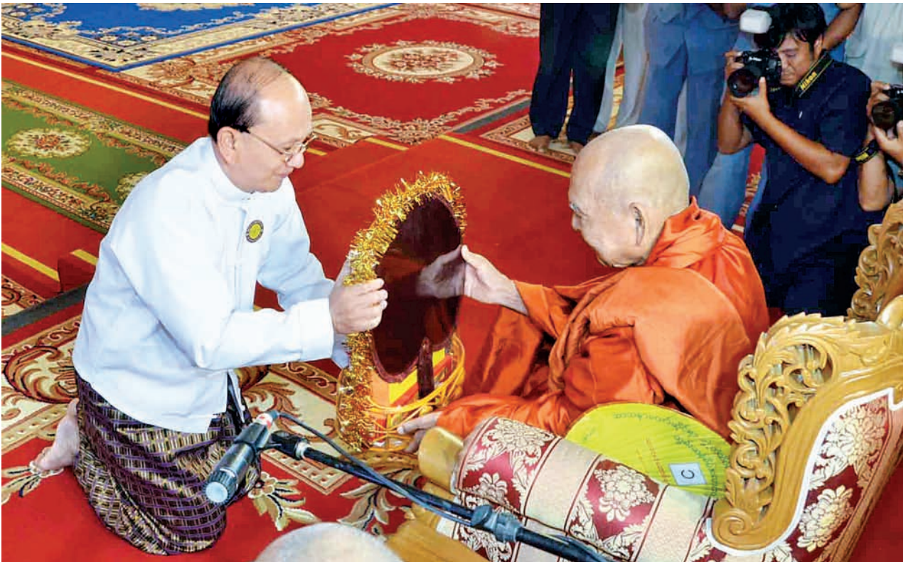
နိုင်ငံတော်သမ္မတ ဦးသိန်းစိန် နိုင်ငံတော်သံယမဟာနာယကအဖွဲ့ဥက္ကဋ္ဌ အဘိဇေယျာရဋ္ဌဂုရု အဘိဇေယျာမဟာ သဒ္ဓမ္မဇောတိက ဗန်းမော်ဆရာတော် ဒေါက်တာ ဘဒ္ဒန္တ ကုမာရာဘိဝံသထံ လှူဖွယ်ပစ္စည်းများ ဆက်ကပ်လှူဒါန်းစဉ်။ (သတင်းစဉ်)