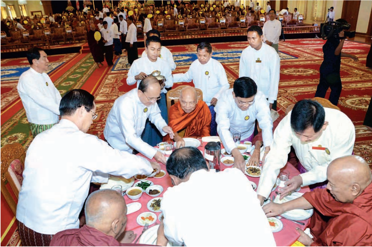
နိုင်ငံတော်သမ္မတ ဦးသိန်းစိန်နှင့် ဒုတိယသမ္မတများဖြစ်ကြသော ဒေါက်တာစိုင်းမောက်ခမ်းနှင့် ဦးညွှန်ထွန်းတို့ ဆရာတော်များအား နေ့ဆွမ်းဆက်ကပ်လှူဒါန်းကြစဉ်။ (သတင်းစဉ်)

☆ နိုင်ငံတော်သံယမဟာနာယကမှ အခမ်းအနားတွင် နိုင်ငံတော်သံယမဟာနာယက အဖွဲ့ဥက္ကဋ္ဌ အဘိဓဇ မဟာရဋ္ဌဂုရု အဘိဓဇအဂ္ဂမဟာ သဒ္ဓမ္မဇောတိက ဗန်းမော်ဆရာတော် ဒေါက်တာ ဘဒ္ဒန္တ ကုမာရာဘိဝံသထံမှ နိုင်ငံတော်သမ္မတ အမျိုးပြုသော ပရိသတ်များက ကိုးပါးသီလခံယူဆောက်တည်ကြပြီး ဆရာတော်၊ သံယာတော်များ ရွတ်ပွားချီးမြှင့်တော်မူသည့် မေတ္တာသုတ် ပရိတ်တရားတော်ကို နာယူကြသည်။ ထို့နောက် နိုင်ငံတော်သမ္မတက နိုင်ငံတော်သံယ မဟာနာယကအဖွဲ့ဥက္ကဋ္ဌ ဗန်းမော်ဆရာတော်ထံ လှူဖွယ် ပစ္စည်းများ ဆက်ကပ်လှူဒါန်းသည်။ ဆက်လက်၍ ဒုတိယသမ္မတများနှင့် ၎င်းတို့၏ဇနီးများ၊