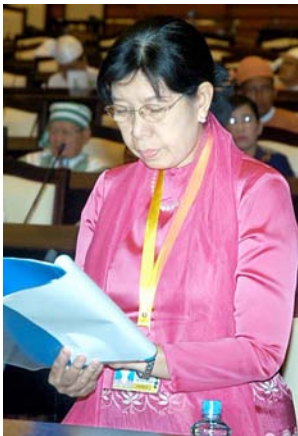
ဒုတိယဝန်ကြီး ဒေါ်သိန်းသိန်းဌေး၊ ဓာတ်ပုံ-ခင်မောင်ဝင်း(ကြေးမုံ)

ကျန်းမာရေးဝန်ကြီးဌာန ဆေးသိပ္ပံပညာဦးစီးဌာနအောက်ရှိ သူနာပြုနှင့် သားဖွားသင်တန်းကျောင်းများသို့ တပ်ရင်းတပ်ဖွဲ့ ဆေးခန်းများတွင်လည်းကောင်း၊ အဖွဲ့အစည်းများတွင်လည်းကောင်း ခန့်အပ်တာဝန်ပေးနိုင်ရေးအတွက် အထူးကိစ္စရပ်ဖြင့် သင်တန်းတက်ရောက်ခွင့်ပြုပါရန် ညှိနှိုင်းချက်များအရ သင်တန်းတက်ရောက်ခွင့်ပြုခဲ့ပါကြောင်း၊ အထူးကိစ္စတစ်ရပ်အနေဖြင့် တပ်ရင်းတပ်ဖွဲ့၊