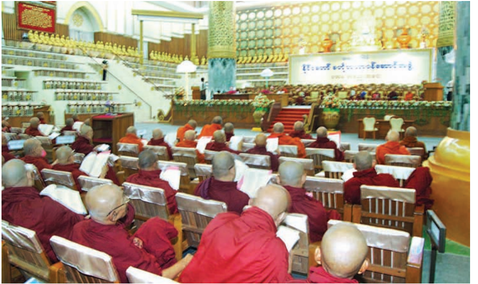
သတ္တမအကြိမ် နိုင်ငံတော်ဗဟိုသံယာဉ်ဆောင်အဖွဲ့ ပထမအစည်းအဝေးကို ကမ္ဘာအေးကုန်းမြေရှိ မဟာဝါသာဏလိုက်ဂူ၌ တတိယနေ့ ကျင်းပစဉ်။

၆။ မြန်မာနိုင်ငံတော်ဗဟိုဘဏ်သည် ပြည်သူများ လက်ဝယ်ထားရှိပိုင်ဆိုင်သော နိုင်ငံခြားငွေလက်မှတ်များ ပြန်လည်ရွေးနုတ်ခြင်းကို ကနဦးသတ်မှတ်ကာလဖြစ်သည့် ၁-၄-၂၀၁၃ ရက်နေ့မှ ၃၀-၆-၂၀၁၃ ရက်နေ့အထိ ကာလ၌ သော်လည်းကောင်း၊ ခိုင်လုံသော အကြောင်းပြချက်ဖြင့် အထူးကိစ္စရပ်အနေဖြင့် ဆောင်ရွက်ပေးမည့် ၁-၇-၂၀၁၃ ရက်နေ့မှ ၃၁-၃-၂၀၁၄ ရက်နေ့အထိ ကာလ၌သော်လည်းကောင်း နိုင်ငံခြားငွေလက်မှတ် အပ်နှံလဲလှယ်ခြင်းကို ဆောင်ရွက်ပေးမည်ဖြစ်ပြီး ယင်းသတ်မှတ်ကာလ ကျော်လွန်ပါက နိုင်ငံခြားငွေလက်မှတ် အပ်နှံလဲလှယ်ခြင်းကို ဆောင်ရွက်ပေးမည်မဟုတ်ကြောင်း အသိပေးကြေညာအပ်ပါသည်။