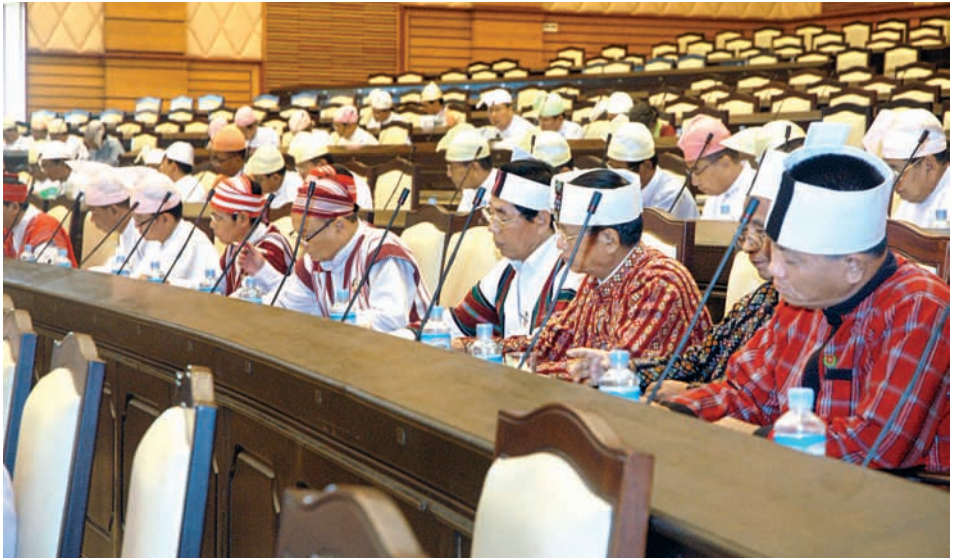
ပထမအကြိမ် ပြည်ထောင်စုလွှတ်တော် ဆဌမပုံမှန်အစည်းအဝေးသို့ တက်ရောက်ကြသူများအား တွေ့ရစဉ်၊ ဓာတ်ပုံ-ခင်မောင်ဝင်း (ကြေးမုံ)

အလားတူ ၂၀၁၃-၂၀၁၄ ဘဏ္ဍာရေးနှစ် နိုင်ငံတော်၏ အခွန်အကောက်ဆိုင်ရာ ရှင်းလင်းတင်ပြချက်နှင့်စပ်လျဉ်း၍ လွှတ်တော်ကော်မတီများနှင့် ကိုယ်စားလှယ်များက အဆိုတင်သွင်းဆွေးနွေးခြင်း၊ ပြည်သူ့လွှတ်တော်ဥက္ကဋ္ဌ ထံမှပေးပို့သည့်သဝဏ်လွှာအရ ၂၀၀၈ ခုနှစ် ဖွဲ့စည်းပုံအခြေခံဥပဒေလေ့လာသုံးသပ်ရေးကော်မတီ သို့မဟုတ် ကော်မရှင်ဖွဲ့စည်းဆောင်ရွက်ရေးအတွက် ပြည်ထောင်စု