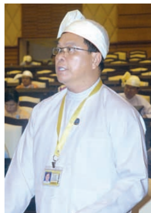
လျှပ်စစ်စွမ်းအားဝန်ကြီးဌာန ခုတိယဝန်ကြီး ဦးအောင်သန်းဦး ပြန်လည် ရှင်းလင်း ဖြေကြားစဉ်။

နိုင်ငံတော်ဓာတ်အားစနစ်ရောက်ရှိပြီး (သို့မဟုတ်)မရောက်ရှိသေးသော ဒေသများတွင် အသေးစားနှင့်အလတ်စား ဓာတ်အားဖြန့်ဖြူးရေးလုပ်ငန်းများဆောင်ရွက်လိုသည့် ပြည်တွင်း/