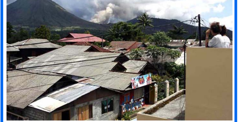
အင်ဒိုနီးရှားနိုင်ငံ မြောက်ဆူလာဝေဆီဒေသရှိ လိုကွန်မီးတောင် ပေါက်ကွဲစဉ်။

လုကာတာ မတ် ၂၀ အင်ဒိုနီးရှားနိုင်ငံအရှေ့ပိုင်း မြောက်ဆူလာဝေဆီဒေသရှိ လိုကွန်မီးတောင်သည် မတ် ၂၀ ရက်က ပေါက်ကွဲ ရာ အမြင့်မီတာ ၂၀၀၀ အထိ ပြာမှုန်များကို မှုတ်ထုတ်ခဲ့ကြောင်း ဒေသဆိုင်ရာသတင်းဌာနများက သတင်းထုတ်ပြန် သည်။ မတ် ၂၀ ရက် ဒေသစံတော်ချိန် နံနက် ၇နာရီ ၅၇ မိနစ်တွင် မီးတောင်ပေါက်ကွဲမှုဖြစ်ပွားခဲ့ပြီး တောင် စောင်းတစ်လျှောက် ချော်ရည်များစီးဆင်းလာခဲ့ကြောင်း မီးတောင်လေ့လာရေးဌာနအကြီးအကဲ ခရစ္စတီယာနိုက ပြောကြားသည်။ မီးတောင်ထိပ်မှ ၂ ဒသမ ၅ ကီလိုမီတာ ပတ်လည်အကွာအဝေးအတွင်းနယ်မြေသို့ ကမ္ဘာလှည့် ခရီးသည်များနှင့် ဒေသခံများ ဝင်ရောက်ခြင်းမပြုရန် တားမြစ်ပိတ်ပင်ထားသည်။ မီးတောင်ပေါက်ကွဲမှုဖြစ်ပွားသော်လည်း ဒေသခံပြည်သူများအား ရွှေ့ပြောင်းပေးရခြင်း မရှိကြောင်း ခရစ္စတီယာနိုက ပြောကြားသည်။ လိုကွန်မီးတောင်သည် ၂၀၁၁ခုနှစ် ဇွန်လကုန်မှစ၍ မီးတောင်ဆိုင်ရာလှုပ်ရှားမှု စတင်ခဲ့သည်။ ဆင်ယွာ။