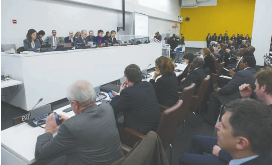
သမားရိုးကျလက်နက်များ ဥပဒေမဲ့ရောင်းဝယ်မှု အဆုံးသတ်ရေးဆိုင်ရာ ဆွေးနွေးပွဲ ကျင်းပစဉ်။