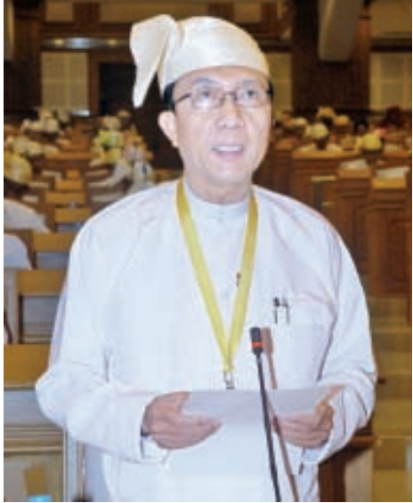
ပြည်ထောင်စုဝန်ကြီး ဦးဝင်းရှိန် ရှင်းလင်းတင်ပြစဉ်။