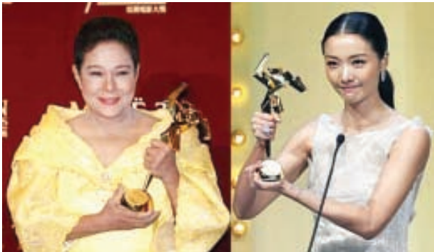
အကောင်းဆုံးအမျိုးသမီးသရုပ်ဆောင်ဆုကို ဖိလစ်ပိုင်မင်းသမီး နော်ရာ အန်နော်နှင့် အမျိုးသမီးဇာတ်ပို့ဆုရ ဂျပ်နမင်းသမီး မာကီကိုဝါတနာဘိ။

သတ္တမအကြိမ်မြောက် အာရှရုပ်ရှင်ပွဲတော်ကို မတ် ၈ ရက်မှ ၁၇ ရက်အထိ ဂျပန်နိုင်ငံ အိုဆာကာမြို့၌ ကျင်းပခဲ့ရာ အာရှဒေသနိုင်ငံများမှ ရုပ်ရှင်ကားပေါင်း ၃၀ ပါဝင်ယှဉ်ပြိုင်ခဲ့ကြပြီး ဆုအမျိုးအစား ၁၄ မျိုး ပေးအပ်ချီးမြှင့်ခဲ့ကြောင်း သိရသည်။