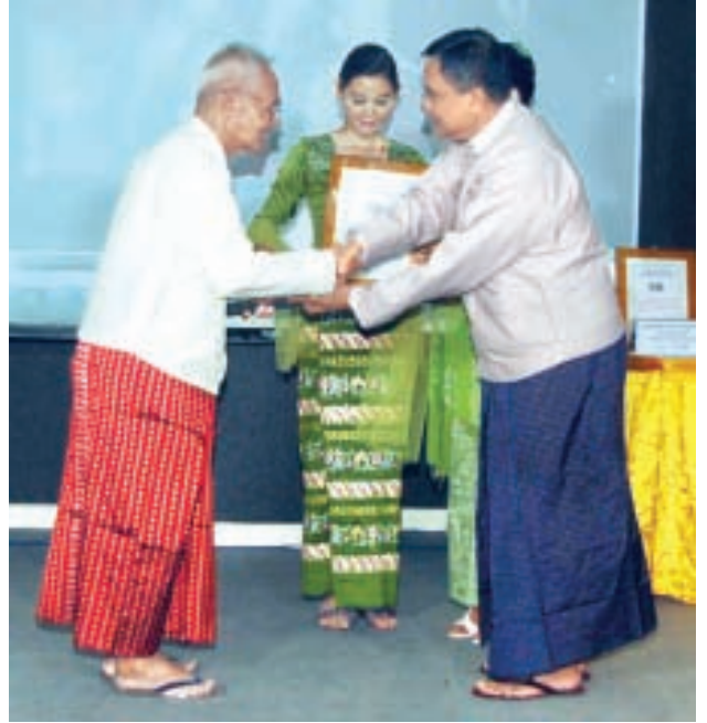
ပြန်ကြားရေးဝန်ကြီးဌာန ပြည်ထောင်စုဝန်ကြီး ဦးအောင်ကြည် ယဉ်ကျေးမှုဘာသာရပ်တွင် “စာပေနှင့်ဂီတ ဂီတနှင့်စာပေ” စာအုပ်ဖြင့် ဆုရရှိသည့် ဦးမြင့်ကြည်အား ဆုများချီးမြှင့်စဉ်။ (သတင်းစဉ်)

ထို့နောက် ထွန်းဖောင်ဒေးရှင်းစာပေဆု ရွေးချယ်ရေးကော်မတီ နာယက ဦးသိန်းထွန်းက ဆုရွေးချယ်ရေးကော်မတီဝင်များကိုယ်စား ကော်မတီဝင်