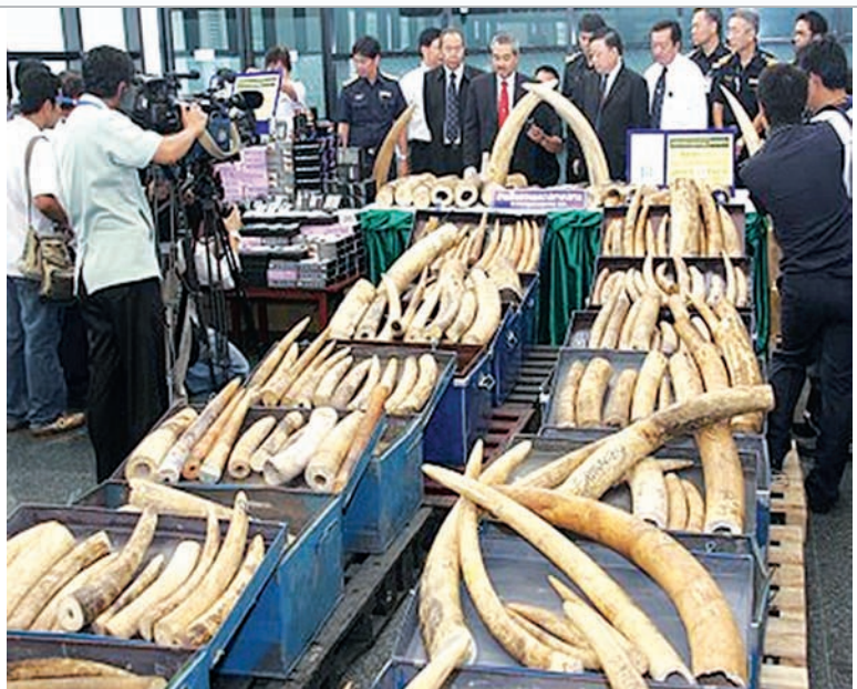
ထိုင်းအကောက်ခွန် အာဏာပိုင်များ သိမ်းဆည်းရမိသော ဆင်စွယ်များကို ကြည့်ရှုနေစဉ်။