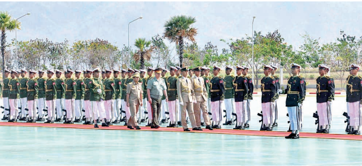
တပ်မတော်ကာကွယ်ရေးဦးစီးချုပ် ဒုတိယဗိုလ်ချုပ်မှူးကြီး မင်းအောင်လှိုင် ရုရှားကာကွယ်ရေးဝန်ကြီးနှင့်အတူ ဂုဏ်ပြုတပ်ဖွဲ့အား စစ်ဆေးစဉ်။ (သတင်းစဉ်)