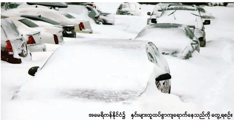
အမေရိကန်နိုင်ငံ၌ နှင်းများထူထပ်စွာကျရောက်နေသည်ကို တွေ့ရစဉ်။