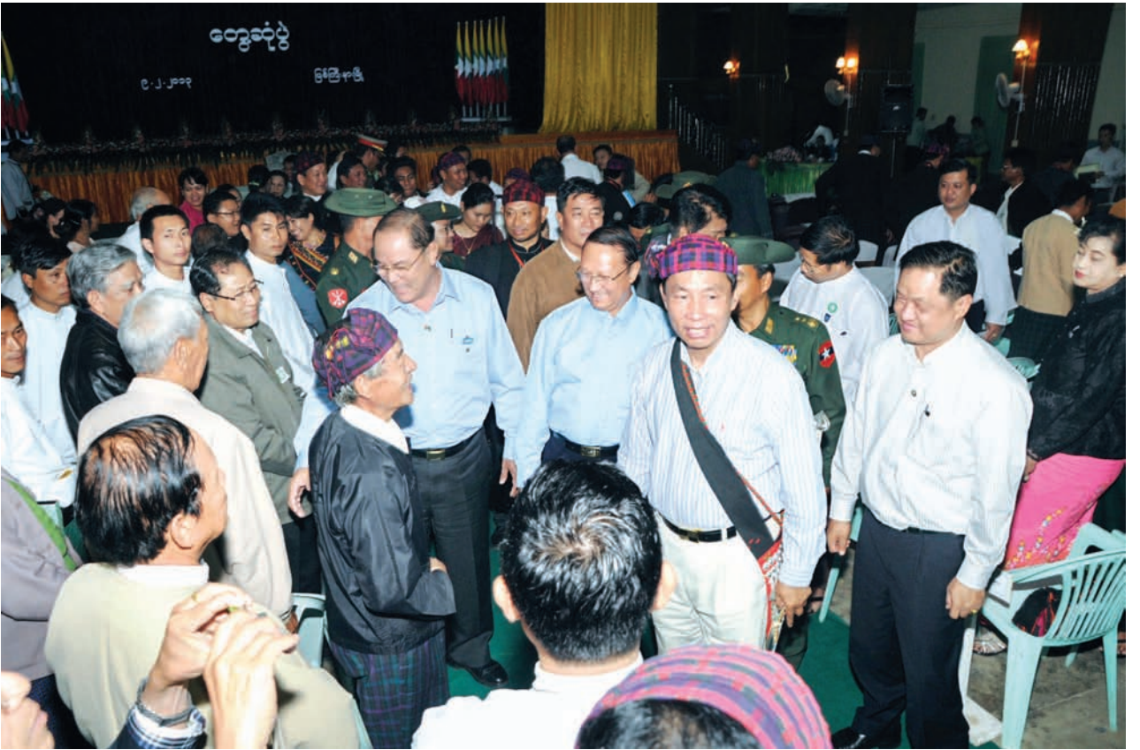
ပြည်သူ့လွှတ်တော်ဥက္ကဋ္ဌ သူရဦးရွှေမန်း မြစ်ကြီးနားမြို့ မြို့တော်ခန်းမ၌ ဒေသခံပြည်သူများအား ရင်းရင်းနှီးနှီးနှုတ်ဆက်စဉ်။

ဆက်လက်၍ လွှတ်တော်များက ထောက်ပံ့လှူဒါန်းသော ဆန်၊ ဆီ၊ ဆား တို့အား ပြည်သူ့လွှတ်တော်ဥက္ကဋ္ဌနှင့် လွှတ်တော်ကော်မတီဥက္ကဋ္ဌများ ဖြစ်ကြ သည့် သူရဦးအေးမြင့်နှင့် စာမျက်နှာ ၃ ကော်လံ ၁ သို့*