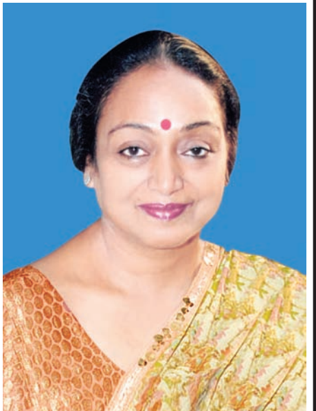
အိန္ဒိယသမ္မတနိုင်ငံ အောက်လွှတ်တော်ဥက္ကဋ္ဌ Honourable Smt. Meira Kumar

နေပြည်တော် ဖေဖော်ဝါရီ ၁၀ ပြည်သူ့လွှတ်တော်ဥက္ကဋ္ဌ သူရဦးရွှေမန်း၏ ဖိတ်ကြားချက်အရ အိန္ဒိယသမ္မတနိုင်ငံ အောက်လွှတ်တော် (LOK SABHA) ဥက္ကဋ္ဌ Honourable Smt. Meira Kumar ခေါင်းဆောင်သော အိန္ဒိယလွှတ်တော်ကိုယ်စားလှယ်အဖွဲ့သည် မကြာမီ မြန်မာနိုင်ငံသို့ ချစ်ကြည်ရေးခရီး လာရောက်မည်ဖြစ်သည်။ အိန္ဒိယအောက်လွှတ်တော်ဥက္ကဋ္ဌသည် အိန္ဒိယနိုင်ငံ၏ (၁၅)ကြိမ်မြောက် အောက်လွှတ်တော် ဥက္ကဋ္ဌအဖြစ် ၂၀၀၉ ခုနှစ် မေလမှ စတင်ဆောင်ရွက်လျက်ရှိသည်။ သူမအား ၁၉၄၅ ခုနှစ် မတ်လတွင် ဘီဟာပြည်နယ် ပတ္တနာမြို့၌ မွေးဖွားခဲ့သည်။ ဒေလီတက္ကသိုလ်မှ ဝိဇ္ဇာဘွဲ့၊ ဥပဒေဝိဇ္ဇာဘွဲ့၊ မဟာဝိဇ္ဇာဘွဲ့ (အင်္ဂလိပ်ဘာသာ) ရရှိခဲ့ပြီး စပိန်နိုင်ငံ မက်ဒရစ်မြို့တွင် စပိန်ဘာသာအဆင့်မြင့် ဒီပလိုမာရရှိခဲ့သည်။ ၁၉၇၃ ခုနှစ်တွင် အိန္ဒိယပြည်ပရေးရာဝန်ကြီးဌာနသို့ ဝင်ရောက်ခဲ့ပြီး စပိန်နိုင်ငံနှင့် ဗြိတိန်နိုင်ငံတို့တွင် တာဝန်ထမ်းဆောင်ခဲ့သည်။ နိုင်ငံခြားရေးဝန်ထမ်းအဖြစ်မှ နုတ်ထွက်ခဲ့ပြီး (၈)ကြိမ်မြောက် အောက်လွှတ်တော် ရွေးကောက်ပွဲသို့ ဝင်ရောက်ယှဉ်ပြိုင်အနိုင်ရခဲ့သည်။ ၁၉၈၅ ခုနှစ်မှစ၍ အိန္ဒိယပါလီမန်အဖွဲ့၊ အဖွဲ့ဝင်တာဝန် ထမ်းဆောင်ခဲ့သည်။ ၁၉၉၀ ပြည့်နှစ်တွင် အိန္ဒိယနိုင်ငံလုံးဆိုင်ရာ ကွန်ဂရက်ကော်မတီ အထွေထွေအတွင်းရေးမှူးတာဝန်ထမ်းဆောင်သည်။ (၁၁)ကြိမ်၊ (၁၂)ကြိမ်၊ (၁၄)ကြိမ်နှင့် (၁၅)ကြိမ်မြောက် အောက်လွှတ်တော်ကိုယ်စားလှယ်အဖြစ် တာဝန်ထမ်းဆောင်