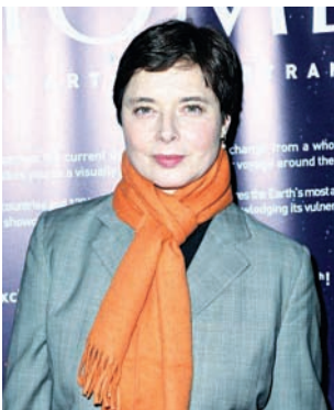
အီတလီ သရုပ်ဆောင် အစ္စဘဲလ်လာ ရိုဆယ်လီနီ

အဆိုပါ The Necessary Death of Charlie Countryman ဇာတ်ကားသည် ၂၀၁၃ ခုနှစ်တွင်မှ အသစ်ထွက်ရှိလာသော ဟာသ၊ အချစ်၊ အက်ရှင်ဇာတ်ကားတစ်ကားဖြစ်ပြီး ဒါရိုက်တာ ဖရိုဒရစ်ခ် ဘွန်းက ရိုက်ကူးပုံဖော်ပေးထားသည်။