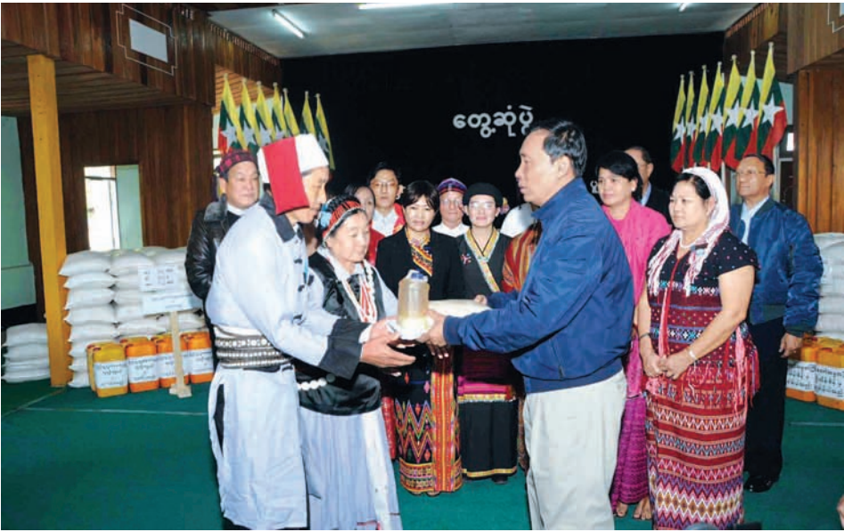
ပြည်သူ့လွှတ်တော်ဥက္ကဋ္ဌ သူရဦးအေးမြင့်က ဆန်၊ ဆီ၊ ဆား တို့ကို ဒေသခံပြည်သူများအား ပေးအပ်လှူဒါန်းစဉ်။ (သတင်းစဉ်)

မိမိတို့နိုင်ငံသည် ဖွံ့ဖြိုးဆဲနိုင်ငံဖြစ်၍ ဒေသလိုအပ်ချက်များစွာရှိကြောင်း၊ ထို့ကြောင့် တိုင်းပြည်ဖွံ့ဖြိုးတိုးတက်အောင်ဆောင်ရွက်ရာတွင် တိုင်းရင်းသားစည်းလုံးညီညွတ်ရေးနှင့် အမျိုးသားရေးပြန်လည်သင့်မြတ်အောင် ဆောင်ရွက်ရမည်ဖြစ်ကြောင်း၊ အချင်းချင်း ပဋိပက္ခဖြစ်ပြီး ပစ်ခတ်တိုက်ခိုက်နေလျှင် ဒေသဖွံ့ဖြိုးရေးလုပ်ငန်းများကို လုပ်ဆောင်နိုင်မည် မဟုတ်ကြောင်း၊ လွှတ်တော်တွင်လည်း ပြည်တွင်းငြိမ်းချမ်းရေးအတွက် အပစ်အခတ်ရပ်စဲရေးအဆိုကိုတင်သွင်းဆွေးနွေးခဲ့ရာ အောင်မြင်ခဲ့ကြောင်း၊ ထိုသို့ လွှတ်တော်နှင့်သက်ဆိုင်ရာများ၏ ဆောင်ရွက်မှုများကြောင့် ယခုဆိုလျှင် ငြိမ်းချမ်းရေးရောင်နီသန်းလာပြီဖြစ်၍ နှစ်ဦးနှစ်ဖက် အချင်းချင်းဆက်သွယ်ကာ ပွင့်ပွင့်