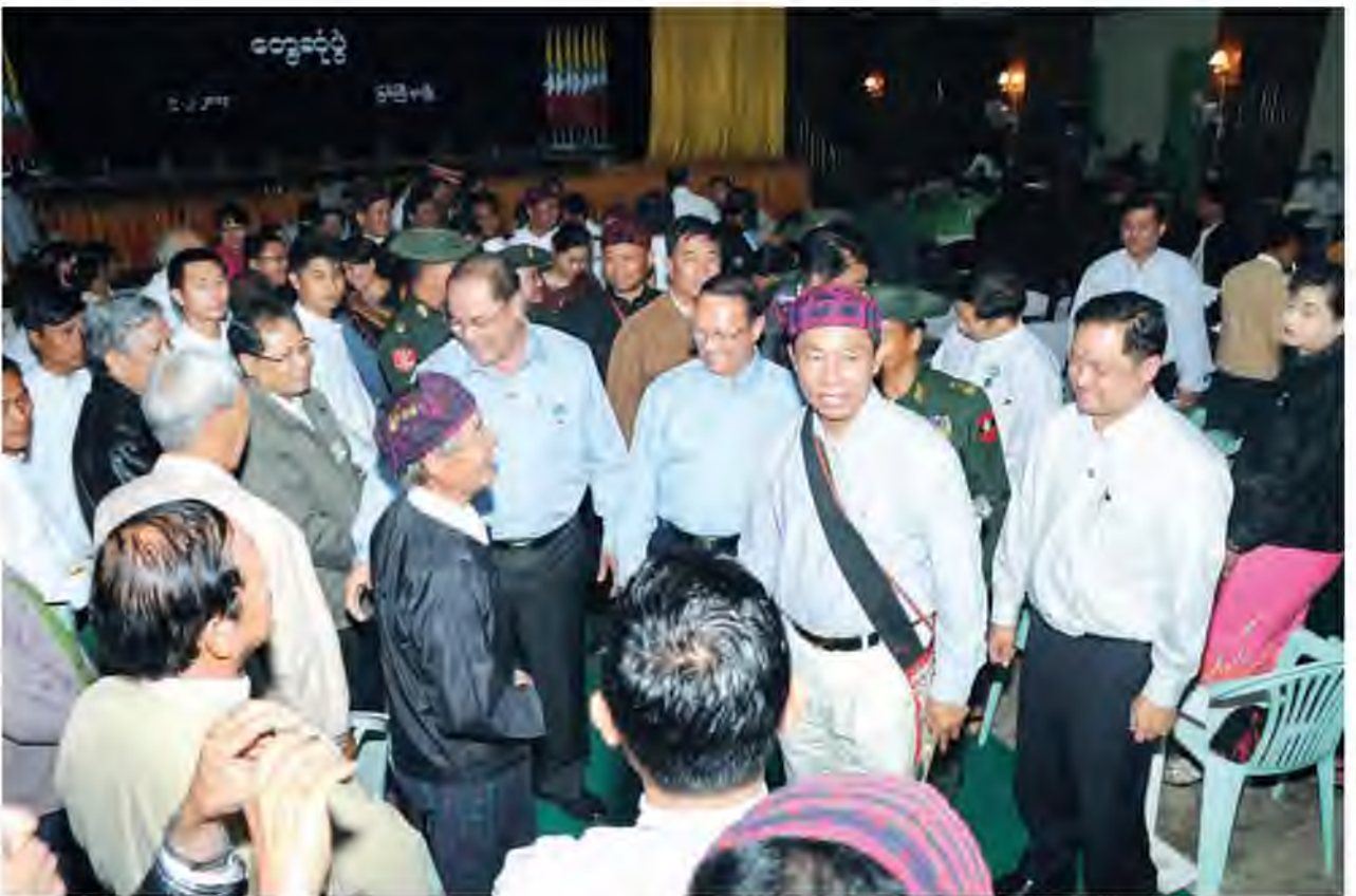
ပြည်သူ့လွှတ်တော်ဥက္ကဋ္ဌ သူရဦးရွှေမန်း မြစ်ကြီးနားမြို့ မြို့တော်ခန်းမ၌ ဒေသခံပြည်သူများအား ရင်းရင်းနှီးနှီးနှုတ်ဆက်စဉ်။

ဆက်လက်၍ လွှတ်တော်များက ထောက်ပံ့လှူဒါန်းသော ဆန်၊ ဆီ၊ ဆား တို့အား ပြည်သူ့လွှတ်တော်ဥက္ကဋ္ဌနှင့် လွှတ်တော်ကော်မတီဥက္ကဋ္ဌများ ဖြစ်ကြ သည့် သူရဦးအေးမြင့်နှင့် စာမျက်နှာ ၃ ကော်လံ ၁ သို့*