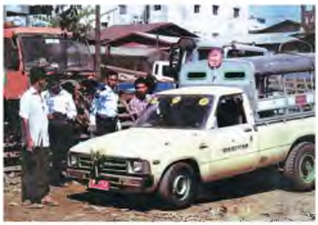
ဖြစ်စဉ်နှင့်ပတ်သက်၍ ယာဉ်မှစစ်ဌာနမှ ရဲအုပ်မြင်းနှင့်အဖွဲ့က လိုအပ်သည်များ စစ်ဆေးပြီး ယာဉ်အား အမှတ်(၁)နယ်မြေ ယာဉ်ထိန်းစခန်းသို့ ပို့အပ်လိုက်သည်။ ယာဉ်မောင်းမှာ ထွက်ပြေးတိမ်းရှောင်နေကြောင်းသိရသည်။(ဖော်ကြီး-ပဏီတ)

ရမည်းသင်း ဖေဖော်ဝါရီ ၁၀ မန္တလေးတိုင်းဒေသကြီး ရမည်းသင်းမြို့နယ်အရှေ့ဘက် ရွှေတောနယ်မြေ မိုးထိမ်းမိဒေသ နွားဘူးတောင်အနီးရှိ ခွင့်ပြုချက်တစ်စုံတစ်ရာမပါဘဲ မြို့နယ်ကျော်ဖြတ်သန်းသယ်ဆောင်မောင်းနှင်လာသူ နွား ငှါ ကောင်အား နွားမောင်းသမား ၂၁ ဦးနှင့်အတူ ဖမ်းဆီးရမိခဲ့ကြောင်း သိရသည်။ ဇန်နဝါရီ ၃၀ ရက်က ဒုရဲအုပ်ချုပ်ငြိမ်းသော်သည် ရွှေတောဒေသ၊ ဝါးဖြူတောင်ရဲကင်းမှူးအဖြစ် တာဝန်ထမ်းဆောင်နေစဉ် ခရိုင်ရဲတပ်ဖွဲ့မှူး၏ ခရိုင်အတွင်း တရားမဝင်နွားများကို စောင့်ဆိုင်းဖမ်းဆီးရန် ညွှန်ကြားချက်အရ ခရိုင်ဒုစရိုက်နှိမ်နင်းရေးတပ်ဖွဲ့ဝင်များနှင့် ရွှေမိုးယံကုမ္ပဏီမှ လုံခြုံရေးအဖွဲ့တို့ ပူးပေါင်းအဖွဲ့သည် နွားဘူးတောင် တောင်ခြေအနီး တောလမ်းမှ နွားများ တရားမဝင်သယ်ယူပို့ဆောင်နေသည်ကို စောင့်ဆိုင်းခဲ့ကြသည်။ (၁၁၅)