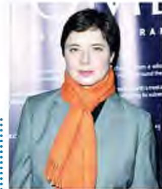
အီတလီ သရုပ်ဆောင် အစ္စတဲလ်လာ ရိုဆယ်လီနီ။

အဆိုပါ The Necessary Death of Charlie Countryman ဇာတ်ကားသည် ၂၀၁၃ ခုနှစ်တွင်မှ အသစ်ထွက်ရှိလာသော ဟာသ၊ အချစ်၊ အက်ရှင်ဇာတ်ကားတစ်ကားဖြစ်ပြီး ဒါရိုက်တာ ဖရီဒရစ်ခ် ဘွန်းက ရိုက်ကူးပုံဖော်ပေးထားသည်။