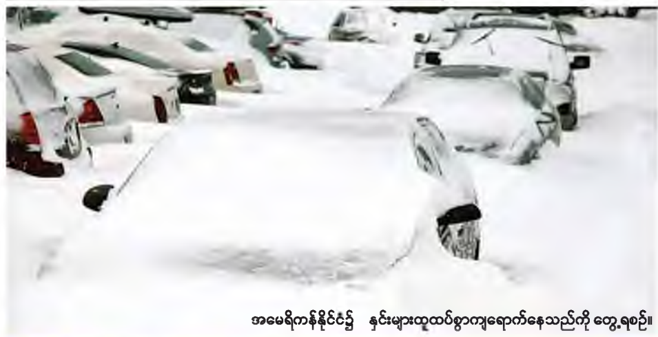
အမေရိကန်နိုင်ငံ၌ နှင်းများထူထပ်စွာကျရောက်နေသည်ကို တွေ့ရစဉ်။