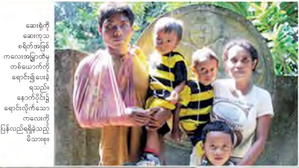
ဆေးရုံကို ဆေးကုသ စရိတ်အဖြစ် ကလေးအမြွှာထဲမှ တစ်ယောက်ကို ရောင်း၍ ပေးခဲ့ ရသည်။ နောက်ပိုင်း၌ ရောင်းလိုက်သော ကလေးကို ပြန်လည်ရရှိခဲ့သည့် မိသားစု။

လူကတာ ဖေဖော်ဝါရီ ၁၀ မသင်္ကာဖွယ်ရာ ကလေးမှောင်ခိုကို စစ်သိုက်ကို စစ်ဆေးလျက်ရှိကြောင်း အင်ဒိုနီးရှားရဲတပ်ဖွဲ့က ပြောကြား သည်ဟု ဖေဖော်ဝါရီ ၈ ရက် ဘီဘီစီသတင်း၌ ဖော်ပြ သည်။ ၎င်းသိုက်သည် ကလေးများကို စင်ကာပူနိုင်ငံသို့ ခေါ်သွားပြီး ယင်းနိုင်ငံမှတစ်ဆင့် အခြားနိုင်ငံများသို့ ရောင်းချလျက်ရှိသည်ဟု ယူဆရသည်။ ဝမ်းဆွဲဆရာမများပါဝင်သော လူနုနုဦးနှင့် မိမိ၏ ရင်သွေးအား ရောင်းချသည်ဟု မသင်္ကာသော မိခင် တစ်ဦးတို့ကို ဖမ်းဆီးထားကြောင်း၊ ကလေးသုံးယောက်ကို လည်း ကယ်ဆယ်နိုင်ခဲ့ကြောင်း ရဲတပ်ဖွဲ့ကပြောသည်။ ၎င်းကလေးများကို တစ်ယောက်လျှင် ဒေါ်လာ အနည်းငယ်ပေး၍ ဆင်းရဲသောမိဘများထံမှ ဝယ်ယူ လာခဲ့ကြသည်ဟု စစ်ဆေးသူများက ပြောသည်။ စင်ကာပူသို့သွားမည့် လက်မှတ်များကိုလည်း ရှာဖွေ တွေ့ရှိခဲ့သည်ဟု ပြောသည်။ ကလေးများကို မွေးစားရန်အတွက် နိုင်ငံအသီးသီးမှ မိဘများထံသို့ ရောင်းချခဲ့ကြောင်း အထောက်အထား များရှိသည်ဟု ကလေးများ ကာကွယ်စောင့်ရှောက်ရေး တာဝန်ရှိသူတစ်ဦးက ပြောသည်။ ယင်းအပြစ် ဤလုပ်ငန်း များကို ၁၉၉၀ပြည့်နှစ်လယ်ပိုင်းမှစ၍ လုပ်ဆောင်နေကြ သည်ဟုဆိုသည်။ ငွေကြေးအမြောက်အမြားရရှိမည့်အပြင် ချမ်းသာ ကြွယ်ဝသောမိသားစုနှင့်အတူနေရသည့်အတွက် ကလေး များ၏လူနေမှုဘဝ ပိုမိုကောင်းမွန်လာမည်ဖြစ်ကြောင်း၊ ဆင်းရဲသောမိဘများကို ဖြားယောင်းပြောဆို၍ ၎င်းတို့ထံမှ ကလေးများကို ဝယ်ယူကြသည်ကိုတွေ့ရသည်ဟု စုံစမ်း စစ်ဆေးရာမှ သိရသည်ဟုဆိုသည်။ ကလေးတစ်ယောက်လျှင် ရူပီးသန်း ၂၀၊ သို့မဟုတ် ကလေးများ၏ ရုပ်ဆင်းအင်္ဂါလုပ်မှုကိုလိုက်၍ ရူပီးသန်း ၄၀အထိ မိခင်များကိုပေးကြသည်ဟု ရဲတပ်ဖွဲ့ပြောရေးဆို ခွင့်ရှိသူက ပြောကြားသည်။ ဘီဘီစီ။