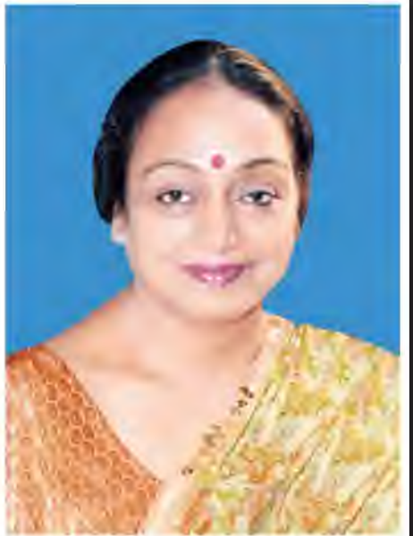
အိန္ဒိယသမ္မတနိုင်ငံ အောက်လွှတ်တော်ဥက္ကဋ္ဌ Honourable Smt. Meira Kumar

ပြည်သူ့လွှတ်တော်ဥက္ကဋ္ဌ သူရဦးရွှေမန်း၏ ဖိတ်ကြားချက်အရ အိန္ဒိယသမ္မတနိုင်ငံ အောက်လွှတ်တော် (LOK SABHA) ဥက္ကဋ္ဌ Honourable Smt. Meira Kumar ခေါင်းဆောင်သော အိန္ဒိယလွှတ်တော်ကိုယ်စားလှယ်အဖွဲ့သည် မကြာမီ မြန်မာနိုင်ငံသို့ ချစ်ကြည်ရေးခရီး လာရောက်မည် ဖြစ်သည်။