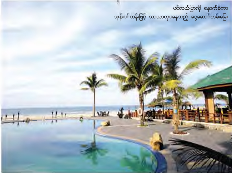
ပင်လယ်ပြင်ကို နောက်ခံကာ အနားယူအပန်းဖြေ သာယာလှပနေသည့် ငွေဆောင်ကမ်းခြေ။

လပေါ်ကမ်းခြေသည် ရခိုင်ပြည်နယ် သံတွဲမြို့မှ ခုနစ် ကီလိုမီတာ (လေးမိုင်) အကွာတွင် တည်ရှိ၍ ကမ်းခြေအလျား ၃ ကီလိုမီတာ (နှစ်မိုင်) ရှည်လျားပြီး အိန္ဒိယသမုဒ္ဒရာဘက်သို့ စာမျက်နှာ ၆ ကော်လံ ၃ သို့