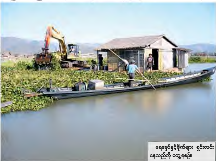
ရေမှော်နှင့်ဖိုက်များ ရှင်းလင်း နေသည်ကို တွေ့ရစဉ်။

❖ ကျောဖုံးမှ မေး ။ ။ အင်းလေးကန်ရဲ့ ပထမ အကျယ်အဝန်းနဲ့ ယခုလက်ရှိ အကျယ်အဝန်းကို သိလိုပါတယ်။ နောက်ပြီးအင်းလေးကန် တိမ်ကော ရခြင်းအကြောင်းလည်း ရှင်းပြပေးပါ ဦးခင်ဗျာ။ ဖြေ ။ ။ အင်းလေးကန်ဟာ မူလက ဧရိယာစတုရန်းမိုင်ပေါင်း ၁၀၄ မိုင်ခန့် ကျယ်ဝန်းခဲ့ပြီး ယခုလက်ရှိတိုင်းတာ ချက်အရ ဧရိယာ ၆၃ စတုရန်းမိုင် ခန့်ရှိပြီး အင်းလေးကန် တိမ်ကော လာရခြင်း အကြောင်းကတော့