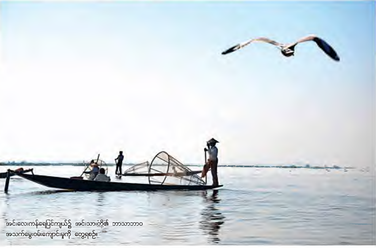
အင်းလေးကန်ရေပြင်ကျယ်၌ အင်းသားတို့၏ ဘာသာဘာဝအသက်မွေးဝမ်းကျောင်းမှုကို တွေ့ရစဉ်။