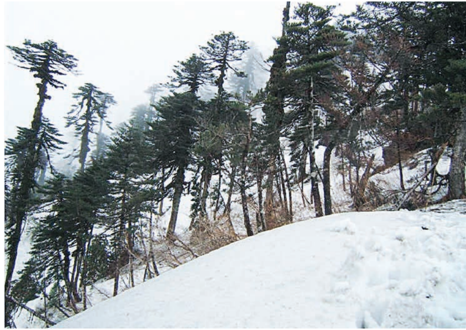
ဖုန်ကန်ရာဇီတောင်ရှိခရီးသွားတစ်ဦးက ချင်းတွင်းမြစ်ဖျားရှိ သဘာဝတောင်ပေါ်ထင်းရှူးတောကို တွေ့ရစဉ်။

(၁၉၁၄၂ ပေ) စသည့် တောင်ထိပ်များ တည်ရှိကာ ဆီးနှင်းရေခဲများအမြဲ ဖုံးလွှမ်းလျက်ရှိသည်။ အကျယ်ဆုံး လွင်ပြင်များမှာ ချင်းတွင်းမြစ်ဖျားရှိ