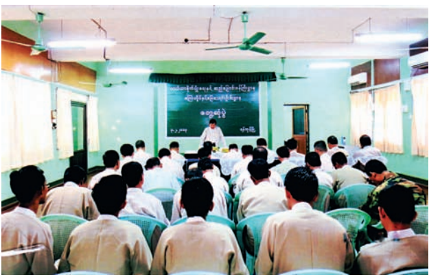
မေဖော်ဝါရီ ၇ ရက်က လယ်ယာမြေလုပ်ပိုင်ခွင့်ပြုလက်မှတ် ထုတ်ပေးရေး ဆောင်ရွက်ရန်နည်းလမ်းများကို ကြွေးတိုင်နှင့်မြေစာရင်းဦးစီးဌာန ညွှန်ကြား ရေးမှူးချုပ် ဦးမြင့်ဆွေ တိုင်းဒေသကြီး ခရိုင်နှင့် မြို့နယ်မြေစာရင်းဦးစီး ဌာနမှူးများအား ဆွေးနွေးမှာကြားစဉ်။

ကော်မတီဥက္ကဋ္ဌ ယဉ်ကျေးမှုဝန်ကြီးဌာန ပြည်ထောင်စုဝန်ကြီး ဦးအေးမြင့်ကြွေက အမှာစကားပြောကြားသည်။ ထို့နောက် ကော်မတီအတွင်းရေးမှူး၊ အနုပညာဦးစီးဌာန ညွှန်ကြား ရေးမှူးချုပ်နှင့် တာဝန်ရှိသူများက သက်ဆိုင်ရာကဏ္ဍအလိုက် ဆွေးနွေးညှိနှိုင်း ခဲ့ကြကြောင်း သတင်းရရှိသည်။ (သတင်းစဉ်)