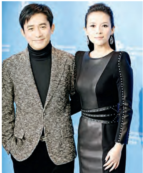
'The Grandmaster' ဇာတ်ကားမှ ဒါရိုက်တာ ဝန်ကော့နှင့် မင်းသမီး ကျန်းကျိတို့အား ဘာလင်နိုင်ငံ တကာရုပ်ရှင်ပွဲတော်တွင် တွေ့ရစဉ်။

(၆၃)ကြိမ်မြောက် ဘာလင်နိုင်ငံတကာရုပ်ရှင်ပွဲတော် ဖွင့်ပွဲအခမ်းအနားကို ဖေဖော်ဝါရီ ၇ ရက်က ကျင်းပခဲ့ရာ အဆိုပါဖွင့်ပွဲအခမ်းအနားတွင် ယင်းရုပ်ရှင်ပွဲတော်၏ အကဲဖြတ်ပိုင်ခွင့်ရရှိသူ တရုတ်ဒါရိုက်တာ ဝန်ကော့၏ 'The Grandmaster' ဇာတ်ကားဖြင့် စတင်ပွင့်လှစ်ပေးခဲ့ကြောင်း သိရသည်။