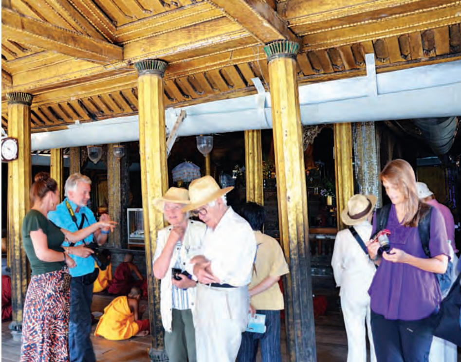
ဖေဖော်ဝါရီ ၈ ရက်က ကမ္ဘာလှည့်ခရီးသွားများ ရွှေရန်ပြေကျောင်းတော်အတွင်း၌ ရှေးဟောင်းအနုပညာလက်ရာများ လေ့လာကြစဉ်။

ထို့နောက် ပေါက်မြို့နယ် ကမ်းပါးဖြူကျေးရွာ၌ သရက်ချောင်းတံတားတည်ဆောက်နေမှု၊ ပုံရွာ-ပုလဲ-ဂန့်ဂေါင်-ဟားခါးလမ်း ၃၄ ပေအကျယ် လမ်းသားတိုးချဲ့ခြင်းလုပ်ငန်း၊ ပုံရွာ-ပုလဲ-ဂန့်ဂေါင်-ဟားခါးလမ်းမှ ဆေးမင်းတော-တောမ-ရေမျက်နှိလမ်းပိုင်း မိုင်တိုင်(၉၃/၄)နှင့်(၉၃/၅)အကြား ပေ ၄၀ သံကွက်ကရစ်တံတား တည်ဆောက်နေမှုတို့ကို ကြည့်ရှုစစ်ဆေးခဲ့ကြောင်း သတင်းရရှိသည်။ (သတင်းစဉ်)