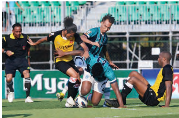
ရန်ကုန်နှင့် နေပြည်တော်အသင်းတို့ ယှဉ်ပြိုင်ကစားစဉ်။

စုံစမ်းစစ်ဆေးရေးကော်မရှင် ၂၀၁၃ ခုနှစ်၊ ဖေဖော်ဝါရီလ ၉ ရက်