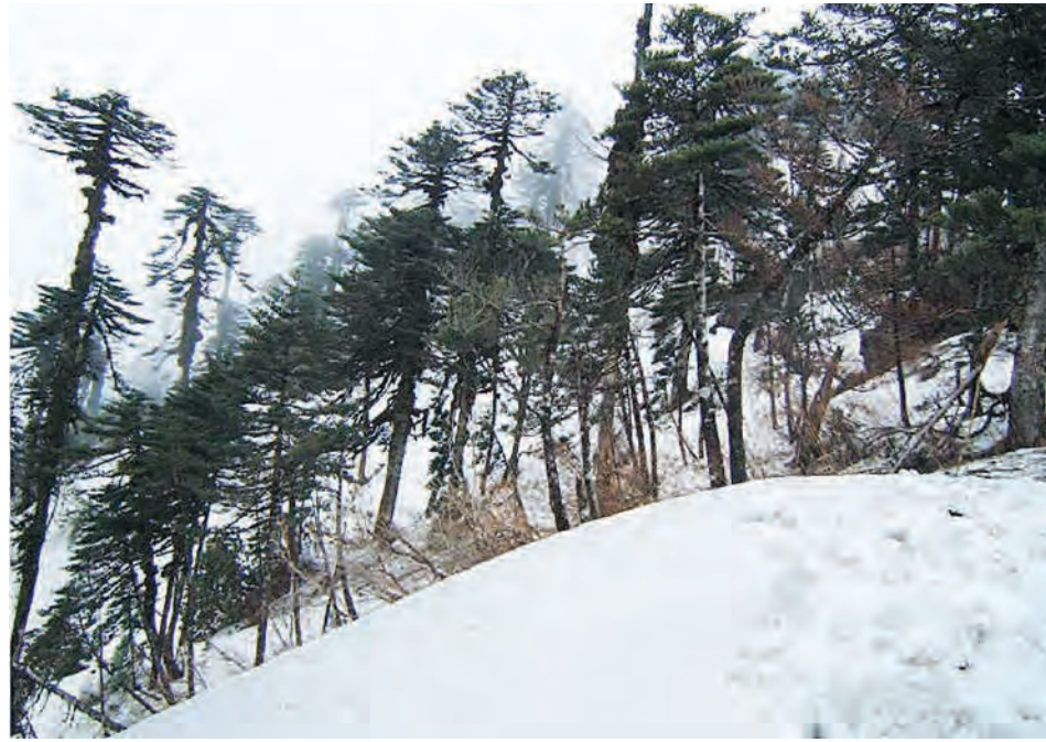
ဖုန်ကန်ရာဇီတောင်ရှိခရီးသွားတစ်ဦး၏ရိုက်ကူးထားသော ခါကာဘိုရာဇီတောင်ပေါ်ထင်းရှူးတောကို တွေ့ရစဉ်။

(၁၉၁၄၂ ပေ) စသည့် တောင်ထိပ်များ တည်ရှိကာ ဆီးနှင်းရေခဲများအမြဲ ဖုံးလွှမ်းလျက်ရှိသည်။ အကျယ်ဆုံး လွင်ပြင်များမှာ ချင်းတွင်းမြစ်ဖျားရှိ