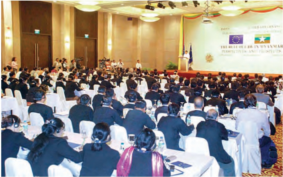
မြန်မာနိုင်ငံ တရားဥပဒေစိုးမိုးရေးလုပ်ငန်းစဉ်နှင့် ရှေ့အလားအလာ (Rule of Law in Myanmar; Perspectives and Prospects) ဆွေးနွေးပွဲ ကျင်းပစဉ်။ (သတင်းစဉ်)

တရားဥပဒေစိုးမိုးရေးဆိုင်ရာ အခြေခံမူတွင် လွတ်လပ်မှု၊ ကျင့်ဝတ်မှန်ကန်မှု၊ သာတူညီမျှမှု၊ ရိုးသားဖြောင့်မတ်မှု၊ ဘက်မလိုက်မှု၊ ကျိုးကြောင်းဆီလျော်မှု၊ အရည်အချင်းပြည့်ဝမှု၊ လုံ့လဝီရိယရှိမှုတို့ ပါဝင်ပါကြောင်း၊ တရားဥပဒေစိုးမိုးရေး၏ အချက်(၇)ချက်မှာ လွတ်လပ်၍ တည်ငြိမ်သော လူ့ဘောင်အဖွဲ့အစည်း အုပ်ချုပ်မှုအတွက် လွန်စွာအရေးပါသော အချက်များဖြစ်ပါကြောင်း၊ ထိုအချက်များမှာ သင့်လျော်သောဥပဒေရေးရာ ဖြစ်စဉ်မရှိဘဲ မည်သူ့ကိုမျှ အပြစ်မပေးနိုင်ခြင်း၊ ဥပဒေရှေ့မှောက်၌ အားလုံးသာတူညီမှုဖြစ်ခြင်း၊ တရားသူကြီးများသည် ဘက်လိုက်မှုကင်းပြီး လွတ်လပ်စွာ တရားစီရင်ရခြင်း၊ ညှဉ်းပန်းနှိပ်စက်မှုနှင့်လမ်းကိုအသုံးပြု၍ အပြစ်ဝန်ခံစေခြင်းကို လက်မခံခြင်း၊ မည်သည့်အကျဉ်းသားမဆို တရားရုံးရှေ့မှောက်တွင် ၎င်းအား ထိန်းသိမ်းထားမှုအတွက် ခုခံချေပနိုင်ခွင့်ကို မနေင့်နေ့စေဘဲ ပေးရခြင်း၊ အစိုးရအရာရှိများ၊ တရားသူကြီးများ၏ ဥပဒေအနက်အဓိပ္ပာယ်ဖွင့်ဆိုခြင်းကို ဥပဒေဖြင့် ကန့်သတ်ထားသင့်ခြင်းနှင့် မျှတသော၊ ဘက်မလိုက်သော