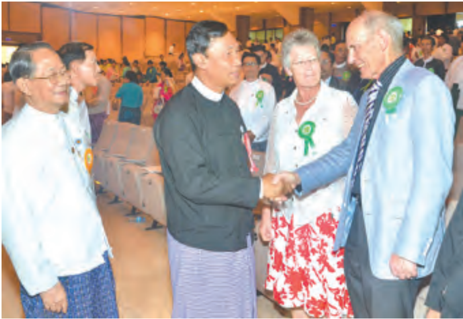
ပြည်ထောင်စုလွှတ်တော်နာယက၊ ပြည်သူ့လွှတ်တော်ဥက္ကဋ္ဌ သူရဦးရွှေမန်း ဧည့်သည်တော်များနှင့် သံတမန်အဖွဲ့ဝင်များအား ရင်းရင်းနှီးနှီးနှုတ်ဆက်စဉ်။

ရှေးဦးစွာ ပြည်ထောင်စုလွှတ်တော်နာယက သူရဦးရွှေမန်းက အဖွင့်အမှာစကား ပြောကြားရာတွင် ကမ္ဘာပေါ်ရှိ အချုပ်အခြာအာဏာပိုင်နိုင်ငံများအနက် နိုင်ငံပေါင်း ၁၆၂ နိုင်ငံက ဒီမိုကရေစီစနစ်ကို လက်ခံကျင့်သုံးလျက် ရှိကြပါကြောင်း၊ ယခုလို ကျင့်သုံးနေခြင်းကို ဂုဏ်ပြုသည့်အနေဖြင့်လည်းကောင်း၊ အစိုးရများအနေဖြင့် ဒီမိုကရေစီကျင့်စဉ်များကို အားပေးမြှင့်တင်နိုင်ရန်နှင့် ပြည်သူများအကြား ဒီမိုကရေစီစိတ်ဓာတ် အစဉ်ရှင်သန်နှိုးကြားနေစေရန်အတွက် လည်းကောင်း၊ ဒီမိုကရေစီကျင့်စဉ်များကို ယနေ့ကာလတွင်သာမက အနာဂတ်ကာလတွင်လည်း အစဉ်အမြဲ လုပ်ဆောင်ရန် နှိုးဆော်တိုက်တွန်းပေးသည့် အနေဖြင့်လည်းကောင်း၊ ကောင်းမြတ်သော ရည်ရွယ်ချက်များဖြင့် နှစ်စဉ် စက်တင်ဘာ ၁၅ ရက်ကို အပြည်ပြည်ဆိုင်ရာ ဒီမိုကရေစီနေ့ အဖြစ်သတ်မှတ်ပြီး နိုင်ငံအလိုက် အထိမ်းအမှတ် အခမ်းအနားများ ပြုလုပ်ရန် ၂၀၀၇ခုနှစ် (၆၂)ကြိမ် မြောက် ကုလသမဂ္ဂအထွေထွေညီလာခံက ဆုံးဖြတ်ခဲ့ကြပါကြောင်း၊ ဒီမိုကရေစီနေ့ကျင်းပရန် ရက်သတ်မှတ်ရွေးချယ်ရာတွင် ပါလီမန်အမတ်များသမဂ္ဂ (Inter-Parliamentary Union-IPU)က အပြည်ပြည်ဆိုင်ရာဒီမိုကရေစီ ကြေညာစာတမ်းထုတ်ပြန်ခဲ့သည့် ၁၉၉၇ ခုနှစ် စက်တင်ဘာ ၁၅ ရက်ကို ဂုဏ်ပြုရွေးချယ်ခဲ့ကြခြင်း ဖြစ်ပါကြောင်း။