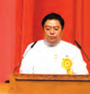
ပြည်ထောင်စုကြံ့ခိုင်ရေးနှင့် ဖွံ့ဖြိုးရေးစာတမ်းကို သက်ဆိုင်ရာကိုယ်စားလှယ်က ဖတ်ကြားစဉ်။

ထို့နောက်အမျိုးသားလွှတ်တော်ဥက္ကဋ္ဌ ဦးခင်အောင်မြင့်က အမှာစကားပြောကြားရာတွင် စနစ်သစ်တစ်ခုကို ကူးပြောင်းခါစအချိန်တွင် ပြည်သူများသည် မျှော်လင့်ချက်များ ကြီးကြီးမားမားရှိနေတတ်သည်မှာ သဘာဝကျပါကြောင်း၊ မျှော်လင့်ချက်ကြီးမားနေသည့် ပြည်သူများသည် မျှော်တော်ငေးနှင့်မောမသွားရန်လိုပါကြောင်း၊ ထို့ကြောင့် ခေါင်းဆောင်များသည် ပထမဦးစွာ ပြည်သူများ၏ စိုးရိမ်သောကများကို ပြတ်ပြတ်သားသား ဖြေရှင်းရုံမရမည် ဖြစ်ပါကြောင်း၊ အထူးအားဖြင့် လူများစုဖြစ်သော တောင်သူလယ်သမားနှင့် ဆင်းရဲသားဖြစ်သည့် အောက်ခြေ အလုပ်သမားတို့၏ အရေးကို ဦးစားပေးရမည်ဖြစ်ပါကြောင်း၊ မူဝါဒမှန်သမျှ သူတို့၏ အကျိုးစီးပွားပါရန် လိုပါကြောင်း၊ ဒုတိယအားဖြင့် ခုရေတွင်းတူးခုရေကြည်သောကံ၊ ခုချက်ချင်း