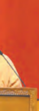
အမျိုးသားဒီမိုကရေစီအဖွဲ့ချုပ်ပါတီ၏ စာတမ်းကို သက်ဆိုင်ရာ ကိုယ်စားလှယ်က ဖတ်ကြားစဉ်။

ခြင်းတို့ဖြင့် ဝိုင်းဝန်းပေါင်းစည်းဆောင်ရွက်သွားကြရမည် ဖြစ်ပါကြောင်း၊ ဒီမိုကရေစီကျင့်စဉ်များ ကျင့်သုံးရာမှာ လွှတ်တော်များ၏ အရည်အချင်းများ မြင့်မားတိုးတက်လာအောင်လည်း ဖတ်ရွှေလေ့လာခြင်း၊ ဆွေးနွေးညှိနှိုင်းခြင်း၊ နိုင်ငံတကာလွှတ်တော်များသို့ သွားရောက်လေ့လာခြင်း၊ သင်တန်းနှင့်လေ့ကျင့်မှုများ ပြုလုပ်ပေးလျက်ရှိပါကြောင်း၊ ပြည်သူများ၏ အကျိုးအတွက် အခြေပြုပြီး ပြည်သူများ၏ ရွေးချယ်မှုနှင့်ပေါ်ပေါက်လာကြသည့်အဖွဲ့အစည်းများ ဖြစ်ကြသည့်အတွက် ပြည်သူများ၏အသံ၊ ပြည်သူများ၏ဆန္ဒ၊ ပြည်သူများ၏မျှော်လင့်ချက်များကို သိရှိအောင် ကြိုးပမ်းနေကြရမည် ဖြစ်သကဲ့သို့ အခြေအနေ အချိန်အခါအလိုက် ဖြည့်ဆည်းဆောင်ရွက်ပေးနေကြရ