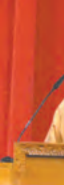
အမျိုးသားဒီမိုကရေစီအဖွဲ့ချုပ်ပါတီ၏ စာတမ်းကို သက်ဆိုင်ရာ ကိုယ်စားလှယ်က ဖတ်ကြားစဉ်။

ကြသည့် ဒီမိုကရေစီစနစ်များသည် မိမိတို့နိုင်ငံ၏ ရေမြေသဘာဝ၊ ယဉ်ကျေးမှုလေ့ထုံးစံ၊ သမိုင်းကြောင်း နောက်ခံပထဝီဝင်နှင့် ရွေးချယ်သတ်မှတ်ပြီး အကျိုးစီးပွားအတွက် ရွေးချယ်ကျင့်သုံး ကြခြင်းဖြစ်ပါကြောင်း၊ ယနေ့ နိုင်ငံရေးပညာရှင်များ၏ လေ့လာချက်အရ ကမ္ဘာပေါ်တွင် ဒီမိုကရေစီအမျိုးအစားပေါင်း ၃၅ မျိုးရှိနေသည်ဟု သိရှိရပါကြောင်း၊ မည်သို့ပင် အမျိုးအစားကွဲပြားမှုရှိကြသော်လည်း ဒီမိုကရေစီသည် ပြည်သူများအတွက် ပြည်သူများ၏ အရေးအရာကိစ္စများကို ပြည်သူတို့က အုပ်ချုပ်သောစနစ် ဖော်ဆောင်ခြင်းသာဖြစ်ပါကြောင်း၊ ပြည်သူများက ပြည်သူ့ကိုယ်စားလှယ်များကို အခြေခံစည်းမျဉ်းများနှင့်အညီ ရွေးချယ်တင်