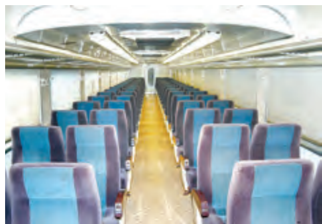
ရန်ကုန်-ကျိုက်ထို အထူးအမြန်ရထားတွင် အဆင့်မြင့်ထိုင်ခုံများ တပ်ဆင်ထားသည်ကို တွေ့ရစဉ်။