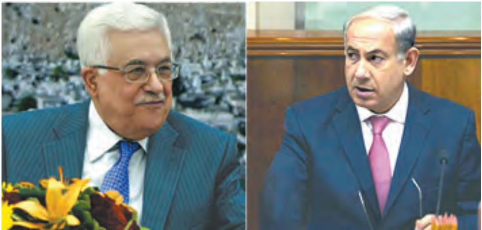
ပါလက်စတိုင်းခေါင်းဆောင် မာမူတ်အဘတ်စ်။ အစ္စရေးဝန်ကြီးချုပ် နေတန်ယာဟု။

စက်တင်ဘာ ၁ ရက်က ပြုလုပ်ခဲ့တဲ့ နှစ်ဖက်ညှိနှိုင်းရေးမှူးများရဲ့ ဆွေးနွေးပွဲမှာတော့ အရှေ့အလယ်ပိုင်းဆိုင်ရာ အမေရိကန်အထူးကိုယ်စားလှယ် မာတင်အင်ဒ်ပါဝင်ခဲ့ဖူး။ စက်တင်ဘာ ၃ ရက်မှာ ထပ်မံပြုလုပ်မယ့် တွေ့ဆုံဆွေးနွေးပွဲမှာတော့