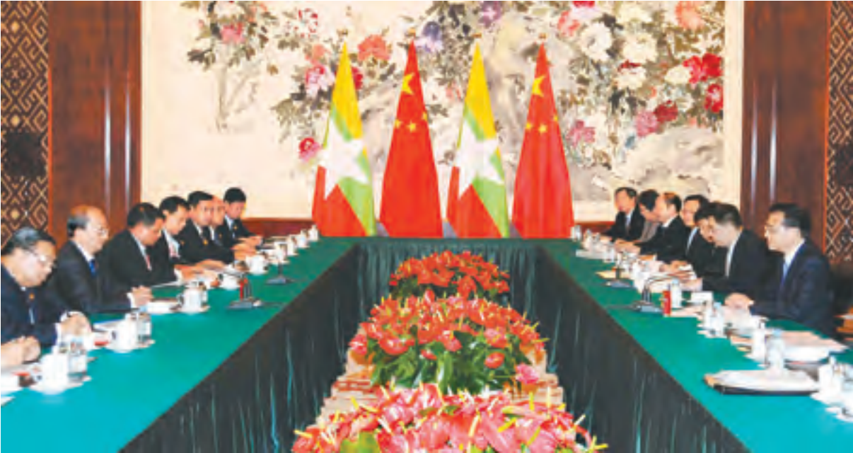
နေပြည်တော် စက်တင်ဘာ ၃

တရုတ်နိုင်ငံသည် ယခုအခါ အာဆီယံ၏ အကြီးဆုံးကုန်သွယ်ဖက် နိုင်ငံဖြစ်သကဲ့သို့ အာဆီယံသည် လည်း တရုတ်နိုင်ငံ၏တတိယ အကြီးဆုံး ကုန်သွယ်ဖက်ဖြစ်နေပါ ကြောင်း၊ တရုတ်နိုင်ငံက အာဆီယံ ဒေသကို တိုက်ရိုက်ရင်းနှီးမြှုပ်နှံမှု ပမာဏသည် သိသိသာသာတိုးတက် လာပါကြောင်း၊ ထိုသို့ မြှင့်တက်လာ ခြင်းသည် ကောင်းမွန်သည့် လက္ခဏာဖြစ်ပြီး ဆက်လက်ထိန်း သိမ်းသွားရန် လိုအပ်ပါကြောင်း၊ ၂၀၁၀ ပြည့်နှစ်၌ အာဆီယံ-တရုတ် လွတ်လပ်သော ကုန်သွယ်ရေး နယ်မြေကို စတင်ထူထောင်နိုင်ခဲ့ပြီး ကမ္ဘာပေါ်၌ လူဦးရေအများဆုံးနှင့် ပြည်တွင်း အသားတင်ထုတ်လုပ်မှု