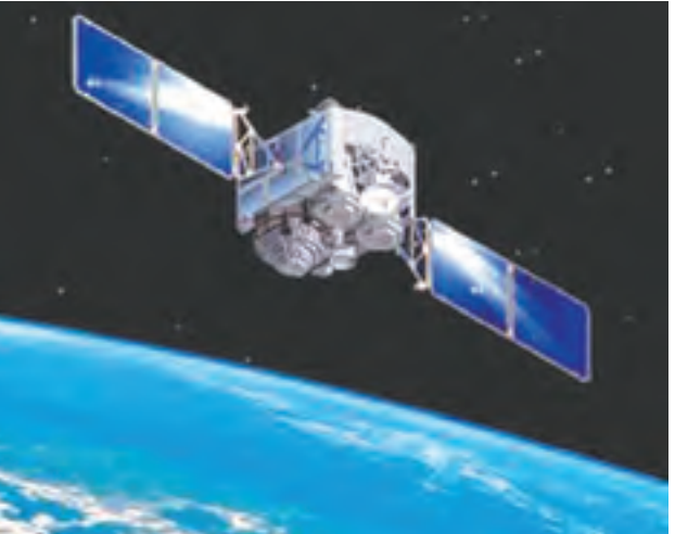
ကမ္ဘာဂြိုဟ်ပတ်လမ်းကြောင်းအတွင်း လွှတ်တင်ထားသည့် အစ္စရေးနိုင်ငံမှ ဆက်သွယ်ရေးဂြိုဟ်တုတစ်စင်းကို တွေ့ရစဉ်။

အရှေ့အရပ်ပိုင်းများအထိ အကူအညီပေးနိုင်မည် ဖြစ်သည်။ အစ္စရေးနိုင်ငံသည် အာကာသသို့ ကိုယ်ပိုင် ခုံးပျံဖြင့် ပြည်တွင်းလုပ် ဂြိုဟ်တု ဝန်ဆောင်မှု လုပ်ငန်းများကို အရှေ့များကို လွှတ်တင်နိုင်ရန် ဆက်လက် စီစဉ်လျက်ရှိသည်။