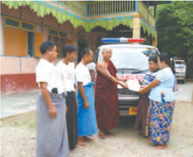
သက်ကြီးရွယ်အိုများ ဆေးဝါးကုသနိုင်ရန်အတွက် ငွေကျပ် ၁၅၅၀၀၀ လှူဒါန်းခဲ့ကြောင်း သိရသည်။ (အပေါ်ပုံ)