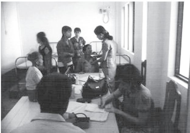
ထားဝယ်မြို့ သီတဂူအာရောဂျဒါနဆေးရုံတော်၌ ဩဂုတ် ၂၁ ရက်မှ စ၍ ပြင်ပလူနာအခမဲ့ဆေးခန်းဖွင့်လှစ်ကာ စေတနာရှင်အထူးကုဆရာဝန်ကြီးများဦးဆောင်၍ ဆေးကုသလျက်ရှိရာ ဩဂုတ် ၃၁ရက်က လူနာများလာရောက်ဆေးကုသမှုခံယူနေစဉ်။

မော်လူး စက်တင်ဘာ ၃ စစ်ကိုင်းတိုင်းဒေသကြီး အင်းတော်မြို့နယ် မော်လူးဒေသ ဟောင်းတုန်းကျေးရွာအုပ်စုဆားမော်ကျေးရွာတွင် ဆောင်းရာသီနှောင်းပိုင်းနှင့် နွေရာသီတို့တွင်ရေရှားပါးပြီး သောက်သုံးရေအခက်အခဲရှိနေကြောင်း သိရသည်။ ဆားမော်ကျေးရွာသည် မိုးရာသီနှင့် ဆောင်းရာသီ အစောပိုင်းအထိသာ သောက်သုံးရေ ပြည့်ပြည့်ဝဝသုံးစွဲ