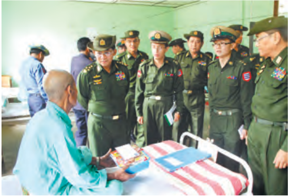
ပေးစက်နှင့် မွေးလူနာများအတွက် ထောက်ပံ့ငွေများ ပေးအပ်သည်။ ယင်းနောက် တပ်မတော်

ထို့နောက် တပ်မတော်ကာကွယ်ရေးဦးစီးချုပ်နှင့် ဇနီးတို့က စစ်မြေ ပြင်ဆေးတပ်ရင်းအတွက် လေအေး