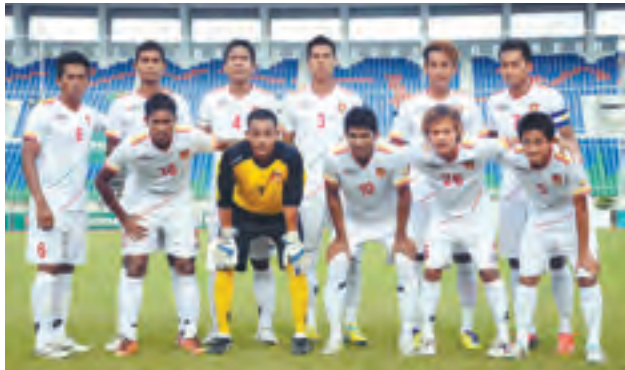
မာဒေးကားဖလားပြိုင်ပွဲဝင်မည့် မြန်မာယူ-၂၃ အသင်း ကစားသမားများ။

ယင်းပြိုင်ပွဲကို အိမ်ရှင်မလေးရှား ယူ-၂၃ အသင်း၊ မြန်မာယူ-၂၃ အသင်း၊ စင်ကာပူယူ-၂၃ အသင်းနှင့် ထိုင်းပရီမီယာလိဂ်ညွန့်ပေါင်းအသင်းတို့ ယှဉ်ပြိုင် မည်ဖြစ်ကာ စက်တင်ဘာ ၇ ရက်မှ ၁၄ ရက်အထိ ကျင်းပသွားမည်ဖြစ်သည်။ ပြိုင်ပွဲဝင်ရန် မြန်မာအသင်းသည် စက်တင်ဘာ ၅ ရက်တွင် ထွက်ခွာမည်ဖြစ်ပြီး ပွဲဦးထွက်ပွဲစဉ်အဖြစ် စက်တင်ဘာ ၇ ရက်တွင် ထိုင်းအသင်းနှင့် စတင်ကစား ရမည်ဖြစ်သည်။