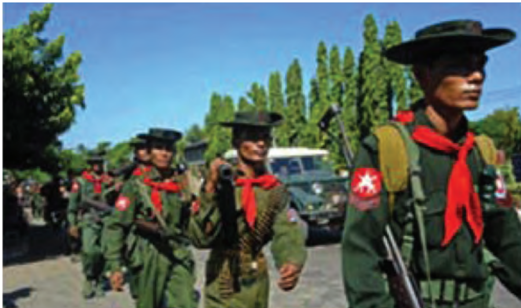
ကချင်ပြည်နယ်တွင်း မြန်မာအစိုးရ စစ်တပ်များ ပိုမိုတိုးချဲ့လာခြင်း။ ၂၀၁၃ ခုနှစ် ဧပြီလ။

“အရပ်သား” အစိုးရသစ်တက်လာချိန်မှစ၍ အမျိုးသမီးများ အဖွဲ့ချုပ် (မြန်မာနိုင်ငံ)နှင့် အဖွဲ့ဝင် အဖွဲ့အစည်းများသည် မြန်မာ့တပ်မတော်၏ လိင်ပိုင်းဆိုင်ရာအကြမ်းဖက်မှုများ ကျူးလွန်ခံခဲ့ရသော အမျိုးသမီး (၁၀၄) ဦးကို မှတ်တမ်းပြုစု နိုင်ခဲ့သည်။ ယင်းအမှုများသည် အပေါ်ယံမျှသာရှိသေးသည်။ ပြုမူဆောင်ရွက်ပုံ သဘောသဘာဝနှင့် ကျူးလွန်ပုံများသည် အဓမ္မပြုကျင့်မှုကို စစ်ပွဲနှင့် တိုင်းရင်းသား ဒေသများအတွင်း ဖိနှိပ်မှုကိရိယာအဖြစ် ယနေ့တိုင်အသုံးပြုနေဆဲဖြစ်ကြောင်းအတည်ပြုနိုင်သည်။ ဤချိုးဖောက်မှုများသည် စစ်ရာဇဝတ်မှုနှင့် လူသားဖြစ်မှုကို ဆန့်ကျင်သော ရာဇဝတ်မှုများ ဖြစ်လာနိုင်ဖွယ် ရှိနေသဖြင့် ယင်းလုပ်ရပ်များကို ချက်ချင်းရပ်တံ့ရမည်။