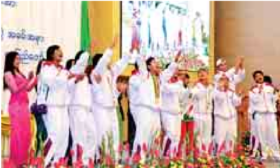
(၂၇)ကြိမ်မြောက် ဆီးရိမ်းပြိုင်ပွဲ ဂုဏ်ပြုချီးမြှင့်ပွဲအခမ်းအနားတွင် နိုင်ငံ့ဂုဏ်ဆောင်ဆုတံဆိပ်ရ မြန်မာအားကစားသမားများအား ဂုဏ်ပြုဆုလှူအပြီး တွေ့ရစဉ်။