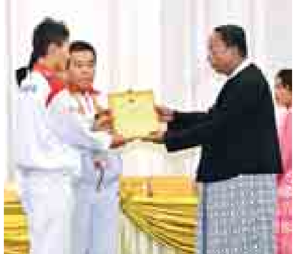
အမျိုးသားလွှတ်တော်ဥက္ကဋ္ဌ ဦးခင်အောင်မြင့် (၂၇)ကြိမ်မြောက် ဆီးရိမ်းပြိုင်ပွဲတွင် ရွှေ၊ ငွေ၊ ကြေး ဆုတံဆိပ်ရ အားကစားအဖွဲ့အား ဂုဏ်ပြုမှတ်တမ်းလွှာ ချီးမြှင့်စဉ်။

အရှေ့တောင်အာရှအားကစားပြိုင်ပွဲ မော်ကွန်းသစ်စီဒီကိုပြသခဲ့သည်။ ဆက်လက်၍ နိုင်ငံတော်သမ္မတ ဦးသိန်းစိန်၊ ဒုတိယသမ္မတ ဒေါက်တာစိုင်းမောက်ခမ်း၊ ဒုတိယ သမ္မတ ဦးညက်ထွန်း၊ ပြည်ထောင်စု လွှတ်တော်နာယက၊ ပြည်သူ့ လွှတ်တော်ဥက္ကဋ္ဌ၊ သူရဦးရွှေမန်း၊ အမျိုးသားလွှတ်တော် ဥက္ကဋ္ဌ ဦးခင် အောင်မြင့်၊ ပြည်ထောင်စုတရားသူ ကြီးချုပ် ဦးထွန်းထွန်းဦး၊ တပ်မတော် ကာကွယ်ရေးဦးစီးချုပ်ဗိုလ်ချုပ်ဖျူးကြီး မင်းအောင်လှိုင်၊ နိုင်ငံတော်ဖွဲ့စည်းပုံ အခြေခံဥပဒေဆိုင်ရာ ခုံရုံးဥက္ကဋ္ဌ ဦးမြသိန်း၊ ပြည်ထောင်စုဓမ္မကောက် ပွဲကော်မရှင်ဥက္ကဋ္ဌ ဦးတင်အေးနှင့် ဒုတိယတပ်မတော်ကာကွယ်ရေး ဦးစီးချုပ် ကာကွယ်ရေးဦးစီးချုပ်