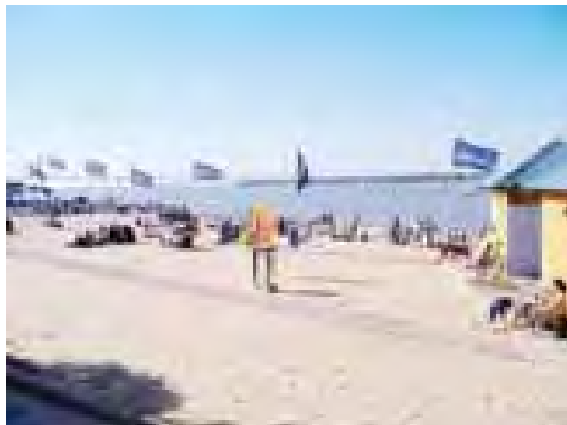
အာဂျင်တီးနားနိုင်ငံ ရိုဆာရီယိုမြို့အနီးရှိ မြစ်ကမ်းနံဘေး၌ အပူလှိုင်းဒဏ်မှ သက်သာရာရရေးအတွက် နားခိုနေသူများအား တွေ့ရစဉ်။