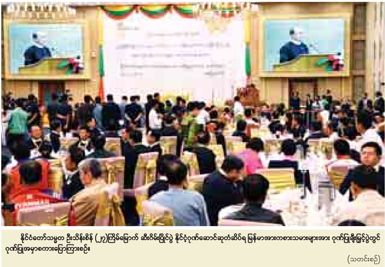
နိုင်ငံတော်သမ္မတ ဦးသိန်းစိန် (၂၇)ကြိမ်မြောက် ဆီးရိမ်းပြိုင်ပွဲ နိုင်ငံ့ဂုဏ်ဆောင်ဆုတံဆိပ်ရ မြန်မာအားကစားသမားများအား ဂုဏ်ပြုချီးမြှင့်ပွဲတွင် ဂုဏ်ပြုအမှာစကားပြောကြားစဉ်။