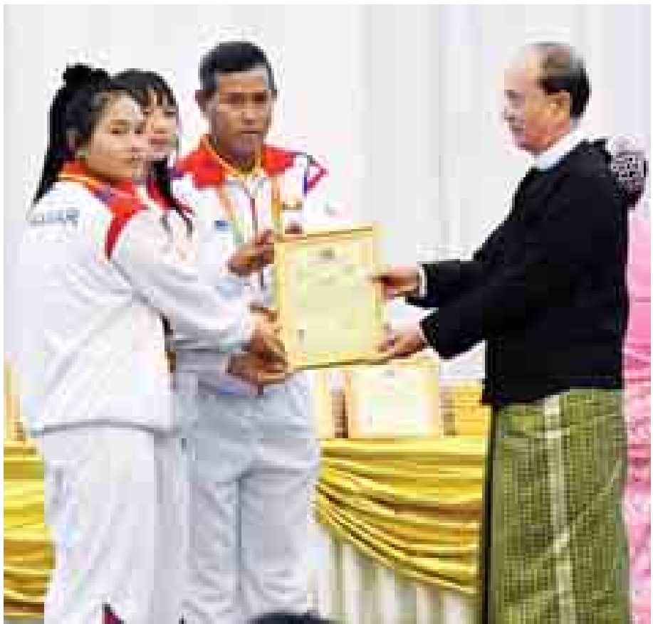
နိုင်ငံတော်သမ္မတ ဦးသိန်းစိန် (၂၇)ကြိမ်မြောက် ဆီးရိမ်းပြိုင်ပွဲတွင် ရွှေ၊ ငွေ၊ ကြေး ဆုတံဆိပ်ရ အားကစားအဖွဲ့အား ဂုဏ်ပြုမှတ်တမ်းလွှာ ချီးမြှင့်စဉ်။

(၂၇)ကြိမ်မြောက် အရှေ့တောင် အာရှ အားကစားပြိုင်ပွဲ၌ နိုင်ငံ့ ဂုဏ်ဆောင်ဆုတံဆိပ်ရ မြန်မာ အားကစားသမားများအား ညစာ စားပွဲဖြင့် တည်ခင်းစည်ခံခဲ့သည်။ အဆိုပါ ဂုဏ်ပြုအခမ်းအနားသို့ နိုင်ငံတော်သမ္မတနှင့်အတူ ဒုတိယ သမ္မတများ၊ ပြည်ထောင်စုလွှတ်တော် နာယက ပြည်သူ့လွှတ်တော်ဥက္ကဋ္ဌ၊ အမျိုးသား လွှတ်တော်ဥက္ကဋ္ဌ၊ ပြည်ထောင်စု တရားသူကြီးချုပ်၊ တပ်မတော် ကာကွယ်ရေးဦးစီးချုပ်၊ ဖွဲ့စည်းပုံအခြေခံဥပဒေဆိုင်ရာ ခုံရုံး ဥက္ကဋ္ဌ၊ ပြည်ထောင်စုဓမ္မကောက်ပွဲ ကော်မရှင်ဥက္ကဋ္ဌ၊ ဒုတိယတပ်မတော် ကာကွယ်ရေးဦးစီးချုပ် ကာကွယ်ရေး ဦးစီးချုပ်(ကြည်း)၊ ပြည်ထောင်စု ဝန်ကြီးများ၊ မန္တလေးတိုင်းဒေသကြီး ဝန်ကြီးချုပ်၊ ဒုတိယဝန်ကြီးများ၊ နေပြည်တော်တိုင်း စစ်ဌာနချုပ် တိုင်းဖျူး၊ ပြိုင်ပွဲကျင်းပရေးကော်မတီ ဝင်များ၊ မြန်မာနိုင်ငံအားကစားအဖွဲ့