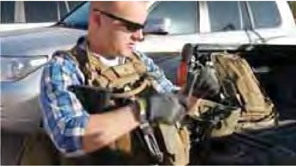
လတ်ဗျားနိုင်ငံ ဗြိတိန်တပ်ဖွဲ့က အမေရိကန်သံရုံးကို လုံခြုံရေးစောင့်ကြပ်နေသော အထူးတပ်ဖွဲ့ဝင်တစ်ဦးကို တွေ့ရစဉ်။

ဂျေရုဆလမ် ဒီဇင်ဘာ ၂၈ အစွဲရေနိုင်ငံ၏ အသိမ်းပိုက်ခံဒေသများ၌ အိမ်ရာသစ်များတိုးချဲ့ထူထောင်မှုကို ဆန့်ကျင်ကန့်ကွက်ဆန္ဒပြမှုတစ်ရပ် ဖြစ်ပွားနေစဉ်အတွင်း အနောက်ဘက်ကမ်းဒေသရှိ အသိမ်းပိုက်ခံဒေသတွင်ရှိသော ပါလက်စတိုင်းကျေးရွာ နဘီဆာလေ ကို အစွဲရေတပ်ဖွဲ့များက စီးနင်းတိုက်ခိုက်မှုများပြုလုပ်ခဲ့ပြီးနောက် ပါလက်စတိုင်းနှင့် အစွဲရေတို့အကြား တိုက်ခိုက်မှုများ ဖြစ်ပွားခဲ့ကြောင်း ယနေ့ဘီဘီစီသတင်းတွင် ဖော်ပြသည်။ အကြီးစား စစ်လက်နက်များ တပ်ဆင်ထားသော အစွဲရေတပ်ဖွဲ့များက အဆိုပါ ပါလက်စတိုင်းကျေးရွာကို ဒီဇင်ဘာ ၂၇ ရက် မွန်းလွဲပိုင်းတွင် စီးနင်းတိုက်ခိုက်ခဲ့ခြင်းဖြစ်ပြီး ယင်းကျေးရွာရှိ လူနေအိမ်ခြေများနှင့် လက်နက်မဲ့ ဆန္ဒထုတ်ဖော်နေသည့် ဆန္ဒပြသူများအား မျက်ရည်ဗုံးများ၊ ရော်ဘာကျည်များနှင့်အသံမြည်ဟည်းပေါက်ကွဲသော ဗုံးများဖြင့် ပစ်ခတ်နှိမ်နင်းခဲ့ကြောင်း သတင်းတွင် ဖော်ပြသည်။ ယင်းနှိမ်နင်းဖြိုခွင်းမှုကြောင့် ဆန္ဒပြသူ ပါလက်စတိုင်းလူမျိုး ဒါဇင်နှင့်ချီ၍ ထိခိုက်ဒဏ်ရာများ ရရှိခဲ့ကြောင်းနှင့် ဒဏ်ရာရသူများထဲတွင် မျက်ရည်ယိုဗုံးဒဏ်ကြောင့် အသက်ရှူကျပ်ခဲ့သူများလည်းပါဝင်သည်။ ဒီဇင်ဘာ ၂၆ ရက်တွင်လည်း အသိမ်းပိုက်ခံ အနောက်ဘက်ကမ်းဒေသရှိ ပါလက်စတိုင်းများ၏ နေအိမ်များအား အစွဲရေစစ်ဘက်က စီးနင်းမှုများ ပြုလုပ်ခဲ့ပြီး ပါလက်စတိုင်းလူမျိုးကိုးဦး ထက်မနည်းကို ဖမ်းဆီးခဲ့သည်။ အစွဲရေအစိုးရအဖွဲ့က ဒီဇင်ဘာ ၂၇ ရက်တွင် ကြေညာချက်တစ်ရပ် ထုတ်ပြန်ရာ၌ လာမည့်ရက်သတ္တပတ်အတွင်း အသိမ်းပိုက်ခံ အနောက်ဘက်ကမ်းဒေသ၌ လူနေအိမ်ခြေ ၁၄၀၀ တည်ဆောက်မည့် အစီအမံတစ်ရပ်ပါရှိသည်။ အစွဲရေအကျဉ်းထောင်များ၌ ထိန်းသိမ်းထားသော ပါလက်စတိုင်း အကျဉ်းသားများအား လွှတ်ပေးမည်ကြေညာချက်ထုတ်ပြန်အပြီး၌ ယင်းကြေညာချက်ကိုထုတ်ပြန်ခြင်း ဖြစ်သည်။