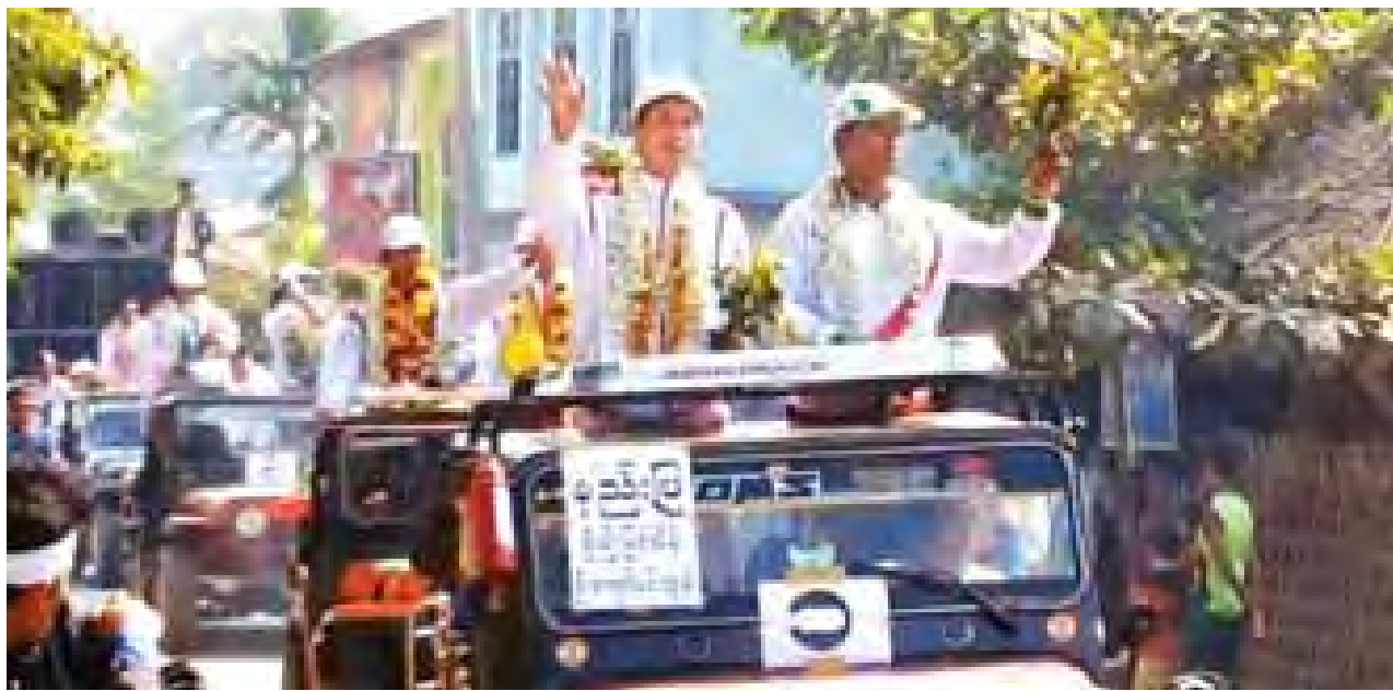
မြန်မာ့ဂုဏ်ဆောင် ဗိုလ်နစ်အားကစားသမားများအား အမရပူရမြို့နယ်လူထု သောင်းသောင်းဖြဖြ ကြိုဆိုနှုတ်ဆက်အားပေးစဉ်။

○ ရှေ့ဖူးမှ မေး။ ။ အမရပူရမြို့နယ်က နိုင်ငံကိုယ်စားပြု ဝင်ရောက်ယှဉ်ပြိုင်ခဲ့တာ အားကစားသမားဘယ်နှဦးပါလဲခင်ဗျာ။ ဖြေ။ ။ ကျွန်တော်တို့ မြို့နယ်က စုစုပေါင်း ခြောက်ဦး ဝင်ရောက်ယှဉ်ပြိုင်ခဲ့တာ ဖြစ်ပါတယ်။ မေး။ ။ ဒီဆီးဂိမ်းပြိုင်ပွဲမှာ ဗိုလ်နစ်အားကစားနည်းနဲ့ရရှိခဲ့တဲ့ ဆုတံဆိပ်အရေ အတွက်ကိုလည်း ပြောပြပေးပါဦးခင်ဗျာ။