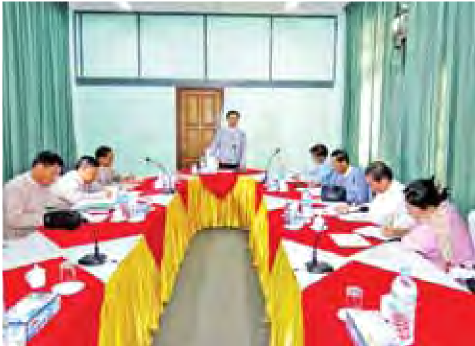
ရေးဘုတ်အဖွဲ့နှင့် ပြည်တွင်းအခွန်များဦးစီးဌာနတို့ ပူးပေါင်း၍ လုပ်ငန်းဆောင်ရွက်မှုများ ပိုမိုထိရောက်အောင်မြင်စေရေးအတွက် လိုအပ်မှုများ ပေါင်းစပ်ညှိနှိုင်း ဆောင်ရွက်ပေးခဲ့ကြောင်း သိရသည်။ (သတင်းစဉ်)

တွင် အခွန်ဘုတ်အဖွဲ့၏ ပံ့ပိုးကူညီမှု အထောက်အကူများ စွာရရှိပါကြောင်း၊ ယခုတွေ့ဆုံဆွေးနွေးပွဲတွင် ပြည်တွင်း အခွန်များဦးစီးဌာနမှ ဆောင်ရွက်ချက်များ ပိုမိုထိရောက်အောင်မြင်စေရေးအတွက် လိုအပ်ချက်များအား အနီးကပ် ကြိုးကြပ်ပေးစေလိုကြောင်းဖြင့် ယနေ့နံနက်ပိုင်းတွင် ရန်ကုန်မြို့ ကျောက်တံတားမြို့နယ်ရှိ ကုမ္ပဏီများဆိုင်ရာ အခွန်ရုံး အစည်းအဝေးခန်းမ၌ ကျင်းပသော အခွန် ကောက်ခံမှုစိစစ်ကြပ်မတ်ရေးဘုတ်အဖွဲ့နှင့် ပြည်တွင်း အခွန်များဦးစီးဌာနမှ တာဝန်ရှိသူများတွေ့ဆုံပွဲတွင် ဘဏ္ဍာရေးဝန်ကြီးဌာန ပြည်ထောင်စုဝန်ကြီး ဦးဝင်းရှိန်တက်ရောက် ဆွေးနွေးမှာကြားသည်။ (ယာပုံ) ဆက်လက်၍ အခွန်ကောက်ခံမှု စိစစ်ကြပ်မတ်ရေး ဘုတ်အဖွဲ့ဥက္ကဋ္ဌ သူရဦးသောင်းလွင်နှင့်အဖွဲ့ဝင်များ ပြည်တွင်း အခွန်များဦးစီးဌာန ညွှန်ကြားရေးမှူးချုပ်နှင့် တာဝန်ရှိသူများက လက်ရှိဆောင်ရွက်လျက်ရှိသည့် အခွန်ကောက်ခံမှု အခြေအနေနှင့် ဆက်လက်ဆောင်ရွက်မည့်လုပ်ငန်း အစီအမံများကို အသေးစိတ်တင်ပြဆွေးနွေးကြရာ ပြည်ထောင်စုဝန်ကြီးက အခွန်ကောက်ခံမှု စိစစ်ကြပ်မတ်