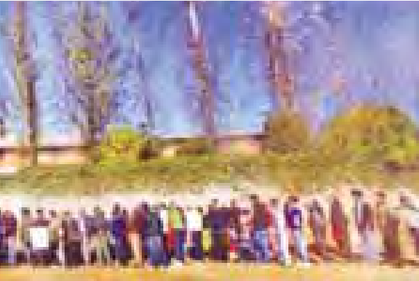
မဲရုံတစ်ရုံရှေ့တွင် မဲပေးရန် စနစ်တကျ တန်းစီစောင့်ဆိုင်းနေကြသော မဲဆန္ဒရှင်များအား တွေ့ရစဉ်။

၂၂-၁၁-၂၀၁၃ ရက်က ရွေးကောက်ပွဲနှင့်ပတ်သက်၍ ကာတာစင်တာ၏ ကနဦးရှုမြင်သုံးသပ်ချက်များကို သမ္မတဂျင်မီကာတာကိုယ်တိုင် သတင်းစာရှင်းလင်းပွဲ၌ ထုတ်ပြန်ခဲ့ပါသည်။ ကာတာစင်တာမှ စေလွှတ်ခဲ့သည့် လေ့လာရေးအဖွဲ့များ၏ တွေ့ရှိချက်များအရ ယခုကျင်းပပြီးစီးခဲ့သည့် နီပေါရွေးကောက်ပွဲသည် ယခင်ရွေးကောက်ပွဲများထက် ပိုမိုလွတ်လပ်၍ တရားမျှတပြီး အားလုံးပါဝင်သော ငြိမ်းချမ်းသည့် ရွေးကောက်ပွဲဖြစ်ကြောင်း၊ ထို့ကြောင့် ၎င်းအနေဖြင့် များစွာဂုဏ်ယူကြောင်း၊ မဲဆန္ဒပေးမှုသည်လည်း ၇၀ ရာခိုင်နှုန်း ကျော်သဖြင့် နီပေါနိုင်ငံ၏ မှတ်တိုင်သစ်တစ်ခုဖြစ်ကြောင်း၊ ဝင်ရောက်ယှဉ်ပြိုင်ခဲ့သည့် နိုင်ငံရေးပါတီများအနေဖြင့် နီပေါမဲဆန္ဒရှင်များ၏ သဘောဆန္ဒကို ထင်ဟပ်သော ယခုရွေးကောက်ပွဲမှ ရလဒ်များကို လေးစားရမည်ဖြစ်ကြောင်း ပြောကြားခဲ့ပါသည်။ နောက်တစ်နေ့တွင် မစ္စတာကာတာက UCPN-Maoist ပါတီမှ