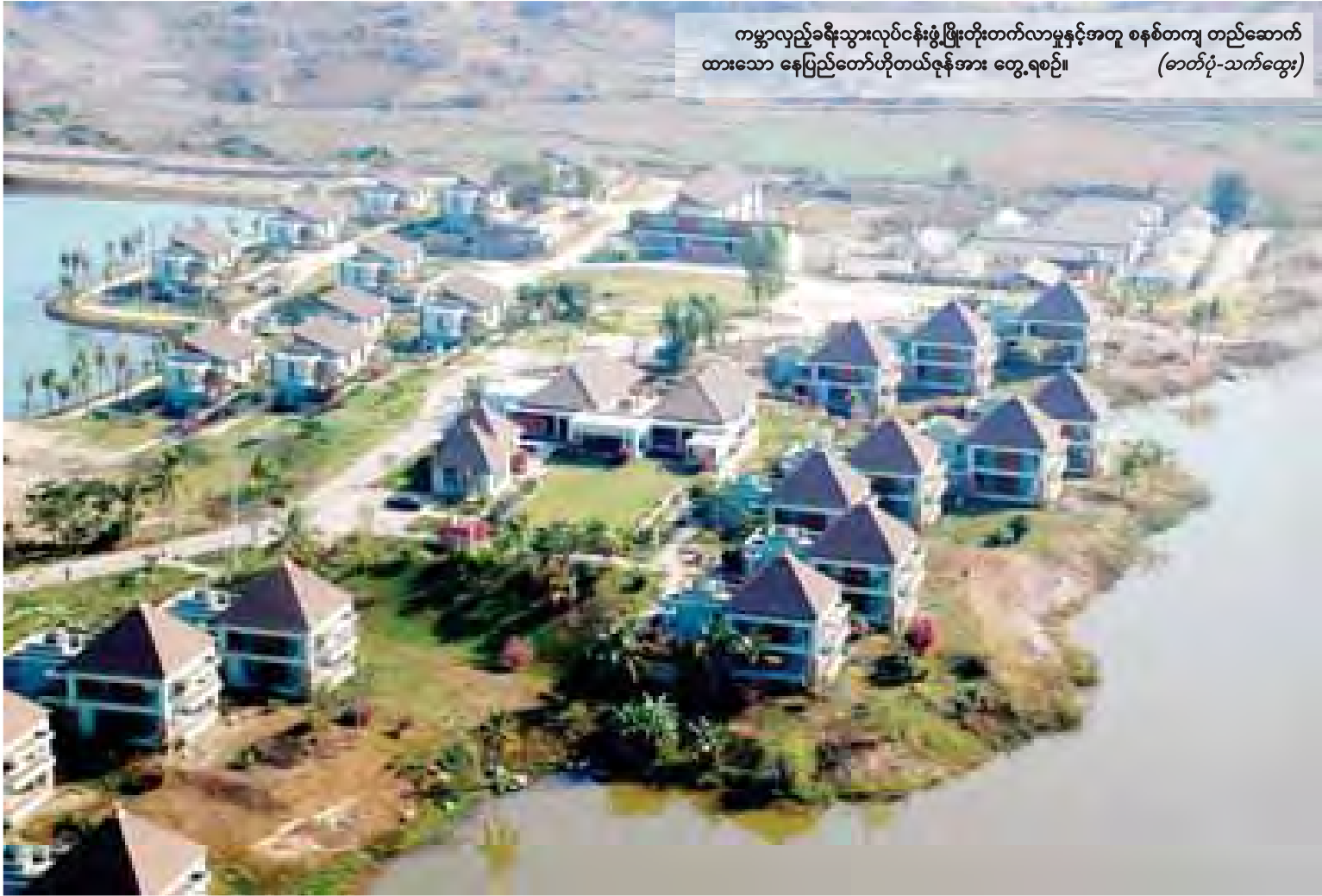
ကမ္ဘာလှည့်ခရီးသွားလုပ်ငန်းဖွံ့ဖြိုးတိုးတက်လာမှုနှင့်အတူ စနစ်တကျ တည်ဆောက်ထားသော နေပြည်တော်ဟိုတယ်ဇုန်အား တွေ့ရစဉ်။

ဟိုတယ်နှင့် ခရီးသွားလာရေးလုပ်ငန်းဝန်ကြီးဌာန ခရီးသွားလုပ်ငန်းဆိုင်ရာ သင်တန်းကျောင်း(ရန်ကုန်)တွင် ဧည့်လမ်းညွှန်အခြေခံ သင်တန်းများကို ၁၉၉၂ ခုနှစ်မှစတင်၍ သင်တန်း