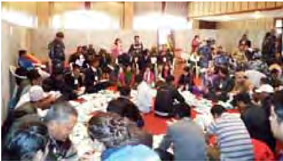
မဲရေတွက်သည့်ဌာနတစ်ခု၌ တာဝန်ရှိသူများ မဲရေတွက်နေပုံကို ကြည့်ရှုနေသည့် ပါတီကိုယ်စားလှယ်များနှင့် လေ့လာနေသည့် အက်ခတ်သူများကို တွေ့ရစဉ်။