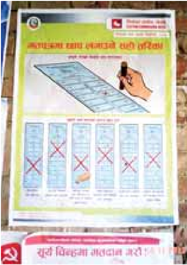
မဲလက်မှတ်တွင် ဆန္ဒပြုနည်းနှင့် ပယ်မဲအဖြစ် သတ်မှတ်မည့် နမူနာပုံစံများ ပြသထားစဉ်။

နီပေါနိုင်ငံမှ မဲပေးသည့်စနစ်မှာ မဲဆန္ဒရှင် စာရင်းကို လက်ဝယ်ကိုင်ထားသည့် မဲရုံအဖွဲ့ဝင်တစ်ဦးက မဲပေးရန် ရောက်ရှိလာသည့် မဲဆန္ဒရှင်၏ မဲဆန္ဒရှင်မှတ်ပုံတင်ကတ်နှင့် မဲဆန္ဒရှင်စာရင်း (မဲဆန္ဒရှင်၏ ဓာတ်ပုံပါပါသည်။) ကို တိုက်ဆိုင်စစ်ဆေးပါသည်။ မှန်ကန်ပါက မဲဆန္ဒရှင်က မဲစာရင်းတွင် လက်မှတ်ရေးထိုး/လက်ဓမ္မခံပြီးနောက် မဲပေးပြီးကြောင်း အထောက်အထားအဖြစ် မဲဆန္ဒရှင်၏လက်မ လက်သည်းခွံအစပ်ကို မင် (Indelible Ink)ဖြင့် သုတ်ပေးပါသည်။ ထို့နောက် မဲရုံမှူး/ ဒု -မဲရုံမှူးထံသို့ သွားရောက်ပြီး