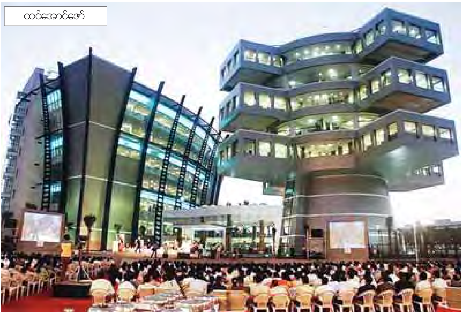
ထင်အောင်ဇော်

စီးပွားရေးလုပ်ငန်းကြီးများသည် တစ်စုံတစ်ခုသော အချက်အချာဒေသ၌