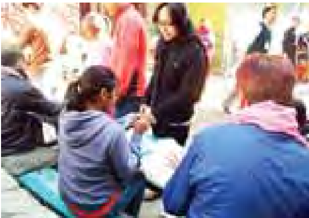
မဲဆန္ဒရှင်တစ်ဦးအား မဲပေးပြီးကြောင်း အထောက်အထားအဖြစ် လက်မလက်သည်းခွံအစပ်ကို မင်သုတ်ပေးနေစဉ်။

ANFREL အဖွဲ့မှ Mr. Damaso Magbual က “အစိုးရနှင့် ရွေးကောက်ပွဲကော်မရှင်အား ရွေးကောက်ပွဲကို အောင်မြင်အောင် ကျင်းပပေးနိုင်သည့်အတွက် ချီးကျူးဂုဏ်ပြုကြောင်း၊ ယခုရွေးကောက်ပွဲသည် လူအများအလွန်ယုံကြည် လက်ခံနိုင်အောင် ကျင်းပခဲ့သော ရွေးကောက်ပွဲဖြစ်ကြောင်း” မှတ်ချက်ပြုခဲ့ပါသည်။ ထို့ပြင် အီးယူနိုင်ငံတကာ ရွေးကောက်ပွဲ လေ့လာရေး