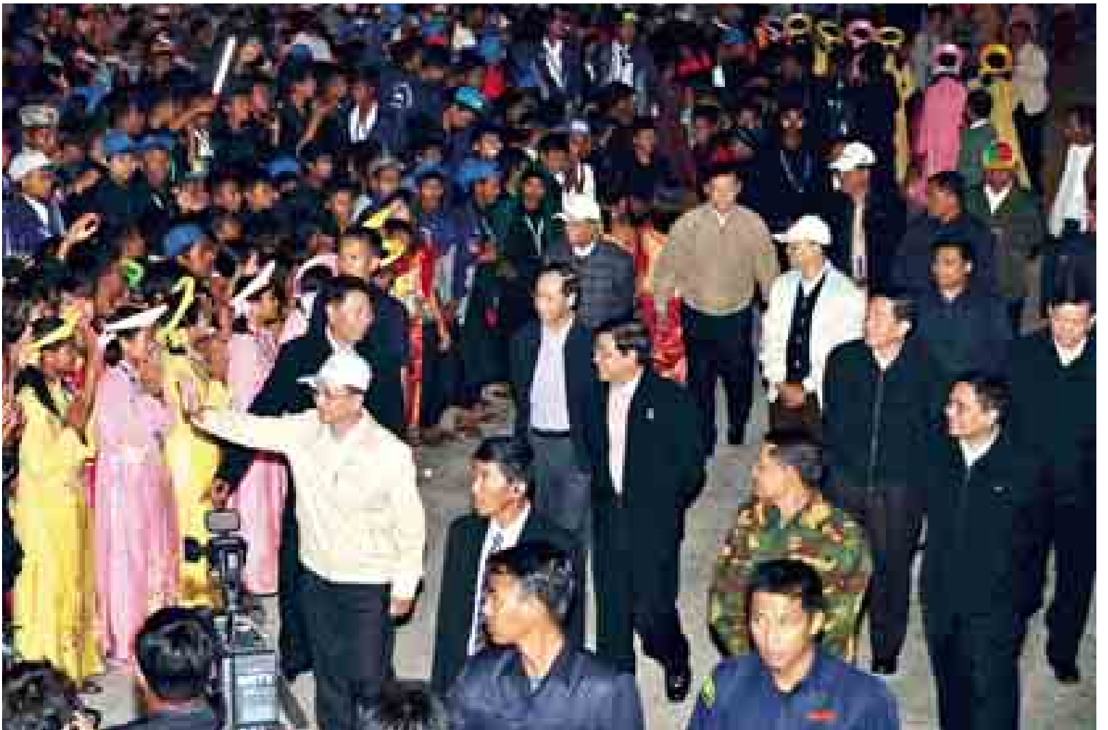
နိုင်ငံတော်သမ္မတ ဦးသိန်းစိန် ဂုဏ်ပြုဥပဇာတီးပွဲအခမ်းအနားသို့ တက်ရောက်လာသော (၂၇)ကြိမ်မြောက် အရှေ့တောင်အာရှအားကစားပြိုင်ပွဲ အောင်မြင်ရေးအတွက် ကူညီထောက်ပံ့ပေးခဲ့သူများအား ရင်းရင်းနှီးနှီးနှုတ်ဆက်စဉ်။ (သတင်းစဉ်)

ထို့နောက် နိုင်ငံတော်သမ္မတ ဦးသိန်းစိန်က (၂၇)ကြိမ်မြောက် အရှေ့တောင်အာရှအားကစားပြိုင်ပွဲ တမုက်မှာ ၈ ကော်လံ ၁ သို့ ☆