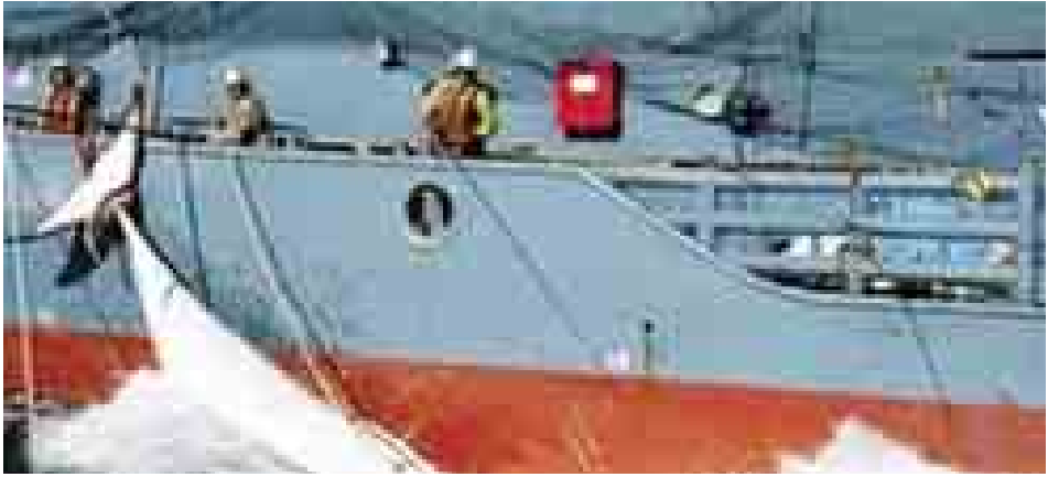
ဂျပန်ငါးဖမ်းရေယာဉ်များသည် သိပ္ပံသုတေသနဆောင်ရွက်ရန်ဟုဆိုကာ တောင်ပစိဖိတ်သမုဒ္ဒရာ၌ နှစ်စဉ် ဝေလငါး ၁၀၀ ကျော် ဖမ်းဆီးလေ့ရှိသည်။

ဂျဏာ ဒီဇင်ဘာ ၂၃ ဆူဒန်နိုင်ငံ ဒုတိယသမ္မတဟောင်း ရိုက်မာချာကို သစ္စာခံသောသူပုန်တပ်ဖွဲ့များက ၎င်းတို့သည် ရေနံထွက်ရှိသော ယူနိုက်တက်ပြည်နယ်ကို သိမ်းပိုက်မိပြီဖြစ်ကြောင်း တနင်္လာနေ့တွင် ပြောကြားသည်။ အစိုးရက ယင်းပြည်နယ်မှ ရေနံအလုပ်သမားများကို ရွှေ့ပြောင်းပေးခဲ့ပြီး ရေနံတွင်းအချို့ကိုလည်း ပိတ်ပစ်ရန် စီစဉ်လျက်ရှိသည်။ ဗိုလ်ချုပ်ကြီးဂျိမ်း(စ်)ကောင်ဒို ဦးစီးသည့် တိုက်ခိုက်ရေးသမားများသည် ပြည်နယ်၏မြို့တော် ဘင်တီအူနှင့် မြောက်ပိုင်းဒေသ၏ အခြားအစိတ်အပိုင်းအချို့ကို ဒီဇင်ဘာ ၂၁ ရက်တွင် သိမ်းယူနိုင်ခဲ့ပြီဖြစ်ကြောင်း၊ ၎င်းတို့သည် မာချာနှင့် မဟာမိတ်များဖြစ်ကြောင်း ပြောကြားခဲ့သည်။ သမ္မတ ဆာလ်ဗာကီယာ၏တပ်များသည် ဂျောင်လိုင်ပြည်နယ်၏ မြို့တော်ဘော်ကို လက်လွှတ်ခဲ့ရပြီးနောက် ယူနိုက်တက်ပြည်နယ်သည် သူပုန်များလက်သို့ ကျရောက်သွားသော ဒုတိယပြည်နယ်ဖြစ်သည်။ ဒီဇင်ဘာ ၁၅ ရက်တွင် မြို့တော်ဂျဏာရှိ သမ္မတနန်းတော်ကို သေနတ်သမားများက တိုက်ခိုက်ရာမှာ စစ်မီးတောက်ခဲ့ခြင်းဖြစ်သည်။ တိုက်ပွဲများအတွင်း အနည်းဆုံးလူ ၅၀၀ သေဆုံးခဲ့ပြီး မာချာ၏ နှုတ်ခွင့်အမည်ဖြင့် ပြင်ဘက်ကီယာ၏ ဒင်ကာလူမျိုးစုတို့အကြား လူမျိုးရေးတင်းမာမှုမှာ ကြီးထွားလာလျက်ရှိသည်။ အေပီ။