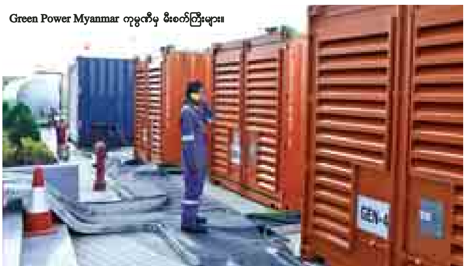
Green Power Myanmar ကုမ္ပဏီမှ မီးစက်ကြီးများ။

သို့သော် ပီအက်စ်ဂျီအသင်းအနေဖြင့် လိုင်လီအသင်း နှင့်သရေပွဲဖြစ်ခဲ့သော်လည်း ပြင်သစ်ပထမတန်းပွဲစဉ် (၁၉) အပြီးတွင် နိုင်ပွဲ ၁၃ ပွဲ၊ သရေပွဲငါးပွဲနှင့် တစ်ပွဲရှုံး ရလဒ်ထွက်ပေါ်ကာ ရမှတ် ၄၄ မှတ်ဖြင့် အမှတ်ပေးဇယား ကို ဆက်လက်ဦးဆောင်နေဆဲပင်ဖြစ်သည်။ (ဌေးကြယ်)