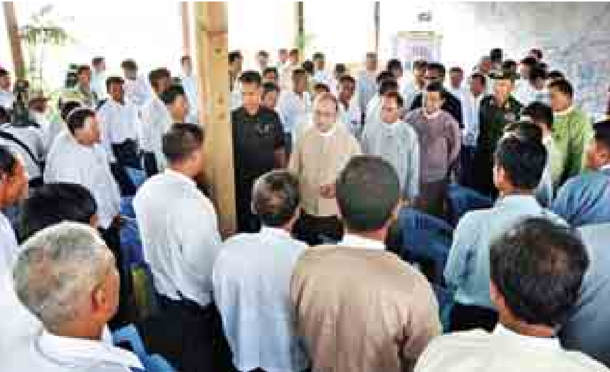
နိုင်ငံတော်သမ္မတ ဦးသိန်းစိန် ဒေသခံတောင်သူများအား ရင်းရင်းနှီးနှီးနှုတ်ဆက်စဉ်၊ (သတင်းစဉ်)

☆ မိမိတို့မှ ဆင်းရဲနွမ်းပါးမှု လျော့ချနိုင်ရေးအတွက် လယ်ယာကဏ္ဍဖွံ့ဖြိုးတိုးတက်ရေးသည် အရေးကြီးသော အခန်းကဏ္ဍမှ ပါဝင်နေမှု၊ တောင်သူလယ်သမားများအနေဖြင့် လယ်ယာကဏ္ဍ ပြုပြင်ပြောင်းလဲရေးလုပ်ငန်းစဉ်များကို ယုံယုံကြည်ကြည်နှင့် ပူးပေါင်းဆောင်ရွက်ပါက လက်ငင်းအကျိုးဖြစ်ထွန်းနိုင်မှုအခြေအနေများကို ရှင်းလင်းပြောကြားသည်။