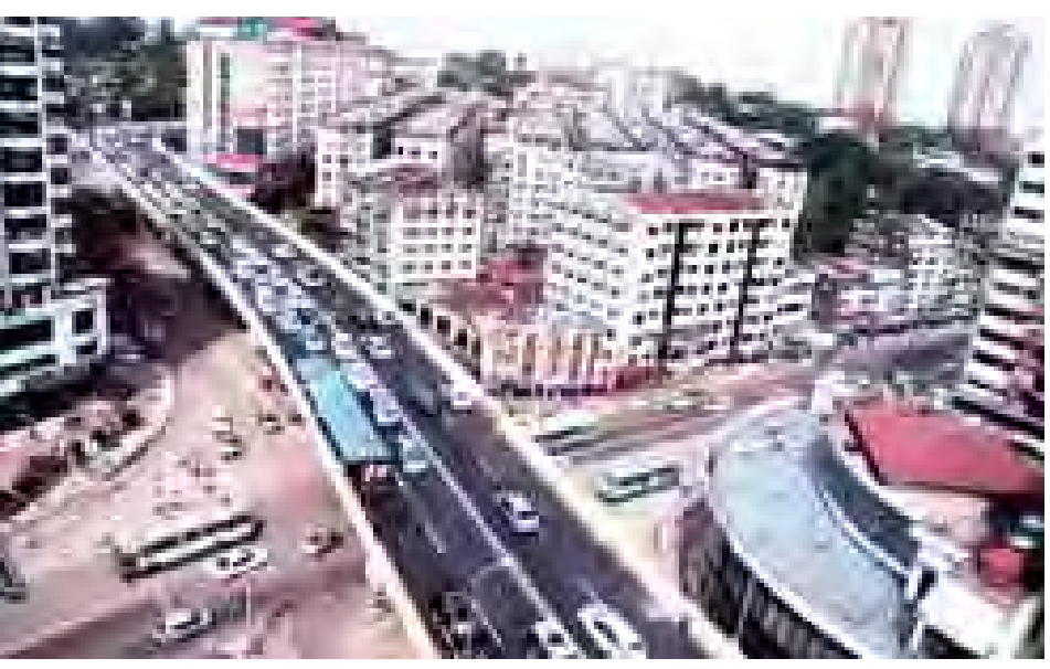
သွားပြီဆိုတော့ အချိန်တွေပိုထွက်လာ တာပေါ့”ဟု ပြောကြားသည်။ ရန်ကုန်တိုင်းဒေသကြီးအတွင်း

ခုံးကျော်တံတား တည်ဆောက် သည့် တာဝန်ခံအင်ဂျင်နီယာက“ တံတားကြီး အခုလိုပြီးစီးတာဟာ လုပ်ကိုင်သူအားလုံး နေ့မအားညမနား တက်ညီလက်ညီ ဆောင်ရွက်ကြလို့ ပါပဲ၊ တံတားကြီး ပြီးသွားပြီဆိုတော့ ယာဉ်ကြောကျပ်တည်းမှု သက်သာ သွားတာဟာ ပြည်သူတွေအတွက် ဝမ်းသာစရာပါပဲ” ဟု ပြောကြား သည်။ ယင်း ခုံးကျော်တံတားပေါ်တွင် ဖြတ်သန်းမောင်းနှင်လာသည့် ခရီးသည် တင်ယာဉ်မောင်းကလည်း “အရင်က ဆိုရင် ရွှေဝိုတိုင်ဘက်ကဖြတ်ရမှာ ကြောက်တယ်။ ယာဉ်ကြောပိတ်ဆိုတာ က မိနစ် ၃၀၊ ၄၅ မိနစ်လောက်ကြာ တဲ့အတွက် ခရီးသည်အတွက်ရော ယာဉ် မောင်းသူတွေအတွက်ပါ အခက် အခဲဖြစ်ရပါတယ်။ တံတားကြီးပြီးစီး